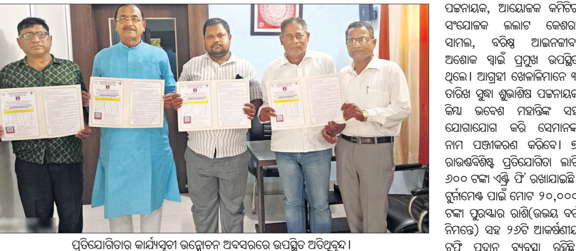
ପ୍ରତିଯୋଗିତାର କାର୍ଯ୍ୟସୂଚୀ ଉନ୍ମୋଚନ ଅବସରରେ ଉପସ୍ଥିତ ଅତିଥିବୃନ୍ଦ ।