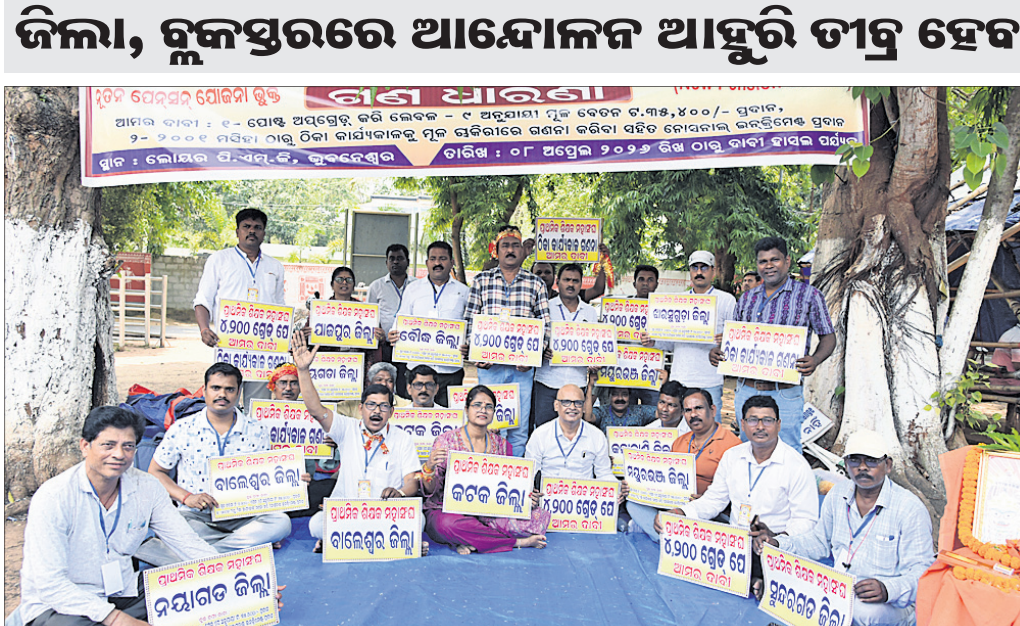
ପ୍ରାଥମିକ ଶିକ୍ଷକ ମହାସଂଘର କର୍ମକର୍ମୀମାନେ ଲୋକସଭା ପିଏସ୍‌ସିରେ ଧାରଣାରେ ବସିଛନ୍ତି।

ଭୁବନେଶ୍ୱର, ୮୪ (ପ୍ରତିଷ୍ଠିତା ସାହୁ) ପୁଣି ଧାରଣାରେ ବସିଲେ ପ୍ରାଥମିକ ଶିକ୍ଷକ। ୨୦୦୧ରୁ ଏପର୍ଯ୍ୟନ୍ତ କାର୍ଯ୍ୟରେ ସମସ୍ତ ଶିକ୍ଷକଙ୍କ କାର୍ଯ୍ୟକାଳକୁ ଠିକା କାର୍ଯ୍ୟକୁ ଉଦ୍ଧେଶ୍ୟ କରି ମୂଳ ଚାକିରିରେ ରଖିବା କରି ୬ଟି ନେତାମାନଙ୍କ ଉନ୍ନତମୁଖ୍ୟ ପ୍ରଦାନ ଆଦି ୨ ଦିନୀ ଦାବି ନେଇ ରୁଧିରା ପ୍ରାଥମିକ ଶିକ୍ଷକ ମହାସଂଘ ଉପରେ କଂଗ୍ରେସ ପ୍ରଦର୍ଶନ କରିଛନ୍ତି। ମହାସଂଘ ଆବାହକ