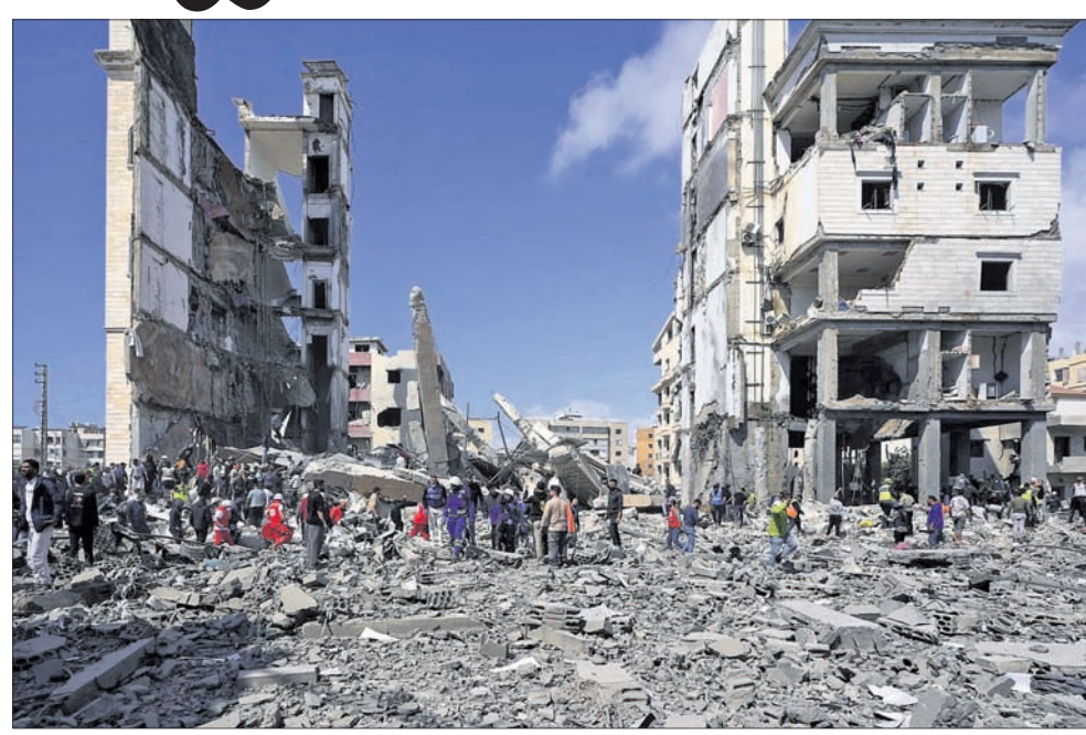
ଇରାନର ସାଇବାରେ ଇସ୍ତ୍ରାଏଲ୍ ପକ୍ଷରୁ ବୁଧବାର ଏହାର ସ୍ତମ୍ଭପତ୍ତ ପରେ ଉଗ୍ରାବଶେଷକୁ ଉଦ୍ଧାର କାର୍ଯ୍ୟ ଜାରି ରହିଛି ।

■ ଯୁଦ୍ଧ, କୁସର୍, ବାହାରିନ୍ରେ ଆକ୍ରମଣ ଜାରି ■ ହେଜ୍ ବୋଲୋଲୋକୁ ଇସ୍ତ୍ରାଏଲ୍ ଟାର୍ଗେଟ୍