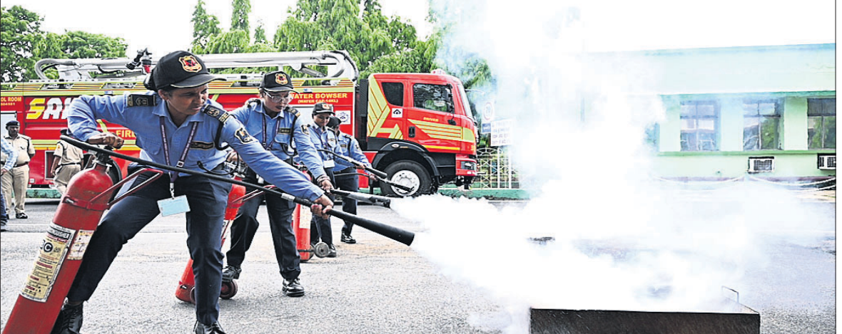
ଅଗ୍ନିଶମ କର୍ମଚାରୀ ତେମନିଷ୍ଟେଶନ କରୁଛନ୍ତି।