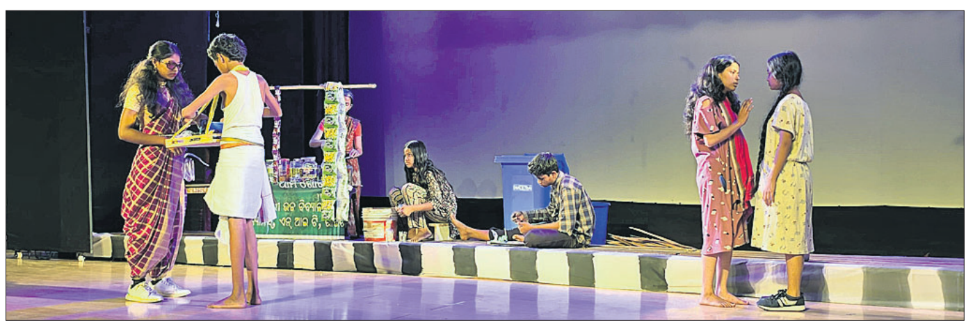
ରାଉରକେଲା ସିଲିକ୍ଟ ସେକ୍ଟର ପ୍ରେକ୍ଷାଳୟରେ ରୁପସା ଆନ୍ଧ୍ର ମହାବିଦ୍ୟାଳୟରୁ ନାଟ୍ୟ ମହୋତ୍ସବରେ ପରିବେଷିତ ନାଟକର ଦୃଶ୍ୟ।