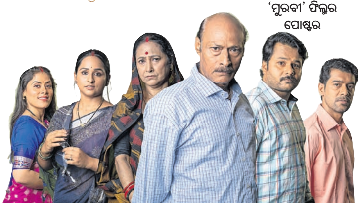
‘ପୁରବା’ ଫିଲ୍ମର ପୋଷ୍ଟର