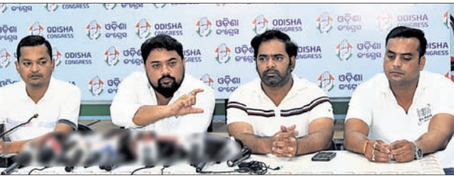
ଖବରଦାତା ସମ୍ମିଳନୀରେ ଯୁବ କଂଗ୍ରେସ କର୍ମକର୍ମୀ।

ଭୁବନେଶ୍ୱର, ୮୪ (ରବିବାରାୟଣ ଜେନା) ଓଡ଼ିଶାରେ ମେଟ୍ରୋ ରେଳ ପ୍ରକଳ୍ପ ରୁଚ୍ଛିନାମା ବାତିଲକୁ ନେଇ ରାଜ୍ୟ ଯୁବ କଂଗ୍ରେସ ସରକାରଙ୍କୁ ଚାର୍ଜେଜ୍ କରିଛି।