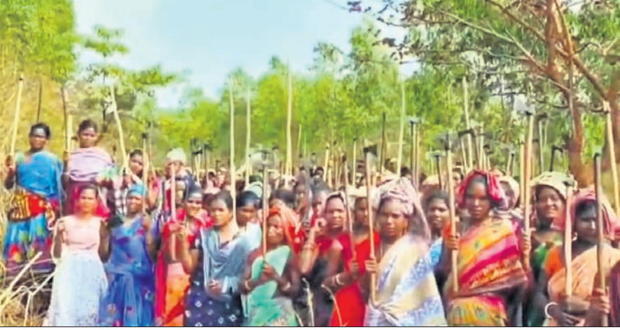
ରାୟଗଡ଼ା ଜିଲ୍ଲା କାଶୀପୁର ବ୍ଲକ୍ ସିଦ୍ଧିପାଳି ପାହାଡ଼ର ସୁରକ୍ଷା ପାଇଁ ରୁଧିବାର ଆଦିବାସୀ ମହିଳାମାନେ ପାରମ୍ପରିକ ଅସ୍ତ୍ରଶସ୍ତ୍ର ସହିତ ଏକାଠି ହୋଇଛନ୍ତି ।

ଦେବାନ୍ତ ପାଇଁ ରାୟଗଡ଼ା ଜିଲ୍ଲା କାଶୀପୁର ଅଞ୍ଚଳ ଅଞ୍ଚଳ ହୋଇପଡ଼ିଛି । ଦେବାନ୍ତ କମ୍ପାନୀ ପକ୍ଷରୁ ନିର୍ମାଣ ହେଉଥିବା ରାସ୍ତା କାମକୁ ଜୋରଜବରଦସ୍ତ କରିବା ପାଇଁ କମ୍ପାନୀ ସ୍ଥାନୀୟ ଜିଲ୍ଲା ପ୍ରଶାସନ ଏବଂ ପୋଲିସକୁ ବ୍ୟବହାର କରୁଛି । ଏହାକୁ ଅଞ୍ଚଳବାସୀ ବିରୋଧ କରିବାରୁ କାଶୀପୁର ବ୍ଲକର ଶାନ୍ତବାବା ଗ୍ରାମରେ ମଙ୍ଗଳବାର ସକାଳେ ପୋଲିସ-ଗ୍ରାମବାସୀ ମୁହାଁମୁହିଁ ହୋଇଥିଲେ । ଏଥିରେ ୫୦ରୁ ଊର୍ଦ୍ଧ୍ୱ ଗ୍ରାମବାସୀ ଆହତ ହୋଇଥିବାବେଳେ ୫୮ ପୋଲିସ କର୍ମୀ ଆହତ ହୋଇଥିବା କୁହାଯାଇଛି । ଦେବାନ୍ତ ପାଇଁ ପୋଲିସର ଲୋକଙ୍କୁ ଦମନଲାଳା ପରେ ଗିରଫ ଭୟରେ ଅଞ୍ଚଳବାସୀ ଏବେ ଜଙ୍ଗଲମୁହାଁ ହୋଇଛନ୍ତି । ୩ ଗାଁ କନ୍ଧମାନ, ବଣେଇ ଓ ସିଦ୍ଧିପାଳି ପାହାଡ଼ର ସାମାଜିକ ଗ୍ରାମ ପ୍ରାୟତଃ ଖାଲି ହୋଇଯାଇଛି । ହେଲେ ସିଦ୍ଧିପାଳି ପାହାଡ଼ର ସୁରକ୍ଷା ପାଇଁ ଆଦିବାସୀ ମହିଳାପୁରୁଷ ପାରମ୍ପରିକ ଅସ୍ତ୍ରଶସ୍ତ୍ର ସହିତ ପ୍ରସ୍ତୁତ ରହିଥିବା କଣ୍ଠାପଡ଼ିଛି । ମରିଚୁ ପଛେ ନିଜର ଭିତାମାତି ତଥା ସେମାନଙ୍କୁ କାନ୍ଦିବା ନିର୍ବାହର ମାଧ୍ୟମ ସାଜିଥିବା ସିଦ୍ଧିପାଳି ପାହାଡ଼ ଦେବାନ୍ତକୁ ଦେଖୁ ନାହିଁ ବୋଲି ଅତି ଦୃଷ୍ଟିଶୀଳ ଗ୍ରାମବାସୀ ।