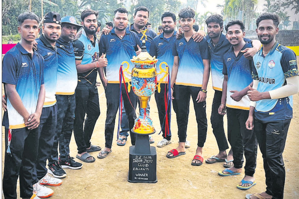
ଟ୍ରଫି ସହ ଚାମ୍ପିୟନ ପଲାଇ ଦଳର ଖେଳାଳିମାନେ ।