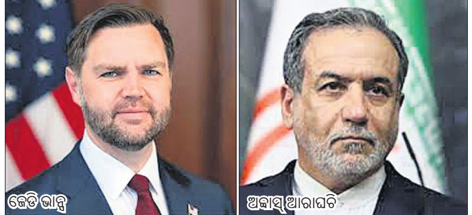
ଜେଡି ଭାନ୍ସ (ବାମ) ଓ ଅୟମ୍ ଆରାୟତି (ଡାହାଣ)

ଆମେରିକା-ଇସ୍ଲାମିକ୍ ଏବଂ ଇରାନ ମଧ୍ୟରେ ୨ ସପ୍ତାହ ପାଇଁ ଘୋଷିତ ଅସ୍ତବିରତି ଉପରେ ପ୍ରତ୍ୟକ୍ଷ ଆଲୋଚନା ଶୁକ୍ରବାର ହେବାକୁ ଯାଉଛି । ପାକିସ୍ତାନ ମଧ୍ୟସ୍ତରରେ ଇସ୍ଲାମାବାଦର ଆଇଡିଏନ୍ ଇ ସଦର (ପ୍ରେସିଡେଣ୍ଟିଆଲ ପ୍ୟାଲେସ୍)ରେ ହେବାକୁ ଥିବା ଏହି ଶାନ୍ତି ଆଲୋଚନା ଉପରେ ବିଶ୍ୱ ସମୁଦାୟର ଦୃଷ୍ଟି କେନ୍ଦ୍ରୀଭୂତ ହୋଇଛି । ଫ୍ରାନ୍ସ ରାଷ୍ଟ୍ରପତି ଜମାଲ୍ ବେକ୍ରେଜ୍ ମାକରନ୍ଙ୍କ ସମେତ ବିଶ୍ୱର କେତେକ ନେତା ପାକିସ୍ତାନ ପ୍ରଧାନମନ୍ତ୍ରୀ ଶେହବାଜ୍ ଶରିଫ୍ଙ୍କୁ ଫୋନ୍ କରି ଆଲୋଚନାକୁ ସଫଳ କରିବା ଉପରେ ଗୁରୁତ୍ୱାରୋପ କରିଛନ୍ତି । ପଶ୍ଚିମ ଏସିଆରେ ଆରକୁ ଯେପରି ଉତ୍ତେଜନା ନ ବଢ଼ିବ ସେଥିପାଇଁ ଆମେରିକା ଓ ଇରାନ ୨ ସପ୍ତାହ ଲାଗି ସମର୍ଥ ସିକ୍ସପାୟାର କରିବାକୁ ବୁଧବାର ସହମତି ପ୍ରକାଶ କରିଥିଲେ । ଶତ୍ରୁତାକୁ ଚିରଶାନ୍ତିରେ ପରିଣତ କରିବା ସକାଶେ ଇସ୍ଲାମାବାଦ ଉଭୟ ପକ୍ଷ ମଧ୍ୟରେ ସାମ୍ବାଦି ଆଲୋଚନାର ଆୟୋଜନ କରୁଛି । ଇସ୍ଲାମାବାଦରେ ରୁକ୍ଷତାର ବୈଠକ ଅନୁଷ୍ଠିତ ହେବ ଏବଂ କେବଳ ତାପର୍ଯ୍ୟପୂର୍ଣ୍ଣ ଆଲୋଚନା ହେବ ବୋଲି ଆମେରିକା ରାଷ୍ଟ୍ରପତି ଡୋନାଲ୍ଡ ଟ୍ରମ୍ପ୍ ଟ୍ୱିଟ୍ଟ୍ ଯୋଗାଣରେ ଘୋଷ୍ଟ କରିଛନ୍ତି । ଏଥିରେ ଯୋଗଦେବା ପାଇଁ