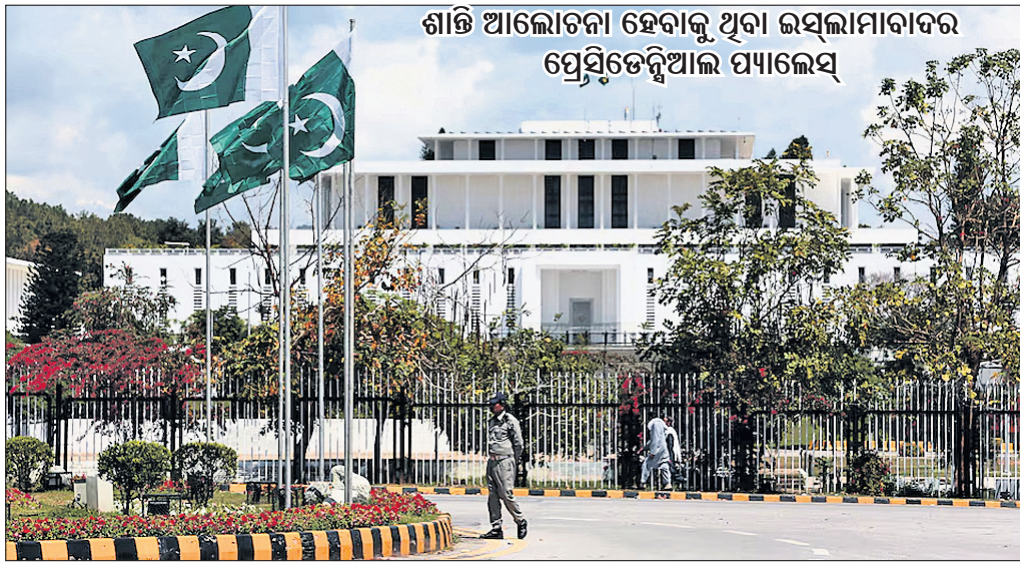
ଶାନ୍ତି ଆଲୋଚନା ହେବାକୁ ଥିବା ଇସ୍ଲାମାବାଦର ପ୍ରେସିଡେଣ୍ଟିଆଲ ପ୍ୟାଲେସ୍

ପାଇଁ ମୋଦିଙ୍କ ସ୍ଥିତିର ମହମ୍ମଦ ବୟେର ଘଲିବାୟତି ଯୋଗ ଦେଉଛନ୍ତି । ପୂର୍ବ ସୁପ୍ରିମ ଲିଭର ଆୟାତୋଲା ଅଲୀ ଖାମେନେଇ ଓ ବର୍ତ୍ତମାନର ସର୍ବୋଚ୍ଚ ନେତା ମୋଦିଙ୍କୁ ଖାମେନେଇଙ୍କ ଘନିଷ୍ଠ ସହଯୋଗୀ ରୂପେ ଜଣାଶୁଣା ଘଲିବାୟତି ପଛଦ୍ୱାର ଦେଇ ଆମେରିକା ଟିମ୍ ସହ କିଛିଦିନ ଧରି ଆଲୋଚନା ଚଳାଇଆସିଛନ୍ତି ବୋଲି ରିପୋର୍ଟ ପ୍ରକାଶ ପାଇଛି । ତେବେ ଏହା ସମ୍ପୂର୍ଣ୍ଣ ଦ୍ୱିପାକ୍ଷିକ ଆଲୋଚନା ଏବଂ ଏଥିରେ ଇସ୍ଲାମିକ୍ କୌଣସି ନେତା ଯୋଗଦେବେ ନାହିଁ ବୋଲି ଜଣାପଡ଼ିଛି ।