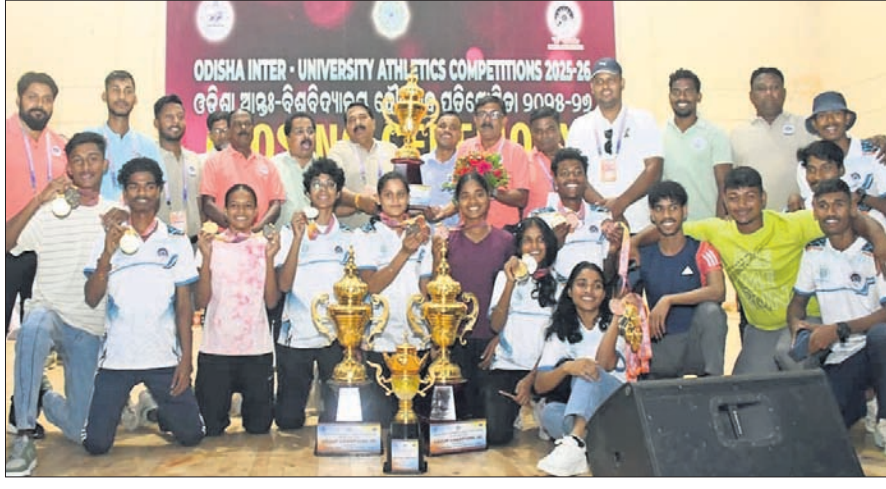
ଅତିଥିକ ସହ ଚାମ୍ପିୟନ ସମ୍ବଲପୁର ବିଶ୍ୱବିଦ୍ୟାଳୟ ଦଳର କୁଡ଼ା ଖେଳାଳିମାନେ ।

ସମ୍ବଲପୁର, ୯୪୪(ପ୍ରମୋଦ ବହିସାର) ସମ୍ବଲପୁର ବିଶ୍ୱବିଦ୍ୟାଳୟର ଆୟୋଜିତ ୪ର୍ଥ ଓଡ଼ିଶା ଆନ୍ତର୍ ବିଶ୍ୱବିଦ୍ୟାଳୟ ଦୌଡ଼କୁ ପ୍ରତିଯୋଗିତା ଗୁରୁବାର ଉଦ୍‌ଘାଟିତ ହୋଇଯାଇଛି । ଚାରିଦିନ ଧରି ଚାଲିଥିବା ଏହି କ୍ରୀଡ଼ା ମହୋତ୍ସବରେ ସମ୍ବଲପୁର ବିଶ୍ୱବିଦ୍ୟାଳୟ (ଏସ୍‌ୟୁ) ଉଭୟ ମହିଳା ଓ ପୁରୁଷ ବର୍ଗରେ ଶ୍ରେଷ୍ଠ ପ୍ରଦର୍ଶନ କରି ଚାମ୍ପିୟନ ଟ୍ରଫି ହାସଲ କରିଛି । ସେହିପରି ଉତ୍କଳ ବିଶ୍ୱବିଦ୍ୟାଳୟ ରନର ଅପ ହୋଇଛି । ପ୍ରତିଯୋଗିତାରେ ଶେଷ ଦିନରେ ପୁରୁଷ ଓ ମହିଳା ବିଭାଗର ୧୦,୦୦୦ ମିଟର ଦୌଡ଼, ୨୦୦ ମିଟର ସ୍ପ୍ରିଣ୍ଟ ଏବଂ ୪x୪୦୦ ମିଟର ରିଲେ ଦୌଡ଼ ଆୟୋଜିତ ହୋଇଥିଲା । ୨୦୨୫-୨୬ ବର୍ଷ ପାଇଁ ଆୟୋଜିତ ଓଡ଼ିଶା ଆନ୍ତର୍ବିଶ୍ୱବିଦ୍ୟାଳୟ ଦୌଡ଼କୁ ପ୍ରତିଯୋଗିତାରେ ସମ୍ବଲପୁର ବିଶ୍ୱବିଦ୍ୟାଳୟ ଚାମ୍ପିୟନ ହେବାର ଗୌରବ ହାସଲ କରିଛି । ସମ୍ବଲପୁର