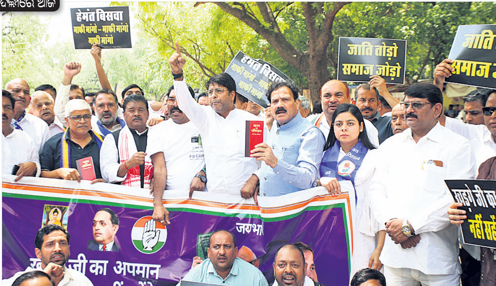
କଂଗ୍ରେସ ଅଧକ୍ଷ ମଲ୍ଲିକାର୍ଜୁନ ଖାର୍ଗେଙ୍କ ପ୍ରତି ଆସାମ ମୁଖ୍ୟମନ୍ତ୍ରୀ ହିମନ୍ତ ବିଶ୍ୱଶର୍ମାଙ୍କ ଅପମାନକରକ ମତବ୍ୟ ଓ ଖରାପ ଭାଷା ପ୍ରୟୋଗକୁ ବିରୋଧ କରି ଏଆଇସିସି (ଅନୁସୂଚିତ ଜାତି ବିଭାଗ) ପକ୍ଷରୁ ଗୁରୁବାର ନୂଆଦିଲ୍ଲୀର ଯତ୍ନରମତରଠାରେ ବିଶୋଇ ପ୍ରଦର୍ଶନ କରାଯାଇଛି ।