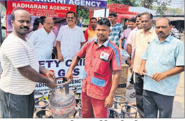
ଲୋକେ ୫ କେଜିଆ ଗ୍ୟାସ୍ ସିଲିଣ୍ଡର କିଣୁଛନ୍ତି।