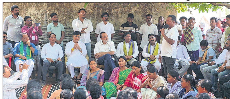
ରାୟଗଡ଼ା ଜିଲ୍ଲା କାଶୀପୁର ବ୍ଲକ୍ କର୍ମାଚାରୀ ଗ୍ରାମରେ ଗୁରୁବାର ବିଜେଡି ଟିମ୍ ଗ୍ରାମବାସୀଙ୍କ ସହ ଆଲୋଚନା କରୁଛନ୍ତି।