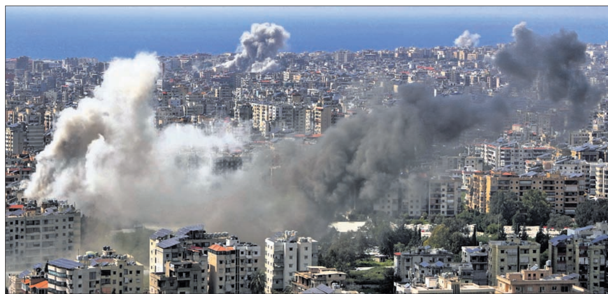
ଲେବାନନ୍‌ର ବିରୁଦ୍ଧରେ ଇସ୍ରାଏଲର ଏକାଧିକ ଏୟାର ଷ୍ଟ୍ରାଇକ୍ ପରେ ଧୂଆଁ ବାହାରୁଛି।

ଇରାନ ବିରୋଧରେ ଆମେରିକା ଓ ଇସ୍ରାଏଲ ଚଳାଇଥିବା ଯୁଦ୍ଧକୁ ୨ ସପ୍ତାହ ପାଇଁ ବନ୍ଦ ରଖିବା ନିମନ୍ତେ ସହମତି ଫଳପ୍ରସ୍ତ ହେବା ଆଶା କରାଯାଇଛି। ଇସ୍ରାଏଲ ଚା'ର ପଡ଼ୋଶୀ ଦେଶ ତଥା ଇରାନର ସହଯୋଗୀ ରାଷ୍ଟ୍ର ଲେବାନନ୍ ଉପରେ ଆକ୍ରମଣ କରି ରଖିଛି। ଏହି ଏୟାର ଷ୍ଟ୍ରାଇକ୍‌ରେ ୨୫୦ରୁ ଊର୍ଦ୍ଧ୍ୱ ଲୋକଙ୍କ ପ୍ରାଣହାନି ଘଟିଲାଣି। ଇସ୍ରାଏଲ ଅସ୍ତ୍ରବିରତିରେ ଲେବାନନ୍‌କୁ ଅନ୍ତର୍ଭୁକ୍ତ କରି ନ ଥିବାରୁ ଏହାର ପ୍ରତିବାଦ ସ୍ୱରୂପ ଇରାନ ଚା'ର ନିୟନ୍ତ୍ରଣରେ ଥିବା ଅନ୍ତର୍ଜାତୀୟ ସାମୁଦ୍ରିକ ଜଳପଥ 'ଷ୍ଟ୍ରେଟ୍ ଅଫ୍ ହର୍ମୁଜ୍' ଖୋଲିବାକୁ ଅମଙ୍ଗ ହୋଇଛି। ଫଳସ୍ୱରୂପ ଗୁରୁତ୍ୱପୂର୍ଣ୍ଣ ଅଣୋଧିକ ଟେଲିକମ୍ୟୁନିକେସନ୍‌ରେ ଲେବାନନ୍ ଲେବାନନ୍ ସହ ବିଶ୍ୱ ବଜାରରେ ଅସ୍ତ୍ରବିରତି ଦେଖିବାକୁ ମିଳିଛି। ଦେଖି କୁହ ଟେଲି ୩.୭% ବୃଦ୍ଧି ପାଇ ବ୍ୟାରେଲ ପିଛା ୧୦୦ ଡଲାର ଅତିକ୍ରମ କରିଛି। ଏସିଆ ଏବଂ ଯୁରୋପର ପ୍ରମୁଖ ଶେୟାର ବଜାରଗୁଡ଼ିକ ନିମ୍ନମାନା ହୋଇଛି। ଏଭଳିସ୍ଥିତିରେ ପାକିସ୍ତାନ ମଧ୍ୟସ୍ତରରେ ଶୁକ୍ରବାର ଇସ୍ରାଏଲବାଦରେ ହେବାକୁ ଥିବା ଶାନ୍ତି ଆଲୋଚନା ଉପରେ ବିଶ୍ୱର ନଜର ରହିଛି।