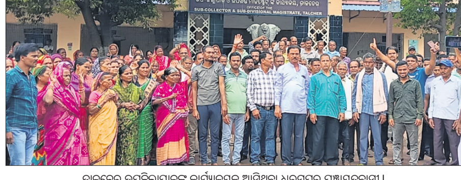
ତାଳଚେର ଉପଜିଲ୍ଲାପାଳଙ୍କ କାର୍ଯ୍ୟାଳୟକୁ ଆସିଥିବା ଧରମପୁର ପଞ୍ଚାୟତବାସୀ।

ତାଳଚେର, ୯।୪ (ମନୋଜ ନନ୍ଦ) ଅନୁଗୋଳ ଜିଲ୍ଲା ତାଳଚେର ବ୍ଲକ୍‌ର ଧରମପୁର ଏବଂ କଳିଙ୍ଗ ପଞ୍ଚାୟତରେ କୋଇଲା ଉତ୍ତୋଳନ ପାଇଁ ଟେଣ୍ଡର ପାଇଥିବା ଘରୋଇ କମ୍ପାନୀ ରୁଙ୍ଗଟା ସମ୍ବନ୍ଧୁ ଗୁରୁବାର ଗୋଟିଏ ବିରୋଧ କରାଯାଇଛି। କୌଣସି ପରିସ୍ଥିତିରେ ଏକ ଘରୋଇ କମ୍ପାନୀକୁ ଜମି ଦିଆଯିବ ନାହିଁ ବୋଲି କଳିଙ୍ଗ ଓ ଧରମପୁର ପଞ୍ଚାୟତର ଲୋକମାନେ ଅଡ଼ି ବସିଛନ୍ତି। ଏପରି କି ବୋରଝେଲ୍ ସଭେ ଓ ଡ୍ରିଲିଂ ନିମନ୍ତେ ଆସିଥିବା ଗଡ଼ିକୁ ଧରମପୁର