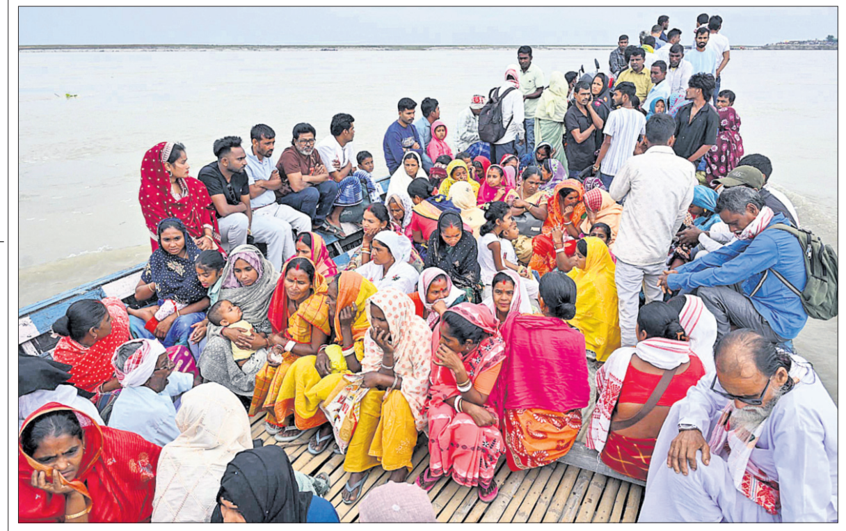
ଦରଙ୍ଗ: ଆସାମ ବିଧାନସଭା ନିର୍ବାଚନରେ ମତଦାନ କରିବା ପାଇଁ ଦରଙ୍ଗଠାରେ ଗୁରୁବାର ଲୋକମାନେ ନୌକା ଯୋଗେ ବ୍ରହ୍ମପୁତ୍ର ନଦୀ ପାର ହେଉଛନ୍ତି।