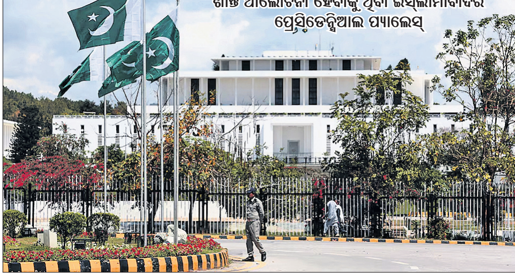
ଶାନ୍ତି ଆଲୋଚନା ହେବାକୁ ଥିବା ଇସ୍ଲାମାବାଦର ପ୍ରେସିଡେଣ୍ଟିଆଲ ପ୍ୟାଲେସ୍