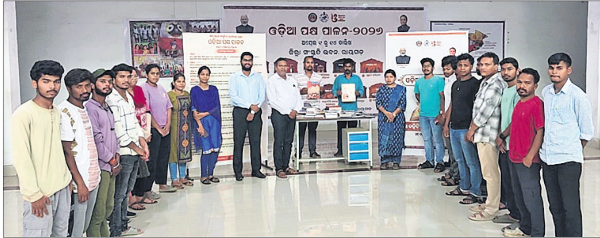
ଅତିଥିକ ସହ ଉପସ୍ଥିତ ଅଧିକାରୀ ଓ କର୍ମଚାରୀମାନେ।

ରାଜଗଡ଼ା, ୯୪ (ଆଶିଷ ରଞ୍ଜନ ପଣ୍ଡା) ଓଡ଼ିଆ ପଞ୍ଚ ପାଳନ ଅବସରରେ ରାଜଗଡ଼ାରେ ଜିଲ୍ଲା ସଂସ୍କୃତି ବିଭାଗ, ଜିଲ୍ଲା ସୂଚନା ଓ ଲୋକ ସମ୍ପର୍କ ବିଭାଗ ସହଯୋଗରେ 'ଆସ ବହିଟିଏ କିଣିବା ଅଭିଯାନ' ଦିବସ ପାଳିତ ହୋଇଛି। ଏହି ଅବସରରେ ଛାତ୍ରାଛାତ୍ରୀ ଓ ଯାଧାରଣ ଜନସାଧାରଣଙ୍କୁ ପୁସ୍ତକ କ୍ରୟ କରି ପଢ଼ିବା ଅଭ୍ୟାସ କରିବାକୁ କୁହାଯାଇଥିଲା। ଜିଲ୍ଲାର ବିଭିନ୍ନ ବିଦ୍ୟାଳୟ, କଲେଜ ଓ ସାର୍ବଜନୀନ ସ୍ଥାନରେ ବହି ପଢ଼ିବା ପ୍ରତି ଆଗ୍ରହ ବୃଦ୍ଧି ପାଇଁ ସଚେତନତା କାର୍ଯ୍ୟକ୍ରମ, ପୁସ୍ତକ ପ୍ରଦର୍ଶନୀ ଓ ପାଠନ ଶିବିର ଆୟୋଜନ କରାଯାଇଥିଲା।