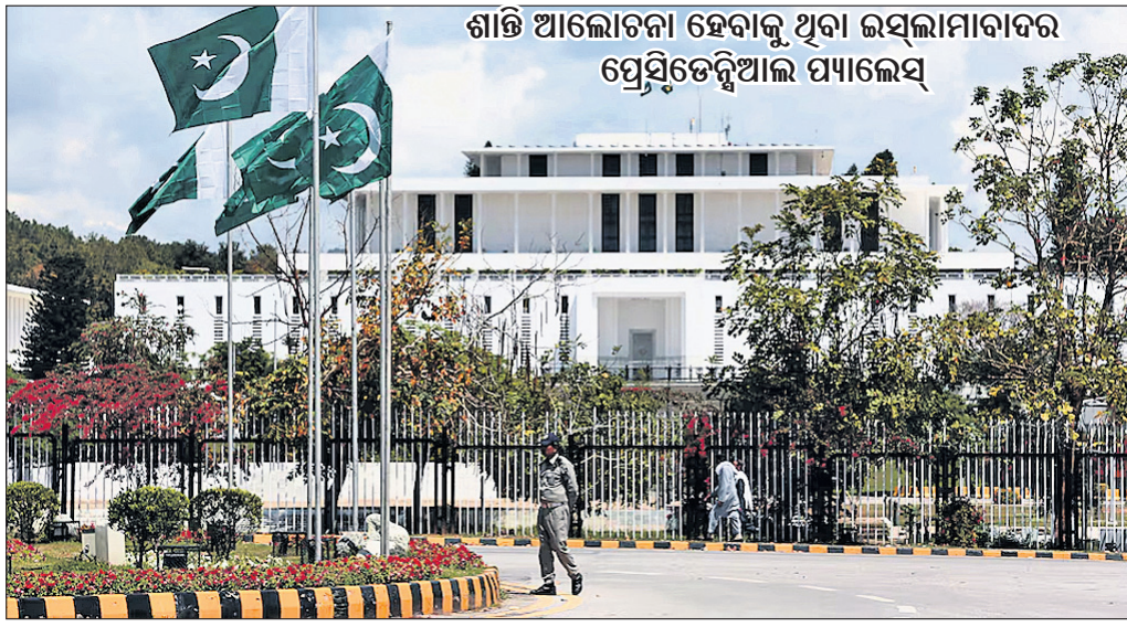
ଶାନ୍ତି ଆଲୋଚନା ହେବାକୁ ଥିବା ଇସ୍ଲାମାବାଦର ପ୍ରେସିଡେନ୍ସିଆଲ୍ ପ୍ୟାଲେସ୍

ପାଇଁ ପାକିସ୍ତାନର ସର୍ବୋଚ୍ଚ ସାମରିକ ଅଧିକାରୀ ଫିଲ୍ଡ ମାର୍ଶାଲ ଆସିଫ୍ ହୁନିର ମାର୍ଚ୍ଚ ଶେଷ ପରଠୁ ଭାରତକୁ ସମେତ ଅନ୍ୟ କୃତନୀତିକ୍ଷକ ସହ ଫୋନ୍ରେ ଆଲୋଚନା କରିଆସିଛନ୍ତି । ସେହିପରି ପାକିସ୍ତାନର ଉପପ୍ରଧାନମନ୍ତ୍ରୀ (ବହିର୍ବ୍ୟାପାର) ଇଶ୍ରାକ୍ ଡାର ମଧ୍ୟ ତତ୍ପରତା ସହ ଉଭୟ ପକ୍ଷ ମଧ୍ୟରେ କୃତନୀତିକ ଉଦ୍ୟମ ଚଳାଇଛନ୍ତି । ସେହିପରି ଟିମ୍ ଇରାନୀୟ ନେତୃତ୍ୱ ନେଉଛନ୍ତି ବହିର୍ବ୍ୟାପାର ମନ୍ତ୍ରୀ ଅକାସ୍ ଆରାୟତି । ଇରାନୀୟ ଶୀର୍ଷ କୃତନୀତିକ୍ଷ ଆରାୟତିକ ସହ ଉକ୍ତ ପ୍ରତିନିଧି ଦଳରେ ଯୋଗଦେବେ ନାହିଁ ବୋଲି ଜଣାପଡ଼ିଛି ।