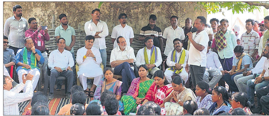
ରାୟଗଡ଼ା ଜିଲ୍ଲା କାଶୀପୁର ବ୍ଲକ୍ କର୍ମାଳୀୟାଳୟ ଗ୍ରାମରେ ଗୁରୁବାର ବିଜେଡି ଟିମ୍ ଗ୍ରାମବାସୀଙ୍କ ସହ ଆଲୋଚନା କରୁଛନ୍ତି ।