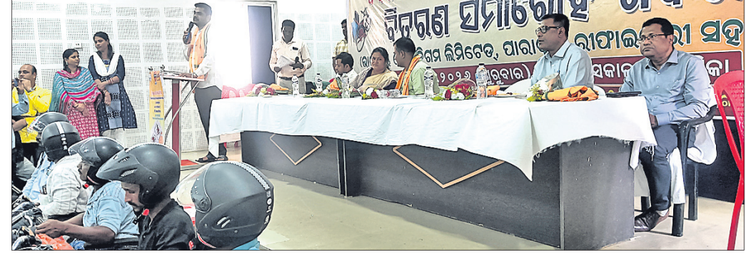
ଦିବ୍ୟାଙ୍ଗଙ୍କୁ ସହାୟକ ଉପକରଣ ବଣ୍ଟନ ଅବସରରେ ମଞ୍ଚାସୀନ ଅତିଥି।