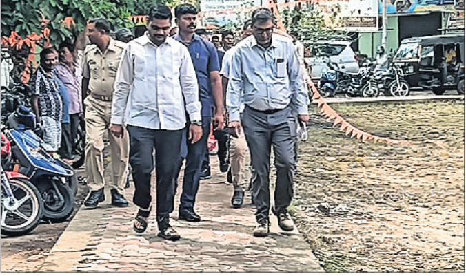
ମନ୍ତ୍ରୀ ସମ୍ପଦ ଚନ୍ଦ୍ର ସ୍ୱାଇଁ ଓ ପାରାଦୀପ ଆଇଓସିଏଲର ନିର୍ବାହୀ ନିର୍ଦ୍ଦେଶକ କୌଶିକ ବସୁ ଚଳାପଥରେ ଉତ୍ସବ ସ୍ଥଳକୁ ଯାଉଛନ୍ତି।