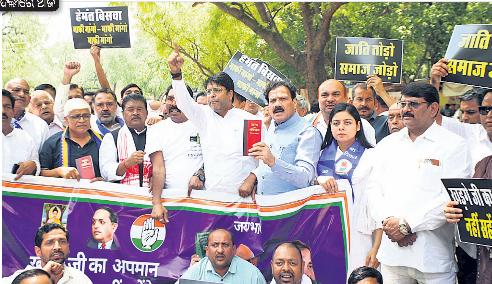
କଂଗ୍ରେସ ଅଧ୍ୟକ୍ଷ ମଲ୍ଲିକାର୍ଜୁନ ଖାର୍ଗେଙ୍କ ପ୍ରତି ଆସାମ ମୁଖ୍ୟମନ୍ତ୍ରୀ ହିମନ୍ତ ବିଶ୍ୱଶର୍ମାଙ୍କ ଅପମାନକରକ ମନ୍ତବ୍ୟ ଓ ଖରାପ ଭାଷା ପ୍ରୟୋଗକୁ ବିରୋଧ କରି ଏଆଇସିସି (ଅନୁସୂଚିତ ଜାତି ବିଭାଗ) ପକ୍ଷରୁ ଗୁରୁବାର ନୂଆଦିଲ୍ଲୀର ଯନ୍ତ୍ରମନ୍ତରଠାରେ ବିଶୋଭ ପ୍ରଦର୍ଶନ କରାଯାଇଛି ।