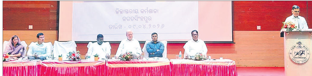
ସଚେତନ କର୍ମଶାଳାରେ ଯୋଗଦେଇଥିବା ଅତିଥି।