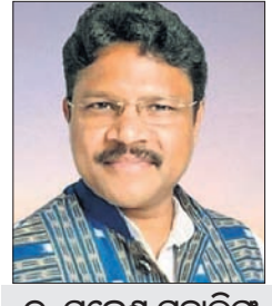
ଡ. ମୁକେଶ ମିଶ୍ର କ୍ୟାବିନେଟ ମନ୍ତ୍ରୀ, ସ୍ୱାସ୍ଥ୍ୟ ଓ ପରିବାର କଲ୍ୟାଣ, ସଂସଦୀୟ ସ୍ୱାସ୍ଥ୍ୟ ଏବଂ ରଲେକୋନିକ୍ସ ଓ ସୂଚନା ପ୍ରଯୁକ୍ତି ବିଭାଗ, ଓଡ଼ିଶା ସରକାର

ଅନ୍ତ୍ୟେୟର ମୂଳ ଅର୍ଥ ହେଉଛି ସମାଜର ସବୁଠାରୁ ଶେଷଧାଡ଼ିରେ ଥିବା ନାଗରିକଙ୍କ ସାମଗ୍ରିକ ବିକାଶ। ଯେତେବେଳେ ସେହି ଶେଷ ମଣିଷଟି ମଧ୍ୟ ସମାନ ସୁଯୋଗ, ସମ୍ମାନ ଓ ସୁବିଧା ପାଏ, ସେତେବେଳେ ହିଁ ସମାଜରେ ସମତା ଓ ସାଫଲ୍ୟ ପ୍ରତିଷ୍ଠା ହୁଏ। ଏହା ସମାନତା, ସାମାଜିକ ନ୍ୟାୟ ଓ ସହଭାଗିତାର ଏକ ଶକ୍ତିଶାଳୀ ସରୋଧି ପ୍ରାୟୋଗିକ ରୂପ। ଚୈତନ୍ୟ ଭାରତୀୟ ବିକାଶଧାରୀଙ୍କୁ ଦର୍ଶାଇଥିବା ପଣ୍ଡିତ ଦୀନକରୀୟ ଉପାଧ୍ୟାୟଙ୍କ ଦ୍ୱାରା ପ୍ରତିପାଦିତ ଏକାମ୍ ନୀତିର ଦର୍ଶନ ହେଉଛି ଆମ ସଂସ୍କୃତି ଓ ଜୀବନମୂଲ୍ୟ ଉପରେ ଆଧାରିତ ବ୍ୟକ୍ତି, ସମାଜ, ପ୍ରକୃତି ଓ ପରମେଶ୍ୱରଙ୍କ ମଧ୍ୟରେ ସମନ୍ୱୟ ସୃଷ୍ଟି କରି ସର୍ବାଙ୍ଗୀନ ବିକାଶର ଲକ୍ଷ୍ୟକୁ ପୂରଣ କରିବା। ଆଧୁନିକ ବିଶ୍ୱରେ ପୁଞ୍ଜିବାଦ ଓ ସାମ୍ୟବାଦ ଭଳି ପାଶ୍ଚାତ୍ୟ ବିଚାରଧାରା ମାନବ ଜୀବନକୁ କେବଳ ଆର୍ଥିକ ମାନଦଣ୍ଡରେ ମାପିଥାଏ। କିନ୍ତୁ ଏକାମ୍ ମାନବ ଦର୍ଶନ ମାନବକୁ କେବଳ ଶରୀର ନୁହେଁ, ବରଂ ମନ, ବୁଦ୍ଧି ଓ ଆତ୍ମାର ସମନ୍ୱିତ ଏକ ସମଗ୍ର ସ୍ୱରୂପ ଭାବେ ଦେଖେ। ଏହି ଦର୍ଶନର ମୂଳଭିତ୍ତି ହେଉଛି ସମନ୍ୱୟବାଦ, ଯାହା ଜୀବନର ସମଗ୍ର ଦିଗକୁ ସମାନ ଗୁରୁତ୍ୱ ଦେଇ ସବୁଜିବିତ ବିକାଶକୁ ପ୍ରୋତ୍ସାହିତ କରେ। ଯେତେବେଳେ ସରକାର ଓ ସମାଜ ମିଶି ସବୁଠାରୁ ଦୁର୍ବଳ ଲୋକଙ୍କୁ ସହାୟତା କରେ, ସେତେବେଳେ ସତ୍ୟ ସମାନତା ଓ ନ୍ୟାୟ ସ୍ଥାପନ ହୁଏ। ଏହା ଦ୍ୱାରା ଗରିବ, ବୟୋକ୍ଷେପ ଓ ଅସହାୟ ବ୍ୟକ୍ତିମାନେ ସୁରକ୍ଷିତ ଓ ସମ୍ମାନପୂର୍ଣ୍ଣ ଜୀବନ ଅତିବାହିତ କରିପାରନ୍ତି। ଏହାକୁ ଆଧାର କାମି ଅଭିଜ୍ଞ ଓ ବୟୋକ୍ଷେପ ବ୍ୟକ୍ତିମାନଙ୍କ ସାମାଜିକ ସୁରକ୍ଷା ପାଇଁ ଭାରତର ଯଶସୀ ପ୍ରଧାନମନ୍ତ୍ରୀ ନରେନ୍ଦ୍ର ମୋଦୀଙ୍କ ମାର୍ଗଦର୍ଶନ ଏବଂ ଓଡ଼ିଶାର ଲୋକପ୍ରିୟ ମୁଖ୍ୟମନ୍ତ୍ରୀ ମୋହନ ଚରଣ ମାଝାଙ୍କ ନେତୃତ୍ୱାଧୀନ ଆମ ସରକାର ବିଭିନ୍ନ ଯୋଜନା ପ୍ରଣୟନ କରିଛନ୍ତି।