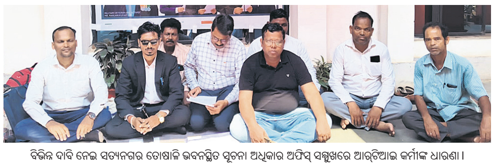
ବିଭିନ୍ନ ଦାବି ନେଇ ସତ୍ୟନଗର ଗୋଷ୍ଠୀକ ଭବନସ୍ଥିତ ସୂଚନା ଅଧିକାର ଅଧିକାରୀଙ୍କୁ ଆର୍ଡିଆଇ କର୍ମୀଙ୍କ ଧାରଣା।

ଭାରତୀୟ ଦୀର୍ଘକାଳୀନ ଆୟୁ ଅଧ୍ୟୟନ ଅନୁସାରେ ୨୦୧୧ ଜନଗଣନାକୁ ଅନୁଧ୍ୟାନ କଲେ ଜଣାଯାଏ, ୬୦ ବର୍ଷରୁ ଉର୍ଦ୍ଧ୍ୱ କେବଳ ୮.୬% ଜନସଂଖ୍ୟା ଅଛି। କିନ୍ତୁ ୨୦୫୦ ପୂର୍ଣ୍ଣ ଏହା ୧୯.୫% ହେବାର ସମ୍ଭାବନା ରହିଛି, ଯାହାକି ପ୍ରାୟ ୩୧.୯ କୋଟି ବରିଷ୍ଠ ନାଗରିକଙ୍କ ପ୍ରତିନିଧିତ୍ୱ କରିବ। ନୂତନତର ବୃଦ୍ଧି ପାଇଥିବା ଏହି ଜନସଂଖ୍ୟାର ସୁସ୍ଥମୟ ଜୀବନର ଆବଶ୍ୟକତାକୁ ପୂରଣ କରିବା ପାଇଁ ଆମ ସରକାର ଆୟୁଷ୍ମାନ ଭାରତ ବୟୋକର୍ମନା ଯୋଜନା ଓ ଗୋପବନ୍ଧୁ ଜନ ଆରୋଗ୍ୟ ଯୋଜନା ଆରମ୍ଭ କରିଛନ୍ତି। ଏହା ବିଶ୍ୱର ସର୍ବବୃହତ୍ ସ୍ୱାସ୍ଥ୍ୟ ବ୍ୟାପୀ କାର୍ଯ୍ୟକ୍ରମ ଆୟୁଷ୍ମାନ ଭାରତ ପ୍ରଧାନମନ୍ତ୍ରୀ ଜନ ଆରୋଗ୍ୟ ଯୋଜନାର ଅନ୍ତର୍ଭୁକ୍ତ। ଏଥିରେ ୫ ଲକ୍ଷ ଟଙ୍କା ପର୍ଯ୍ୟନ୍ତ ନିଃଶୁଳ୍କ ଚିକିତ୍ସା ସୁବିଧା ଯୋଗାଇ ଦିଆଯାଉଛି। ହସ୍ପିଟାଲରେ ଭର୍ତ୍ତିଠାରୁ ଆରମ୍ଭ କରି ଔଷଧ, ରୋଗ ପରୀକ୍ଷା ଓ ସମସ୍ତ ପ୍ରକାର ଚିକିତ୍ସା ଖର୍ଚ୍ଚ ସରକାର ବହନ କରୁଛନ୍ତି। ୬୦ ବର୍ଷରୁ ଅଧିକ ବୟସ୍କ ଯେକୌଣସି ବ୍ୟକ୍ତି ଏହି ଯୋଜନାର ହିତାଧିକାରୀ ଭାବେ ଅନ୍ତର୍ଭୁକ୍ତ। ସରକାରୀ, ବେସରକାରୀ ଚାକିରିରୁ ଅବସରପ୍ରାପ୍ତ ତଥା ସେନସର୍ବଭୋଗୀ ଓ ଆର୍ଥିକ ସ୍ୱଚ୍ଛଳ ବ୍ୟକ୍ତି ମଧ୍ୟ ନିର୍ଦ୍ଧାରିତ ବୟସ ହେଲେ ଏହାର ସୁବିଧା ପାଇଛନ୍ତି। ବର୍ତ୍ତମାନ ପୂର୍ଣ୍ଣ ୭,୦୪,୯୮୮ ଜଣ ହିତାଧିକାରୀ ଏହି ଯୋଜନାର ସୁବିଧା ପାଇଥିବା ବେଳେ ୨୦୨୫-୨୬ ଆର୍ଥିକ ବର୍ଷରେ ୨୬,୫୮୯ ଜଣ ହିତାଧିକାରୀଙ୍କ ଚିକିତ୍ସା ବାବଦରେ ୧୨୩.୭୭ କୋଟି ଟଙ୍କା ଆମ ସରକାର ବହନ କରିଛନ୍ତି। ଏହା ଦ୍ୱାରା ଆର୍ଥିକ ଅନୁଗ୍ରହ ପରିବାରର ମଧ୍ୟ ଆର୍ଥିକ ଭାର ହ୍ରାସ ହେବ। ବୟସ ବୃଦ୍ଧି ସହିତ ଅନେକ ରୋଗର ସମ୍ଭାବନା ବଢ଼ିଥାଏ, ତେଣୁ ସେମାନଙ୍କ ସ୍ୱାସ୍ଥ୍ୟର ସୁରକ୍ଷା ପାଇଁ ଏହି ଯୋଜନା ସଂଜ୍ଞାବନା ଭାବେ କାର୍ଯ୍ୟ କରୁଛି। କୌଣସି ବୟୋକ୍ଷେପ ନାଗରିକ ଯେପରି ଅର୍ଥାଭାବରୁ ଚିକିତ୍ସାକୁ ବଞ୍ଚିତ ହେବ ନାହିଁ, ଏହା ଆମ ସରକାରଙ୍କର ପ୍ରାୟୋଗ।