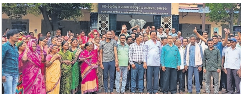
ତାଳଚେର ଉପଜିଲାପାଳଙ୍କ କାର୍ଯ୍ୟକ୍ରମକୁ ଆସିଥିବା ଧରମପୁର ପଞ୍ଚାୟତବାସୀ ।

ବୋଲି ନିଷ୍ପତ୍ତି ହୋଇଥିଲା । ତଥାପି କେତେଜଣ ବ୍ୟକ୍ତି କମ୍ପାନୀ ଅଧିକାରୀଙ୍କ ସହ ହାତ ମିଳାଇ ବର୍ତ୍ତମାନ ଧରମପୁର ଅଞ୍ଚଳରେ ଟ୍ରିଲି କାର୍ଯ୍ୟ କରିବାକୁ ଉଦ୍ୟମ କରୁଛନ୍ତି । ଏ ନେଇ ଧରମପୁର ପଞ୍ଚାୟତବାସୀ ଉପଜିଲାପାଳଙ୍କୁ ଭେଟି ଅଭିଯୋଗ କରିବା ପରେ କମ୍ପାନୀ ଓ ପଞ୍ଚାୟତର କେତେଜଣ ଲୋକଙ୍କୁ ନେଇ ଉପଜିଲାପାଳ ବୈଠକ କରିଥିଲେ । ଧରମପୁର ପଞ୍ଚାୟତର ଅଧିକାରୀ ଉପସ୍ଥିତିରେ ଏହି ବୈଠକ ହେଇ ବୋଲି ପଞ୍ଚାୟତବାସୀ କହିବା ପରେ ଏହି ଗ୍ରାମରୁ ପ୍ରାୟ ୫୦୦ରୁ ଅଧିକ ମହିଳା ପୁରୁଷଙ୍କ ଉପସ୍ଥିତିରେ ବୈଠକ ଅନୁଷ୍ଠିତ ହୋଇଥିଲା । ଏଥିରେ ଉପଜିଲାପାଳ ଅଧ୍ୟକ୍ଷତା କରି ପଞ୍ଚାୟତବାସୀ ରାଜି ନ ହେଲେ ଟ୍ରିଲି ହେବନାହିଁ ବୋଲି ନିଷ୍ପତ୍ତି ହୋଇଥିଲା ।