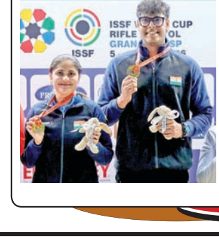
ବିଶ୍ୱ ତୀରଯାତ୍ରା ପାରା ସିରିଜ୍‌ରେ ଓଡ଼ିଶା ପାୟଲ ନାଗ ସାଥୀ ତୀରଯାତ୍ରା ଶୀତଳ ସାଥୁରେ ସେକିକି ଉଭୟ ବାଗ ପାଇଲେ ଗୋଲ୍ଡ୍‌ମେଡାଲ ଆଗ ଲକ୍ଷ୍ମଣାଧି ଥିଲେ ସବୁ ପସିବୁଲ୍ ଜାଗ ଯୁବ ଶକ୍ତି ଜାଗ... ୩

ଇଣ୍ଡୋନେସିଆର ଚେସ୍ ଫେଡ଼େରେଶନ ଚାଲିକାରେ ପ୍ରକାଶିତ ଭାରତୀୟ ବଂଶୋତ୍ତର ଲଂଲଣ୍ଡର ବୋଧିଆ ଶାନ୍ତିସେ ସତ ବିଶ୍ୱ ସାରା ଯାଆ ମିତ ଭାରତ ମାଟିର ମହକ ସବୁଠି ଏକ୍‌କାଣ୍ଟୁଲ ଅଛି ଶତ... ୨