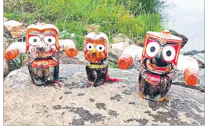
ବାରଙ୍ଗ, ୯।୪ (ଲିଙ୍ଗରାଜ ରାଉତ)

ମହାନଦୀରୁ ମୁଖିକ ବ୍ରଜ ପାଖ ତଳମୁଣ୍ଡରୁ ଭାସିଯାଇଥିବା ମହାପ୍ରଭୁଙ୍କ ମୂର୍ତ୍ତି ଉଦ୍ଧାର କରାଯାଇଛି। ମହାନଦୀରୁ ମହାପ୍ରଭୁଙ୍କ ମୂର୍ତ୍ତି ଉଦ୍ଧାର କରାଯାଇଛି। ମହାନଦୀରୁ ମହାପ୍ରଭୁଙ୍କ ମୂର୍ତ୍ତି ଉଦ୍ଧାର କରାଯାଇଛି। ମହାନଦୀରୁ ମହାପ୍ରଭୁଙ୍କ ମୂର୍ତ୍ତି ଉଦ୍ଧାର କରାଯାଇଛି।