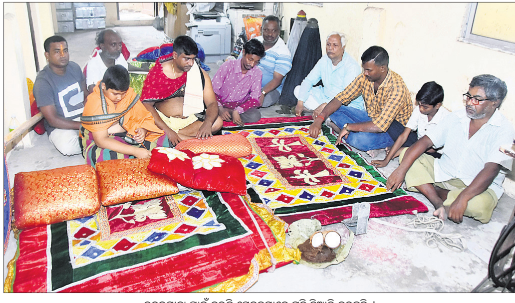
ଚନ୍ଦନଯାତ୍ରା ପାଇଁ ବରଳି ସେବକମାନେ ଗତି ତିଆରି କରୁଛନ୍ତି ।