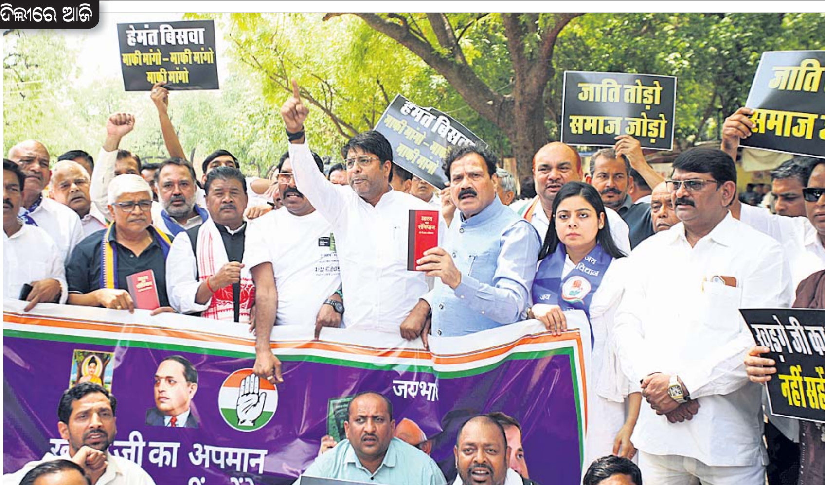
କଂଗ୍ରେସ ଅଧ୍ୟକ୍ଷ ମଲ୍ଲିକାର୍ଜୁନ ଖାର୍ଜେଙ୍କ ପ୍ରତି ଆସାମ ମୁଖ୍ୟମନ୍ତ୍ରୀ ହିମତ ବିଶ୍ୱଶର୍ମାଙ୍କ ଅପମାନକରକ ମତବ୍ୟ ଓ ଖରାପ ଭାଷା ପ୍ରୟୋଗକୁ ବିରୋଧ କରି ଏଆଇସିସି (ଅନୁସୂଚିତ ଜାତି ବିଭାଗ) ପକ୍ଷରୁ ଗୁରୁବାର ନୂଆଦିଲ୍ଲୀର ଯନ୍ତ୍ରମନ୍ତ୍ରଣାଳୟରେ ବିରୋଧ ପ୍ରଦର୍ଶନ କରାଯାଇଛି।