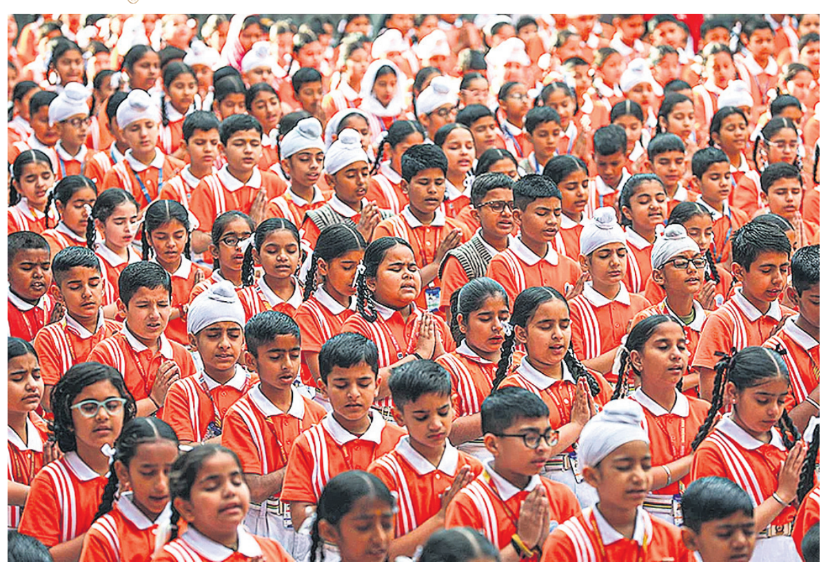
ସ୍କୁଲ ବନ୍ଦ ଓ ବିଶ୍ୱରେ ଶାନ୍ତି ପ୍ରତିଷ୍ଠାର ବାର୍ତ୍ତା ନେଇ ଜଣ୍ଡେର ସ୍କୁଲ ପିଲାମାନେ ଗୁରୁବାର ସଞ୍ଜ ପ୍ରାର୍ଥନା କରୁଛନ୍ତି ।