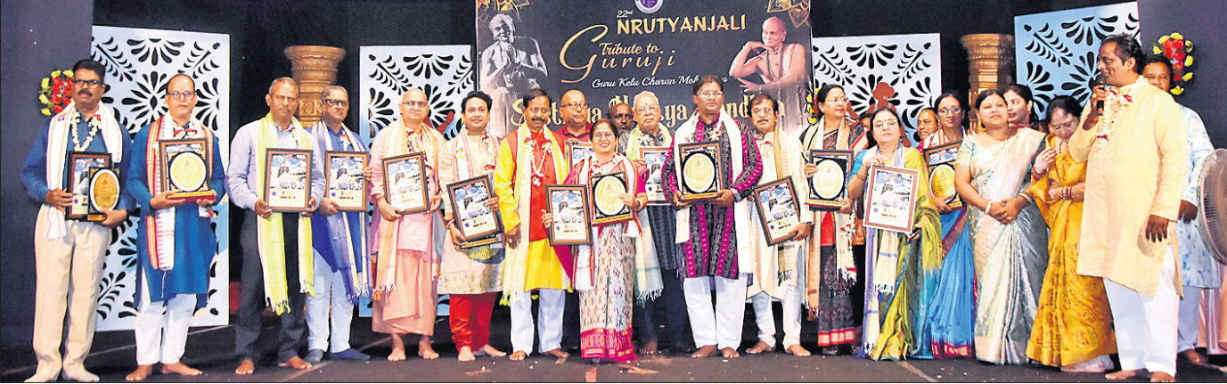
ଅନୁପୂର୍ଣ୍ଣ ରଞ୍ଜନାଥରେ ପୁରୀ ତ୍ୟାଗ୍ ଏକାଡେମୀ ପକ୍ଷରୁ ଆୟୋଜିତ ନୃତ୍ୟାଞ୍ଜଳି କାର୍ଯ୍ୟକ୍ରମରେ ଅତିଥିକ ସହ ସମ୍ବନ୍ଧିତ କଳାକାରମାନେ ।

ଆତ୍ମସମ୍ମାନ ସହ ଜୀବନଯାତ୍ରାରେ ସହାୟତା କରିବା ପାଇଁ ୮୦ ବର୍ଷ ବୟସରୁ ଉର୍ଦ୍ଧ୍ୱ ଭକ୍ତଙ୍କୁ ୧୨୦୦ରୁ ବୃଦ୍ଧି କରି ଆମ ସରକାର ୩,୫୦୦ ଟଙ୍କା କରିଛନ୍ତି। ଏହା ବୟୋକ୍ଷେମମାନଙ୍କୁ ଆର୍ଥିକ ଭାବେ ସ୍ୱାଧୀନତା ପ୍ରଦାନ କରିବା ସହ ବିଶେଷକରି ଗ୍ରାମାଞ୍ଚଳରେ ଗରିବ ଓ ନିରାଶ୍ରୟ ବୃଦ୍ଧମାନଙ୍କ ପାଇଁ ଆଶୀର୍ବାଦ ସଦୃଶ। ରାଜ୍ୟର ୩,୭୩,୫୨୧ ଜଣ ବୟୋକ୍ଷେମ ସହି ଯୋଜନାର ଲାଭ ପାଇଥିବା ବେଳେ ଏହାର ଏକ ବିଶେଷତା ହେଉଛି ରାଷ୍ଟ୍ରୀୟ ସାମାଜିକ ସୁରକ୍ଷା ଯୋଜନା ଅଧୀନରେ ଥିବା ହିତାଧିକାରୀ ହୁଅନ୍ତୁ କିମ୍ବା ମଧୁରାସୁ ପେନସନ ଯୋଜନାର ଲାଭାର୍ଥୀ, ସମସ୍ତେ ଏହି ବର୍ଦ୍ଧିତ ଭତ୍ତା ଅଧିକାରୀ। ସେହିପରି ୮୦ ବର୍ଷରୁ ଥିବା ବ୍ୟକ୍ତିବିଶେଷଙ୍କୁ ମଧ୍ୟ ୩,୫୦୦ ଟଙ୍କା ଭତ୍ତା ଦେବାକୁ ଆମ ସରକାର ବ୍ୟବସ୍ଥା କରିଛନ୍ତି। ତିନିଆ ଖର୍ଚ୍ଚଠାରୁ ସେମାନଙ୍କ ଦୈନିକ ଆବଶ୍ୟକତା ପୂରଣରେ ଏହା ଉପକାରୀ ହେବ। ସମାଜ ଓ ପରିବାରରେ ଦିବ୍ୟାଙ୍ଗମାନଙ୍କୁ ସ୍ୱାଭିମାନର ସହିତ ବଞ୍ଚିବା ଏବଂ ଆତ୍ମନିର୍ଭରତା ଦିଗରେ ଗୁରୁତ୍ୱପୂର୍ଣ୍ଣ ଭୂମିକା ନିର୍ବାହ କରିବା ଏପର୍ଯ୍ୟନ୍ତ ୧,୦୬,୨୪୬ ଜଣ ଦିବ୍ୟାଙ୍ଗ ସହି ଯୋଜନାରେ ଉପକୃତ ହେଉଛନ୍ତି। ଆମର ଏହି ପଦକ୍ଷେପ କେବଳ ଏକ ଆର୍ଥିକ ସହାୟତା ନୁହେଁ, ବରଂ ଏହା ମାନବତା, ସାମାଜିକ ନ୍ୟାୟ ଓ ସମାଜତାର ଏକ ଉଜ୍ଜ୍ୱଳ ଉଦାହରଣ। 'ଅଖଣ୍ଡମଣ୍ଡଳାକାର' ବ୍ୟାପ୍ଟ୍ ମେନ ଚରାଚରମ୍' ଏକାମ୍ ଫାଉଣ୍ଡେସନର ଦର୍ଶନ ହେଉଛି ଗୋଟିଏ ସ୍ଥାନରୁ ଆରମ୍ଭ କରି ସମାନ ଗୋଲାକାର ଆକୃତିରେ ସମାଜରେ ରହିଥିବା ସମସ୍ତଙ୍କର ସମପରିମାଣରେ ବିକାଶ କରିବା। ଏହାକୁ ଆଧାର କରି ଆମ ସରକାର ସାମାଜିକ ସୁରକ୍ଷା ନିମନ୍ତେ ବୃଦ୍ଧବର୍ଗୀ ଉଦ୍ୟମ କରୁଛନ୍ତି। ଜ୍ଞାନର ଉତ୍ସାହରେ ପରିପୂର୍ଣ୍ଣ ଥିବା ବୟୋକ୍ଷେମମାନଙ୍କ ଅନୁଭବର ବ୍ୟବହାର କରି ବିକଶିତ ଭାରତ ୨୦୫୭ ଓ ବିକଶିତ ଓଡ଼ିଶା ୨୦୩୬ର ପରିକଳ୍ପନା ପୂରଣ ହୋଇ ପାରିବ। ସେଥିପାଇଁ ରାଜ୍ୟର ସମସ୍ତ ବୟୋକ୍ଷେମ ନାଗରିକ ସକ୍ରିୟ ଓ ଆରୋଗ୍ୟର ଦୀର୍ଘ ଜୀବନର ଉପକାରୀ ହେଉ।