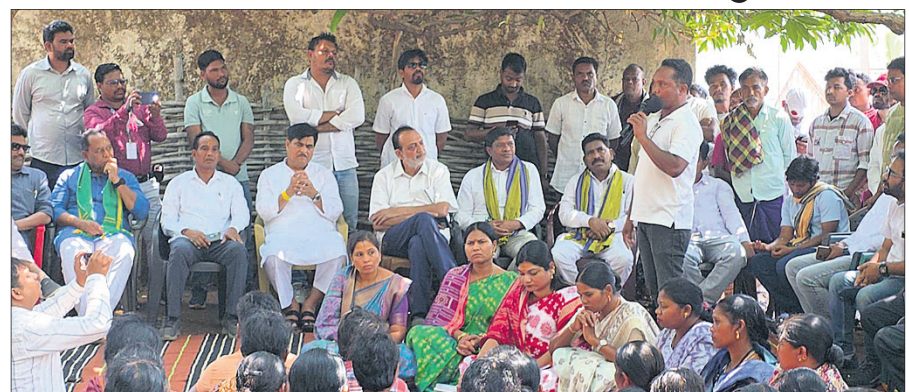
ରାୟଗଡ଼ା ଜିଲା କାଶୀପୁର ବ୍ଲକ୍ କର୍ମାଳୀୟାଳୟ ଗ୍ରାମରେ ଗୁରୁବାର ବିଜେଡି ଟିମ୍ ଗ୍ରାମବାସୀଙ୍କ ସହ ଆଲୋଚନା କରୁଛନ୍ତି ।