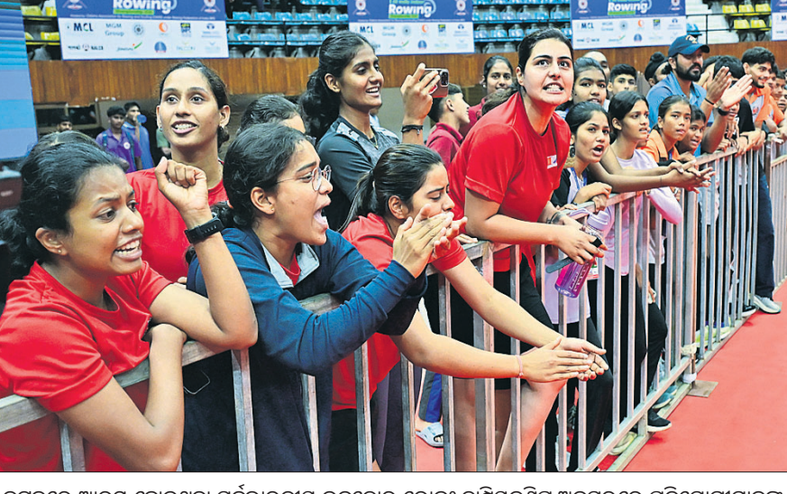
କଟକରେ ଆରମ୍ଭ ହୋଇଥିବା ସର୍ବଭାରତୀୟ ଇନ୍‌ଡୋର ରୋଲ୍ ଚାମ୍ପିୟନଶିପ୍ ଅବସରରେ ପ୍ରତିଯୋଗୀମାନଙ୍କୁ ସହଯୋଗୀମାନେ ଉତ୍ସାହିତ କରୁଛନ୍ତି ।

ଛକା ସହାୟତାରେ ୬୩ ରନ କରି ଆଉଟ ହୋଇଥିଲେ । ଶେଷ ଭାଗରେ ଭେକଟେଶ୍ ୧୫ ବଲ୍‌ରୁ ୧ ଟୋକା ଓ ୨ ଛକା ସହାୟତାରେ ୨୯ ରନ କରି ଅପରାଧିତ ରହିବାକୁ ଆରସିବି ଷ୍ଟୋର ୨୦୦ ଅତିକ୍ରମ କରିଥିଲା । ରାଜସ୍ଥାନ ପକ୍ଷରୁ କୋହା ଆର୍ଡର, ରବି ବିଷ୍ଣୋଇ ଓ ବ୍ରିଜେଶ୍ ଶର୍ମା ୨ଟି ଲେଖାଏ ଏବଂ ସହିତ ଶର୍ମା ଓ ରବାନ୍ଦ୍ର ଜାତେଶ୍ ଗୋଟିଏ ଲେଖାଏ ଉଲ୍ଲେଖ ନେଇଥିଲେ । ବର୍ଷାଯୋଗୁ ରୟାଲ୍ ଚ୍ୟାଲେଞ୍ଜର୍ସ ବେଙ୍ଗାଲୁରୁ ୨୦ ଓଭରରେ ୨୦୧/୮ (ରଜତ ପଟ୍ଟିବାର-୬୩, ବିରାଟ କୋହଲି-୩୨, ଭେକଟେଶ୍ ଆୟର-୨୯, ରୋମାରିଓ ଶେଫର୍ଡ-୨୨, ଜୋହା ଆର୍ଡର-୨/୩୩, ରବି ବିଷ୍ଣୋଇ-୨/୩୨, ବ୍ରିଜେଶ୍ ଶର୍ମା-୨/୩୭, ସହିତ ଶର୍ମା-୧/୪୭) ରବାନ୍ଦ୍ର ଜାତେଶ୍-୧/୧୪) ୮ଟା ୪୦ରେ ମ୍ୟାଚ ଆରମ୍ଭ କରିବାକୁ ଅମ୍ଭୀକାର ନିଷ୍ଠି ନେଇଥିଲେ । ଅର୍ଥାତ୍ ବର୍ଷାଯୋଗୁ ୫୦ ମିନିଟ୍ ବିଳମ୍ବରେ ଖେଳ ଆରମ୍ଭ ହୋଇଥିଲା । ତେବେ ଓଭର ସଂଖ୍ୟା ଅପରିବର୍ତ୍ତିତ ରହିଥିଲା ।