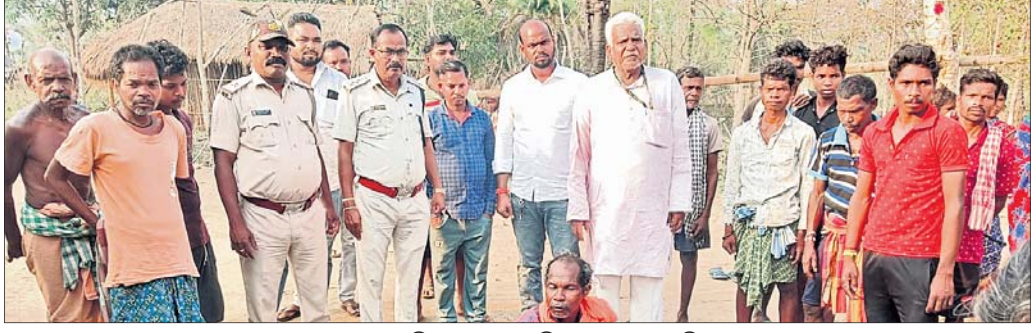
ମୃତକଙ୍କ ପରିବାରକୁ ଭେଟୁଛନ୍ତି ଦେଶାତ୍ମକ ଏମ୍ପି ।