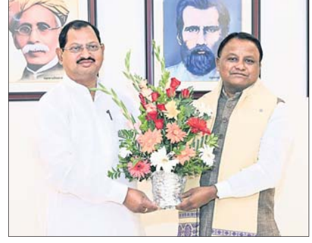
ପୁଖ୍ୟମନ୍ତ୍ରୀ ମୋହନ ଚରଣ ମାଝୀଙ୍କୁ ଭେଟି ଧନ୍ୟବାଦ ଅର୍ପଣ କରୁଥିବା ଅନୁଗୋଳ ଜିଲା ଯୋଜନା କମିଟି ଅଧ୍ୟକ୍ଷ ।

କମିଟି ଅଧ୍ୟକ୍ଷ ଭାବେ ତାଙ୍କୁ ଦାୟିତ୍ୱ ଦେଇଥିବା ବିଧାନ ସଭା ସମାଜ ସମ୍ପର୍କ ମନ୍ତ୍ରୀଙ୍କୁ ଏ ନେଇ ଧନ୍ୟବାଦ ଜଣାଇଥିଲେ । ପୁଖ୍ୟମନ୍ତ୍ରୀ ତାଙ୍କ ଉପରେ ଭରସା ଓ ବିଶ୍ୱାସ କରି ଯେଉଁ ଚୁକ୍ତି ଦାୟିତ୍ୱ ଦେଇଛନ୍ତି, ତାହାକୁ ସେ ନିଷ୍ଠାରେ ସହ ପାଳନ କରିବା ସହ ପାଳନହତ୍ୟା ତଥା ଅନୁଗୋଳ ଜିଲାର ବିକାଶ କାର୍ଯ୍ୟ ପାଇଁ ପ୍ରତିବନ୍ଧ ବୋଲି କହିଛନ୍ତି । ଏହି ଅବସରରେ ଅନୁଗୋଳ ଜିଲା