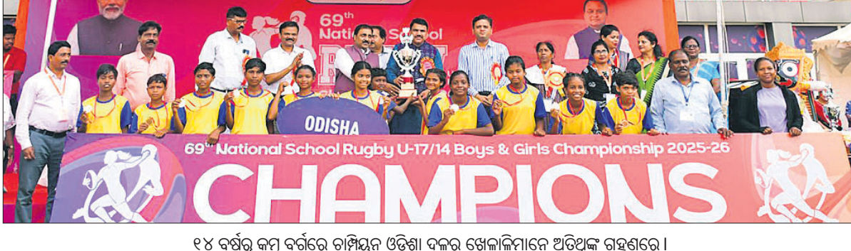
୧୪ ବର୍ଷରୁ କମ୍ ବର୍ଗରେ ଚାମ୍ପିୟନ ଓଡ଼ିଶା ଦଳର ଖେଳାଳିମାନେ ଅତିଥିଙ୍କୁ ଗହଣରେ ।