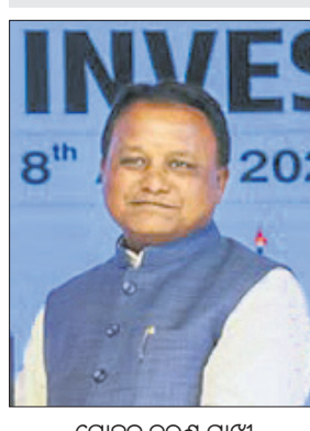
ମୋହନ ଚରଣ ମାଝୀ

ଚଣ୍ଡିଖୋଲରେ ଇଣ୍ଡିଆନ୍ ଷ୍ଟାଟେଜିକ୍ ପେଟ୍ରୋଲିୟମ୍ ରିଜର୍ଭ୍ ଲିମିଟେଡ୍ (ଆଇଏସ୍‌ପିଆର୍‌ଏଲ୍) ପ୍ରକଳ୍ପର ଜମି ହସ୍ତାନ୍ତର ପ୍ରକ୍ରିୟା ଶେଷ ହୋଇଛି। ଏହାସହ ପ୍ରକଳ୍ପର ନିର୍ମାଣ କାର୍ଯ୍ୟ ଶୀଘ୍ର ଆରମ୍ଭ ହେବାର ପଥ ପ୍ରସ୍ତୁତ ହୋଇଛି। ଏନେଇ ରାଜ୍ୟର ପ୍ରମୁଖ ଶିଳ୍ପ ସଂଘ - ଦିଆଇଆଇ, ପିସି, ଆସୋସିଏଟ୍ ଏବଂ ଉତ୍କଳ ଟେକ୍ସଟାଇଲ୍ ଆଣ୍ଡ୍ କମର୍ସିଆଲ୍ ଇଣ୍ଡଷ୍ଟ୍ରି ପୁଣ୍ୟମନ୍ତ୍ରୀ ମୋହନ ଚରଣ ମାଝୀଙ୍କୁ ଧନ୍ୟବାଦ ଜଣାଇଛନ୍ତି। ସୁନା ଆଉଟ୍, ପ୍ରାୟ ୧ ବର୍ଷ ପୂର୍ବେ ଅର୍ଥାତ୍ ୨୦୨୪ ଏପ୍ରିଲ ୮ରେ ଆଇଏସ୍‌ପିଆର୍‌ଏଲ୍ ଏବଂ ଓଡ଼ିଶା ସରକାରଙ୍କ ମଧ୍ୟରେ ନୂଆଦିଲ୍ଲୀରେ ଏକ ବୁଝାମଣା ପତ୍ର (ଏମ୍‌ଏମ୍) ସ୍ୱାକ୍ଷର ହୋଇଥିଲା। ଚଣ୍ଡିଖୋଲ ନିକଟରେ ଭୂଗର୍ଭସ୍ଥ ରକ୍ତ କୋଉର୍ଡିନେଟର ନିର୍ବାଚନ ଅନୁଷ୍ଠିତ ବୋଲି ସେ କହିଛନ୍ତି।