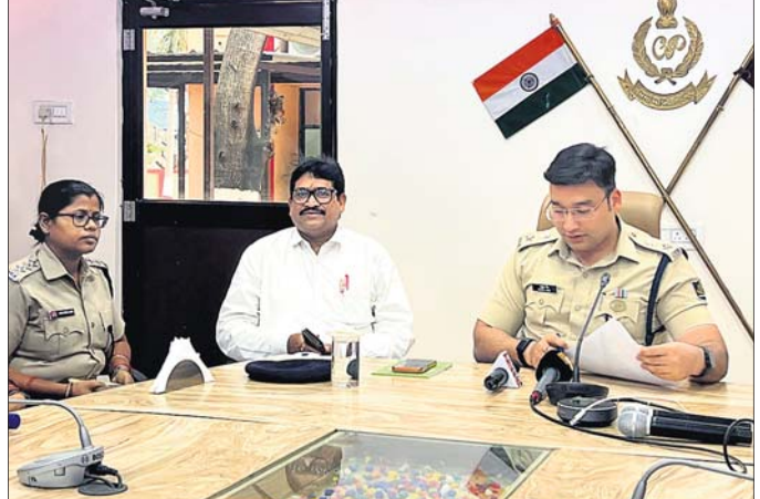
ଖବରଦାତା ସମ୍ମିଳନୀରେ ଅନୁଗୋଳ ଏସ୍ପିଙ୍କ ସହ ଅନ୍ୟମାନେ ।