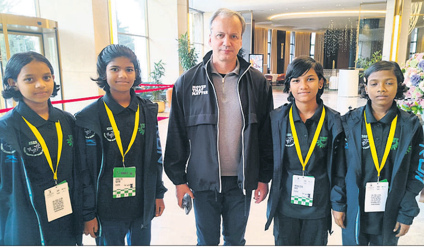
ଅଲମାଟିରେ ଭାରତ ପକ୍ଷରୁ ପ୍ରତିନିଧିତ୍ୱ କରୁଥିବା କିସ୍ ଛାତ୍ରୀଙ୍କ ସହ ଫିଡେ ସଭାପତି ଆର୍ନାଟି ତତ୍ତ୍ୱୋତ୍ତରାଜିତ୍ ।