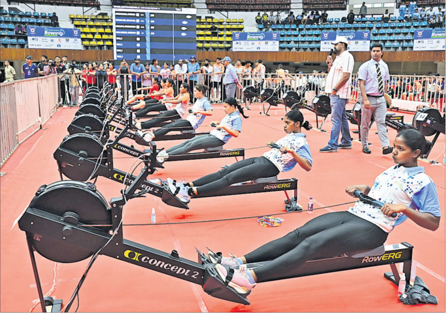
କଟକର ଜବାହରଲାଲ ନେହେରୁ ଇନ୍‌ଡୋର ସ୍ପୋର୍ଟସ୍ ମେଡିସିନ ଶୁକ୍ରବାର ଉଦ୍‌ଘାଟିତ ସର୍ବଭାରତୀୟ ଇନ୍‌ଡୋର ରୋଇଂ ଚାମ୍ପିୟନସ୍‌ସ୍ ଅବସରରେ ପ୍ରତିଯୋଗୀମାନେ ଏଥିରେ ପାଣି କିମ୍ପା ତଳା ବ୍ୟବହାର ହେଉନାହିଁ। ମେଡିକାଲ କ୍ରିଆରେ ପ୍ରତିଯୋଗୀମାନେ ମୁକାବିଲା କରୁଛନ୍ତି।