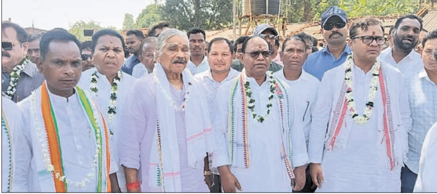
ରାୟଗଡ଼ା ଜିଲ୍ଲା କାଶୀପୁର ବ୍ଲକ୍ କଞ୍ଚାମାଟି ଗ୍ରାମରେ ଶୁକ୍ରବାର ପହଞ୍ଚିଥିବା କଂଗ୍ରେସ ଟିମ୍।