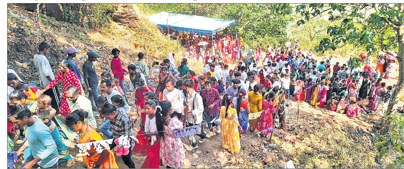
ଦମକ ଯାତ୍ରା ପାଇଁ ବାଲତା ପାହାଡ଼ରେ ଲୋକଙ୍କ ଭିଡ଼।

ପା'ଙ୍କ ନିକଟରେ ବଳି ଦେଇଥିଲେ। ଅଧିକାଂଶ ଅଞ୍ଚଳରୁ ହଜାର ସଂଖ୍ୟକ ଭକ୍ତ ଆସି ଠାକୁରାଣୀଙ୍କ ଦର୍ଶନ କରିଥିଲେ। ସମ୍ପୂର୍ଣ୍ଣ ଅଞ୍ଚଳ ଉତ୍ସବମୁଖର ହୋଇଥିଲା। ଶାନ୍ତିଶୁଖିଳା ପାଇଁ ପୂଜା କମିଟି ପକ୍ଷରୁ ବ୍ୟାପକ ବ୍ୟବସ୍ଥା କରାଯାଇଥିଲା। ପୋଲିସ ପ୍ରଶାସନ ସୁରକ୍ଷା ବଳୟରେ ମା'ଙ୍କୁ ଗ୍ରାମ ପରିକ୍ରମା କରି ପୂଜା ପାଇବା ନିଜ ଅପ୍ମାନକୁ ଫେରିଥିଲେ। ଉତ୍ସବରେ ହଜାର ହଜାର ଶ୍ରଦ୍ଧାଳୁଙ୍କ ଭିଡ଼ ଜମିଥିଲା। ପାରମ୍ପରିକ ରୀତିନୀତିରେ ବାଜା, ମନ୍ଦୁରା, ଘଣ୍ଟର ତାଳେ ତାଳେ ମା'ଙ୍କୁ ମନ୍ଦିରକୁ ଗାଁରେ ନିର୍ମିତ ଅପ୍ମାନ ମନ୍ଦିରକୁ ଅଣାଯାଇଥିଲା। ୯ ଦିନ ଧରି ମା'ଙ୍କ ପୂଜା କରାଯାଇଥିଲା। ଶୁକ୍ରାଳ୍ପମାନେ