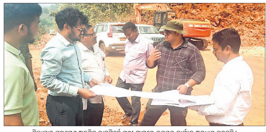
ଜିଲ୍ଲାପାଳ ପ୍ରଥମେ ଅବିଭକ୍ତ ରାଜସ୍ୱର ଯତ୍ନ ଗ୍ରାମରେ ଉନ୍ନତ କାର୍ଯ୍ୟର ଅନୁଧ୍ୟାନ କରୁଛନ୍ତି।

ମାଲକାନଗିରି ଜିଲ୍ଲା ପ୍ରଶାସନ ପକ୍ଷରୁ ଭୂମି ସାଜିବା ଅଞ୍ଚଳର ବିକାଶ ପାଇଁ ପ୍ରକ୍ରିୟା କୋରସର କରାଯାଇଛି। ଅପହସ୍ତ ଅଞ୍ଚଳର କୋଶ ଅନୁକୋଶରେ ସରକାରୀ ସେବା ପହଞ୍ଚାଇବା ଲକ୍ଷ୍ୟରେ ଜିଲ୍ଲାପାଳ ପ୍ରଥମେ ଅବିଭକ୍ତ ରାଜସ୍ୱର ଚିତ୍ରକୋଣ୍ଡା ବ୍ଲକ୍ ସ୍ତରର ଯତ୍ନ ପ୍ରୟାସରେ ଶୁକ୍ରବାର ଗସ୍ତ କରିଛନ୍ତି। ବିଭିନ୍ନ ବିକାଶମୂଳକ କାର୍ଯ୍ୟର କ୍ଷେତ୍ର ପରିବର୍ତ୍ତନକରି ସମାଧାନ କରିଛନ୍ତି। ଭୌଗୋଳିକ ପ୍ରତିବନ୍ଧକ ସତ୍ତ୍ୱେ ଜିଲ୍ଲାପାଳ ଓ ରାଜ୍ ଚିମ୍ପା ଚିତ୍ରକୋଣ୍ଡା ଶିଳ୍ପକ୍ଷେତ୍ର ଲକ୍ଷ୍ୟ ଯାତ୍ରା ମୋଟର ବୋର୍ଡ ଯୋଗେ ଜଳପଥ ଦେଇ ଯତ୍ନ ଗ୍ରାମରେ ପହଞ୍ଚିଥିଲେ। ଅଜନଶ୍ରୀ ପିଲାମାନଙ୍କ ଦ୍ୱାରା ପ୍ରଦର୍ଶିତ