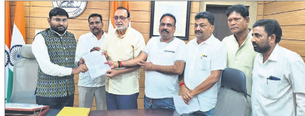
ଦାବିପତ୍ର ଦେବାକୁ ଆସିଥିବା ବ୍ୟବସାୟୀମାନେ।