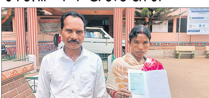
ତମ୍ବୁଣି ଖୁଲ ଓ ସାମା କେଶବ।