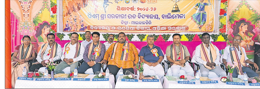
କାର୍ଯ୍ୟକ୍ରମରେ ଉପସ୍ଥିତ ଅତିଥି ଓ ଅନ୍ୟମାନେ।

ଅଞ୍ଚଳର ବିକାଶକୁ ଅଗ୍ରାଧିକାର ଦିଆଯାଉଥିବା ସେ କହିଥିଲେ। ଯତ୍ନରେ ଯେଉଁ କାର୍ଯ୍ୟ ଶେଷ ହେଲେ ଏହି ଅଞ୍ଚଳର ଯୋଗାଯୋଗ ବ୍ୟବସ୍ଥାରେ ଏକ ନୂତନ ଅଧ୍ୟାୟ ପୃଷ୍ଠିହେବ। ଏହି ସମୟରେ ଜିଲ୍ଲା ମୁଖ୍ୟ ଉନ୍ନତ ଅଧିକାରୀ ଦାଖଲ ସମୟରେ, ଚିତ୍ରକୋଣ୍ଡା ବିଭାଗ ପ୍ରାଣୀ କୁମାର ଓ ଅନ୍ୟ ଅଧିକାରୀମାନେ ଉପସ୍ଥିତ ଥିଲେ। ସାଜିବା ଅଞ୍ଚଳର ବିକାଶପାଇଁ ଜାରି ରଖିବାକୁ ଜିଲ୍ଲା ପ୍ରଶାସନ ସର୍ବଦା ପ୍ରତିଶ୍ରୁତିବଦ୍ଧ ବୋଲି ଜିଲ୍ଲାପାଳ ବୋଧହୋଇଥିଲେ।