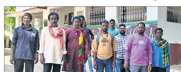
ଦାବି ଜଣାଇବାକୁ ଆସିଥିବା ଗ୍ରାମବାସୀ।