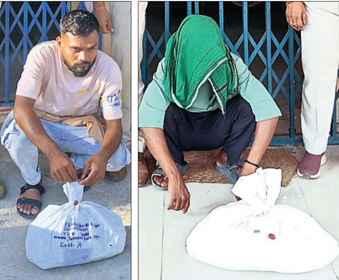
ଗିରଫ ୨ ଅଭିଯୁକ୍ତ ।

ଉତ୍ତରକୋଟ, ୧୦.୧୪ (ସଂକଳ୍ପ ଶତପଥୀ) ଗଞ୍ଜେଇ ଚୋରା ଚାଲାଣ ଅଭିଯୋଗରେ ଉତ୍ତରକୋଟ ଅଧିକାରୀ ବିଭାଗ ୨ ଜଣଙ୍କୁ ଗିରଫକରି କୋର୍ଟ ଚାଲାଣ କରିଛି । ସେମାନେ ହେଲେ ବାଉଁଶବେତା ଗ୍ରାମର ମୁଖ୍ୟ ପାଇକ (୨୧) ଓ ଧୋଡ଼ା ଗାଁ ନିକଟସ୍ଥ ଚେନ୍ଦୁଲିଖୁଣ୍ଟି ଗ୍ରାମର ଖଗପତି ଉତ୍ତର (୨୬) । ପୋଲିସ୍ ସେମାନଙ୍କ ନିକଟରୁ ୪ କେଜି ୧୭୫ ଗ୍ରାମ ଗଞ୍ଜେଇ ଜବତ କରିଛି । ସୂଚନା ଅନୁଯାୟୀ, ଅଧିକାରୀ ବିଭାଗ ଶୁକ୍ରବାର ପାଟ୍ଟୋଲି କରୁଥିବା ସମୟରେ ଗଞ୍ଜେଇ ଗ୍ରାମପଞ୍ଚାୟତ ବାଉଁଶବେତା