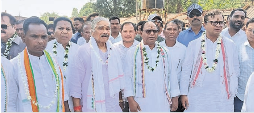
ରାୟଗଡ଼ା ଜିଲ୍ଲା କାଶୀପୁର ବ୍ଲକ୍ କର୍ମାଳୟ ଗ୍ରାମରେ ଶୁକ୍ରବାର ପହଞ୍ଚିଥିବା କଂଗ୍ରେସ ଚିମ୍ପା