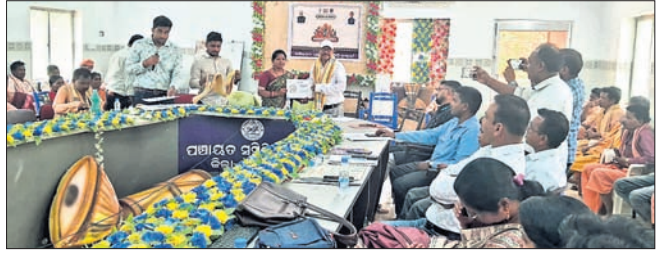
କାର୍ଯ୍ୟକ୍ରମରେ ଅତିଥି ଜଣେ କଳାକାରଙ୍କୁ ସମ୍ମାନିତ କରୁଛନ୍ତି ।