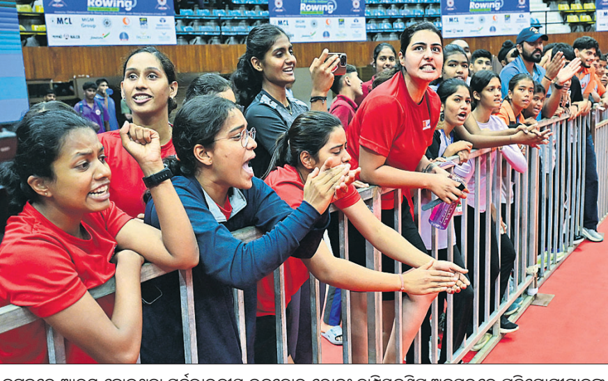
କଟକରେ ଆରମ୍ଭ ହୋଇଥିବା ସର୍ବଭାରତୀୟ ଇନ୍‌ଡୋର ରୋଲ୍ ଚାମ୍ପିୟନସିପ୍ ଅବସରରେ ପ୍ରତିଯୋଗୀମାନଙ୍କୁ ସହଯୋଗୀମାନେ ଉତ୍ସାହିତ କରୁଛନ୍ତି ।