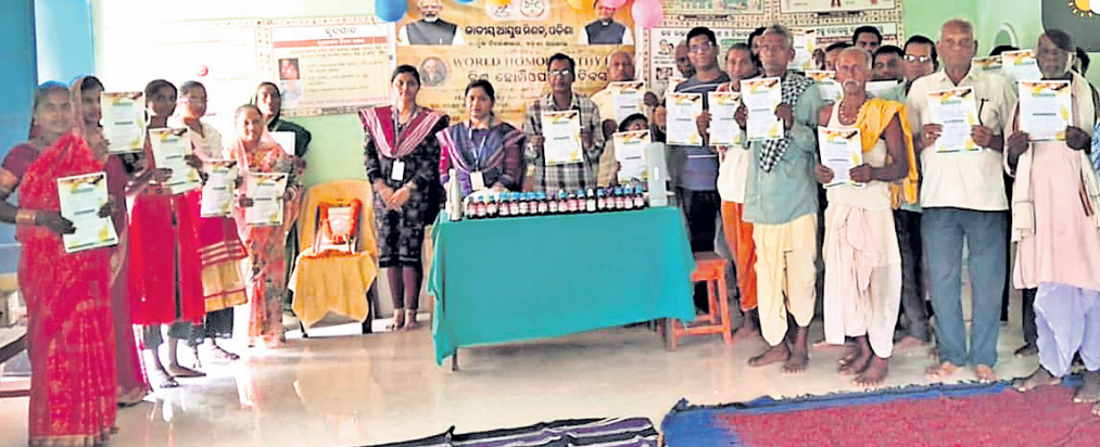
ବଣପଲ୍ଲୀ, ୧୦/୪ (ପ୍ରକାଶ କୁମାର ପାଣି)

ସି.ଏସ୍. ସାମୁଏଲ୍ ହାନିମାନଙ୍କ ଜୟନ୍ତୀ ପାଳନ ଅବସରରେ ସ୍ୱାସ୍ଥ୍ୟକ୍ଷେତ୍ରରେ ହୋମିଓପାଥିକ୍ ମେଡିକାଲରେ ବିଶ୍ୱ ହୋମିଓପାଥିକ୍ ଦିବସ ଶୁକ୍ରବାର ପାଳିତ ହୋଇଯାଇଛି । ହୋମିଓପାଥିକ୍ ଜନକ ଡା.