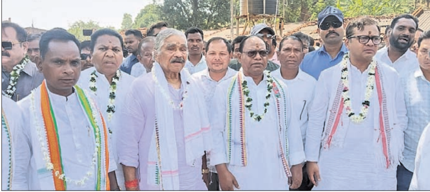
ରାୟଗଡ଼ା ଜିଲ୍ଲା କାଶୀପୁର ବ୍ଲକ୍ କଖମାଳ ଗ୍ରାମରେ ଶୁକ୍ରବାର ପହଞ୍ଚିଥିବା କଂଗ୍ରେସ ଟିମ୍।

ଅଗ୍ନିକାଣ୍ଡରେ ଜଳିଗଲେ ପକ୍ଷାଘାତ ପୀଡ଼ିତା ବୃଦ୍ଧା ବାଉଁଶୁଣା, ୧୦/୪ (ଦେବାଶିଷ୍ଟ କେପାଳ) ବୈକଳ୍ୟ ବାଉଁଶୁଣା ଗ୍ରାମପଞ୍ଚାୟତର ଦିକରାପଡ଼ା ଗ୍ରାମରେ ଶୁକ୍ରବାର ଅଗ୍ନିକାଣ୍ଡରେ ଘର ଭିତରେ ଥିବା ଜଣେ ପକ୍ଷାଘାତ ପୀଡ଼ିତା ବୃଦ୍ଧା ସମ୍ପୂର୍ଣ୍ଣ ଜଳିଯାଇଛନ୍ତି।