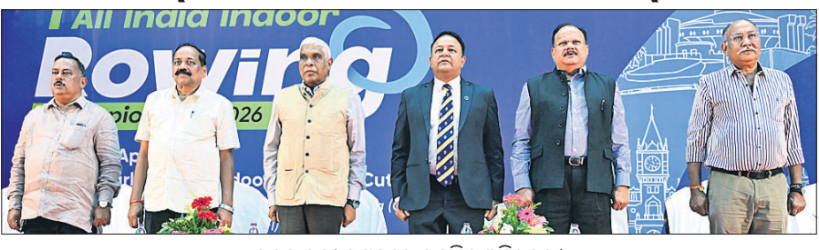
ଉଦ୍‌ଘାଟନା ଉତ୍ସବରେ ଉପସ୍ଥିତ ଅତିଥିବୃନ୍ଦ ।

ଭାରତୀୟ ରୋଲ୍ ଫେଡେରେଶନ ଏବଂ ଓଡ଼ିଶା ଆସୋସିଏସନ ଫର ରୋଲ୍ ଆଣ୍ଡ ସ୍କଲିଂର ମିଳିତ ସହଯୋଗରେ ପ୍ରଥମ ସର୍ବଭାରତୀୟ ଇନ୍‌ଡୋର ରୋଲ୍ ଚାମ୍ପିୟନସିପ୍ ଶୁକ୍ରବାର ସ୍ଥାନୀୟ ଜବାହରଲାଲ ନେହେରୁ ଇନ୍‌ଡୋର ସ୍ଥଳରେ ଆରମ୍ଭ ହୋଇଛି । ପ୍ରଥମ ଦିବସରେ ଆୟୋଜକ ଓଡ଼ିଶାକୁ ଅଧିକାଂଶ ସମ୍ପର୍କ ମିଳିଛି ।