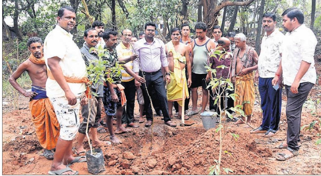
କଂସାରିସାହିର ଲୋକେ ଚାରାରୋପଣ କରୁଛନ୍ତି ।

କିଛି ସୁବିଧା କରାଗଲା ନାହିଁ । ସ୍କୁଲ ନିର୍ମାଣ ସମୟ ୧୯୫୧ରୁ ହୋଇଥିବା ଘରଗୁଡ଼ିକ ବିପଦସଙ୍କୁଳ ହୋଇପଡ଼ିଛି । ଆଜବେଷ୍ଟସ କଣା ହୋଇ ପାଣି ଗଳୁଛି । ଓରା, ଶେଣାରେ ଭଲ ଲାଗିବ ଯିବା ବାହା ନଷ୍ଟ ହୋଇ ଚାଲିଛି । କାଳଗୁଡ଼ିକ ନଷ୍ଟ ହୋଇଯିବା ପରେ ସିମେଣ୍ଟ ଅତଡ଼ା ଖସୁଛି । ଏଥିରେ ମରାମତି କଲେ ମଧ୍ୟ ଏହାର ସୁବିଧା ରହିବ । ପୁରୁଣା ବେଞ୍ଚ ଓ ତେଲୁ ଭାଙ୍ଗି ଗଲାଣି । ଭଙ୍ଗା ଘରେ, ଭଙ୍ଗା ବେଞ୍ଚ ଓ ତେଲୁରେ ଛାତ୍ରଛାତ୍ରୀ ପାଠ ପଢ଼ୁଛନ୍ତି । ଛାତ୍ରୀମାନଙ୍କ ପାଇଁ ଶୈବାଳୟ ଥିବାବେଳେ ଛାତ୍ର ଓ କର୍ମଚାରୀଙ୍କ ପାଇଁ ନ ଥିବାରୁ ସବୁବେଳେ ହଇଜା ହେବାକୁ ପଡ଼ୁଛି । ସେହିପରି ସ୍କୁଲର ଚାରିପଟେ ପ୍ରାଚୀର ନାହିଁ । ଗୋରୁ ଗାଈଙ୍କ ଅବାଧ ପ୍ରବେଶ ଯୋଗୁଁ ସ୍କୁଲର ସୁବିଧା ରହିନାହିଁ । ସେହିପରି ୧୦୦ ଛାତ୍ରଛାତ୍ରୀ ବସି କରି ସଭା କରିବା ପାଇଁ ସମ୍ମିଳନୀ କକ୍ଷଟିଏ ମଧ୍ୟ ନାହିଁ । ସ୍ୱାଚ୍ଛ କମରରୁ ମଧ୍ୟ ନାହିଁ ବୋଲି ଅଭିଭାବକ ଓ ଛାତ୍ରଛାତ୍ରୀମାନେ କହିଛନ୍ତି ।