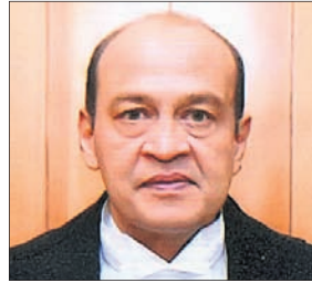
ଜଷ୍ଟିସ୍ ଯଶଓନ୍ତ ବର୍ମା

ଦିଲ୍ଲୀର ସରକାରୀ ବାସଭବନରେ ଅଗ୍ନିକାଣ୍ଡ ପରେ ବିପୁଳ ପରିମାଣର ଆଧାପୋଡ଼ା ଚକ୍କା ମିଳିବା ଯୋଗୁ ବିବାଦୀୟ ହୋଇଥିବା ଆଲ୍ଲାହାବାଦ ହାଇକୋର୍ଟର ବିଚାରପତି ଜଷ୍ଟିସ୍ ଯଶଓନ୍ତ ବର୍ମା ଶୁକ୍ରବାର ନିଜ ପଦବୀରୁ ଇସ୍ତଫା ଦେଇଛନ୍ତି । ସେ ରାଷ୍ଟ୍ରପତି ଡ୍ରୌପଦୀ ମୂର୍ମୁଙ୍କ ନିକଟକୁ ଏପ୍ରିଲ ୯ରେ ଇସ୍ତଫାପତ୍ର ଦେଇଥିଲେ, ଯାହାକି ଗୃହାନ୍ତ ହୋଇଛି । ତାଙ୍କ ବିରୋଧରେ ସଂସଦରେ ମହାଭିଯୋଗ ନେଇ ପ୍ରକ୍ରିୟା ଆରମ୍ଭ ପୂର୍ବରୁ ସେ ଇସ୍ତଫା ଦେବା ଦ୍ୱାରା ଯାନ୍ତ୍ର ପ୍ରକ୍ରିୟାରେ ବିରତି ଆସିଛି । ଜଷ୍ଟିସ୍ ବର୍ମାଙ୍କ ବିରୋଧରେ ମହାଭିଯୋଗ ଆସିଥିଲେ ଲୋକ ସଭାର ଅତିକମ୍ପରେ ୧୦୦ ଜଣ ଓ ରାଜ୍ୟ ସଭାର ୫୦ ଜଣ ସଦସ୍ୟଙ୍କ ସ୍ୱାକ୍ଷର ସମ୍ବଳିତପତ୍ର ଗତବର୍ଷକୁ ଦିଆଯାଇଥିଲା । ଉତ୍ତରାଞ୍ଚଳ ଦେଖିଲେ ଅତୀତରେ ସୁପ୍ରିମକୋର୍ଟର ପୂର୍ବଦିନ ବିଚାରପତି ଜଷ୍ଟିସ୍ ଭି. ରାମସ୍ୱାମୀ ଓ କଲିକତା ହାଇକୋର୍ଟର ପୂର୍ବଦିନ ବିଚାରପତି ଜଷ୍ଟିସ୍ ସୌମିନ୍ଦ୍ର ସେନଙ୍କ ବିରୋଧରେ ମୋସଦ ଆସିଥିଲେ ମଧ୍ୟ ସେମାନଙ୍କୁ ପୂର୍ଣ୍ଣ ଭାବେ ଅପସାରିତ କରାଯାଇ ନ ଥିଲା । ବର୍ତ୍ତମାନ ପରିପ୍ରେକ୍ଷାରେ ଜଷ୍ଟିସ୍ ବର୍ମା ଇସ୍ତଫା ଦେଇଥିବାରୁ ମାମଲା ସ୍ୱତନ୍ତ୍ର ରଦ ହୋଇଯିବା ନ୍ୟାୟିକ ବିଶେଷକ୍ଷମାନେ ମତ ଦେଇଛନ୍ତି ।