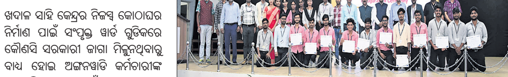
ପାରଳାଖେମୁଣ୍ଡି, ୧୦୪ (ଗିରିଧାରୀ ପରିଚ୍ଛା)

ତେଲିସାହି ଓ ଗୋଲାସାହି-୧ ଆଦି ୬ଟି କେନ୍ଦ୍ର ନିଜସ୍ୱ କୋଠାରେ ରାଜିଛି। ଗୋଲାସାହି ଦ୍ୱିତୀୟ ଅଜ୍ଞାନତା କେନ୍ଦ୍ରକୁ ଭଲ ରାସ୍ତା ନ ଥିବା ବେଳେ ରତ୍ନନାଥ ସାହି କେନ୍ଦ୍ର ନିର୍ମିତ ନିଜସ୍ୱ କୋଠାରେ ଉଦ୍‌ଘାଟିତ ହୋଇଥିଲେ ମୁଖ୍ୟ ଯେଠାକୁ ଚାଲୁଥିବା ଦେଖାଯାଇଛି।