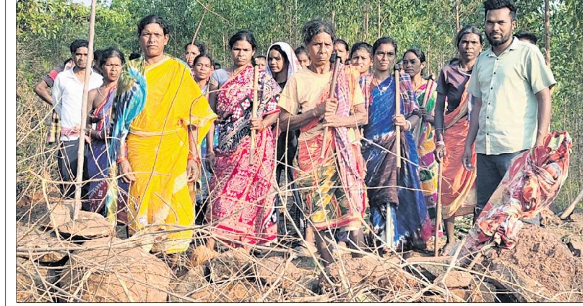
ରାୟଗଡ଼ା ଜିଲ୍ଲା କାଶୀପୁର ବ୍ଲକ୍‌ରେ ଥିବା ସିଦ୍ଧିଲି ପାହାଡ଼ର ପୁରୁଣା ପାଇଁ ଅଞ୍ଚଳବାସୀ ଶୁକ୍ରବାର ପାଦଦେଶରେ ଜରି ରହିଛନ୍ତି ।

ରାୟଗଡ଼ା/କଲ୍ୟାଣସିଂହପୁର, ୧୦୧୪ (ଆଶିଷ ରଞ୍ଜନ ପଣ୍ଡା/ଦୀପକ କୁମାର ପରିଡ଼ା) ରାୟଗଡ଼ା ଜିଲ୍ଲା କାଶୀପୁର ବ୍ଲକ୍ ସିଦ୍ଧିଲି ବନ୍ଧାଢ଼ି ଖଣିକୁ ବେଦାନ୍ତ ପକ୍ଷରୁ ଗତ ମଇଜୁଲାଇନ ରାସ୍ତା