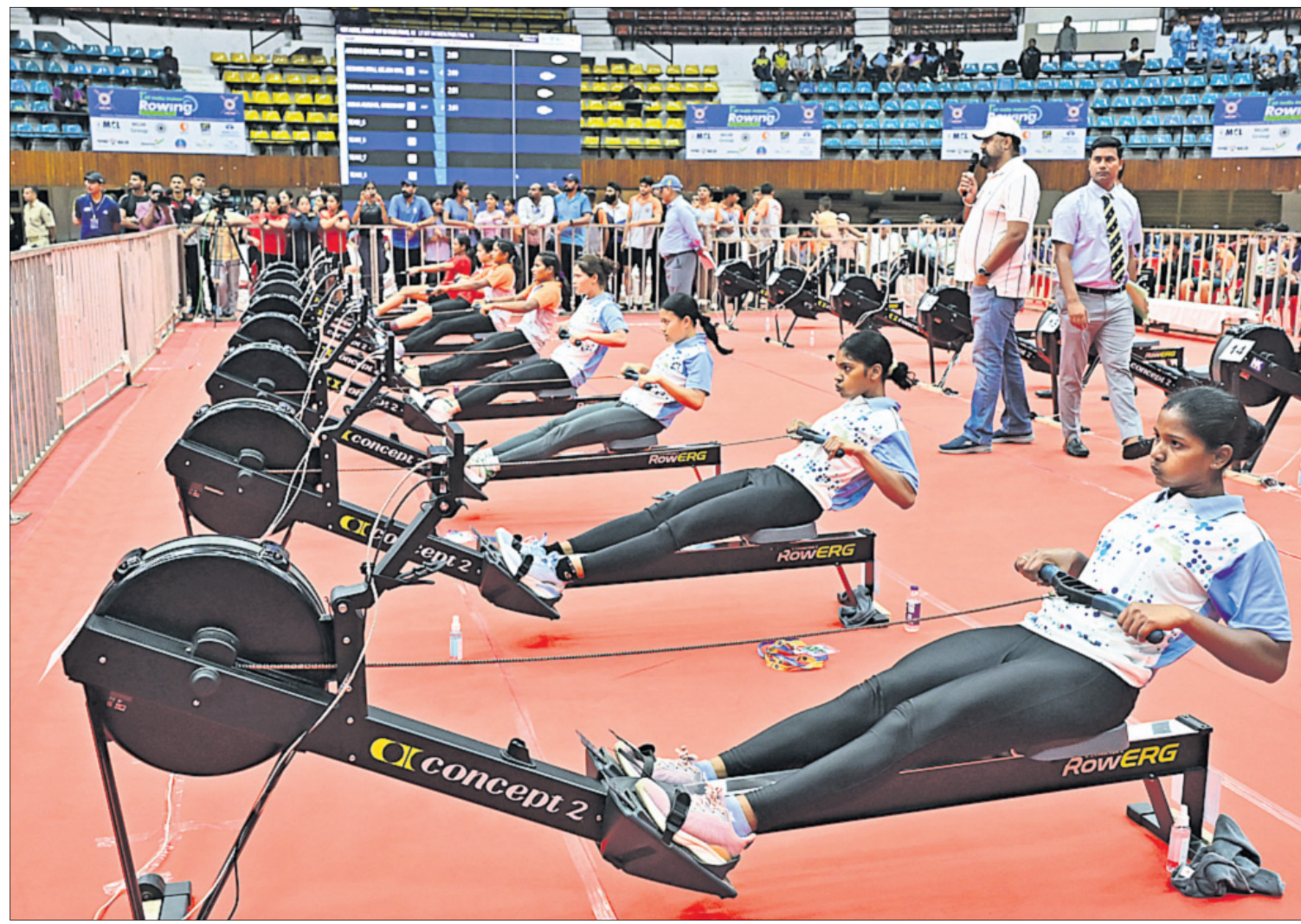
କଟକର ଜବାହରଲାଲ ନେହେରୁ ଇନ୍‌ଡୋର ସ୍ପୋର୍ଟସ୍‌ମେନ୍ ଶୁକ୍ରବାର ଉଦ୍‌ଘାଟିତ ସର୍ବଭାରତୀୟ ଇନ୍‌ଡୋର ରୋଇଂ ଚାମ୍ପିୟନସିପ୍ ଅବସରରେ ପ୍ରତିଯୋଗୀମାନେ ଏଥିରେ ପାଣି କିମ୍ପା ତଳା ବ୍ୟବହାର ହେଉନାହିଁ । ମେଣ୍ଟିନ୍ କରିଆରେ ପ୍ରତିଯୋଗୀମାନେ ମୁକାବିଲା କରୁଛନ୍ତି ।