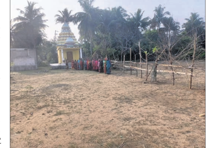
ସିଦ୍ଧେଶ୍ୱର ମହାଦେବ ମନ୍ଦିରର ପ୍ରମୁଖ ମାର୍ଗକୁ ବାଉଁଶ ଆଡି ଦେଇ ଅବରୋଧ କରାଯାଇଛି । ଉଭୟ ଅନନ୍ତପୁର ଓ କୁରୁପୁର ପଞ୍ଚାୟତର ବହୁ ହଜାର ଭକ୍ତ ଆସୁଥିବା ବେଳେ ଉଲ୍ଲେଖ ରହିଛି ଯେ, ମନ୍ଦିର ମାର୍ଗକୁ କାର୍ଯ୍ୟକାରୀ ଅବରୋଧ କରାଯାଇଛି ବୋଲି ଗ୍ରାମବାସୀ ପ୍ରତାରଣା ସେମାନଙ୍କୁ ଅସତ୍ୟ ଭାଷାରେ ଗାଳିଗୁଳି କରାଯିବା ସହ ଆନାରେ ଅଭିଯୋଗ କରିବା ପାଇଁ ଧମକ ଦିଆଯାଇଛି ।

ବାଲିକୁଦା ତହସିଲ ଅନ୍ତର୍ଗତ ଅନନ୍ତପୁର ପଞ୍ଚାୟତ କେଉଁପଡା ଗ୍ରାମର ପ୍ରତିଷ୍ଠିତ ଶୈବ ପୀଠ ଶ୍ରୀମୁଖୀ ସିଦ୍ଧେଶ୍ୱର ମହାଦେବ ମନ୍ଦିରର ପ୍ରମୁଖ ମାର୍ଗକୁ ସେହି ଗ୍ରାମର ଗୋଟିଏ ପରିବାର ବାଉଁଶ ଆଡି ଦେଇ ଦୀର୍ଘମାସ ହେବ ଅବରୋଧ କରି ରଖୁଥିବା ନେଇ ଗ୍ରାମବାସୀଙ୍କ ପକ୍ଷରୁ ଜିଲ୍ଲାପାଳ ଓ ତହସିଲଦାରଙ୍କ ନିକଟରେ ଶୁକ୍ରବାର ଲିଖିତ ଅଭିଯୋଗ କରାଯାଇଥିବା ବେଳେ ପୋର୍ଟାଲ କରିଆରେ ମୁଖ୍ୟମନ୍ତ୍ରୀ ଓ ମୁଖ୍ୟ ଶାସନ ସଚିବଙ୍କ ନିକଟରେ ମଧ୍ୟ ଅଭିଯୋଗ କରାଯାଇଛି । ସେଥିରେ ଉଲ୍ଲେଖ ରହିଛି ଯେ, ମନ୍ଦିର ମାର୍ଗକୁ କାର୍ଯ୍ୟକାରୀ ଅବରୋଧ କରାଯାଇଛି ବୋଲି ଗ୍ରାମବାସୀ ପ୍ରତାରଣା ସେମାନଙ୍କୁ ଅସତ୍ୟ ଭାଷାରେ ଗାଳିଗୁଳି କରାଯିବା ସହ ଆନାରେ ଅଭିଯୋଗ କରିବା ପାଇଁ ଧମକ ଦିଆଯାଇଛି । ଏହି ମନ୍ଦିରକୁ