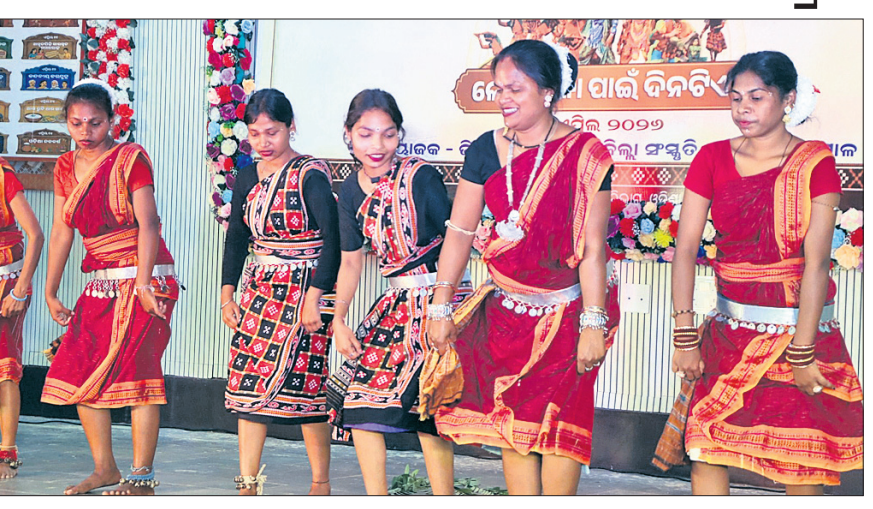
ପୁଲକାଶୀରେ କଳାକାରମାନେ ଲୋକକଳା ପ୍ରଦର୍ଶନ କରୁଛନ୍ତି।

ପୁଲକାଶୀ/ଖୁର୍ଦ୍ଧାପଡ଼ା, ୧୦୪(ରାଜେଶ୍ୱରୀ କୁମାର ରାଉତ/ବିଭୁ ବେହେରା) ଲୋକକଳା ପାଇଁ ଦିନଟିଏ କାର୍ଯ୍ୟକ୍ରମ ଅନୁଷ୍ଠିତ ହୋଇଛି। ଲୋକ ପାରମ୍ପରିକ ଲୋକକଳା, ସଙ୍ଗୀତ ଓ ନୃତ୍ୟ କଳାକାରମାନେ ପରିବେଷଣ କରିଥିଲେ।