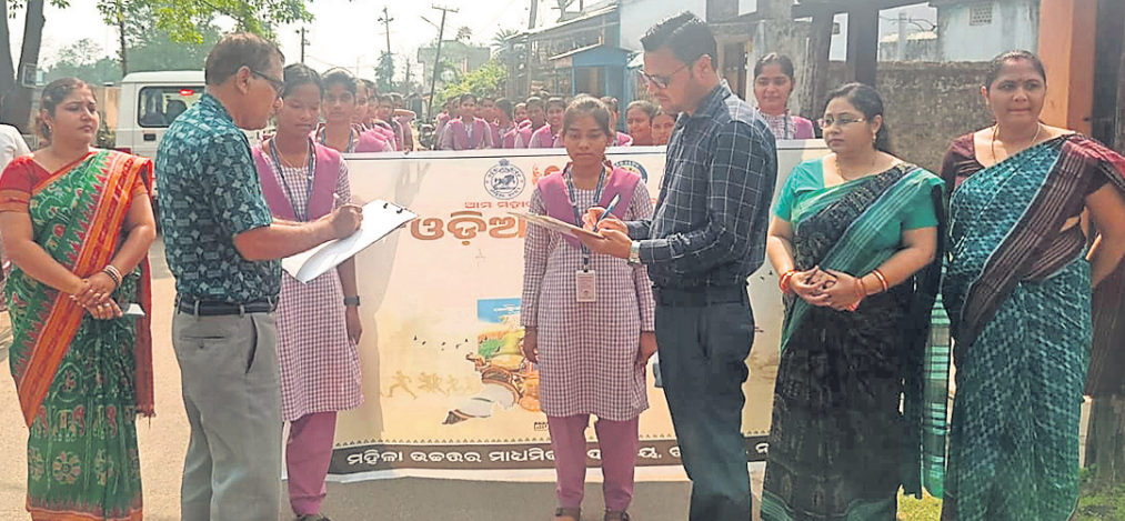
ଖଣ୍ଡପଡ଼ା ମୁକ୍ତ ୨ ମହିଳା ମହାବିଦ୍ୟାଳୟର ଛାତ୍ରୀମାନେ ଲୋକଙ୍କୁ ଓଡ଼ିଆରେ ସ୍ୱାକ୍ଷର କରାଯାଇଛି ।