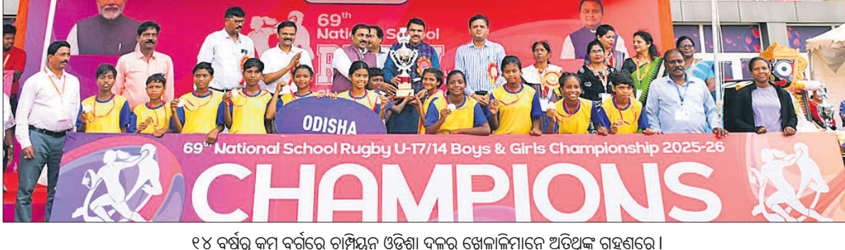
୧୪ ବର୍ଷରୁ କମ୍ ବର୍ଗରେ ଚାମ୍ପିୟନ ଓଡ଼ିଶା ଦଳର ଖେଳାଳିମାନେ ଅତିଥିଙ୍କୁ ଗୃହଣରେ ।