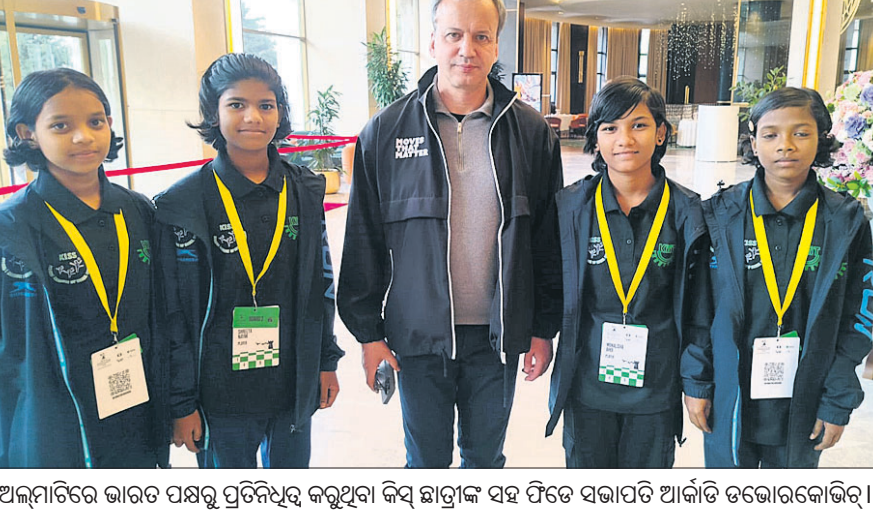
ଅଲମ୍ପିକରେ ଭାରତ ପକ୍ଷରୁ ପ୍ରତିନିଧିତ୍ୱ କରୁଥିବା କିଏ ଛାତ୍ରୀଙ୍କ ସହ ଫିଡେ ସଭାପତି ଆର୍ନାଲ୍ଡ ଡିଭୋରକୋଭିଚ୍ ।