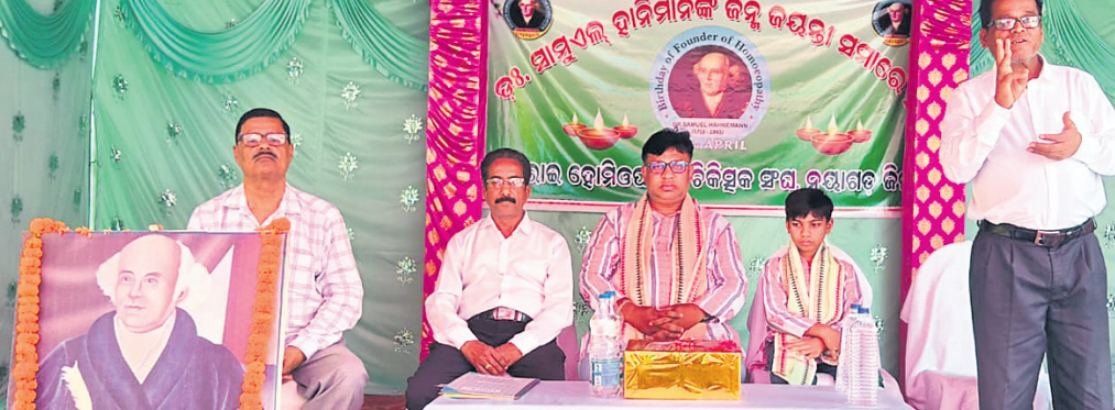
ଜୟନ୍ତୀ ଉତ୍ସବରେ ମଞ୍ଚସାଥୀ ଅତିଥି ।