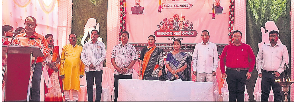
ଲୋକକଳା ଦିବସରେ ଉପସ୍ଥିତ ଅତିଥିମାନେ ।

ସମେତ ବହୁ କଳା ରହିଛି । ଦଶପଲ୍ଲୀର ବିଭିନ୍ନସ୍ଥାନରେ କଳାକୃତିର ଫଟୋଗ୍ରାଫି ଅଙ୍କା ଯାଇ ଆକର୍ଷଣ ହୋଇପାରିଛି । ଏହାକୁ ବ୍ୟାପକ କରାଯିବା ନିମନ୍ତେ ମତପ୍ରକାଶ ପାଇଥିଲା । ବିଶିଷ୍ଟ ଅତିଥି ବିଭିନ୍ନ କଳା ଭରପୁର ହୋଇରହିଛି ବୋଲି ମତବ୍ୟକ୍ତ କରିଥିଲେ । ଦଶପଲ୍ଲୀର ପ୍ରସିଦ୍ଧ ଲକ୍ଷ୍ମୀପତି ଯାତ୍ରା, ବନ୍ଦୁପର୍ବ, ଅଷ୍ଟପ୍ରହରୀ