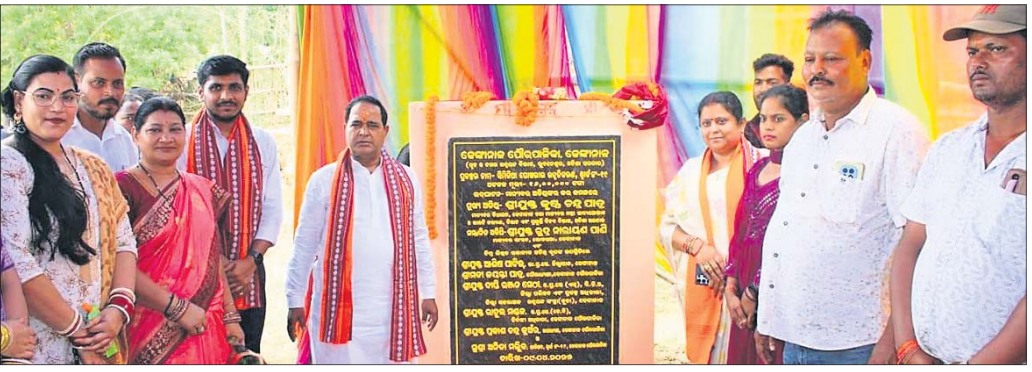
ପଞ୍ଚମ ସଭାରେ ପଦବୀ ମାଡ଼ି ବସିଛନ୍ତି ନର୍ସିଂ କର୍ମଚାରୀ।

ଡାକ୍ତରୀ ଡାକ୍ତରୀର ଉପଯୋଗୀ ଯୋଗାଣ କମିଟିର ସଭାରେ ପଦବୀ ମାଡ଼ି ବସିଛନ୍ତି ନର୍ସିଂ କର୍ମଚାରୀ। ପଞ୍ଚମ ସଭାରେ ଉପଯୋଗୀ ଯୋଗାଣ କମିଟିର ସଭାରେ ପଦବୀ ମାଡ଼ି ବସିଛନ୍ତି ନର୍ସିଂ କର୍ମଚାରୀ।