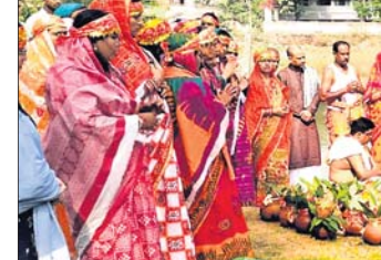
ମା' ତାରିଣୀଙ୍କ ପ୍ରତିଷ୍ଠା ଉତ୍ସବ ପାଇଁ କଲସ୍ ଯାତ୍ରାରେ ଯୋଗାଣ କମିଟିର ସଭାରେ ପଦବୀ ମାଡ଼ି ବସିଛନ୍ତି ନର୍ସିଂ କର୍ମଚାରୀ।