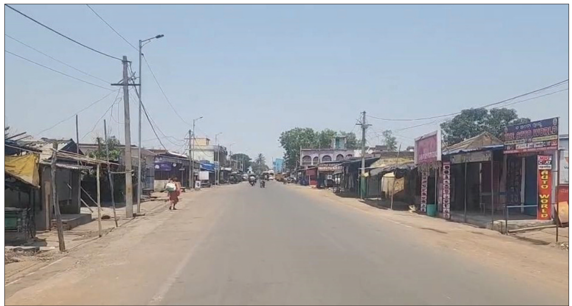
ବନ୍ଦପାଳନ ଯୋଗୁ ଅନୁଗୋଳ ଜିଲ୍ଲା ଛେଡ଼ିପଦା ଥାନା କୋଶଳା ଦେଇ ଯାଇଥିବା ରାଜ୍ୟ ରାଜପଥ ଗାଡ଼ିଶୂନ୍ୟ ରହିଛି।

ସଞ୍ଜୁ ସାମସନଙ୍କ ଶତକ ଦିଲ୍ଲୀ କ୍ୟାପିଟାଲ୍ ବିପକ୍ଷ ଆଇପିଏଲ୍ ମ୍ୟାଚରେ ଶତକ ହାସଲ କରିଛନ୍ତି ବେକାଲ ସୁପର କିଙ୍ଗ୍ସ ଓପନର ସଞ୍ଜୁ ସାମସନ।