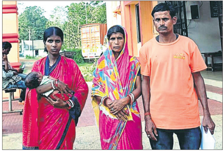
ଥାନାକୁ ଅଭିଯୋଗ କରିବାକୁ ଆସିଥିବା ଶାଶୁ ଶଶୁଛଳା ସାଇଁକ ସହିତ ପରିବାର ଲୋକ । ନିର୍ଯାତନା ଘଟଣାରେ ଜଣାପଡ଼ିବା ସହ ସ୍ତ୍ରୀ, ପୁଅ ଓ ଶାଶୁଙ୍କୁ ପେଟ୍ରୋଲ ଢାଳି ଜିଆଡ଼ା ଜାଳିବାକୁ ଉଦ୍ୟମ କରିଥିଲେ ବୋଲି ଜଣାପଡ଼ିଥିଲା ।