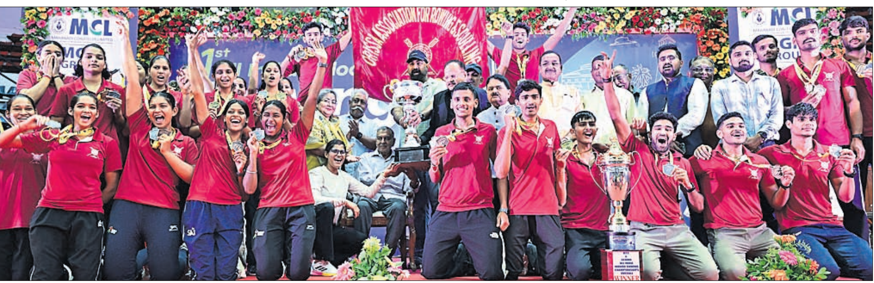
ସର୍ବଭାରତୀୟ ଇନ୍ଡୋର ରୋଲ୍ ଚାମ୍ପିୟନସ୍ଥିପରେ ଓଡ଼ିଶା ଅଲ ଚାମ୍ପିୟନ ଓଡ଼ିଶା ଦଳ ତୁଫି ସହ ଅତିଥିକ ରହଣରେ। ।