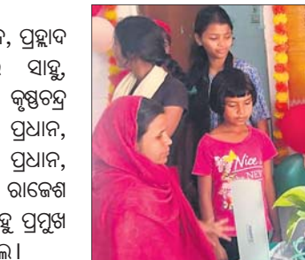
ବିଶ୍ୱ ହୋମିଓପାଥୀକ ଦିବସ ପାଇଁ ପ୍ରକଳ୍ପର ଭିତ୍ତିପଥର ସ୍ଥାପନ କରାଯାଇଛି।