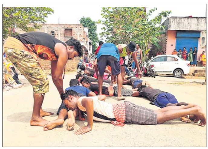
ଆଦର ହରାଇଲି ଦେଢ଼ାମାଲର ଦଣ୍ଡନୂତ୍ୟ ଉପରେ ଆକ୍ରୋଶିତ ହୋଇଛନ୍ତି ନର୍ସିଂ କର୍ମଚାରୀ।