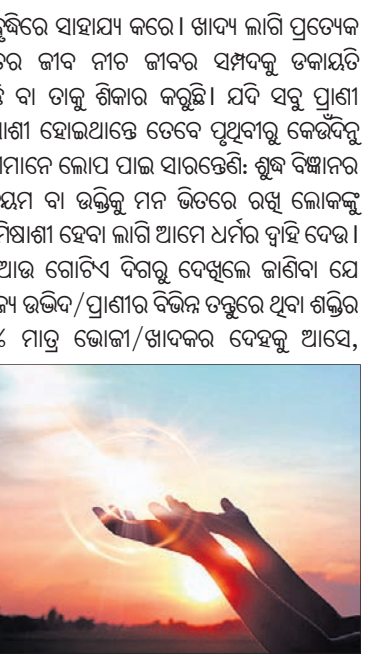
ପରିବେଶରୁ ସବୁ ଜିନିଷ ମିଳିପାରୁଛି ତେବେ ଶରୀର କାହିଁକି ଖଟିବ ବା ସବୁ ଜିନିଷ ତିଆରି କରିବାର ଯନ୍ତ୍ରପାତି (ଏନ୍‌ଜାଇମ୍) କାହିଁକି ବୋହିବ? ବିଶେଷ ଉଦ୍ଦେଶ୍ୟରେ ଓ ସୁସ୍ୱଚ୍ଚର କାମ ପାଇଁ କୋଷଗୁଡ଼ିକ ଶକ୍ତି ଓ ଗ୍ଲୁକୋଜ୍ ଯୋଗାଇ ପାରିଛି ବୋଲି ତ ମସ୍ତିଷ୍କର ବୃଦ୍ଧି ହୋଇଛି। ସେ ତା'ର ବିଶ୍ୱାସକୁ ବ୍ୟାବହାରିକ କୌଶଳ ବା କାର୍ଯ୍ୟ ବିଦ୍ୟାରେ ଲଗାଇଛି, ଦର୍ଶନ ଓ ବିଜ୍ଞାନରେ ମଜ୍ଜି ଯିବାକୁ ସମୟ ପାଉଛି।

କାରଣ, କିନ୍ତୁ ବିଜ୍ଞାନ ଦୃଷ୍ଟିରୁ ବୁଝିପାନ୍ତର କାମ। ଯଦି ପରିବେଶରୁ ସବୁ ଜିନିଷ ମିଳିପାରୁଛି ତେବେ ଶରୀର କାହିଁକି ଖଟିବ ବା ସବୁ ଜିନିଷ ତିଆରି କରିବାର ଯନ୍ତ୍ରପାତି (ଏନ୍‌ଜାଇମ୍) କାହିଁକି ବୋହିବ? ବିଶେଷ ଉଦ୍ଦେଶ୍ୟରେ ଓ ସୁସ୍ୱଚ୍ଚର କାମ ପାଇଁ କୋଷଗୁଡ଼ିକ ଶକ୍ତି ଓ ଗ୍ଲୁକୋଜ୍ ଯୋଗାଇ ପାରିଛି ବୋଲି ତ ମସ୍ତିଷ୍କର ବୃଦ୍ଧି ହୋଇଛି। ସେ ତା'ର ବିଶ୍ୱାସକୁ ବ୍ୟାବହାରିକ କୌଶଳ ବା କାର୍ଯ୍ୟ ବିଦ୍ୟାରେ ଲଗାଇଛି, ଦର୍ଶନ ଓ ବିଜ୍ଞାନରେ ମଜ୍ଜି ଯିବାକୁ ସମୟ ପାଉଛି। ଶରୀରର କୋଷଗୁଡ଼ିକ ଆପେ ଆପେ ଖାଦ୍ୟ ସଂଗ୍ରହ କରିନିଅନ୍ତେ ତ ମଣିଷ ଏକ 'ଜ୍ଞାନ ଅସୁତ୍ର', ସେନ୍‌ସିବିଲ୍ ବିକଳ, ହୋଇଯାଆନ୍ତା, ଆମର ଉପସ୍ଥିତ ଭାଷାରେ ଦେବତା ହୋଇଯାନ୍ତା। ମଣିଷ ଆଜିଯାଏ ଯାହା ହୋଇଅଛି ସେସବୁ ବିକଳନର ଫଳ, ବିଚରଣ ନିୟମକୁ ନିୟନ୍ତ୍ରଣ କରୁଥିବା ଶକ୍ତିକୁ ଆମେ ଭଗବାନ କହିଲେ ସେ ନିୟନ୍ତ୍ରଣକୁ ମାନିବାକୁ ଭକ୍ତି କହିବା। ତେଣୁ ଭଲ ଜୀବନ ପାଇଁ ପରିବେଶ ସୃଷ୍ଟି କରିବା ଓ ଭଲ ରହିବା ନିଜର କ୍ରିୟାଧୀନ, ତାହା ହିଁ ଆମର ଉପସ୍ଥିତ ଭାଷାରେ ଭଗବାନଙ୍କୁ ପ୍ରାର୍ଥନା। ମୂର୍ଚ୍ଛିତ୍ୟ ରହି ତା' ଆଗରେ ରୂପି ଶ୍ଳୋକ ଉକାରଣ କରିବା ସମ୍ପୂର୍ଣ୍ଣ ମଣିଷର ଜୀବନକୁ ସାମୟିକ ଭାବେ ସରସ ଆଉ ସୁଖୀ କରିପାରେ, କିନ୍ତୁ ମଣିଷ ସମାଜକୁ ଉନ୍ନତ କରେ ନାହିଁ। ଏକକୋଷୀ ଜୀବ ବହୁକୋଷୀ ହେବାର ଅବସର ଆସିଲା ଯେତେବେଳେ ଗୋଟିଏ କୋଷ ଆଉ ଏକ କୋଷକୁ ତା' ଅନ୍ତର୍ଗତ ଭଳି କରି ରଖିପାରନ୍ତି। ଏକକୁ ବହୁକୋଷୀ ହୋଇ ଉଦ୍ଭିଦ ଓ ପ୍ରାଣୀ ହେଲେ। ଉଦ୍ଭିଦ ଜଗତରେ ପରାଜ୍ଞତାପୂର୍ଣ୍ଣ ଓ ପ୍ରାଣୀ ଜଗତରେ ମାଂସାଣୀ ଆରମ୍ଭ ହେଲେ। ଭୋକ୍ୟ ଦେହରେ ଥିବା ଜୈବିକ ଉପାଦାନଗୁଡ଼ିକ ଉଚ୍ଚତର ପ୍ରାଣୀର ରେଡିଫେକ୍ ଖାଦ୍ୟ ହୋଇଗଲା। ପ୍ରକୃତିର ଫାଷ୍ଟ ଫୁଲ୍। ଭୋକାର ଅନ୍ଧ ବା ଅନ୍ଧର ପହଞ୍ଚିଲା ଯାଣି ଭୋକ୍ୟ ଜୀବର ବୁଦ୍ଧିର ବୁଦ୍ଧିର ଅଞ୍ଚ ଓ ରସ (ମଣିଷର ଭାଷାରେ ମାଂସ ଓ ରକ୍ତ) ଆଦିକୁ ଅନୁଗୁଡ଼ିକ ଏନ୍‌ଜାଇମ୍-କ୍ରିୟା ଦ୍ୱାରା ବୁଝିପାରି ହୋଇ ଉଚ୍ଚତର ଜୀବର ଦେହରେ ମିଶେ। ଏଭଳି ପ୍ରସିଦ୍ଧି ବା ପ୍ରକ୍ରିୟାକରଣ, ଯାହାକୁ ଆମେ ହଜମ କ୍ରିୟା (ଡାଇଜେସ୍‌ଟ) କହୁଛୁ, ଜୀବର