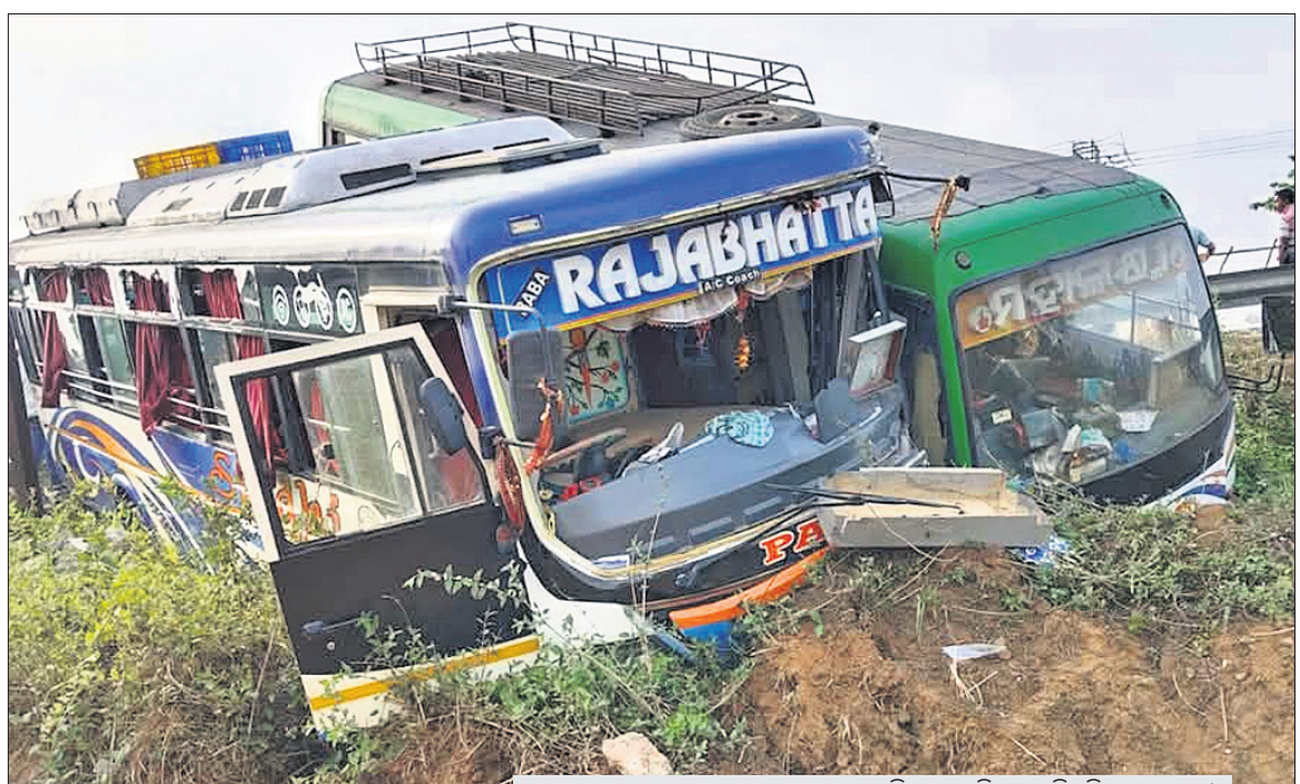
କଟକ-ସାଲେପୁର ଗାସ୍ତାର ଭାତପଡ଼ା ଛକ ନିକଟରେ ବିଲକୁ ଖସିପଡ଼ିଥିବା ୨ ବସ୍।

ସଞ୍ଜୁ ସାମସନଙ୍କ ଶତକ ଦିଲ୍ଲୀ କ୍ୟାପିଟାଲ୍ ବିପକ୍ଷ ଆଇପିଏଲ୍ ମ୍ୟାଚରେ ଶତକ ହାସଲ କରିଛନ୍ତି ଚେକାଇ ସୁପର କିଙ୍ଗ୍ସ ଓପନର ସଞ୍ଜୁ ସାମସନ।