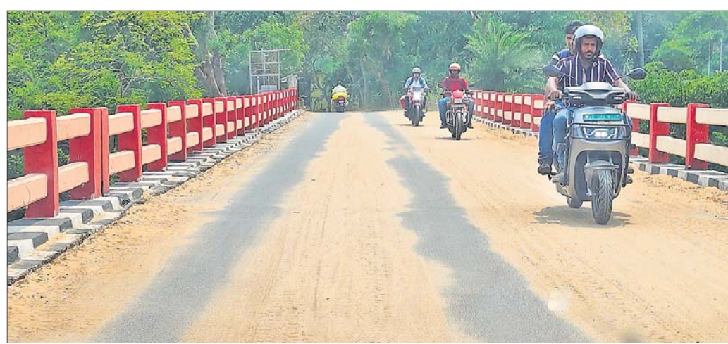
ଖରସ୍ରୋତା କୋକଡ଼ିଆ ବ୍ରିଜ୍ ଉପରେ ବାଲି ଆସୁରଣ ଜମିଛି ।

■ ବିପଦରେ ଜୀବନ-ଜେନାପୁର ବ୍ରାହ୍ମଣୀ ସେତୁ ■ ଖରସ୍ରୋତା କୋକଡ଼ିଆ ବ୍ରିଜ୍ ଉପରେ ବାଲି ଆସୁରଣ