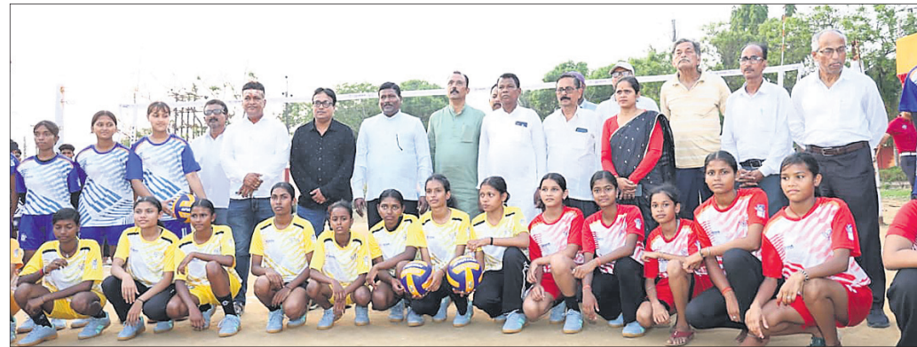
ଅଭିଯୁକ୍ତ କୋର୍ଟ ଚାଲାଣ: ମହିଳା ଉଦ୍ଧାର

ଜଗତ୍‌ସିଂହପୁର, ୧୧୪ (ପ୍ରମୋଦ କୁମାର ନାୟକ) ଗ୍ଲାନାୟ ନବକୃଷ୍ଣ ଚୌଧୁରୀ ଷ୍ଟାଡ଼ିୟମରେ ଏକ ସିଏମ୍ ଟ୍ରଷ୍ଟି ଆନ୍ଧ୍ର କ୍ଲବ ଓ ଆନ୍ଧ୍ର ଜିଲ୍ଲା କବାଡ଼ି, ଭଲିବଲ, ଖୋଖୋ ପ୍ରତିଯୋଗିତା ୨୦୨୬, ଜୁଣ୍ଡା ଜିଲ୍ଲା ବିଦ୍ୟାଳୟ ସମୂହ ଜୁଣ୍ଡା ସଙ୍ଗଠନ ଜଗତ୍‌ସିଂହପୁର ସମୂହ ଜୁଣ୍ଡା ସଙ୍ଗଠନ ଜଗତ୍‌ସିଂହପୁର ସୌଜନ୍ୟରୁ ଉଦ୍ଘାଟିତ ହୋଇଯାଇଛି। ଜଗତ୍‌ସିଂହପୁର ଅତିରିକ୍ତ ଜିଲ୍ଲାପାଳ କୋଷିକାଙ୍କର ରାୟକ ଅଧ୍ୟକ୍ଷତାରେ ଅନୁଷ୍ଠିତ ଉଦ୍ଘାଟନା ସଭାରେ