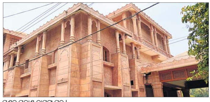
ପ୍ରଣବ ପ୍ରକାଶ ଦାସଙ୍କ ଘର ।

ଯାଜପୁର ଥାନାରେ ପାଇଟା ଅଭିଯୋଗ ଯାଜପୁର ଗଞ୍ଜନ, ୧୧/୪ (ପ୍ରସନ୍ନା ପ୍ରିୟଦର୍ଶିନୀ ମହାନ୍ତି)