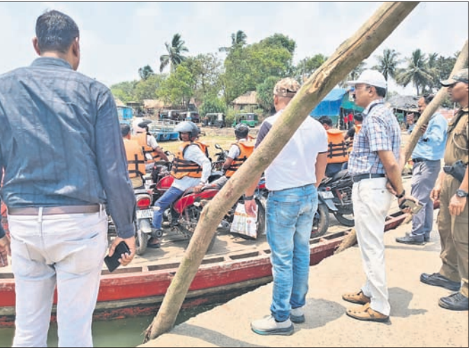
ଫେରି ଘାଟଠାରେ ଜିଲ୍ଲାପାଳ ଓ ଅନ୍ୟ ଅଧିକାରୀମାନେ ପରିଦର୍ଶନ କରୁଛନ୍ତି।