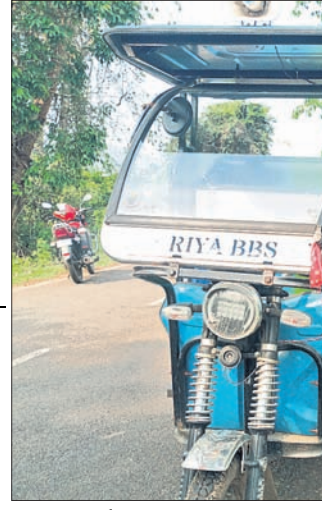
ଆବର୍ଜନାକୁ ଗାଡ଼ିକୁ ୧୦ଲି ନେଉଛନ୍ତି ଭ୍ରାତୃଭର।

ନୂଆଗାଁ, ୧୧୧୪ (ଧନେଶ୍ୱର ସାହୁ) ନୟାଗଡ଼ ଜିଲ୍ଲା ନୂଆଗାଁ ରୁକ୍ମ ଜାକେଡ଼ା ପଞ୍ଚାୟତରୁ ଆବର୍ଜନା ବୋହିବା ପାଇଁ ଦିଆଯାଇଥିବା ଗାଡ଼ି ଶନିବାର ଅଚଳ ହୋଇଯିବାକୁ ଗାଡ଼ିକୁ ୧୦ଲି ୧୦ଲି ଆଣି ନୟାଗଡ଼ ହୋଇଯାଇଛି ଭ୍ରାତୃଭର। ସାହିସାହିରୁ ଅଳିଆ ଆବର୍ଜନା ବୋହି ଆଣି କିପରି ବର୍ଜ୍ୟବସ୍ତୁ ପୁଞ୍ଜୀକରଣ କରାଯାଉ ନାହିଁ ବୋଲି ଭ୍ରାତୃଭର ମନିକ କହିଛନ୍ତି।