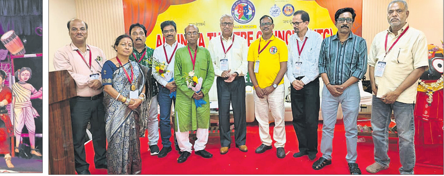
ପୁରୀଠାରେ ଅନୁଷ୍ଠିତ ଅଲ ଇଣ୍ଡିଆ କାର୍ତ୍ତବିଳାସ ଜାତୀୟ ଅଧିବେଶନରେ ଯୋଗଦେଇଥିବା ଅତିଥିମାନେ ।