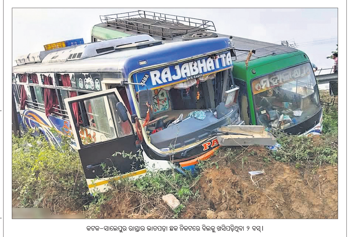
କଟକ-ସାଲେପୁର ରାସ୍ତାର ଭାତପଡ଼ା ଛକ ନିକଟରେ ବିଲ୍ଲୁ ଖସିପଡ଼ିଥିବା ୨ ବସ୍।

ଭୁବନେଶ୍ୱର, ୧୧୪(ସୁଚିତ୍ୱତା ସାହୁ) ଶିକ୍ଷକମାନେ ନିୟୋଜିତ ହୋଇଥିବାବେଳେ ଭାରତର ନିର୍ବାଚନ ଆୟୋଗ(ଇସିଆଇ)ଙ୍କ ନିର୍ଦ୍ଦେଶ ଅନୁସାରେ ଓଡ଼ିଶାରେ ଭୋଟର ତାଲିକାର ସ୍ୱତନ୍ତ୍ର ସଂଗ୍ରହ ସଂଗୋଧନ (ଏସ୍ଆଇଆର) ଏପ୍ରିଲ ୧୨ରୁ ଚାଲିଛି। ଏଥିରେ ନିର୍ଦ୍ଦେଶନାମା ଜାରି କରାଯାଇଛି। ଏସ୍ଆଇଆର ରୁପ୍ତ ଲେଭଲ୍ ଅଫିସର(ବିଏଲ୍ଓ) ଚୁକ୍ତିକରି ପଦାଧିକାର ବିଏଲ୍ଓଏକ୍ ବଦଳି ହେଲେ କାର୍ଯ୍ୟରେ ଭୂମିକା ନେଉଛନ୍ତି। ତେବେ ଏହି ଦାୟିତ୍ୱରେ ପ୍ରଭାବ ପଡ଼ିବା ଆଶଙ୍କା ରହିଛି। ଷ୍ଟ୍ରିଟ୍ ପୃଷ୍ଠା-୫