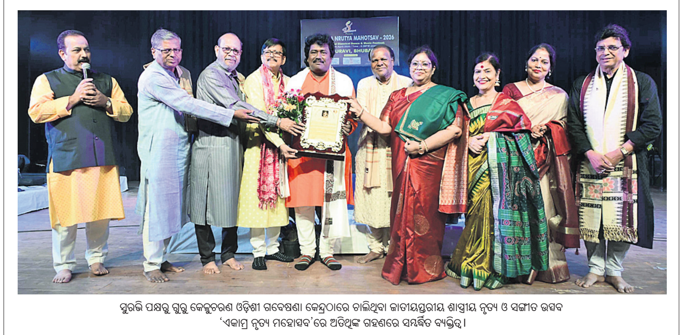
ସୁରଭ ପକ୍ଷରୁ ବୁକ୍ସ କେନ୍ଦ୍ରରେ ଓଡ଼ିଶା ଗବେଷଣା କେନ୍ଦ୍ରରେ ଚାଲିଥିବା ଜାତୀୟ ସ୍ତରୀୟ ଶାସ୍ତ୍ରୀୟ ନୃତ୍ୟ ଓ ସଙ୍ଗୀତ ଉତ୍ସବ 'ଏକାମ୍ର ନୃତ୍ୟ ମହୋତ୍ସବ'ରେ ଅତିଥିକ ଗହଣରେ ସମ୍ବର୍ଦ୍ଧିତ ହେଇଥିଲା ।