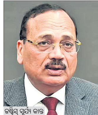
ଜଷ୍ଟିସ୍ ସୂର୍ଯ୍ୟ କାନ୍ତ

କେବଳ ପୁଞ୍ଜି କିମ୍ବା ନୀତି ବଳରେ ଭାରତ ୧୦ ଟ୍ରିଲିୟନ ଡଲାର ଅର୍ଥନୀତି ଲକ୍ଷ୍ୟ ହାସଲ କରିପାରିବ ନାହିଁ ବୋଲି ଭାରତର ପ୍ରଧାନ ବିଚାରପତି ସୂର୍ଯ୍ୟ କାନ୍ତ ଜଷ୍ଟିସ୍ କହିଛନ୍ତି । ଏକ ବିକାଶଶୀଳ ଅର୍ଥନୀତି ଚାହିଦା ପୂରଣ ପାଇଁ ଆଇନ ବ୍ୟବସ୍ଥାରେ ପରିବର୍ତ୍ତନ ଲାଗି ସେ ଆହ୍ୱାନ ଦେଇଛନ୍ତି । ଆଇନ ବ୍ୟବସ୍ଥାର ଗୁଣବତ୍ତା ଏକ ଗୁରୁତ୍ୱପୂର୍ଣ୍ଣ କାରଣ । ଦେଶକୁ ଲକ୍ଷ୍ୟ ହାସଲରେ ସହାୟତା ପାଇଁ ବାଣିଜ୍ୟିକ ଆଇନରେ ପୂର୍ବାନୁମତି, ବିଶେଷତା ଓ ଉତ୍ତମ ବିଶ୍ୱାସର ସଂସ୍କୃତି ଆବଶ୍ୟକ । ପୁଞ୍ଜି ଆବଶ୍ୟକତା ସହ ପ୍ରତିଷ୍ଠିତବଦ୍ଧତା ଏବଂ ନିବେଶକଙ୍କ ଆତ୍ମବିଶ୍ୱାସ ରହିବା ଜରୁରୀ ବୋଲି ଆଇନସୂଚକ ସମ୍ମିଳନୀରେ ଯୋଗଦେଇ ସିଜେଆଇ କହିଛନ୍ତି । ଅଧିକ ଦୃଷ୍ଟି ଆକର୍ଷଣ କରୁଥିବା ଅଧିକାଂଶ ସଂସ୍କାର ଅପେକ୍ଷା ମଧ୍ୟସ୍ତରୀ ଭଳି ବ୍ୟବସ୍ଥା ଭାରତର ଅର୍ଥନୀତିକୁ ପ୍ରତିବୃଦ୍ଧି ପାଇଁ ଅଧିକ ଆକର୍ଷଣ କରିଥାଏ । ପରିବର୍ତ୍ତନ ଅର୍ଥନୀତି ଆବଶ୍ୟକତାର ମୁକାବିଲା ପାଇଁ ପ୍ରୟତ୍ନର ବ୍ୟବହାର