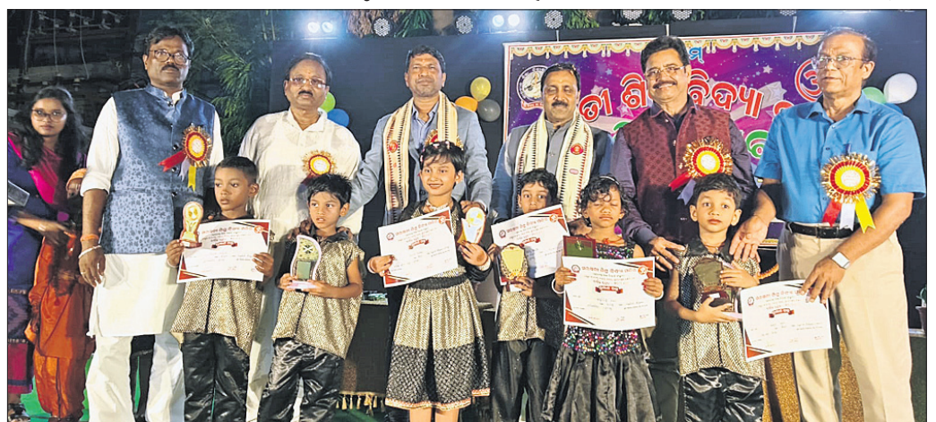
ନାନାଦି ବିହାର ସେକ୍ଟର-୩ରୁ ପରଷ୍ଟା ଶିଶୁ ବିଦ୍ୟାଳୟର ବାର୍ଷିକ ଉତ୍ସବରେ ଅତିଥିକ ଗହଣରେ କୃତୀ ଛାତ୍ରଛାତ୍ରୀ ।