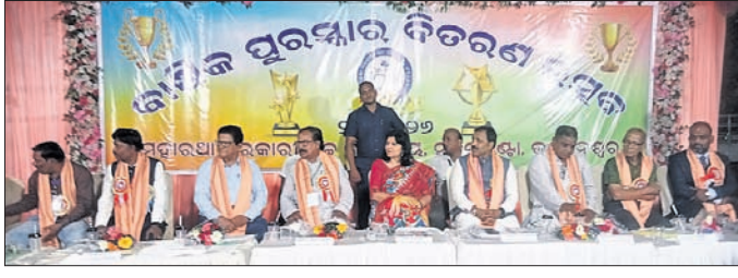
ଉତ୍ସବରେ ଏମ୍ପି ଅପରାଜିତା ଷଡ଼ଙ୍ଗୀ ଓ ଅନ୍ୟ ଅତିଥି ।