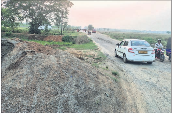
ନିର୍ମାଣ ବିବାଦକୁ ନେଇ ରାସ୍ତାକାମ ବନ୍ଦ ରହିଛି ।

ଭୁବନେଶ୍ୱର ନୂଆ ଅଧୀନ ଉତ୍ତରା ସରକାରଙ୍କୁ ନିର୍ଦ୍ଦେଶ ଦେଇ ପୂର୍ବ ପର୍ଯ୍ୟନ୍ତ ଚାଲିଥିବା ରାସ୍ତା ନିର୍ମାଣ ହେବ । ପ୍ରଥମ ପର୍ଯ୍ୟାୟରେ ପୂର୍ବ ବିଭାଗ ପକ୍ଷରୁ ବାଲିପାଟଣା ସୁଲଭାପୁରଠାରୁ ବାଲିପାଟଣା ପର୍ଯ୍ୟନ୍ତ ୩୭କୋଟି ଟଙ୍କାରେ ଚେଣ୍ଡର ହୋଇ ରାସ୍ତା କାମ ଶେଷ ପର୍ଯ୍ୟାୟରେ ପହଞ୍ଚିଛି । ତେବେ ପିପୁ କାମ ସରିବାକୁ ଥିବା ବେଳେ ବିଶ୍ୱନାଥପୁରଠାରେ ଏକ ବ୍ରିଜ୍ ନିର୍ମାଣ ସ୍ଥାନକୁ ନେଇ ବିବାଦ ଦେଖାଦେବାକୁ ରାସ୍ତା କାମ ବନ୍ଦ ରହିଛି । ସୂଚନା ମୁତାବକ, ରାସ୍ତା କାମ ପୂର୍ବରୁ ତହସିଲ ପ୍ରଶାସନ ପକ୍ଷରୁ ମାପପୃସ୍ତ କରିଯାଇଥିଲା । ବିଶ୍ୱନାଥପୁରଠାରେ ଥିବା ବ୍ରିଜ୍ ରୁ ଯାଉଥିବା ପାଣି ସରକାରୀ ଜାଗାରେ ନ ଯାଇ ଜଣେ ବ୍ୟକ୍ତିଙ୍କ ଜାଗାରେ ଯାଉଥିବା ଜଣାପଡ଼ିବା ପରେ ନୂତନ ସ୍ଥାନରେ ବ୍ରିଜ୍ ନିର୍ମାଣ ସହ ୧୦୦ ମିଟର ତ୍ରେନ୍ ଖୋଳାଯାଇ ସିଧାସଳଖ ପାଣି ନିଷ୍କାସନ ପାଇଁ ତହସିଲ ପ୍ରଶାସନ