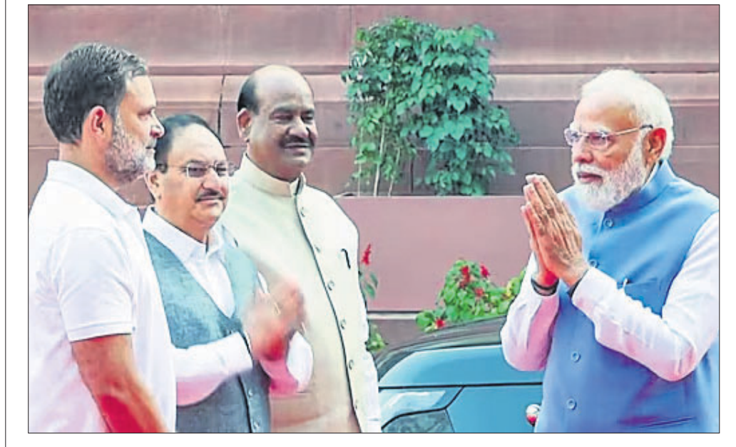
ମହାତ୍ମା ଜ୍ୟୋତିବା ଫୁଲେଙ୍କ ୨୦୦ତମ ଜନ୍ମଦିନରେ ତାଙ୍କୁ ଶ୍ରଦ୍ଧାଞ୍ଜଳି ଦେବା ଲାଗି ଶନିବାର ପ୍ରଧାନମନ୍ତ୍ରୀ ନରେନ୍ଦ୍ର ମୋଦି ପାଇଁମେଣ୍ଟ ପରିସରରେ ପ୍ରୋତ୍ସାହନରେ ସହସ୍ଥୁଥିବାବେଳେ ସେଠାରେ ଲୋକ ସଭାର ବିରୋଧୀ ଦଳ ନେତା ରାହୁଲ ଗାନ୍ଧୀଙ୍କ ସହ ସାମ୍ବାସାମ୍ନି ହେବାର ବିରଳ ଦୃଶ୍ୟ ଗୁଡ଼ ସୋସିଆଲ୍ ମିଡିଆ ଦୃଷ୍ଟି ଆକର୍ଷଣ କରିଥିଲା । ମୋଦି କାରୁ ବାହାରିବା ପରେ ଦିଲ୍ଲୀ ସମୟ ପାଇଁ ଅତି ଉତ୍ସାହ ସହ ସୌହାର୍ଦ୍ଦ୍ୟପୂର୍ଣ୍ଣ କଥା ହେଉଥିବା ଦେଖାଯାଇଛି ।

ଆମେରିକା ବ୍ୟତୀତ ଅଧିକାଂଶ ଦେଶର ନେତା ସେଲିଲେ ପ୍ରତିଷ୍ଠିତକୁ ସର୍ବସମ୍ମତକ୍ରମେ ଗ୍ରହଣ କରିଥିଲେ, ଯେଉଁଥିରେ ବିକାଶ ପାଇଁ ବାର୍ଷିକ ୪ ଟ୍ରିଲିୟନ ଡଲାର ଅର୍ଥନୈତିକ ବ୍ୟବଧାନକୁ ପୂରଣ କରିବା ଲକ୍ଷ୍ୟ ରଖାଯାଇଥିଲା । ବିକାଶଶୀଳ ରାଷ୍ଟ୍ରଗୁଡ଼ିକରେ ନିବେଶ ବଢ଼ାଇବା ଏବଂ ବିଶ୍ୱବ୍ୟାଙ୍କ ଏବଂ ଆଇଏମ୍‌ଏଫ୍ ଭଳି ଅନ୍ତର୍ଜାତୀୟ ଆର୍ଥିକ ପ୍ରତିଷ୍ଠାନଗୁଡ଼ିକର ସଂଘୀୟ ପାଇଁ ଆହ୍ୱାନ ଦିଆଯାଇଥିଲା । କାଟିସଂଘ ମହାସଭା ଆଷ୍ଟ୍ରେଲିଆ ଗୁଡ଼ରେ ସ୍ୱ ମଧ୍ୟ ୨ ଆର୍ଥିକ ପ୍ରତିଷ୍ଠାନରେ ବଡ଼ ଧରଣର ପରିବର୍ତ୍ତନ ପାଇଁ ବାରମ୍ବାର କହିଆସୁଛନ୍ତି । ଆଇଏମ୍‌ଏଫ୍ ଗିରିବ ଦେଶ ବଦଳରେ ଧନୀ ଦେଶକୁ ଅଧିକ ଲାଭଦାୟକ କରାଉଥିବାବେଳେ ବିଶ୍ୱବ୍ୟାଙ୍କ ଏହାର ନିଗମରେ ବିଫଳ ହୋଇଥିବା ଗୁଡ଼ରେ ସ୍ୱ କହିଛନ୍ତି ।