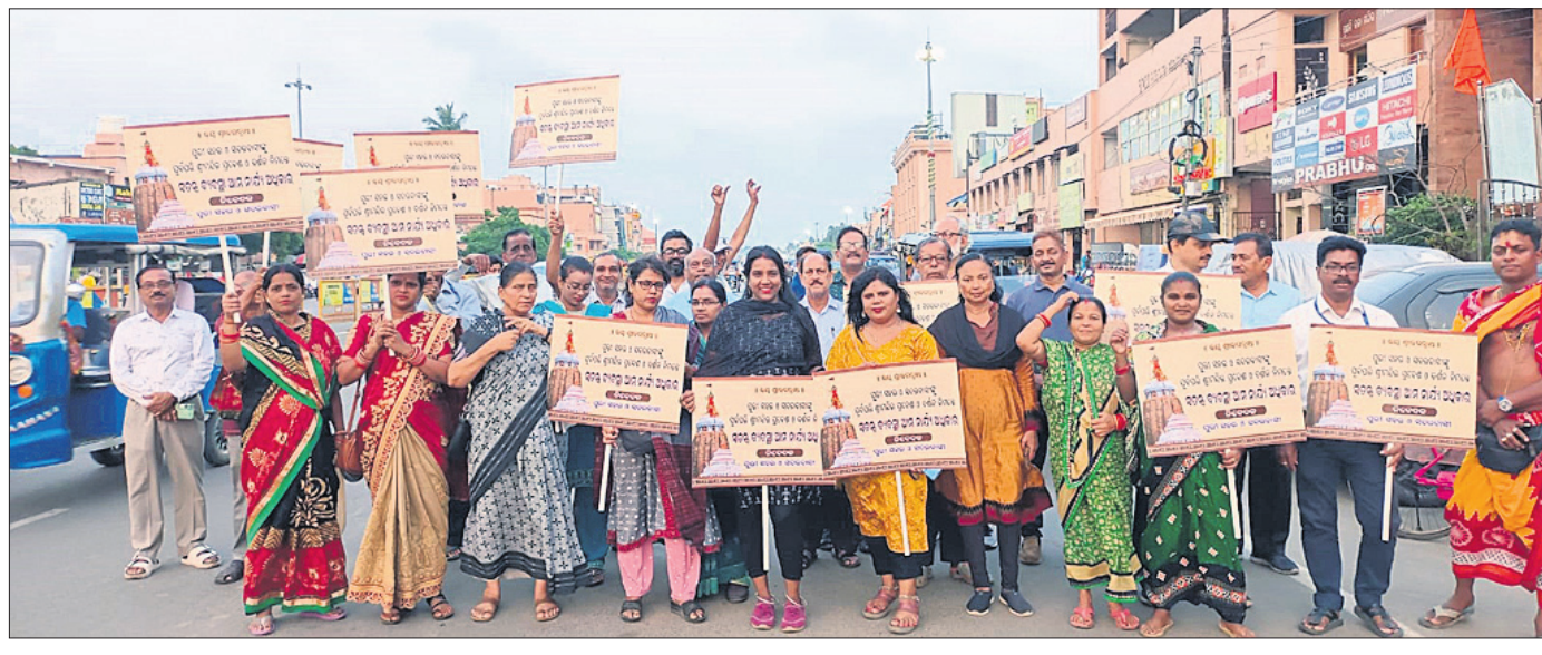
ଶ୍ରୀମନ୍ଦିରରେ ପୁରୀବାସୀଙ୍କ ପ୍ରବେଶ ପାଇଁ ସ୍ୱତନ୍ତ୍ର ବ୍ୟବସ୍ଥା ଦାବିରେ ଶନିବାର ସହରବାସୀ ସିଂହଦ୍ୱାର ସମ୍ମୁଖରେ ଧାରଣା ଦେଇଛନ୍ତି ।

ତିଥି ଅନୁସାରେ ପର୍ବ ପାଳନ କରନ୍ତୁ । ତିଥି ବ୍ୟତିକ୍ରମ କରି ପର୍ବ ପାଳନ କରା ନ ଯାଉ । ଶ୍ରୀମନ୍ଦିର ଅନୁଷ୍ଠିତ ହୋଇଯାଇଛି । ଦେଶ ଓ ଦେଶ ବାହାରେ ମହାପ୍ରଭୁ ଶ୍ରୀଜଗନ୍ନାଥଙ୍କ ପର୍ବପର୍ବାଣି ପାଳନ, ଇତ୍ୟନ୍ତ ଦାୟିତ୍ୱ ଅର୍ପଣ ଆଦି ଉପରେ ଗୁରୁତ୍ୱପୂର୍ଣ୍ଣ ଚର୍ଚ୍ଚା ହୋଇଥିଲା । ଉକ୍ତ ପାଠ୍ୟ ଅନୁସାରେ ଶ୍ରୀମନ୍ଦିରର ବର୍ଷିକ ପର୍ବପର୍ବାଣି ପାଳିତ ହୋଇଥାଏ । ମହାପ୍ରଭୁଙ୍କ ପର୍ବ ପାଳନ ଓ ତାହାର ତିଥି କ୍ୟାଲେଣ୍ଡରରେ ଉଲ୍ଲେଖ କରାଯାଇଛି । ଓଡ଼ିଶା, ଭାରତ ଏବଂ ଭାରତ ବାହାରେ ଯେଉଁଠି ଶ୍ରୀଜଗନ୍ନାଥଙ୍କ ବିଗ୍ରହ ପ୍ରତିଷ୍ଠା ହୋଇଛି, ସେଠାରେ ଶ୍ରୀମନ୍ଦିରର