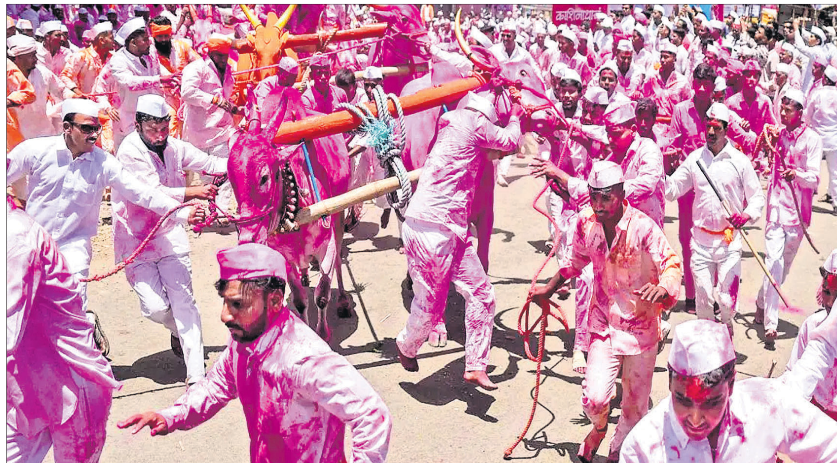
ମହାରାଷ୍ଟ୍ରର ସତ୍ୟାଗ୍ରହୀ ଲୋକ ଅନ୍ତର୍ଗତ ସୁରୁତାରେ ଶନିବାର ଅନୁଷ୍ଠିତ କୃଷି ଲୋକୋତ୍ସବ 'ବଗାଟ ମାତ୍ରା'ରେ ମୁକ୍ତଲା ଶସ୍ତ୍ରକୁ କାନ୍ଦୁ କରିବା ପାଇଁ ଲୋକେ ଉଦ୍ୟମ କରୁଛନ୍ତି ।