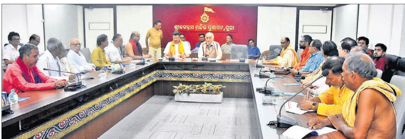
ବୈଠକରେ ଗଜପତି ମହାରାଜ ଦିବ୍ୟସିଂହ ଦେବଙ୍କ ସମେତ ସେବାୟତ ଅଧିକାରୀମାନେ ।