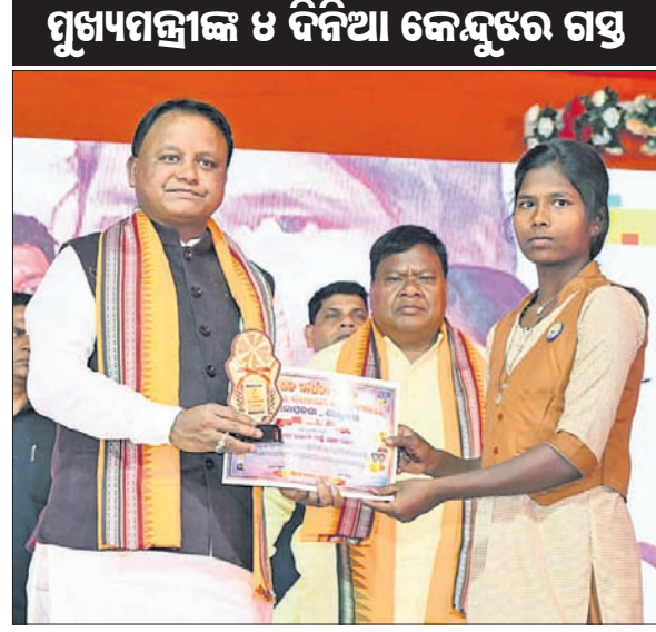
ମୁଖ୍ୟମନ୍ତ୍ରୀ ମୋହନ ଚରଣ ମାଝୀ ଜଣେ ଛାତ୍ରଙ୍କୁ ମାନପତ୍ର ଦେଇ ସମ୍ବର୍ଦ୍ଧିତ କରୁଛନ୍ତି।