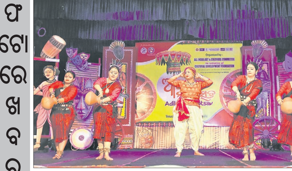
ପୁରୀ ଅନୁପମା ରଙ୍ଗମଞ୍ଚରେ ଅନୁଷ୍ଠିତ ଆବିଷ୍କୃତ ମହୋତ୍ସବର ଉଦ୍‌ଘାଟନା ସମ୍ପନ୍ନରେ କଳାକାରମାନେ ନୃତ୍ୟ ପରିବେଷଣ କରୁଛନ୍ତି ।