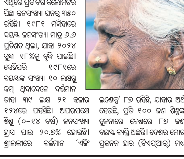
ଇଣ୍ଡୋର ୮୭ ରହିଛି, ଯାହାର ଅର୍ଥ ହେଉଛି, ପ୍ରତି ୧୦୦ ଜଣ ଶିଶୁଙ୍କ ତୁଳନାରେ ଦେଶରେ ୮୭ ଜଣ ବୟସ୍କ ବ୍ୟକ୍ତି ଅଛନ୍ତି। ଦେଶର ମୋଟ ପ୍ରଜନନ ହାର (ଟିଏସ୍ଆର) ମଧ୍ୟ

କଲକତ୍ତା, ୧୧୪(ପି.ଟି.) ଶ୍ରୀଲକ୍ଷ୍ମୀରେ ବୟସ୍କ ବ୍ୟକ୍ତିଙ୍କ ସଂଖ୍ୟା ନୂତନରୂପେ ବୃଦ୍ଧି ପାଇଛି। ସର୍ବମୁଖ୍ୟ ପ୍ରକାଶିତ ଜନଗଣନା ତଥ୍ୟ ଅନୁଯାୟୀ, ଗତ ୪ ଦଶନ୍ଧି ମଧ୍ୟରେ ଦେଶର ବୟସ୍କ ଜନସଂଖ୍ୟା ପ୍ରାୟ ତିନିଗୁଣ ବୃଦ୍ଧି ପାଇ ୧୮%ରେ ପହଞ୍ଚିଛି। ଶ୍ରୀଲକ୍ଷ୍ମୀର ଜନଗଣନା ଏବଂ ପରିସଂଖ୍ୟାନ ବିଭାଗ ଦ୍ୱାରା ଜାରି କରାଯାଇଥିବା ୨୦୨୪ ରିପୋର୍ଟ ଅନୁସାରେ, ଦେଶର ମୋଟ ଜନସଂଖ୍ୟା ବର୍ତ୍ତମାନ ୨ କୋଟି ୧୭ ଲକ୍ଷ ୮୧ ହଜାର ୮୦୦ ରହିଛି।