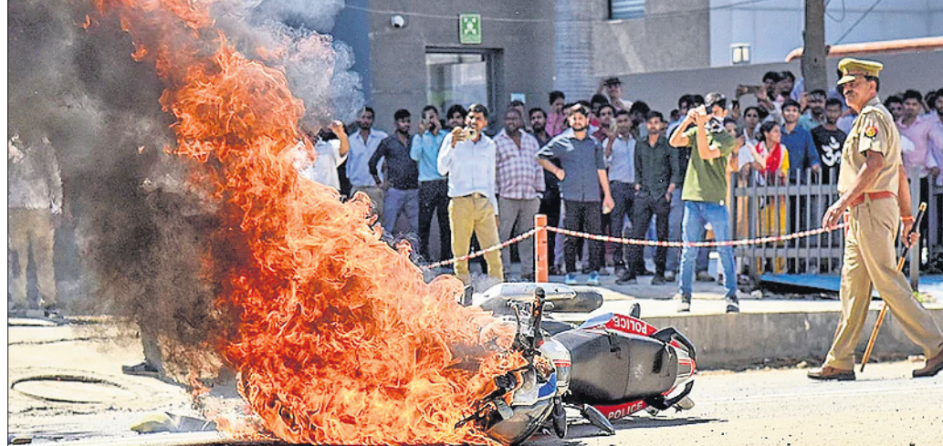
ନବଡ଼ାରେ ବିକ୍ଷୋଭକାରୀ ଫ୍ୟାକ୍ଟି କର୍ମଚାରୀମାନେ ଏକ ଗାଡ଼ି ଜାଳିଦେଇଛନ୍ତି।

କାର୍ ଯୋଡ଼ାକଳା, ରାସ୍ତା ଅବରୋଧ ଲୁହହୁଆ ବାଷ୍ପ ଛାଡ଼ି ମାତ୍ରାଧିକ କାର୍ଯ୍ୟାନୁଷ୍ଠାନ ଦେଲା ପୋଲିସ୍ ନବଡ଼ା/ନୂଆଦିଲ୍ଲୀ, ୧୩୪