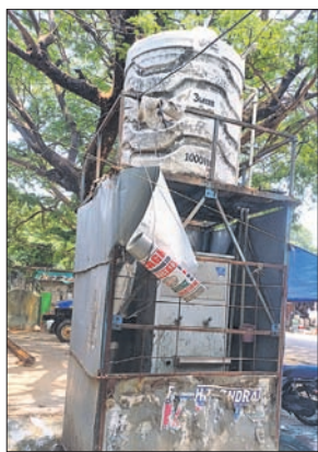
କୋରୁକୋଣ୍ଡା, ପୁରୁଣା ବସଷ୍ଟାଣ୍ଡ, ଗୁଆ ବସଷ୍ଟାଣ୍ଡରେ ଥଣ୍ଡା ପାନୀୟ ଜଳ ମେଣିନ ଅଟଳ କରୁଛନ୍ତି ।

ମାଲକାନଗିରି ଜିଲ୍ଲା ବାଲିମେଳା ବିଜ୍ଞାପିତ ଅଞ୍ଚଳ ପରିସର ପକ୍ଷରୁ ଉକ୍ତ ବର୍ଷ ପୂର୍ବେ ଲୋକଙ୍କୁ ବିଶୁଦ୍ଧ ଥଣ୍ଡା ପାନୀୟ ଯୋଗାଇ ଦେବା ପାଇଁ ବାଲିମେଳା ସହରର ଦୈନିକ ବଜାର ତଥା ପୁରୁଣା ବସଷ୍ଟାଣ୍ଡ, କାଳିକା, ଡ୍ରାଗ ଲାଇନ ଓ ଗୁଆ ବସଷ୍ଟାଣ୍ଡରେ ଲକ୍ଷାଧିକ ପାନୀୟ ଜଳ ମେଣିନ ଲାଗିଥିଲା ।