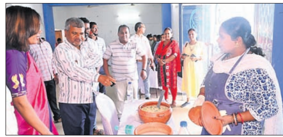
ଆମ ଭୂତି ଆମ ଖାଦ୍ୟ କାର୍ଯ୍ୟକ୍ରମରେ ଯୋଗଦାନ କରୁଛନ୍ତି ।

ମାଲକାନଗିରି, ୧୩୪ (ପୁଷ୍ପା ବାସ/ଗୌରୀଶଙ୍କର ପଣ୍ଡା) ମାଲକାନଗିରି ସଂସ୍କୃତି ଭବନ ପରିସରରେ ଆମ ଭୂତି ଆମ ଖାଦ୍ୟ କାର୍ଯ୍ୟକ୍ରମର ଆୟୋଜିତ ହୋଇଥିଲା ।