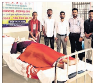
ସେବାଭାବ ଓ ସାମାଜିକ ଦାୟିତ୍ଵବାଦକୁ ଉତ୍ତମ ଉପାଧ୍ୟକ୍ଷଙ୍କୁ କରୁଛନ୍ତି ।

ପାଇଁ ଜିଲ୍ଲାପାଳ ବିଭାଗୀୟ ଅଧିକାରୀଙ୍କୁ ନିର୍ଦ୍ଦେଶ ଦେଇଥିଲେ ।