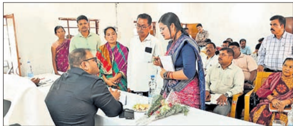
ଶିବିରରେ ଜିଲ୍ଲାପାଳ ପ୍ରଶାସନ ଅଧିକାରୀଙ୍କୁ କରୁଛନ୍ତି ।

ମାଲକାନଗିରି ଜିଲ୍ଲା ପ୍ରଶାସନ ପକ୍ଷରୁ ପଢ଼ିଆ ବ୍ଲକ୍ ଅଧୀନ ନିଲଗୁଡ଼ା ପଞ୍ଚାୟତ କାର୍ଯ୍ୟାଳୟ ପରିସରରେ ଏକ ଯୁକ୍ତ ଜନଶୁଣାଣୀ ଓ ଅଭିଯୋଗ ଶିବିର ଆୟୋଜନ କରାଯାଇଥିଲା ।