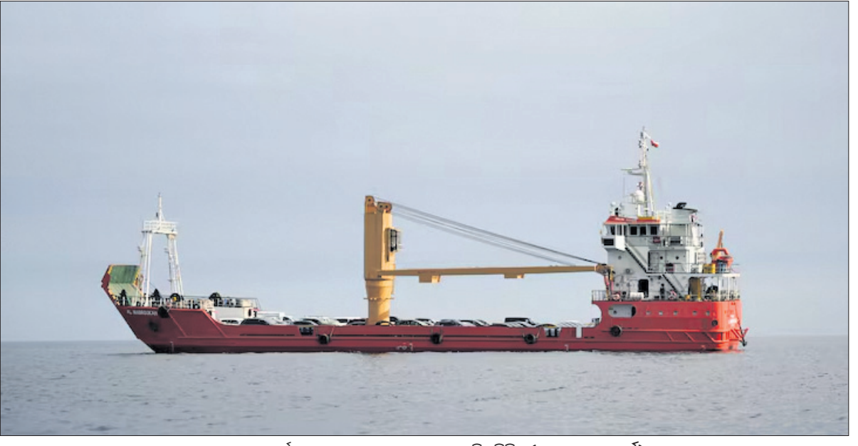
ଷ୍ଟେଟ୍ ଅଫ୍ ହର୍ମୁଜରେ ଓମାନର ଏକ ଜାହାଜ ଫସିରହିଛି ।

ଇସ୍ଲାମାବାଦରେ ୨୧ ଯଶ୍ୱିଆ ଆଲୋଚନାକୁ କୌଣସି ନିଷ୍ପତ୍ତି ନ ବାହାରିବା ପରେ ଆମେରିକା ଓ ଇରାନ ମଧ୍ୟରେ ପୁନଶ୍ଚ ସାମରିକ ଉତ୍ତେଜନା ବୃଦ୍ଧି ପାଇଛି। ଆମେରିକା ରାଷ୍ଟ୍ରପତି ଡୋନାଲ୍ଡ୍ ଟ୍ରମ୍ପ୍ ଓ ଆମେରିକୀୟ ସେନା ଷ୍ଟେଟ୍ ଅଫ୍ ହର୍ମୁଜ୍ ଏବଂ ଇରାନ ଉପକୂଳସ୍ଥିତ ସମସ୍ତ ବନ୍ଦର ବନ୍ଦ କରିଦେବାକୁ ଚେତାବନୀ ଦେଇଛନ୍ତି। ଇରାନ ଏହାର ଜବାବରେ ପାଇସ୍ୟ ଉପସାଗରୀୟ କ୍ଷେତ୍ର ଓ ଗଲ୍ଫ୍ ଅଫ୍ ଓମାନରେ ଥିବା ସବୁ ବନ୍ଦରକୁ ବନ୍ଦ କରିଦେବାକୁ ଧମକ ଦେଇଛି। ହର୍ମୁଜ୍ ପ୍ରଣାଳୀରେ ଛକାପଞ୍ଜା ସ୍ଥିତି ଲାଗି ରହିଥିବାରୁ ଅଗୋଧତ ଟେଲ ଓ ପ୍ରାକୃତିକ ବାଷ୍ପ ପରିବହନରେ ଅତ୍ୟଧିକ ପ୍ରଭାବ ହୋଇଛି। ଉଭୟ ଆମେରିକା ଓ ଇରାନ ଏବେ ହର୍ମୁଜ୍ରେ ଅବସ୍ଥାକୁ ଚାଲିଆସିଛନ୍ତି। ଫଳରେ କୁହ ଅବଲ୍ ମୂଲ୍ୟ ବ୍ୟାପକ ପିଛା ପୁଣି ୧୦୦ ଆମେରିକୀୟ ଡଲାର ଚଢ଼ିଛି।