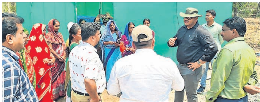
ଜିଲ୍ଲାପାଳ ଉତ୍ତମ ଉପାଧ୍ୟକ୍ଷଙ୍କୁ କରୁଛନ୍ତି ।