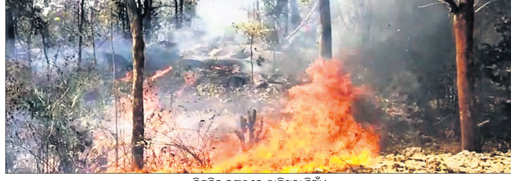
ବିପ୍ରତିହ ଜଙ୍ଗଲରେ ଲାଗିଥିବା ନିଆଁ।