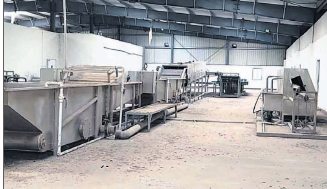
ଗୋବିନ୍ଦପୁରରେ ଥିବା ମ୍ୟାଗ୍ନେଟିକ୍ ହର୍ବ।

ଦେଢ଼ାମାଲ ଜିଲ୍ଲା ସଦର ବୁଦ୍ଧ ୫୫ମଂ ଜାତୀୟ ରାଜପଥର ଗୋବିନ୍ଦପୁର ନିକଟରେ ଥିବା ମ୍ୟାଗ୍ନେଟିକ୍ ହର୍ବ ସରକାର ଓ ଯତ୍ନାଳୟ ସହକାରୀତାରେ କାର୍ଯ୍ୟକ୍ରମ ହୋଇଛି। ଏହାକୁ ଚଳାଇବା ପାଇଁ ଭୁବନେଶ୍ୱରର କୋଲ୍ଡଚେନ୍ ସଲ୍ୟୁଶନ ସଂସ୍ଥା ୧୫ବର୍ଷ ପାଇଁ ସରକାରଙ୍କ ସହ ଚୁକ୍ତି କରିଥିବା ଜଣାପଡ଼ିଛି। ଦେଢ଼ାମାଲରେ ଆୟ ଚାଷୀଙ୍କୁ ପ୍ରୋତ୍ସାହିତ କରିବା ପାଇଁ ୨୦୧୧ରେ ଗୋବିନ୍ଦପୁରରେ ୧୧କୋଟି ଟଙ୍କା ବ୍ୟୟରେ ମ୍ୟାଗ୍ନେଟିକ୍ ହର୍ବ ଚଳାଇବା ପ୍ରକଳ୍ପ ଆରମ୍ଭ ହୋଇଥିଲା। ପରେ ୨୦୧୩ରେ ଏଠାରେ ଫଳ ପରିଚରଣ ସଂରକ୍ଷଣ ବ୍ୟବସ୍ଥା କରାଯାଇଥିଲା। କିନ୍ତୁ ପରିଚାଳନାଗତ ତ୍ରୁଟି ପାଇଁ ୨୦୧୫ରୁ ସମ୍ପୂର୍ଣ୍ଣ ବନ୍ଦହୋଇ ପରିଚରଣ ଅବସ୍ଥାରେ ପଡ଼ିରହିଥିଲା।