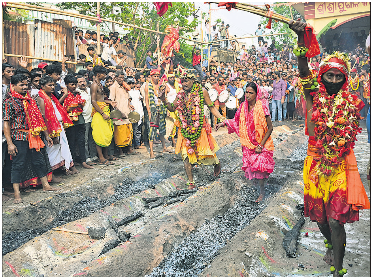
କଟକ ବକ୍ସିବଜାର ବଡ଼େଇ ସାହି ଶ୍ରୀ ଯୁଗଳ କିଶୋର ମନ୍ଦିର ପ୍ରାଙ୍ଗଣରେ ମଙ୍ଗଳବାର ଭକ୍ତମାନେ ଝାମ୍ବୁରେ ଚାଲୁଛନ୍ତି।

ବେଙ୍ଗ, ୧୪୪(ଏକେନ୍ସି) ପାକିସ୍ତାନ ମଧ୍ୟସ୍ଥଗରେ ଇସ୍ଲାମାବାଦରେ ୨୧ ଘଣ୍ଟିଆ ଶାନ୍ତି ଆଲୋଚନାରୁ ନିଷ୍ପତ୍ତି ନ ବାହାରିବାରୁ ଷ୍ଟେର୍ ଅଫ୍ ହର୍ମୁଜରେ ଆମେରିକା ଓ ଇରାନ ପୂର୍ଣ୍ଣ ପୂର୍ଣ୍ଣ ହୋଇଛନ୍ତି। ଆମେରିକୀୟ ନୌସେନା ଏହି ଜଳପଥ ଦେଇ ମଧ୍ୟପ୍ରାଚ୍ୟର ସମସ୍ତ ଇରାନୀୟ ବନ୍ଦରକୁ ବନ୍ଦ କରିଦେଇଥିବାବେଳେ ତେହରାନ ମଧ୍ୟ ଗଲ୍ଲୁ ଦେଶଗୁଡ଼ିକରେ ଥିବା ବନ୍ଦରଗୁଡ଼ିକୁ ବନ୍ଦ କରିବାକୁ ଚେତାବନୀ ଦେଇଛି। ଇତିମଧ୍ୟରେ ଆସନ୍ତା ସପ୍ତାହରେ ଚୁନର୍ବାର ଇସ୍ଲାମାବାଦ ଆଲୋଚନା ହେବ ବୋଲି ସଙ୍କେତ ମିଳିଛି। କିନ୍ତୁ ହର୍ମୁଜ ଦେଇ କୁହ୍ ଏବଂ ପ୍ରାକୃତିକ ବାଷ୍ପ ପରିବହନକାରୀ ଜାହାଜଗୁଡ଼ିକର ଚଳାଚଳ ବନ୍ଦ ରହିଛି।