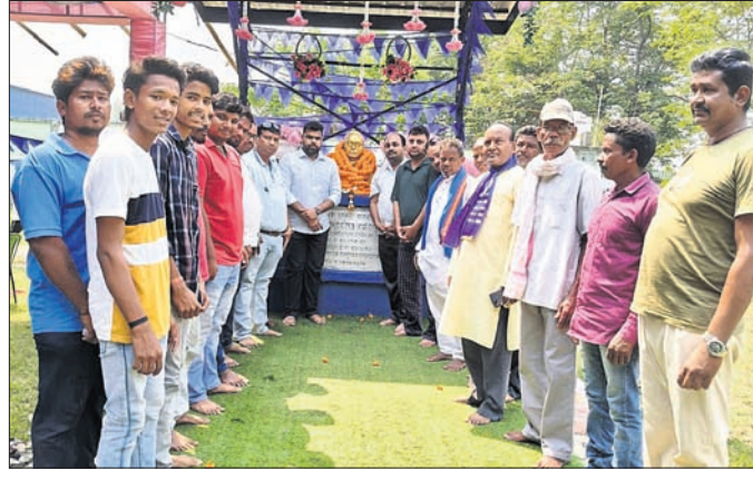
ଅନୁଗୋଳ, ୧୫୪୪