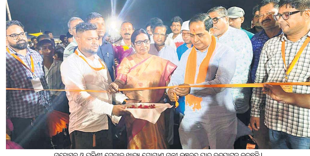
ମହୋତ୍ସବ ଓ ପଲିଶ୍ରୀ ମେଳାକୁ ଖାଦ୍ୟ ଯୋଗାଣ ମନ୍ତ୍ରୀ କୃଷ୍ଣଚନ୍ଦ୍ର ପାତ୍ର ଉଦ୍‌ଘାଟନ କରୁଛନ୍ତି ।