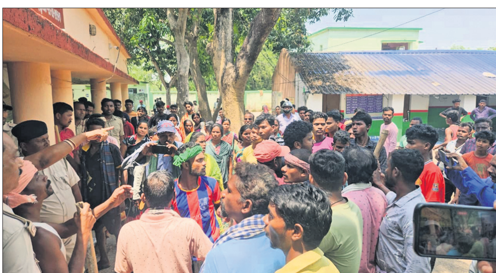
କାକବନ୍ଧ ଅନୁସୂଚିତ କାଳି ଓ ଜନକାଳି ଆଶ୍ରମ ସ୍କୁଲରେ ଅଭିଭାବକମାନେ ହୋହଲା କରୁଛନ୍ତି।