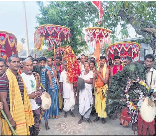
ମା' ମାହେଶ୍ୱରୀଙ୍କୁ ଶୋଭାଯାତ୍ରାରେ ନିଆଯାଉଛି।