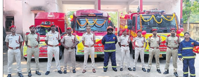
କାର୍ଯ୍ୟକ୍ରମରେ ଅଗ୍ନିଶମ ବାହିନୀର କର୍ମଚାରୀମାନେ ।

କୋରାପୁଟ ଜିଲା ଜୟପୁର ଅଗ୍ନିଶମ କେନ୍ଦ୍ର ପକ୍ଷରୁ ସଚେତନତା ଶୋଭାଯାତ୍ରା ମଙ୍ଗଳବାର ଅନୁଷ୍ଠିତ ହୋଇଛି । ୨୦ ଚାରିଶ ଯାଏ କାତାମ ଅଗ୍ନିଶମ ସୁରକ୍ଷା ସମ୍ମାନ ପାଇଁ କରାଯାଇଛି । ଲୋକେ ଅଗ୍ନିଶମ ସୁରକ୍ଷା ପାଇଁ ନେଇ ସଚେତନ କରାଯାଇଛି । ଗ୍ଲାମାରି ଅଗ୍ନିଶମ କେନ୍ଦ୍ରରୁ ସଚେତନତା ଶୋଭାଯାତ୍ରା ବାହାରି ସହର ପରିକ୍ରମା କରାଯାଇ ଲୋକଙ୍କୁ ସଚେତନ କରାଯାଇଛି । ପ୍ରାଥମିକ ଅବସ୍ଥାରେ ଅଗ୍ନିଶମକୁ ଆୟତ୍ତ କରି ଲୋକଙ୍କ କାମନା ରକ୍ଷା କରି ପରିବେଶକୁ ରକ୍ଷା କରିବେ । ସହକାରୀ ଅଗ୍ନିଶମ ଅଧିକାରୀ