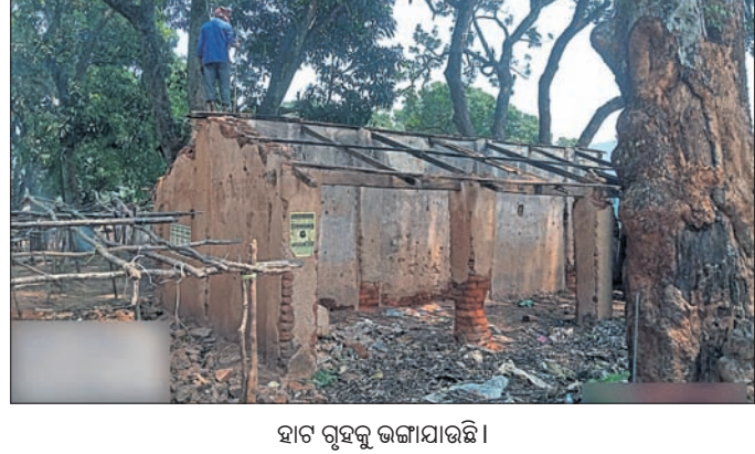
ହାଟ ଗୃହକୁ ଭାଙ୍ଗିଯାଇଛି ।

କାର୍ଯ୍ୟକ୍ରମରେ ଶିକ୍ଷକ ସଂସଦ ସଭାପତି ବାସ ପ୍ରଧାନ, ଆଞ୍ଚଳିକ ସାଧନ କେନ୍ଦ୍ର ସଂଯୋଜକ ମଧୁସୂଦନ ପାତ୍ର, ଶିକ୍ଷକ ଲଳିତ ସେଠ ପ୍ରମୁଖ ଯୋଗଦେଇଥିଲେ । ଓଡ଼ିଆ ଭାଷା ଓ ସଂସ୍କୃତିକୁ ବଜାୟ ରଖିବା ନେଇ ଅତିଥି କୁହାଯାଇଥିଲେ । ଏଥିସହ ଅଜ୍ଞାନତା କର୍ମୀଙ୍କ ଦ୍ୱାରା ପ୍ରସ୍ତୁତ ସୁସ୍ୱାଦ ଖାଦ୍ୟ, ପଣ୍ଡା ଓ ମହିଳାମାନଙ୍କ ମଧ୍ୟରେ ବିଭିନ୍ନ ପ୍ରତିଯୋଗିତା ଅନୁଷ୍ଠିତ ହୋଇଥିଲା । କୃତୀ ପ୍ରତିଯୋଗିତା ଅତିଥି ମାନପତ୍ର ସହ ପୁରସ୍କାର ଦେଇଥିଲେ ।