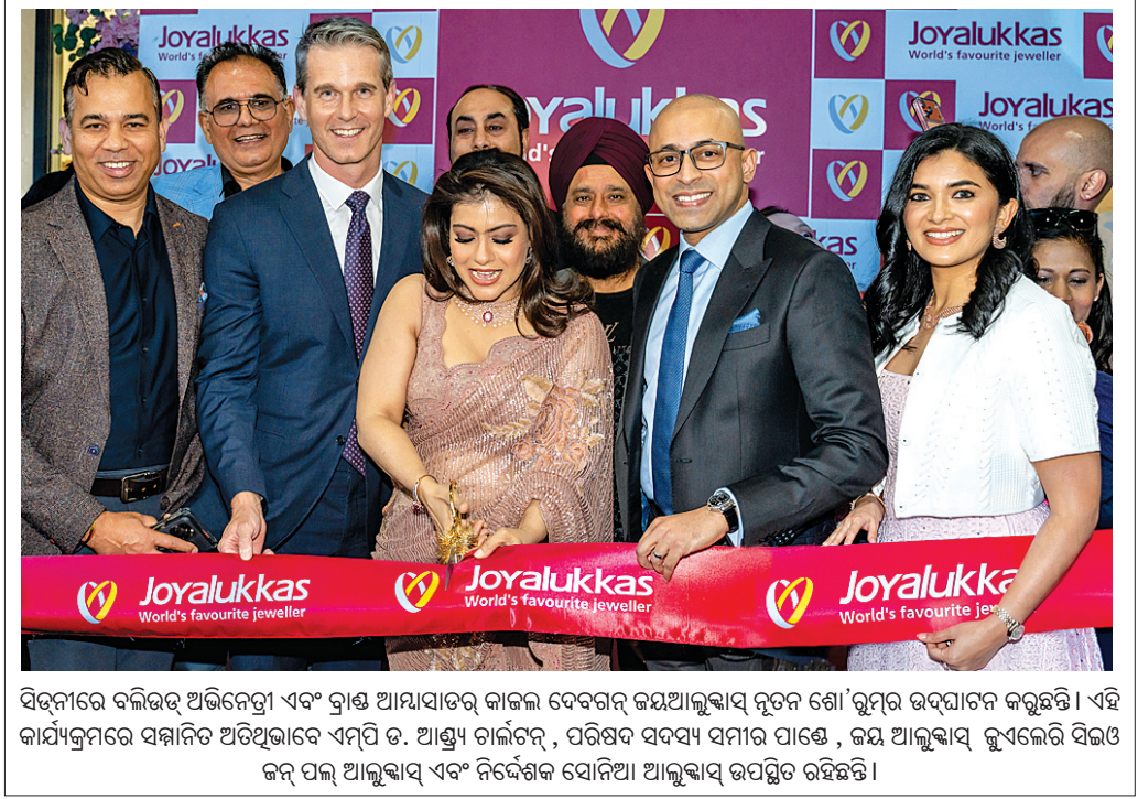
ବିକ୍ରମରେ ବଳିଭର ଅଭିନେତ୍ରୀ ଏବଂ ବ୍ରାଣ୍ଡ ଆୟାସାତ୍ମକ କାଳକ ଦେବତା କମ୍ପ୍ୟୁଟର ନୂତନ ଶୋ' ଲୁମ୍ପର ଉଦ୍ଘାଟନ କରୁଛନ୍ତି । ଏହି କାର୍ଯ୍ୟକ୍ରମରେ ସମ୍ମାନିତ ଅଭିନେତ୍ରୀ ଏବଂ ବ୍ରାଣ୍ଡ ଆୟାସାତ୍ମକ କାଳକ ଦେବତା କମ୍ପ୍ୟୁଟର ନୂତନ ଶୋ' ଲୁମ୍ପର ଉଦ୍ଘାଟନ କରୁଛନ୍ତି ।

କରିଥିବା କହିଛନ୍ତି । ଏହି ଫିଲ୍ମରେ ଅଭିନୟ କରିଥିବା ଅଭିନେତ୍ରୀ ଏବଂ ମୁଖ୍ୟ ଭୂମିକା ଧାରଣ କରିଛନ୍ତି । ଏହାଦ୍ୱାରା ବୈଶ୍ୱିକ ବାଣିଜ୍ୟ-ବ୍ୟବସାୟ ସମ୍ପର୍କ ଉତ୍ତମ ଏବଂ ଯୋଗାଣ ଶୃଙ୍ଖଳ ମାଗୁଥିବା ବ୍ୟାପାରୀଙ୍କୁ ସାମାଜିକ ଅର୍ଥନୀତି ଧାରା ପ୍ରତି ନିଜର ମୁଦ୍ ପ୍ରତିବଦ୍ଧତା ପ୍ରକାଶ କରିଛନ୍ତି ।