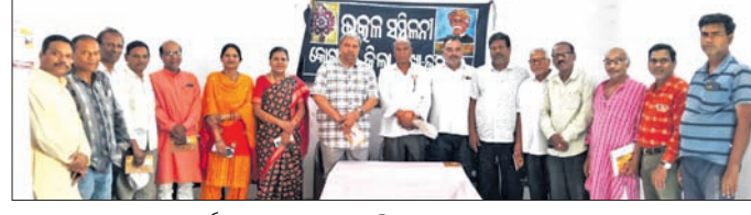
କାର୍ଯ୍ୟକ୍ରମରେ ଭକ୍ତ ସମ୍ମିଳନୀର ସଦସ୍ୟମାନେ ।

ଅନନ୍ତୋତ୍ତମ ପହଡ଼, ପୂଜା ବିଧି ଆଳତି ପରେ ପଣ୍ଡାଭୋଗ କରି ଶ୍ରଦ୍ଧାଳୁଙ୍କୁ ବନ୍ଧାଯାଇଥିଲା । ଜୟପୁର ରାଜୁ ସାହିତ୍ୟ ହନୁମାନ ମନ୍ଦିର, ରଜନଗରସ୍ଥିତ ରଘୁନାଥ ମନ୍ଦିର, ଓଏଲକମା ଛକ ସମେତ ଅନ୍ୟ ଅଞ୍ଚଳରେ ହନୁମାନ ମନ୍ଦିରରେ ଜୟନ୍ତୀ ପାଳିତ ହୋଇଛି । ଏହି ଅବସରରେ ଜୟପୁର ବୈଦିକ କଳାରେ ହନୁମାନଙ୍କ ସ୍ୱତନ୍ତ୍ର ପୂଜା କରାଯାଇଛି । ହନୁମାନଙ୍କ ନିକଟରେ ଦର୍ଶନମାନେ ପୂଜାର୍ଚ୍ଚନା କରିଥିଲେ । ମନ୍ଦିରକୁଡ଼ିକରେ ବିଭିନ୍ନ ସଙ୍ଗଠନ ପକ୍ଷରୁ ପଣ୍ଡା ବନ୍ଧନ କରାଯାଇଛି । ମନ୍ଦିରରେ ହୋମଯଜ୍ଞ, ହନୁମାନ ବାଜିଣା ପାଠ ହୋଇଥିଲା ।