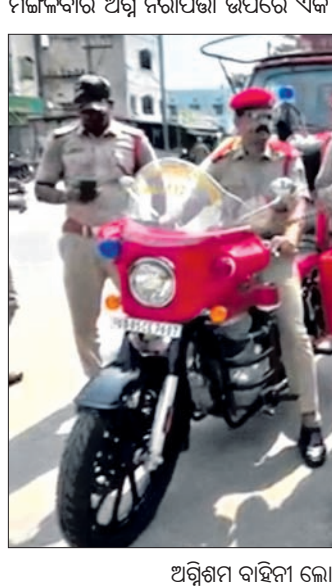
ଅଗ୍ନିଶମ ବାହିନୀ ଲୋକଙ୍କୁ ସଚେତନ କରୁଛନ୍ତି।

ସଚେତନତା ଶୋଭାଯାତ୍ରା ଆୟୋଜିତ ହୋଇଯାଇଛି। ଅଗ୍ନିକୁ ଲୋକଙ୍କୁ ରକ୍ଷା କରିବା ଓ ବିପଦ ସମୟରେ ସହଯୋଗ କରିବା ପାଇଁ ଲୋକଙ୍କୁ ସଚେତନତା ବାର୍ଦ୍ଧି