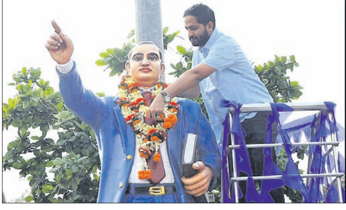
ଆୟେଡକରଙ୍କ ପ୍ରତିମୂର୍ତ୍ତିରେ ଜିଲାପାଳ ପୁଷ୍ପମାଳ୍ୟ ଅର୍ପଣ କରୁଛନ୍ତି।

ରାୟଗଡ଼ା/ଗୁଣପୁର, ୧୪୪ (ଆଶିଷ ରଞ୍ଜନ ପଣ୍ଡା/ ସଂକେତ ପାଠ)