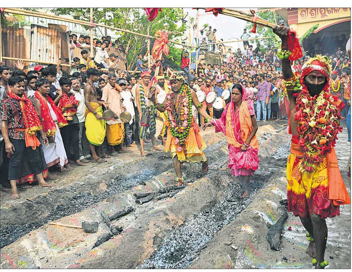
କଟକ ବକ୍ସିବଜାର ବଡ଼େଇ ସାହି ଶ୍ରୀ ଯୁଗଳ କିଶୋର ମନ୍ଦିର ପ୍ରାଙ୍ଗଣରେ ମଙ୍ଗଳବାର ଭକ୍ତମାନେ ଝାମୁରେ ଚାଲୁଛନ୍ତି।

ମହାସାଗରୀୟ ଅଞ୍ଚଳରେ ମାନବ ବିକାଶ ଜନିତ ଗାପ ବଢ଼ିବାରେ ଲାଗିଛି। ଏହା ଆଗକୁ ଆହୁରି ବ୍ୟାପକ ହୋଇପାରେ। ତୈଳ, ପରିବହନ, ଉତ୍ପାଦନ ଖର୍ଚ୍ଚ ବୃଦ୍ଧି ହେବୁ ଲୋକଙ୍କ କ୍ରୟ କ୍ଷମତା ହ୍ରାସ ପାଇବ। ଖାସ୍ତା ଅପୁରଣା ସୃଷ୍ଟିହେବା ସହ ଜୀବନଧାରଣ ମାନ ହ୍ରାସ ପାଇବ। ଏହିସବୁ କାରଣରୁ ବିଶ୍ୱର ୮.୮ ନିୟୁତ ଲୋକ ଦରିଦ୍ର ଭିତରକୁ ଠେଲିହୋଇଯିବେ ବୋଲି ଆକଳନ କରାଯାଇଛି। ପଶ୍ଚିମ ଏସିଆ ସାମରିକ ଉତ୍ତେଜନା ଏସିଆ-ପାସିଫିକ୍ ଅଞ୍ଚଳ ପାଇଁ ୨୨୯ ବିଲିୟନ୍ ଡଲାରର କ୍ଷତି ସୃଷ୍ଟି କରିପାରେ ବୋଲି ଏଥିରେ ଦର୍ଶାଯାଇଛି।