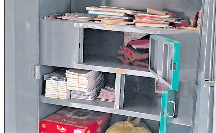
ମନ୍ଦିର ଛୁଣ୍ଡି ଭାଙ୍ଗି ଚୋରି କରାଯାଇଛି ।