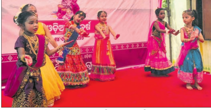
ପିଲାମାନେ ନୃତ୍ୟ ପରିବେଷଣ କରୁଛନ୍ତି।

ଗୁଣପୁର, ୧୪୪ (ସଂକେତ ପାଠ) ଓ ଶିଶୁମାନେ ଅଂଶଗ୍ରହଣକରି ନିଜ ନୃତ୍ୟ ପ୍ରତିଭା ପ୍ରଦର୍ଶନ କରିଥିଲେ। ଏହାସହ ଅବସରରେ ଗୁଣପୁର ପୌର ପରିଷଦ ପକ୍ଷରୁ ଏକ ସାଂସ୍କୃତିକ ଓ ସାମାଜିକ ପଣା ବନ୍ଧନ କରାଯାଇଥିଲା। ପଣା ବନ୍ଧନ ମାଧ୍ୟମରେ ଲୋକମାନଙ୍କ ମଧ୍ୟରେ ଭାଇତାଣା ଓ ସାମ୍ପ୍ରଦାୟିକ ସମ୍ପର୍କନର ବାର୍ଦ୍ଧି ପ୍ରଚାର କରାଯାଇଥିଲା।