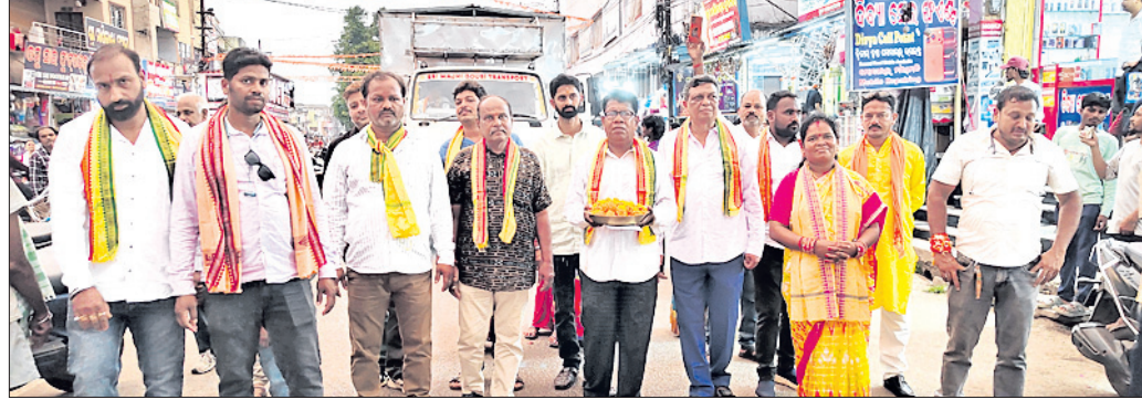
ଶୋଭାଯାତ୍ରାରେ ଅଜ୍ଞାନମାନଙ୍କୁ ନଗର ପରିକ୍ରମା କରାଯାଇଛି।

ରାୟଗଡ଼ା, ୧୪୪ (ଆଶିଷ ରଞ୍ଜନ ପଣ୍ଡା) ରାୟଗଡ଼ା ସହରରେ ମହାବିଷୁବ ସଂକ୍ରାନ୍ତି ହରୁମାନ ଜୟନ୍ତୀ ଓ ଓଡ଼ିଆ ନବବର୍ଷ ଧର୍ମାଧାରରେ ମଙ୍ଗଳବାର ପାଳିତ ହୋଇଯାଇଛି। ନବବର୍ଷ ଉପଲକ୍ଷେ ମଙ୍ଗଳବାର ଅପରାହ୍ଣରେ ଶ୍ରଦ୍ଧା ଶ୍ରୀକ୍ଷେତ୍ର ଶ୍ରୀ ଜଗନ୍ନାଥ ମନ୍ଦିରରେ ଠାକୁରଙ୍କୁ ପୂଜାର୍ଚ୍ଚନା ପରେ ଶୋଭାଯାତ୍ରାରେ ଆଜ୍ଞାନମାନଙ୍କୁ ନଗର ପରିକ୍ରମା କରାଯାଇ ମଞ୍ଚ ନିକଟରେ ପଞ୍ଜିକା ପଢ଼ାଯାଇଥିଲା। ଏହି ପରିପ୍ରେକ୍ଷାରେ ସହରର ସ୍ଥାନୀୟ ଅଂଶେକ