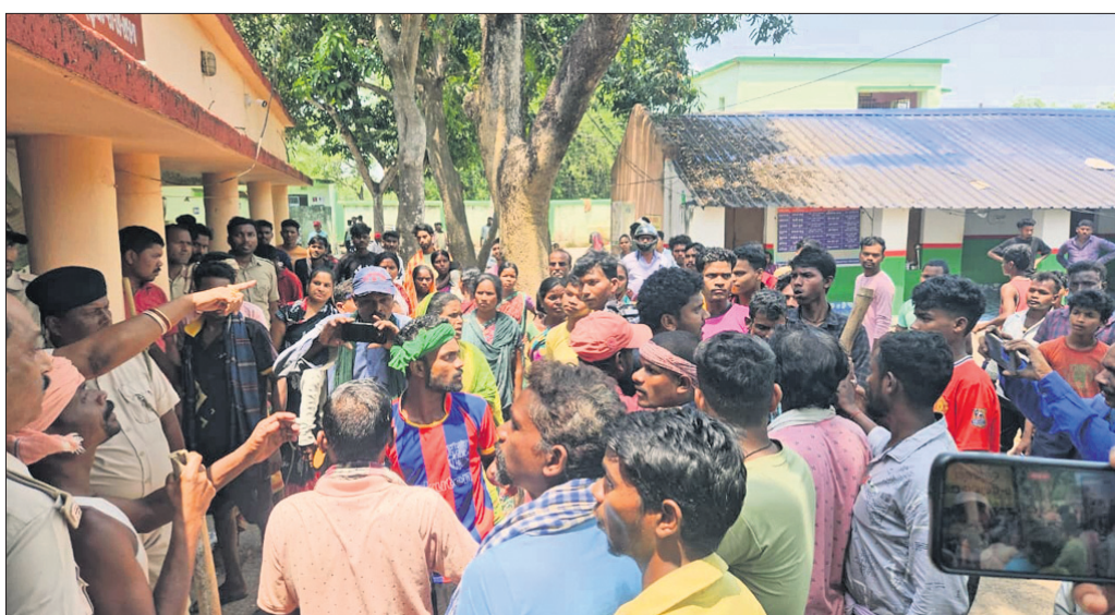
କାକବନ୍ଧ ଅନୁସୂଚିତ କାଳି ଓ ଜନକାଳି ଆଶ୍ରମ ସ୍କୁଲରେ ଅଭିଭାବକମାନେ ହୋହଲା କରୁଛନ୍ତି।