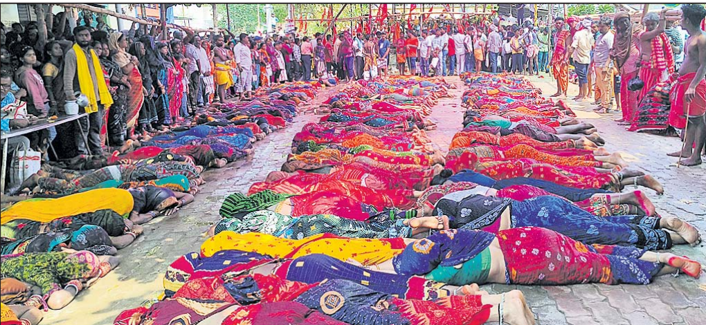
ପୁରୁଷୋତ୍ତମପୁରରେ ପୋଖରୀ ରୁଠରେ ମହିଳାମାନେ ଅଧିଆ ପଡ଼ିଛନ୍ତି ।