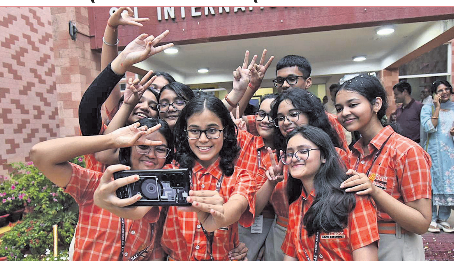
ସିବିଏସ୍‌ଇ ଦଶମ ଶ୍ରେଣୀ ପରୀକ୍ଷାଫଳ ରୁଧିରାଣୀ ପ୍ରକାଶ ପାଇବା ପରେ ଭୁବନେଶ୍ୱର ସାଇ ଇଣ୍ଟରନାଶନାଲ ସ୍କୁଲର ଛାତ୍ରାଛାତ୍ରୀମାନେ ଖୁସି ମନାଇ ସେଲ୍‌ଫି ଉଠାଇଛନ୍ତି।

କେନ୍ଦ୍ରୀୟ ମାଧ୍ୟମିକ ଶିକ୍ଷା ବୋର୍ଡ (ସିବିଏସ୍‌ଇ) ରୁଧିରାଣୀ ୨୦୨୨ର ଦଶମ ଶ୍ରେଣୀ ପରୀକ୍ଷା ଫଳ ପ୍ରକାଶ କରିଛି। ପ୍ରାୟ ୨୫ ଲକ୍ଷ ଛାତ୍ରାଛାତ୍ରୀ ପରୀକ୍ଷା ଦେଇଥିଲେ। ସାମଗ୍ରିକ ଭାବେ ୯୩.୭୦% ପିଲା କୃତକାର୍ଯ୍ୟ ହୋଇଛନ୍ତି। ଏଥର ମଧ୍ୟ ଝିଅମାନଙ୍କ ପାସ୍ ହାର ପୁଅଙ୍କ ତୁଳନାରେ ଅଧିକ ରହିଛି। ପିଲାମାନଙ୍କ ମଧ୍ୟରେ ଅନୁଚିତ ପ୍ରତିଯୋଗିତା ରୋକିବା ପାଇଁ ସିବିଏସ୍‌ଇ ପକ୍ଷରୁ କୌଣସି 'ଟପ୍‌ସ୍‌ଲିଷ୍ଟ' କିମ୍ବା 'ମେରିଟ୍‌ଲିଷ୍ଟ' କରି କରାଯାଇ ନାହିଁ। ତଥାପି ପ୍ରତି ବିଷୟରେ ସର୍ବାଧିକ ନମ୍ବର ରଖୁଥିବା ଶ୍ରେଣୀ ୦.୧% ଛାତ୍ରାଛାତ୍ରୀଙ୍କୁ ବୋର୍ଡ ପକ୍ଷରୁ 'ମେରିଟ୍‌ସ୍‌ଲିଷ୍ଟ' ପ୍ରଦାନ କରାଯାଉଛି। ଏହି ସର୍ବୋତ୍ତମ ଶ୍ରେଣୀର ଛାତ୍ରାଛାତ୍ରୀମାନଙ୍କୁ ଉପକ୍ରମରେ ଉପକ୍ରମ ହେବ। ଯେଉଁ ପିଲାମାନେ ନିଜ ମାର୍କରେ ସମସ୍ତ ନାହାନ୍ତି ଏବଂ ଏଥିରେ ଉଚ୍ଚତ ଆଶିରାଦ୍ରୁ ଚାହୁଁଛନ୍ତି, ସେମାନଙ୍କ ପାଇଁ ଦ୍ୱିତୀୟ ପର୍ଯ୍ୟାୟ ବୋର୍ଡ ପରୀକ୍ଷା ଆୟୋଜନ କରାଯାଉଛି। ଏହି ପରୀକ୍ଷା ଆସନ୍ତା ମେ ୧୫ରୁ ଆରମ୍ଭ ହେବାକୁ ଯାଉଛି। ଯେଉଁମାନେ କୌଣସି ବିଷୟରେ ଅନୁକ୍ରମାଣ୍ଡ ହୋଇଛନ୍ତି, ସେମାନଙ୍କ ପାଇଁ ଶୁଦ୍ଧାସ୍ତ୍ର ସମ୍ପୂର୍ଣ୍ଣମଧ୍ୟାରି ବା କମ୍ପାଉଣ୍ଡମଧ୍ୟାରି ପରୀକ୍ଷା ଆୟୋଜନ କରାଯାଉଛି। ପରୀକ୍ଷା ଫଳରେ ଭୁବନେଶ୍ୱର ରିଜିଅନ (ଓଡ଼ିଶା, ପଶ୍ଚିମବଙ୍ଗ ଏବଂ ଛତିଶଗଡ଼) ବେଶ୍ ଭଲ ପ୍ରଦର୍ଶନ କରିଛି, ଯାହାର ପାସ୍ ହାର ରହିଛି ୯୪.୬୭%। ଏହା କାଗାୟ ହାରାହାରି ପାସ୍ ପ୍ରତିଶତ (୯୩.୭୦%) ଠାରୁ ୦.୯୭% ଅଧିକ। ଦେଶର ସମସ୍ତ ସିବିଏସ୍‌ଇ ରିଜିଅନ ମଧ୍ୟରେ ଭୁବନେଶ୍ୱର ୧୧ଶ ସ୍ଥାନରେ ରହିଛି। ତେବେ ପୂର୍ବ ବର୍ଷ ଏଥର ମଧ୍ୟ ଉଚ୍ଚତମ (୯୯.୭୯%) ଏବଂ ବିକ୍ଷୟାଣୁ (୯୯.୭୯%) ସର୍ବୋଚ୍ଚ ସ୍ଥାନରେ ରହିଛନ୍ତି। କୌଣସି ଛାତ୍ରାଛାତ୍ରୀ ନିଜ ମାର୍କରେ ସମସ୍ତ ନ ଥିଲେ, ସେମାନେ ଗୁରୁବାରଠାରୁ ପୁନଃ ପରୀକ୍ଷା ଆବେଦନ କରିପାରିବେ।