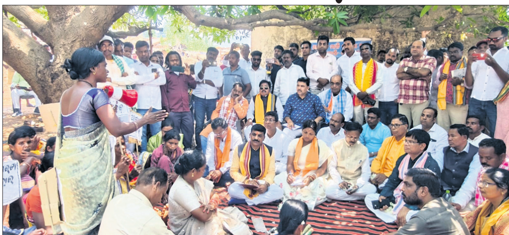
ରାୟଗଡ଼ା ଜିଲ୍ଲା କାଶୀପୁର ବ୍ଲକ କଞ୍ଚାଳ ଗ୍ରାମରେ ରୁଧିରା ଭାଜପା ଟିମ୍ ଲୋକଙ୍କ ମତ ସଂଗ୍ରହ କରୁଛନ୍ତି।