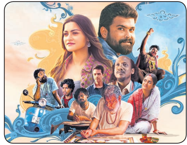
‘ବିନ୍ଦୁସାଗର’ ଫିଲ୍ମର ଏକ ପୋଷ୍ଟର