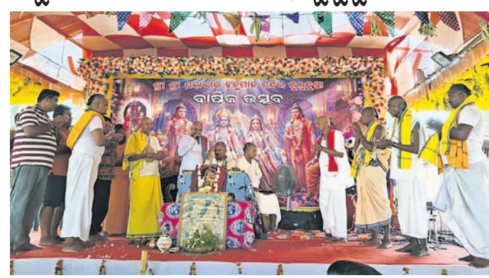
କାର୍ଯ୍ୟକ୍ରମରେ ଉପସ୍ଥିତ ସାଧୁସଭା।

ରୁଣପୁର, ୧୫.୪.୧୮ (ପୁଜାରୀ ପାଢ଼ୀ/ସଂକେତ ପାଢ଼ୀ)