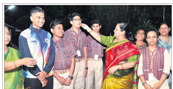
ଭୁବନେଶ୍ୱର ସୁନି-୮ ସ୍ଥିତ ଡିଏଲ୍ ସ୍କୁଲରେ ଜଣେ କୃତୀ ଛାତ୍ରୀଙ୍କୁ ଅଧ୍ୟକ୍ଷା ମିଠା ଖୁଆଉଛନ୍ତି।