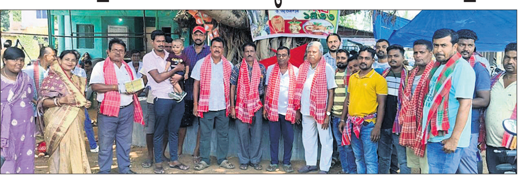
କାର୍ଯ୍ୟକ୍ରମରେ ବଙ୍ଗୀୟ ସମ୍ପ୍ରଦାୟମାନେ ।