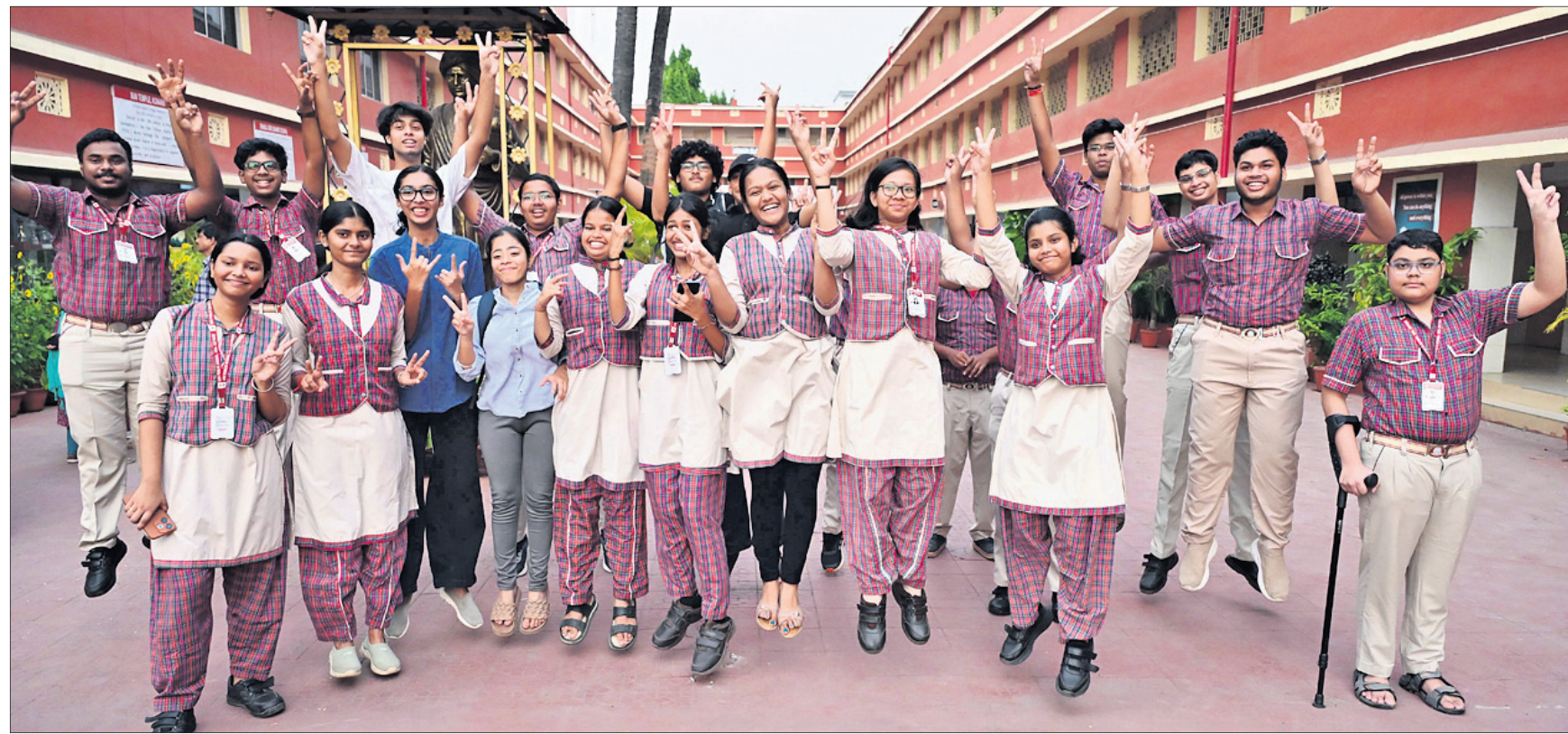
କଟକ ବିଦ୍ୟାଳୟର ଡିଏଲ୍ ସ୍କୁଲର ଛାତ୍ରଛାତ୍ରୀମାନେ ବିଦ୍ୟାଳୟ ଦଶମ ବୋର୍ଡ ପରୀକ୍ଷାରେ ସଫଳତା ପରେ ନାଚି ଖୁସି ମନାଉଛନ୍ତି।