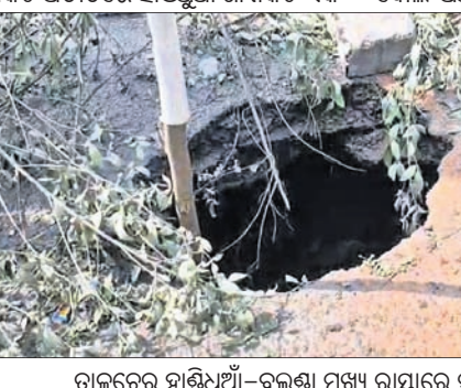
ତାଳଚେର ହାତ୍ତୀ-ବଳଶା ମୁଖ୍ୟ ରାସ୍ତାରେ ସୃଷ୍ଟି ହୋଇଥିବା ଗର୍ତ୍ତ।