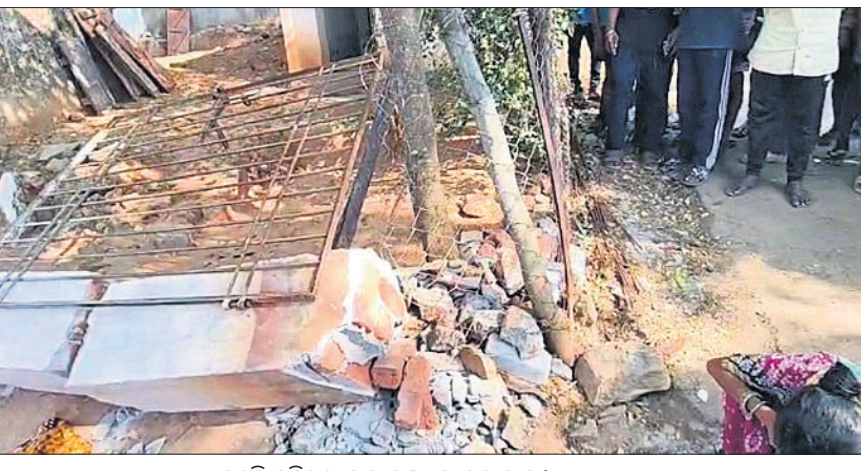
ଭୁଗୁଡ଼ି ପଡ଼ିଥିବା ସ୍କୁଲ ମୁଖ୍ୟ ପୀଡ଼ିତ କାଳ।