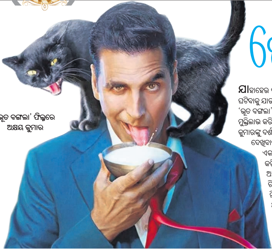
‘ଭୂତ ବଙ୍ଗଳା’ ଫିଲ୍ମରେ ଅକ୍ଷୟ କୁମାର