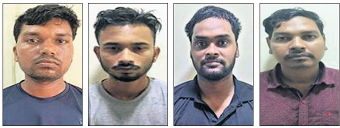
ଭୁବନେଶ୍ୱର, ୧୫୪(ପ୍ରସନ୍ନକିଶୋର ସାହୁ)

ଓଡିପି ଶୋୟାରୀ ଏବଂ ପାକିସ୍ତାନୀ ଏଜେଣ୍ଟଙ୍କ ସହ ସମ୍ପର୍କ ରଖିବା ଅଭିଯୋଗରେ ଭୁବନେଶ୍ୱର ଏସ୍ପିଜେଏମ୍ କୋର୍ଟ ରୁଧିରୀର ୭ ଜଣଙ୍କୁ ଦୋଷୀ ସାଧ୍ୟ କରାଇଛି। ମୋଟ ୫୬ ଦସ୍ତାବିଜ ଏବଂ ୧୧ ଜଣ ସାକ୍ଷାତ ସାକ୍ଷ୍ୟ ଆଧାରରେ କୋର୍ଟ ଏହି ଦଣ୍ଡାଦେଶ ଶୁଣାଇଛନ୍ତି। ଅଭିଯୁକ୍ତଙ୍କୁ ମୋଟ ୪୨୦ ଅନୁମାୟା ୩ ବର୍ଷ ଲେଖାଏଁ ଜେଲଦଣ୍ଡ ସହ ୩୨ ହଜାର ଟଙ୍କା ଜରିମାନା ହୋଇଛି। ପୁରନାଯୋଗ୍ୟ, ୨୦୨୩ ମସିହା ୧୧ରେ କ୍ରାଇମ୍‌ସ୍‌ଟ୍ରାଷ୍ଟର ଏସ୍ପିଜେଏମ୍ କୋର୍ଟ ଓଡିପି ଶୋୟାରୀ ସହ ପୁଲ୍‌ପୁଲ୍ ପ୍ର-ଆକ୍ଟିଭେଟେଡ୍ ସିମ୍‌କାର୍ଡ ମାଧ୍ୟମରେ ଗୁରୁତ୍ୱପୂର୍ଣ୍ଣ ତଥ୍ୟ ଲିକ୍ ଘଟଣା ଜାଣିବାକୁ ପାଇଥିଲା। ଏନେଇ ୧୨ ତାରିଖରେ ରାଜ୍ୟର ବିଭିନ୍ନ ସ୍ଥାନରୁ ୫ ଜଣ ଏବଂ ରାଜ୍ୟ ବାହାରରୁ ୨ ଅଭିଯୁକ୍ତଙ୍କୁ