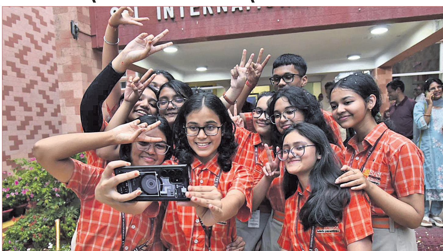
ସିବିଏସ୍‌ଇ ଦଶମ ଶ୍ରେଣୀ ପରୀକ୍ଷାଫଳ ରୁଧିରୀ ପ୍ରକାଶ ପାଇବା ପରେ ଭୁବନେଶ୍ୱର ସ୍କୁଲ ଛାତ୍ରଛାତ୍ରୀମାନେ ଖୁସି ମନାଳି ସେଲ୍‌ଫି ଉଠାଇଛନ୍ତି।

କେନ୍ଦ୍ରୀୟ ମାଧ୍ୟମିକ ଶିକ୍ଷା ବୋର୍ଡ (ସିବିଏସ୍‌ଇ) ରୁଧିରୀ ୨୦୨୨ର ଦଶମ ଶ୍ରେଣୀ ପରୀକ୍ଷା ଫଳ ପ୍ରକାଶ କରିଛି। ପ୍ରାୟ ୨୫ ଲକ୍ଷ ଛାତ୍ରଛାତ୍ରୀ ପରୀକ୍ଷା ଦେଇଥିଲେ। ସାମଗ୍ରିକ ଭାବେ ୯୩.୭୦% ପିଲା କୃତକାର୍ଯ୍ୟ ହୋଇଛନ୍ତି। ଏଥର ମଧ୍ୟ ଝିଅମାନଙ୍କ ପାସ୍ ହାର ପୁଅଙ୍କ ତୁଳନାରେ ଅଧିକ ରହିଛି। ପିଲାମାନଙ୍କ ମଧ୍ୟରେ ଅନୁଚିତ ପ୍ରତିଯୋଗିତା ବୋଧିବା ପାଇଁ ସିବିଏସ୍‌ଇ ପକ୍ଷରୁ କୌଣସି 'ଟପ୍‌ସ୍‌ଲିଷ୍ଟ' କିମ୍ବା 'ମେରିଟ୍‌ଲିଷ୍ଟ' କାରି କରାଯାଇ ନାହିଁ। ତଥାପି ପ୍ରତି ବିଷୟରେ ସର୍ବାଧିକ ନମ୍ବର ରଖିଥିବା ଶ୍ରେଣୀ ୦.୧% ଛାତ୍ରଛାତ୍ରୀଙ୍କୁ ବୋର୍ଡ ପକ୍ଷରୁ 'ମେରିଟ୍ ସାର୍ଟିଫିକେଟ' ପ୍ରଦାନ କରାଯିବ। ଏହି ସାର୍ଟିଫିକେଟଗୁଡ଼ିକ ଡିଜିଟାଲ ମାଧ୍ୟମରେ ଉପଲବ୍ଧ ହେବ। ଯେଉଁ ପିଲାମାନେ ନିଜ ମାର୍କରେ ସମ୍ପୂର୍ଣ୍ଣ ନାହାନ୍ତି ଏବଂ ଏଥିରେ ଉଚ୍ଚତ ଆଶିରାଦ୍ରୁ ଚାହୁଁଛନ୍ତି, ସେମାନଙ୍କ ପାଇଁ ଦ୍ୱିତୀୟ ପର୍ଯ୍ୟାୟ ବୋର୍ଡ ପରୀକ୍ଷା ଆୟୋଜନ କରାଯିବ। ଏହି ପରୀକ୍ଷା ଆସନ୍ତା ମେ ୧୫ରୁ ଆରମ୍ଭ ହେବାକୁ ଯାଉଛି। ଯେଉଁମାନେ କୌଣସି ବିଷୟରେ ଅନୁକାର୍ଯ୍ୟ ହୋଇଛନ୍ତି, ସେମାନଙ୍କ ପାଇଁ ଖୁବ୍‌ଶୀଘ୍ର ସମ୍ପୂର୍ଣ୍ଣମଧ୍ୟାରି ବା କମ୍ପାଉଣ୍ଡମଧ୍ୟାରି ପରୀକ୍ଷା ଆୟୋଜନ କରାଯିବ। ପରୀକ୍ଷା ଫଳରେ ଭୁବନେଶ୍ୱର ରିଜିଅନ (ଓଡ଼ିଶା, ପଶ୍ଚିମବଙ୍ଗ ଏବଂ ଛତିଶଗଡ଼) ବେଶ୍ ଭଲ ପ୍ରଦର୍ଶନ କରିଛି, ଯାହାର ପାସ୍ ହାର ରହିଛି ୯୪.୬୭%। ଏହା କାଗାୟ ହାରାହାରି ପାସ୍ ପ୍ରତିଶତ (୯୩.୭୦%) ଠାରୁ ୦.୯୭% ଅଧିକ। ଦେଶର ସମସ୍ତ ସିବିଏସ୍‌ଇ ରିଜିଅନ ମଧ୍ୟରେ ଭୁବନେଶ୍ୱର ୧୧ଶ ସ୍ଥାନରେ ରହିଛି। ତେବେ ପୂର୍ବ ବର୍ଷ ଏଥର ମଧ୍ୟ ତୁଳନାତ୍ମକ (୯୯.୭୯%) ଏବଂ ବିଜୟାପୁର (୯୯.୭୯%) ସର୍ବୋଚ୍ଚ ସ୍ଥାନରେ ରହିଛନ୍ତି। କୌଣସି ଛାତ୍ରଛାତ୍ରୀ ନିଜ ମାର୍କରେ ସମ୍ପୂର୍ଣ୍ଣ ନ ଥିଲେ, ସେମାନେ ଗୁରୁବାରଠାରୁ ପୁନଃ ପରୀକ୍ଷା ଆବେଦନ କରିପାରିବେ।