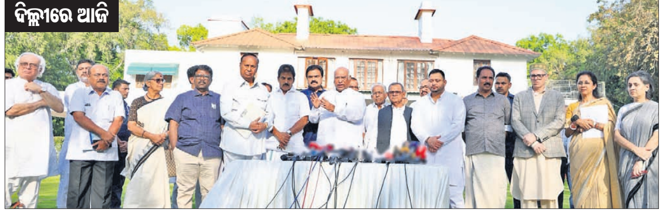
ବିରୋଧୀ ଦଳଗୁଡ଼ିକ ପକ୍ଷରୁ ରୁଧିବାର କଂଗ୍ରେସ ଅଧକ୍ଷ ମଲ୍ଲିକାର୍ଜୁନ ଖାର୍ଯ୍ୟେଙ୍କ ନୂଆଦିଲ୍ଲୀସ୍ଥିତ ବାସଭବନରେ ବିଠକ ପରେ ଖବରଦାତାମାନଙ୍କୁ ସୂଚନା ଦିଆଯାଇଛି।

ଏପ୍ରିଲ ୧୬ରେ ଆରମ୍ଭ ହେବାକୁ ଥିବା ବର୍ଷିତ ବଜେଟ ଅଧିବେଶନରେ କେନ୍ଦ୍ର ସରକାର ମହିଳାଙ୍କୁ ୩୩% ସଂରକ୍ଷଣ ସଂଗ୍ରାହ ନାବା ଶକ୍ତି ବନ୍ଦନ ଅଧିକାରରେ ସଂଶୋଧନ ଆଣିବାକୁ ଯାଉଛନ୍ତି। ମହିଳା ସଂରକ୍ଷଣ ସଂଶୋଧନ ବିଧେୟକ ୨୦୨୩ ସେପ୍ଟେମ୍ବରରେ ସଂସଦରେ ପାରିତ ହୋଇଥିବାବେଳେ ୨୦୨୯ ଲୋକ ସଭା ନିର୍ବାଚନ ପୂର୍ବରୁ ଏହାକୁ କାର୍ଯ୍ୟକାରୀ କରାଯିବା ପାଇଁ ସମିଧାନରେ ସଂଶୋଧନ ଆଣିବାକୁ ପଡୁଛି। ଏଥିସହ ଲୋକ ସଭାରେ ବର୍ତ୍ତମାନ ୫୪୩ ଆସନ ରହିଥିବାବେଳେ ଏହାକୁ ୮୫୦କୁ ବୃଦ୍ଧି କରାଯିବାକୁ ସରକାର ପ୍ରସ୍ତାବ ରଖିଛନ୍ତି। ଏହାକୁ ସ୍ୱୀକୃତ ରୂପ ଦେବା ପାଇଁ ୨୦୧୧ ଜନଗଣନା ତଥ୍ୟ ଆଧାରରେ ନିର୍ବାଚନମଣ୍ଡଳ ସାମା ପୁନଃ ନିର୍ଦ୍ଧାରଣ (ଡିଲିମିଟେଶନ୍) କରାଯିବ। ଏଥିନିମନ୍ତେ ସରକାର ସମିଧାନ ସଂଶୋଧନ କରିବାକୁ ଯାଉଛନ୍ତି। ତେବେ ବିରୋଧୀ ଦଳଗୁଡ଼ିକ ଉକ୍ତ ବିଲ୍ ବିରୋଧରେ ଭୋଟ ଦେବେ ବୋଲି ରୁଧିବାର ଘୋଷଣା କରିଛନ୍ତି। କଂଗ୍ରେସ ଅଧକ୍ଷ ତଥା ରାଜ୍ୟ ସଭାର ବିରୋଧୀ ଦଳ ନେତା ମଲ୍ଲିକାର୍ଜୁନ ଖାର୍ଯ୍ୟେଙ୍କ ବାସଭବନରେ ବିରୋଧୀ ଦଳଗୁଡ଼ିକ ପକ୍ଷରୁ ଏନେଇ ରଣନୀତି ସ୍ଥିର କରାଯାଇଛି। ସେହିପରି ଡିଲିମିଟେଶନ୍ ଯୋଗୁ ଦକ୍ଷିଣ ଭାରତୀୟ ରାଜ୍ୟଗୁଡ଼ିକ ଲୋକ ସଭାରେ କମ୍ ଆସନ ପାଇବେ ଏବଂ ଆନୁପାତିକ ଦୃଷ୍ଟିରୁ ଉପଯୁକ୍ତ ପ୍ରତିନିଧିତ୍ୱ ବହୁତ ହେବେ ବୋଲି ଆଶଙ୍କା କରୁଛନ୍ତି। ତେଣୁ ଡିଲିମିଟେଶନ୍, କେନ୍ଦ୍ର, କର୍ମଚକ, ତେଜସୀନା ଭଳି ଅଣଭାଙ୍ଗି ପାରିଲାନାହିଁ ପୁଞ୍ଜ୍ୟମନ୍ତ୍ରୀ ଏମ୍.କେ. ଷ୍ଟାଲିନ୍ ପ୍ରସ୍ତାବିତ ଡିଲିମିଟେଶନ୍ ପ୍ରକ୍ରିୟା ପ୍ରତିବାଦରେ ଗୁରୁବାର ରାଜ୍ୟବ୍ୟାପୀ 'କଳାପତାକା ବିକ୍ଷୋଭ' କରିବାକୁ ଘୋଷଣା କରିଛନ୍ତି। କେନ୍ଦ୍ର ସରକାର ଡିଲିମିଟେଶନ୍ ସ୍ତର ନ ଶୁଣିଲେ ବହୁମୁଖ୍ୟ ଦେବେ ବୋଲି ଷ୍ଟାଲିନ୍ ରୁଧିବାର ଘୋଷଣା କରୁଛନ୍ତି।