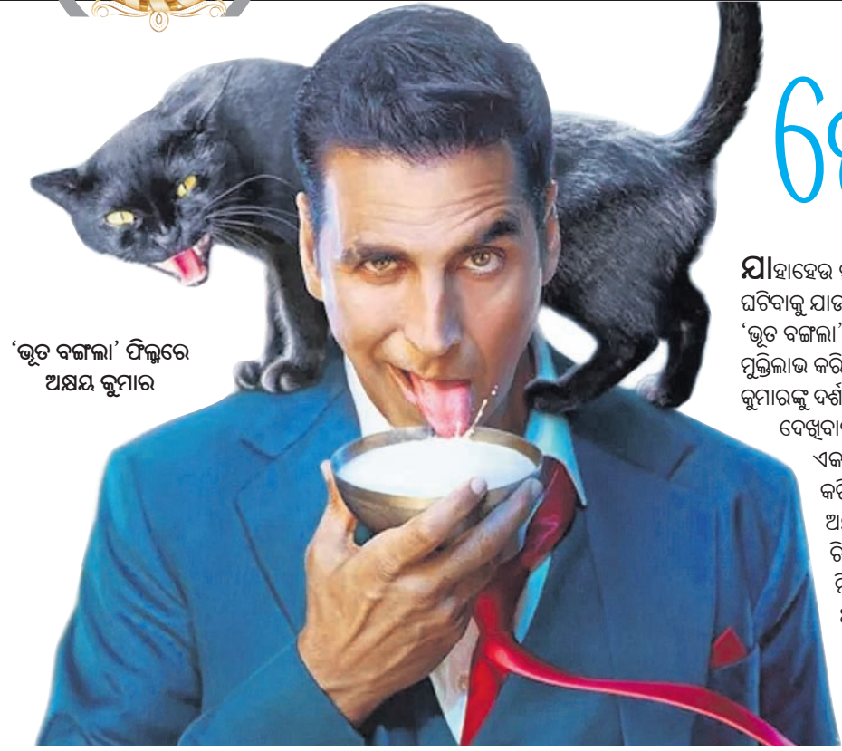
‘ଭୂତ ବଙ୍ଗଳା’ ଫିଲ୍ମରେ ଅକ୍ଷୟ କୁମାର