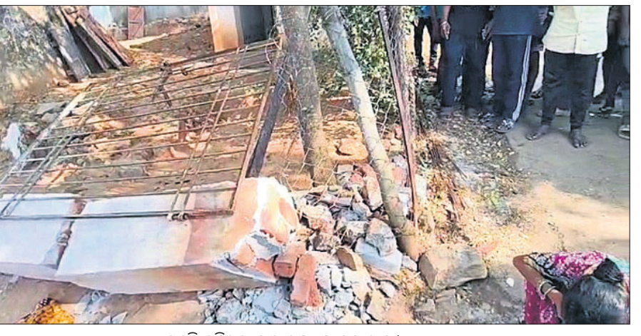
ଭୁଣ୍ଡୁଡ଼ି ପଡ଼ିଥିବା ସ୍କୁଲ ମୁଖ୍ୟ ପୀଠକ କାଢ଼।