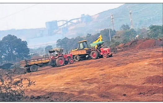
କେସିବି, ଗ୍ରାହକ ଯୋଗେ ଜବତ ଖଣିଜ ରୁଧିରୀର ବୋରାଚାଲାଇ ହେଉଛି।

କେନ୍ଦ୍ରରେ ଜିଲା ଯୋଡ଼ା ସହର ଉପକଣ୍ଠ ବାଂଶପାଣିଠାରେ ଜବତ ହୋଇ ଜମା ରହିଥିବା ଖଣିଜ ରୁଧିରୀର ସ୍ଥାନାନ୍ତର ହେଉଛି। ଏ ନେଇ ଅନୁମତି ନ ଥିବା ଖଣି ବିଭାଗ ପକ୍ଷରୁ ପୁରନା ମିଳିଥିବା ବେଳେ କିପରି ପରିବହନ ହେଉଛି ତାହା ପ୍ରଶ୍ନବାଚୀ ସୃଷ୍ଟି କରିଛି। ବିନା ଅନୁମତିରେ ଜବତ ଖଣିଜ ସ୍ଥାନାନ୍ତର ଓ ବ୍ୟବହାର କରାଯାଇପାରିବ ନାହିଁ ବୋଲି ନିୟମ ଥିବା ବେଳେ କିପରି ଏଭଳି ଅନିୟମିତତା ହେଉଛି। ଏହା ବାଂଶପାଣି ଖୁଣ୍ଟ ପାଣି ଅଞ୍ଚଳର ଲୋକଙ୍କୁ ସନ୍ଦେହରେ ରଖିଛି। ପ୍ରକାଶ ଯେ, ଦାବିକାର ନ ଥିବା ଏହି ଉନତମାନର ଖଣିଜକୁ ପୋଲିସ୍ ଏବଂ ଖଣି ବିଭାଗ ଜବତ କରିଥିଲା। ବହୁ ବର୍ଷରୁ ବାଂଶପାଣିଠାରେ ପଡ଼ିଥିବା ଏହି ଖଣିଜକୁ ଓଏମ୍‌ସି ଜରିଆରେ ନିଲାମ କରା ନ ଯାଇ ପରିଚ୍ୟୁତ