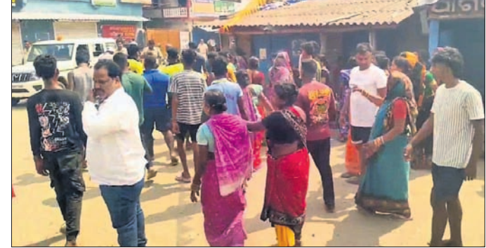
ଆନନ୍ଦପୁର, ୧୫୪ (ପୁଣ୍ୟାତ୍ମ କୁମାର ସାହୁ)

କେନ୍ଦ୍ରରେ ଜିଲା ଆନନ୍ଦପୁର ଉପଖଣ୍ଡ ଉପରାଜ୍ୟ ଥାନା ଅନ୍ତର୍ଗତ କେଶପୁରାପାଳ ଗାଁରେ କଣ୍ଟାଫୋଡ଼ା ଯାତ୍ରାରେ ମଙ୍ଗଳବାର ଗୋଷ୍ଠୀ ସଂଘର୍ଷ ହୋଇଛି। ତିଜେ ବଜା ଶୋଭାଯାତ୍ରାକୁ ନେଇ ଉପର ସାହି ଓ ତନ ସାହି ମଧ୍ୟରେ ମାରପିଟ ହୋଇଥିଲା। ଘଟଣାକୁ ନେଇ ରୁଧିରୀ ଗାଁରେ ରକ୍ତାକ୍ତ ସଂଘର୍ଷ ହୋଇଥିଲା। ଏଥିରେ ୧୫ରୁ ଊର୍ଦ୍ଧ୍ୱ ଆହତ ହୋଇଥିବା ଜଣାପଡ଼ିଛି। ଦୀର୍ଘ ସମୟ ଧରି ଗ୍ରାମରେ ଉଭେଇନା ଲାଗି ରହିଥିଲା। ପୁରନା ପୁରାବଳ, କେଶପୁରାପାଳ ଗ୍ରାମରେ ମଙ୍ଗଳବାର ଚଳିତ ପର୍ବ ଅବସରରେ କଣ୍ଟାଫୋଡ଼ା ଯାତ୍ରା ଅନୁଷ୍ଠିତ ହୋଇଥିଲା। ରାତିରେ ଉପର ସାହି