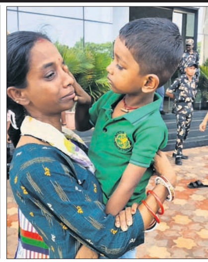
ବିଏମ୍‌ସି ପୁଖ୍ୟାଳୟ ସମ୍ମୁଖରେ ଉଚ୍ଛେଦ ବସ୍ତି ବାସିନ୍ଦା ଧାରଣାରେ ବସିଛନ୍ତି । ଘର ହରାଇ କାନ୍ଦୁଥିବା ଜଣେ ମହିଳାଙ୍କ ଆଖୁରୁ ଚାକ ପୁଅ ଲୁହ ପୋଛୁଛି ।

ଭୁବନେଶ୍ୱର, ୧୫୪ (ବନ୍ଦନା ସେଠୀ) ଖୁବ୍ ନି:ମାଃ ଅନ୍ତର୍ଗତ ଶାନ୍ତିପଲ୍ଲୀ ବସ୍ତିକୁ ଏପ୍ରିଲ ୪ରେ ବିଏମ୍‌ସି ପକ୍ଷରୁ ଉଚ୍ଛେଦ କରାଯାଇଥିଲା । ବର୍ଷ ବର୍ଷ ଧରି ଏଠାରେ ବସବାସ କରୁଥିବା ପ୍ରାୟ ୯୦ଟି ପରିବାରକୁ ଉଚ୍ଛେଦ କରାଯାଇଥିଲା । ଏମାନଙ୍କ ମଧ୍ୟରୁ ୨୫ ଜଣଙ୍କୁ କେଶରୀ ରେସିଡେନ୍ସିଆଲ ନିର୍ମିତ ଆଧିକାରରେ ଉପାଧି ଦିଆଯାଇଥିଲା ।