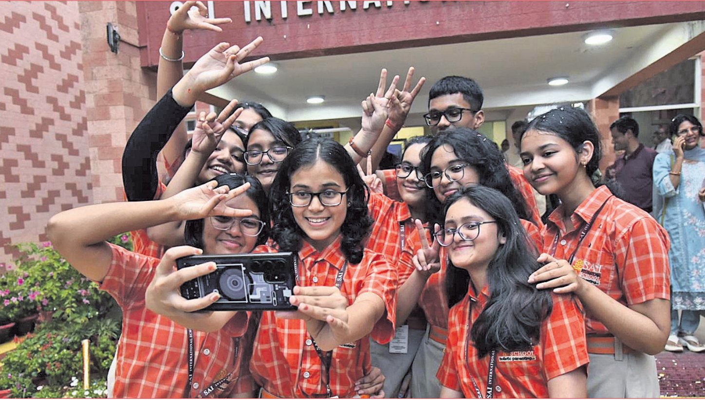
ସିବିଏସ୍‌ଇ ଦଶମ ଶ୍ରେଣୀ ପରୀକ୍ଷାଫଳ ଗ୍ରହଣ ପରେ ଭୁବନେଶ୍ୱର ସାଲ ଇଣ୍ଟରନାଶନାଲ ସ୍କୁଲର ଛାତ୍ରାଛାତ୍ରୀମାନେ ଖୁସି ମନାଇ ସେଲଫି ଉଠାଇଛନ୍ତି। (ଫଟୋ-ବିକାଶ ନାୟକ)

କେନ୍ଦ୍ରୀୟ ମାଧ୍ୟମିକ ଶିକ୍ଷା ବୋର୍ଡ (ସିବିଏସ୍‌ଇ) ରୁଧିରାଣୀ ୨୦୨୨ର ଦଶମ ଶ୍ରେଣୀ ପରୀକ୍ଷା ଫଳ ପ୍ରକାଶ କରିଛି। ପ୍ରାୟ ୨୫ ଲକ୍ଷ ଛାତ୍ରାଛାତ୍ରୀ ପରୀକ୍ଷା ଦେଇଥିଲେ। ସାମଗ୍ରିକ ଭାବେ ୯୩.୭୦% ପିଲା କୃତକାର୍ଯ୍ୟ ହୋଇଛନ୍ତି। ଏଥର ମଧ୍ୟ ଝିଅମାନଙ୍କ ପାସ୍ ହାର ପୁଅଙ୍କ ତୁଳନାରେ ଅଧିକ ରହିଛି। ପିଲାମାନଙ୍କ ମଧ୍ୟରେ ଅନୁଚିତ ପ୍ରତିଯୋଗିତା ବୋଧିବା ପାଇଁ ସିବିଏସ୍‌ଇ ପକ୍ଷରୁ କୌଣସି 'ଟପ୍‌ସ୍‌ଲିଷ୍ଟ' କିମ୍ବା 'ମେରିଟ୍‌ଲିଷ୍ଟ' କରି କରାଯାଇ ନାହିଁ। ତଥାପି ପ୍ରତି ବିଷୟରେ ସର୍ବାଧିକ ନମ୍ବର ରଖୁଥିବା ଶ୍ରେଣୀ ୦.୧% ଛାତ୍ରାଛାତ୍ରୀଙ୍କୁ ବୋର୍ଡ ପକ୍ଷରୁ 'ମେରିଟ୍ ସାର୍ଟିଫିକେଟ୍' ପ୍ରଦାନ କରାଯିବ। ଏହି ସାର୍ଟିଫିକେଟ୍‌ଗୁଡ଼ିକ ଡିଜିଟାଲ ମାଧ୍ୟମରେ ଉପଲବ୍ଧ ହେବ। ଯେଉଁ ପିଲାମାନେ ନିଜ ମାର୍କରେ ସମ୍ପୂର୍ଣ୍ଣ ନାହାନ୍ତି ଏବଂ ଏଥିରେ ଉଚ୍ଚ ଆଶିରାଣୀ ଚାହୁଁଛନ୍ତି, ସେମାନଙ୍କ ପାଇଁ ଦ୍ୱିତୀୟ ପର୍ଯ୍ୟାୟ ବୋର୍ଡ ପରୀକ୍ଷା ଆୟୋଜନ କରାଯିବ। ଏହି ପରୀକ୍ଷା ଆସନ୍ତା ମେ ୧୫ରୁ ଆରମ୍ଭ ହେବାକୁ ଯାଉଛି। ଯେଉଁମାନେ କୌଣସି ବିଷୟରେ ଅକୃତକାର୍ଯ୍ୟ ହୋଇଛନ୍ତି, ସେମାନଙ୍କ ପାଇଁ ଶୁଦ୍ଧାସ୍ତ୍ର ସମ୍ପୂର୍ଣ୍ଣମଧ୍ୟାଧିକାରିକା କମ୍ପ୍ୟୁଟରରେ ପରୀକ୍ଷା ଆୟୋଜନ କରାଯିବ। ପରୀକ୍ଷା ଫଳରେ ଭୁବନେଶ୍ୱର ରିଜିଅନ (ଓଡ଼ିଶା, ପଶ୍ଚିମବଙ୍ଗ ଏବଂ ଛତିଶଗଡ଼) ବେଶ୍ ଭଲ ପ୍ରଦର୍ଶନ କରିଛି, ଯାହାର ପାସ୍ ହାର ରହିଛି ୯୪.୬୭%। ଏହା କାଗାମ୍ଭ ହାରାହାରି ପାସ୍ ପ୍ରତିଶତ (୯୩.୭୦%) ଠାରୁ ୦.୯୭% ଅଧିକ। ଦେଶର ସମସ୍ତ ସିବିଏସ୍‌ଇ ରିଜିଅନ ମଧ୍ୟରେ ଭୁବନେଶ୍ୱର ୧୧ଶ ସ୍ଥାନରେ ରହିଛି। ତେବେ ପୂର୍ବ ବର୍ଷ ଏଥର ମଧ୍ୟ ତିନିଗୁଣିତ (୯୯.୭୯%) ଏବଂ ଦିଲ୍ଲୀଖଣ୍ଡ (୯୯.୭୯%) ସର୍ବୋଚ୍ଚ ସ୍ଥାନରେ ରହିଛନ୍ତି। କୌଣସି ଛାତ୍ରାଛାତ୍ରୀ ନିଜ ମାର୍କରେ ସମ୍ପୂର୍ଣ୍ଣ ନ ଥିଲେ, ସେମାନେ ଗୁରୁବାରଠାରୁ ପୁନଃ ପରୀକ୍ଷା ଆବେଦନ କରିପାରିବେ।