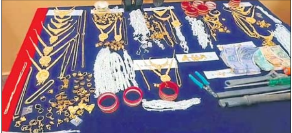
ପୋଲିସ୍ ଜଟ କରିଥିବା ସୁନା, ରୂପା ଅଳଙ୍କାର ଓ ମାରଣାସ୍ତ୍ର।

୯୨୫ ଗ୍ରାମ ସୁନା ଅଳଙ୍କାର, ୩ କେଜି ୧୦୦ ଗ୍ରାମ ରୂପା, ୬୧ ହଜାର ଜରଟ ସାଲେପୁର, ୧୫୪୪ (ଅରବିନ୍ଦ ଭୂୟାଁ)