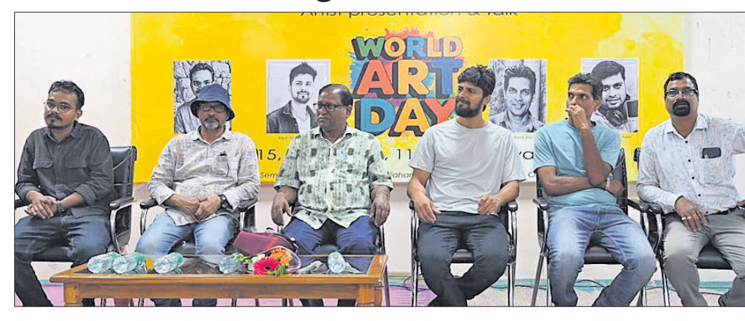
ବିଶ୍ୱ କଳା ଦିବସ ପାଳନ ଅବସରରେ ଯୋଗଦେଇଥିବା ଅତିଥି ।