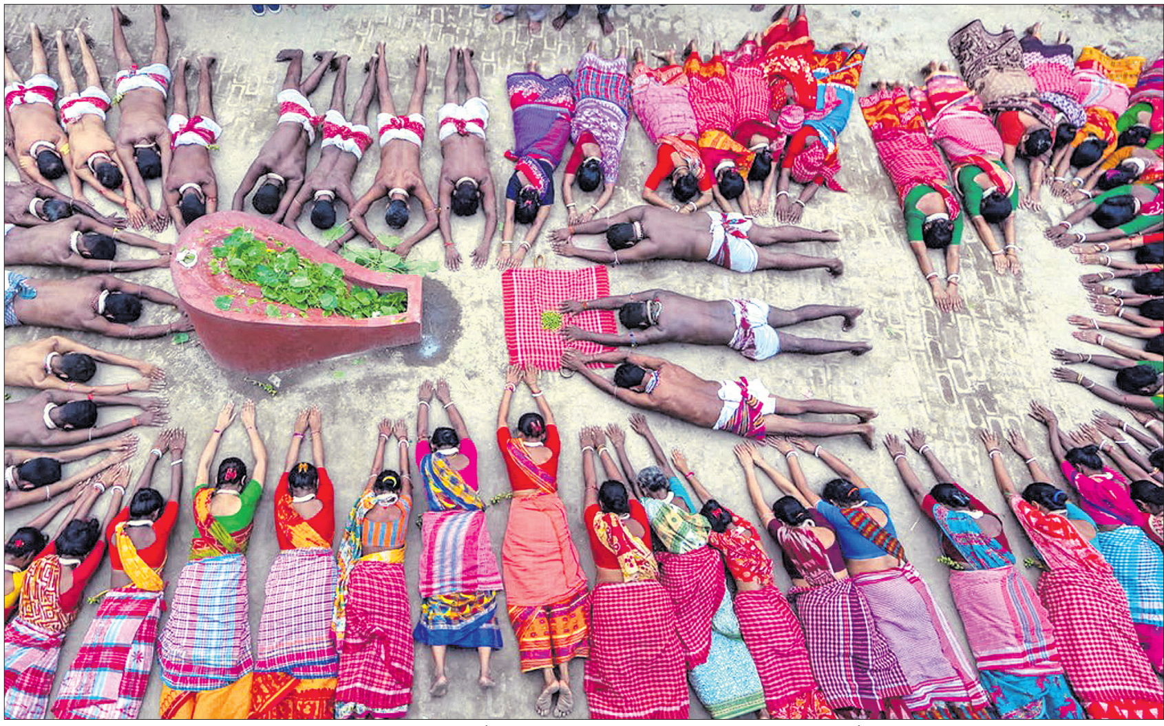
ପଶ୍ଚିମବଙ୍ଗର ହାତଡାରେ ବଙ୍ଗାଳୀ ନବବର୍ଷ ଅବସରରେ ହିନ୍ଦୁ ଭକ୍ତମାନେ ରାତିନାତି ପାଳନ କରୁଛନ୍ତି।