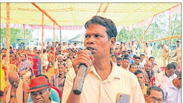
କମି ହରାଇବାକୁ ଥିବା ଗ୍ରାମୀଣ ବ୍ୟକ୍ତି ନିଜର ଦାବି ଉପସ୍ଥାପନ କରୁଛନ୍ତି।