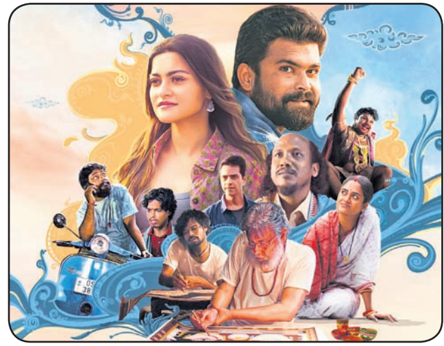
'ବିନ୍ଦୁସାଗର' ଫିଲ୍ମର ଏକ ପୋଷ୍ଟର