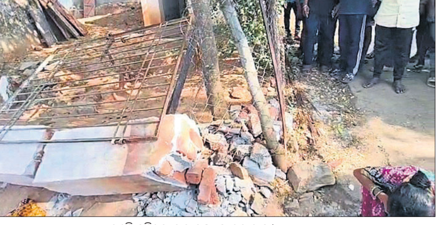
ଭୁଣ୍ଡୁଡ଼ି ପଡ଼ିଥିବା ସ୍କୁଲ ମୁଖ୍ୟ ଫାଟକ କାଢ଼।

ପାରଳାଖେମୁଣ୍ଡି/ଆର. ଉଦୟଗିରି, ୧୫୪ (ବିନିଧାନା ପରିଶ୍ରାମ/ମନୋଜ ପାଠୀ) ଗଜପତି ଜିଲ୍ଲା ନୂଆଗଡ଼ ବ୍ଲକ୍ ଭୁଣ୍ଡୁଡ଼ି ଗ୍ରାମର ସରକାରୀ ପ୍ରାଥମିକ ସ୍କୁଲ ମୁଖ୍ୟ ଫାଟକ କାଢ଼ ରୁଧିରାଣୀ ଭୁଣ୍ଡୁଡ଼ି ୨ ଛାତ୍ରୀଙ୍କ ମୃତ୍ୟୁ ଘଟିଛି। ସେମାନେ ହେଲେ ଭୁଣ୍ଡୁଡ଼ିର ଚତୁର୍ଥ ଶ୍ରେଣୀ ଛାତ୍ରୀ। ଇଡ଼ି ରଜତ(୯) ଓ ପଞ୍ଚମ ଶ୍ରେଣୀ ଛାତ୍ରୀ ବେକିତଲ ସରଜତ(୧୦)। ବିଦ୍ୟାଳୟ ଭିତ୍ତି ପରେ ଛାତ୍ରୀମାନେ ଖେଳୁଥିବା ସମୟରେ ଏହି ଅଘଟଣ ଘଟିଛି। ଏହାକୁ ନେଇ ଗ୍ରାମବାସୀଙ୍କ ମଧ୍ୟରେ ଅସନ୍ତୋଷ ଡେଇଁଛି। ଖବର ପାଇବା ମାତ୍ରେ ମୁଖ୍ୟମନ୍ତ୍ରୀ