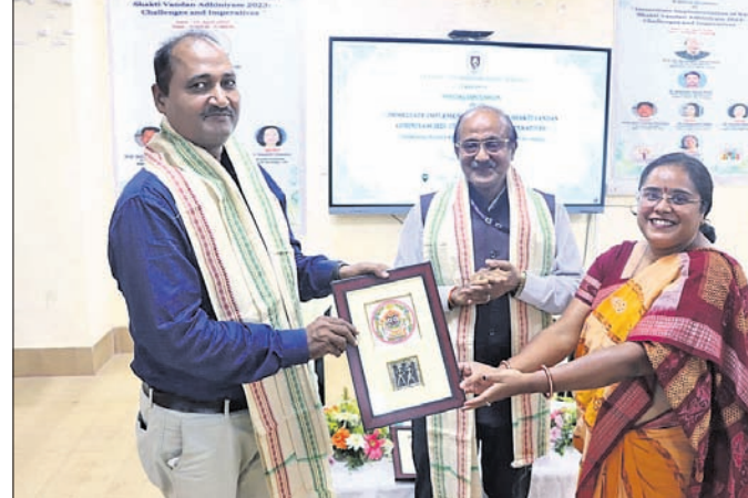
କାର୍ଯ୍ୟକ୍ରମରେ ଉପସ୍ଥିତ ଅତିଥି ଜଣେ ଅଧ୍ୟାପିକାଙ୍କୁ ସମର୍ପଣ କରୁଛନ୍ତି ।