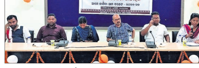
କାର୍ଯ୍ୟକ୍ରମରେ ଉପସ୍ଥିତ ଅତିଥି ।