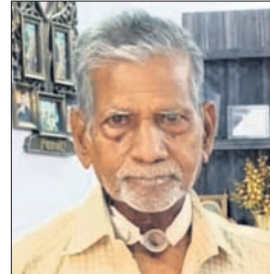
କୋରୁକୋଣ୍ଡା, ୧୬୪୪ (ଶିବପର ସାହୁ)

ମାଲକାନଗିରି ଜିଲ୍ଲା ବାଲିମେଳା ସହରର ଦୈନିକ ବଜାରର ବରିଷ୍ଠ ସାମାଜିକ କର୍ମୀ ସମାଜନ ପାଣିଗ୍ରାହୀ (୮୨)ଙ୍କ ରୂପବୀର ରାତିରେ ପରଲୋକ ହୋଇଯାଇଛି ।