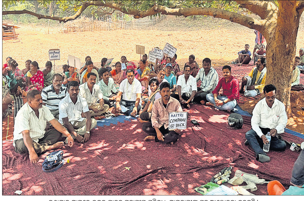
କଣ୍ଠାମାଳ ଗ୍ରାମରେ ଉତ୍କଳ ଯାଦବ ମହାସଂଘ ପ୍ରତିନିଧି ଗ୍ରାମବାସୀଙ୍କ ସହ ଆଲୋଚନା କରୁଛନ୍ତି ।

ବେଦାନ୍ତ ପକ୍ଷରୁ ସିଜିମାଳି ଖଣି ଖନନ ପାଇଁ ରାସ୍ତା ନିର୍ମାଣକୁ ଅଞ୍ଚଳବାସୀଙ୍କ ବିରୋଧକୁ ନେଇ ଜିଲ୍ଲା ପୋଲିସ୍ ଗତ ୬ ତାରିଖ ଭୋର ସମୟରେ କଣ୍ଠାମାଳ ଗ୍ରାମରେ ପଶି ଲୋକଙ୍କ ଉପରେ ଦମନଳାଳାକୁ ନିୟା କରିବା ସହ ପୋଲିସ୍ ରାତି ଅଧରେ ଗିରଫ ପାଇଁ କାର୍ଯ୍ୟକ୍ରମ ନେଇଥିଲା । ସେ ନେଇ ଯାଦବ ମହାସଂଘ ପ୍ରସ୍ତାବ କରିଛି । ଏଥିସହ ଅଞ୍ଚଳବାସୀଙ୍କ ସହିତ ଆଲୋଚନାକରି ଏହାର ସମାଧାନ କରିବାକୁ ଜିଲ୍ଲା ପ୍ରଶାସନ ଓ ରାଜ୍ୟ ସରକାରଙ୍କୁ ପ୍ରସ୍ତାବ ଦେବ ବୋଲି ସଂଘ