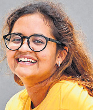
ଦର୍ଶନ ସଙ୍କଳନା ଲୋକ୍ଷ୍ମା ସିନେମା ଓ ସଂସ୍କୃତି ଉପରେ ଲୋକ୍ଷ୍ମାଲେଖକ ଭାବେ ସେ ସେକ୍ସେଣ୍ଟ ସିନେମା ଏକ ପୁସ୍ତକ ପ୍ରତିଷ୍ଠାପା ଏହି ପୋଡ଼କାଷ୍ଟ ମଞ୍ଚ ଉଭୟ ନିର୍ମାଣ ଓ ଦର୍ଶକଙ୍କ ପ୍ରତି ଉତ୍ସର୍ଗୀକୃତ।

କାନ୍ଥା କରୁଛି ଏକ ସିନେମା ହଲ୍ ବଦଳିବ। ପରଦାରେ କାହାଣୀ କାବ୍ୟ ହେଉଛି, ପ୍ରୋଜେକ୍ଟର ଚକ୍ର ଗୁଡ଼ିକ ଏବଂ ଦର୍ଶକ ସେଥିରେ ହସିଲାଇଲୁ। କିନ୍ତୁ ହଠାତ୍ କୌଣସି ପୂର୍ବ ସୂଚନା ନ ଥାଇ ସବୁଜି ଅଧିକାର ହୋଇଯାଇଛି। ଏହି ଅଧିକାର ସିନେମାର ବିପକ୍ଷରେ ପାଇଁ ଗୁଡ଼ିଆ ସିନେମା ଯେତେବେଳେ ସେହି ସତ୍ୟକୁ ଦର୍ଶକଙ୍କ ସାମ୍ନାରେ ଉନ୍ମୋଚିତ କରିବେ, ଯାହାକୁ ଦେଖିବା ବୋଧହୁଏ ସମାଜ କିମ୍ବା ଶାସନ ପାଇଁ ନିଷେଧ ଥିଲା, ସେତେବେଳେ ଏହି ଆଲୋଚନା କୋରକବଦ୍ୟ ଲିଭାଇ ଦିଆଯାଏ।