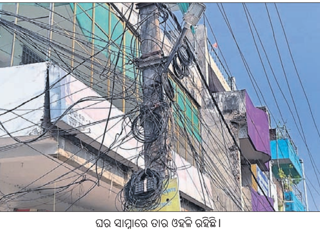
ଘର ସାମ୍ନାରେ ତାର ଓହଳି ରହିଛି ।