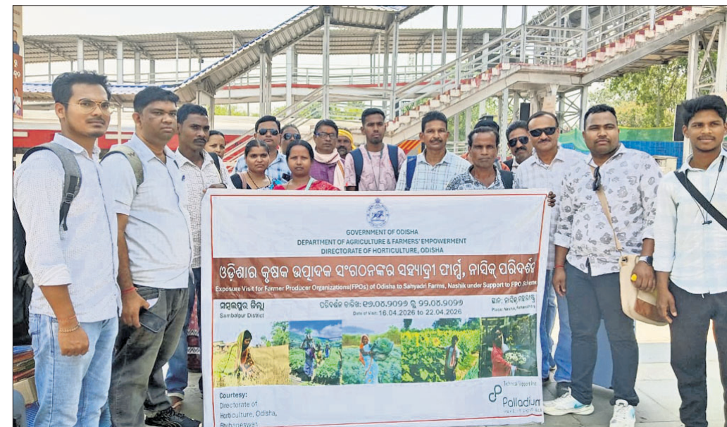
ଭୁବନେଶ୍ୱର, ୧୬/୪ (ଅନୁରାଧା ମହାରଣା) ଭାରତୀୟ ରେଳପଥ ପକ୍ଷରୁ ଏକ ନିଆରା ପଦକ୍ଷେପ ସ୍ୱରୂପ ଓଡ଼ିଶାର ୧୯ ଜଣ ଚାଷୀ ଗୁରୁବାର ଟ୍ରେନ୍ରେ ମହାରାଷ୍ଟ୍ର ନାସିକ ଅଭିଯତ୍ନ ଯାତ୍ରା କରିଛନ୍ତି। ସମ୍ବଲପୁର ଓ ତେଜାନାଳ ଜିଲ୍ଲାକୁ ଆସିଥିବା ଏହି ଚାଷୀମାନେ ଅଧିକାରୀଙ୍କ ସହିତ ଚାଷୀ ଏବଂ କୃଷକ ଉପାଦାନ ଗ୍ରହଣ ସହଯୋଗ। ଏମାନେ ନାସିକର ପ୍ରସିଦ୍ଧ ଶ୍ୟାନ୍ତି ଫାର୍ମସ୍ ପରିଦର୍ଶନ କରିବେ। ଏହା ଏକ ଉପାନ୍ତରିକ ଉଦ୍ୟାନ କୃଷି କେନ୍ଦ୍ର। ଚାଷୀମାନେ ସେଠାରେ ନୂଆ କୃଷି ପଦ୍ଧତି ଶିଖି ଓଡ଼ିଶାରେ ଚାହାର ପ୍ରୟୋଗ କରିବେ।

ଭାରତୀୟ ରେଳପଥ ପକ୍ଷରୁ ଏକ ନିଆରା ପଦକ୍ଷେପ ସ୍ୱରୂପ ଓଡ଼ିଶାର ୧୯ ଜଣ ଚାଷୀ ଗୁରୁବାର ଟ୍ରେନ୍ରେ ମହାରାଷ୍ଟ୍ର ନାସିକ ଅଭିଯତ୍ନ ଯାତ୍ରା କରିଛନ୍ତି। ସମ୍ବଲପୁର ଓ ତେଜାନାଳ ଜିଲ୍ଲାକୁ ଆସିଥିବା ଏହି ଚାଷୀମାନେ ଅଧିକାରୀଙ୍କ ସହିତ ଚାଷୀ ଏବଂ କୃଷକ ଉପାଦାନ ଗ୍ରହଣ ସହଯୋଗ। ଏମାନେ ନାସିକର ପ୍ରସିଦ୍ଧ ଶ୍ୟାନ୍ତି ଫାର୍ମସ୍ ପରିଦର୍ଶନ କରିବେ। ଏହା ଏକ ଉପାନ୍ତରିକ ଉଦ୍ୟାନ କୃଷି କେନ୍ଦ୍ର। ଚାଷୀମାନେ ସେଠାରେ ନୂଆ କୃଷି ପଦ୍ଧତି ଶିଖି ଓଡ଼ିଶାରେ ଚାହାର ପ୍ରୟୋଗ କରିବେ।