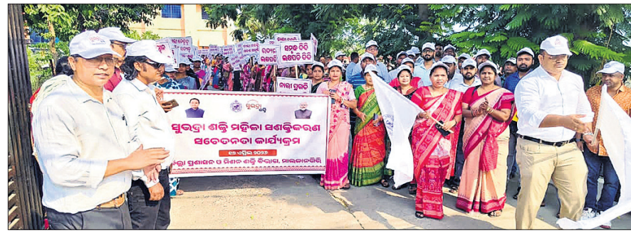
ପଦଯାତ୍ରା କରାଯାଇଛି ।