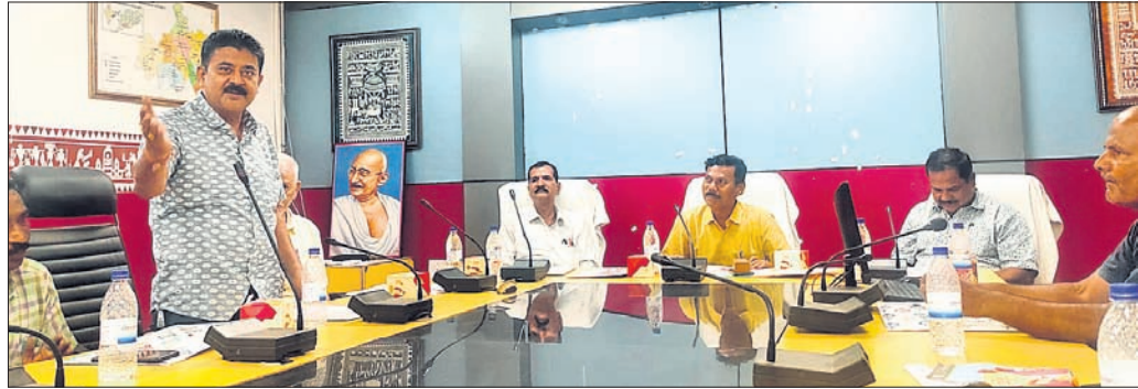
ବୈଠକରେ ଏତିଏମ୍‌ଙ୍କ ସହ ଜିଲ୍ଲା କ୍ରିକେଟ ଆସୋସିଏଶନର କର୍ମକର୍ତ୍ତା ।

ରାୟଗଡ଼ା ଜିଲ୍ଲା କ୍ରିକେଟ ଆସୋସିଏଶନର ସାଧାରଣ ପରିଷଦ ବୈଠକ ଜିଲ୍ଲାପାଳଙ୍କ କାର୍ଯ୍ୟକ୍ରମରୁ ସଦ୍‌ଭାବନା ସଭାଗୃହରେ ଗୁରୁବାର ଅନୁଷ୍ଠିତ ହୋଇଯାଇଛି । ଜିଲ୍ଲାରେ କ୍ରିକେଟ ଖେଳିବା ଓ ପ୍ରଶିକ୍ଷଣ ପାଇଁ ଉନ୍ନତ ଭିଡିଓଫିର ଅଭାବ ରହିଛି । ଦୂର୍ବଳ ଭିଡିଓଫିର ଉନ୍ନତି ପାଇଁ ପଦକ୍ଷେପ ଗ୍ରହଣ କରିବାକୁ ଜିଲ୍ଲା ପ୍ରଶାସନ, ରାଜ୍ୟ ସରକାର ଓ ଜିଲ୍ଲାରେ ଥିବା ଶିକ୍ଷା ସମ୍ପାଦକଙ୍କୁ ଦୃଷ୍ଟି ଆକର୍ଷଣ କରାଯିବାକୁ ବୈଠକରେ ନିଷ୍ପତ୍ତି ନିଆଯାଇଛି । ପ୍ରତିଭାବାନ୍ କ୍ରୀଡ଼ାକରୀଙ୍କୁ ପାଇଁ ଗ୍ରାମାଞ୍ଚଳ ସ୍ତରରୁ ଗ୍ରାଡୁଏଟ୍‌ସ୍ ଚିହ୍ନଟ କରିବାକୁ ଅବ୍ୟାପକ କରିବାକୁ ଗୁରୁତ୍ୱ ଦିଆଯାଇଛି । ରାଜ୍ୟସ୍ତରରେ ୧୨ବର୍ଷରୁ କମ୍ ଓ ୧୯