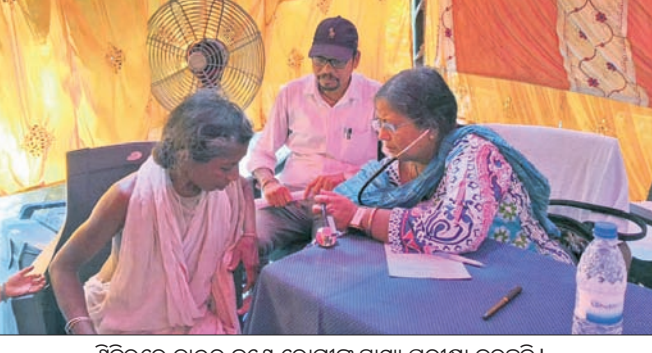
ଶିବିରରେ ଡାକ୍ତର ଜଣେ ରୋଗୀଙ୍କ ସ୍ୱାସ୍ଥ୍ୟ ପରୀକ୍ଷା କରୁଛନ୍ତି ।