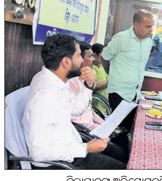
ଜିଲ୍ଲାପାଳଙ୍କୁ ଅଭିଯୋଗକରିବାକୁ ଆସିଥିବା ଚାଷୀ।