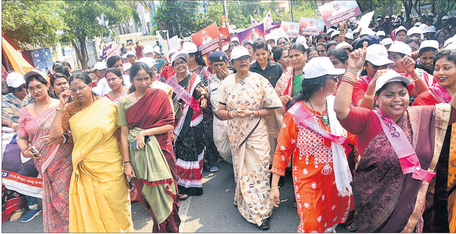
ଉପରପୁଞ୍ଜାପୁର ପ୍ରଭାତ ପରିଷଦ ପୁରୀ ଜିଲ୍ଲା ସ୍ତମ୍ଭୀୟା ଶ୍ରମିକ ସଂଘର ସମାବେଶରେ ଯାମିଲ ହୋଇଛନ୍ତି । ଏହି ଅବସରରେ ସେ ନାରୀ ଶକ୍ତି ବନ୍ଦନ ଶୋଭାଯାତ୍ରାରେ ଯାମିଲ ହୋଇଛନ୍ତି ।