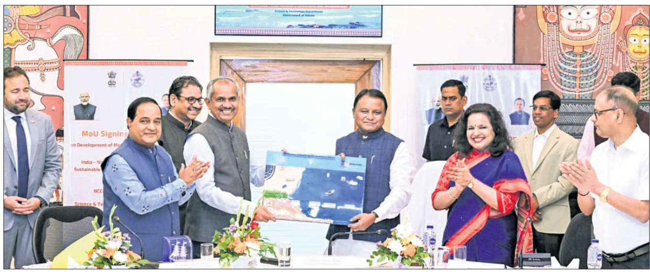
ପୁଞ୍ଜ୍ୟମନ୍ତ୍ରୀ ମୋହନ ଚରଣ ମାଝୀଙ୍କ ଉପସ୍ଥିତିରେ ଏମ୍.ଏସ୍.ସ୍. ସ୍ୱାକ୍ଷର କରାଯାଇଛି।