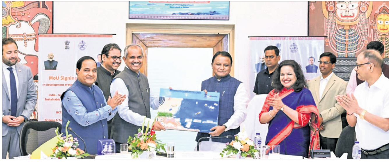
ପୁଞ୍ଜ୍ୟମନ୍ତ୍ରୀ ମୋହନ ଚରଣ ମାଝୀଙ୍କ ଉପସ୍ଥିତିରେ ଏମ୍.ଏସ୍.ସ୍. ସ୍ୱାକ୍ଷର କରାଯାଇଛି।