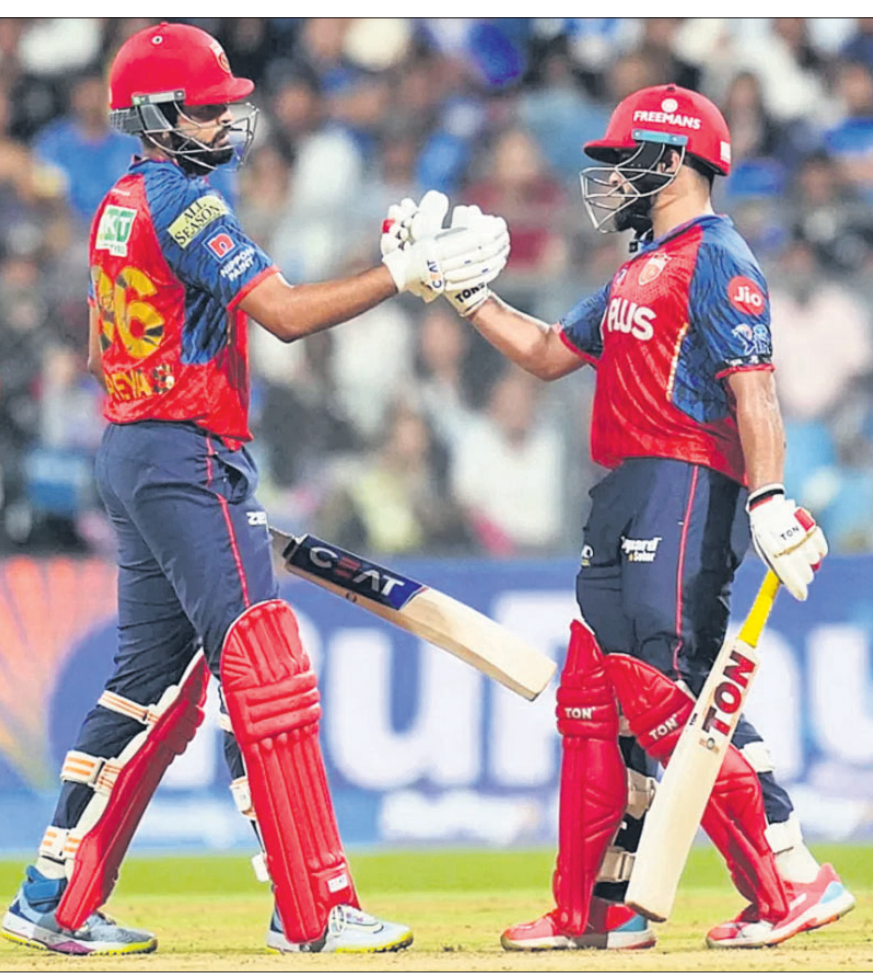
ଶତକୀୟ ଭାଗ୍ୟାବର ଅପରାଜେୟ ଧାରା ଓ ପ୍ରଭାସିନୀର ଦିନ

ପୁରୀ, ୧୬/୪ ପ୍ରଭାସିନୀର ଦିନ ଓ ଅଧିନାୟକ ଶ୍ରେୟାସ ଆୟାଜନ କରାଯାଇଥିବା ଏକ ଦିନ ପଞ୍ଜାବ କିଙ୍ଗ୍ସ (ପିଏସଏସଏ) ଟୁରୁବାର ଖେଳାଯାଇଥିବା ଆଇପିଏଲ ମ୍ୟାଚରେ ପୁରୀ ଇଣ୍ଡିଆନ୍ସ (ଏମଆଇ)କୁ ୬ ରନରେ ହରାଇ ଦେଇଥିଲା। ଶ୍ରେୟାସ ଆୟାଜନ କରିଥିବା ଏହି ମ୍ୟାଚରେ ପଞ୍ଜାବ କିଙ୍ଗ୍ସ ୧୯୪ ରନ କରିବାକୁ ସକ୍ଷମ ହୋଇଥିଲା।