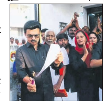
ରହିଛି। ଦକ୍ଷିଣ ଭାରତୀୟ ରାଜ୍ୟଗୁଡ଼ିକର ସ୍ୱାଧୀନ ପାଇଁ ଆମେ ଆଇନଗତ ପଦକ୍ଷେପ ନେବୁ। ଆସନ ସଂଖ୍ୟା କମିବ ନାହିଁ ବୋଲି ପୂର୍ବରୁ ସ୍ୱରାଷ୍ଟ୍ର ମନ୍ତ୍ରୀ ଅମିତ ଶାହା ମୋକ୍ତାଭାବେ ଆଖ୍ୟାସନା ଦେଇଥିଲେ।

ଲୋକ ସଭାରେ ଗୁରୁତ୍ୱପୂର୍ଣ୍ଣ ଡିଲିମିଟେଶନ ବିଲ୍ ଆଗତ ହୋଇଥିବାବେଳେ ଏହାକୁ ବିରୋଧ କରି ଡିଲିମିଟେସନ୍ ପ୍ରକ୍ରିୟାକୁ ଏମ୍.କେ. ଷ୍ଟାଲିନ୍ କଳା ପୋଷାକ ପରିଧାନ କରି ବିଧେୟକର କପି ପୋଡ଼ିଛନ୍ତି।