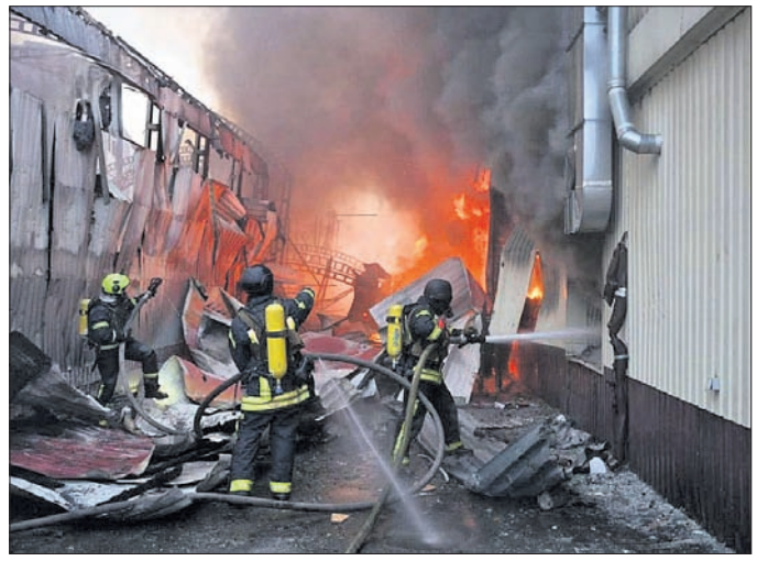
ୟୁକ୍ଲେନ୍ର ଏକ ବିଲ୍ଡିଂ ଉପରେ ରୁଷିଆ ମିଶାଇଲ୍ ମାଡ଼ କରିଛି।

ୟୁକ୍ଲେନ୍ର ଆବାସିକ ଅଞ୍ଚଳଗୁଡ଼ିକୁ ଗାନ୍ଧିତ କରି ରୁଷିଆ ୬୦୦ ଡ୍ରୋନ୍ ଏବଂ ବହୁସଂଖ୍ୟାରେ ବାଲିଷ୍ଟିକ ଏବଂ କ୍ରୁଜ୍ ମିଶାଇଲ୍ ମାଡ଼ କରିବାରୁ ୧୬ ଜଣଙ୍କ ମୃତ୍ୟୁ ଘଟିବା ସହ ୮୦ରୁ ଊର୍ଦ୍ଧ୍ୱ ଆହତ ହୋଇଛନ୍ତି।