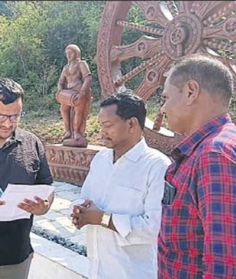
ବେନିୟମଭାବେ ବଦଳିଯାଇଛି। ସେମାନେ ଆମେ ମହେନ୍ଦ୍ରଗିରି ପୂଜା କମିଟି ବାରଘର ଆଦିବାସୀ ପାଠିକାଠି ଧରି ପରମ୍ପରାଗତ ଭାବେ ପୂଜାର୍ଚ୍ଚନା ଓ ଧାର୍ମିକ କାର୍ଯ୍ୟକଳାପ ସହ ଏହାର ସୁରକ୍ଷା ପ୍ରଦାନ କରିବାକୁ ନିମନ୍ତ୍ରଣ ଆସୁଛି। ମାତ୍ର ଆମ ଆଦିବାସୀଙ୍କ ଏକତା ଓ ବିଶ୍ୱାସକୁ କେତେ ଜଣ ଅନୁପ୍ରବେଶକାରୀ ଏବେ କୁଠାରାଘାତ କରୁଛନ୍ତି। ଯେମାନେ