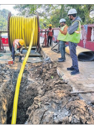
ସମ୍ବଲପୁର, ୧୬/୪ (ପ୍ରମୋଦ ବହିବାର)

ସମ୍ବଲପୁର ସହରବାସୀଙ୍କୁ ଏଣିକି ବିଦ୍ୟୁତ୍ ବିଭ୍ରାଟ ଭଳି ସମସ୍ୟାରୁ ମୁକ୍ତି ମିଳିବ। ସହରର ପ୍ରମୁଖ ବ୍ୟବସାୟିକ କେନ୍ଦ୍ର ଓ ଆଖପାଖ ଅଞ୍ଚଳରେ ନିରବଚ୍ଛିନ୍ନ ବିଦ୍ୟୁତ୍ ସେବା ଯୋଗାଇଦେବା ଲକ୍ଷ୍ୟରେ ବିଦ୍ୟୁତ୍ ଉପକରଣ ପକ୍ଷରୁ ଏକ ନୂତନ ୩୩ କେଜି ବିକଳ ଉପକରଣ ବିଦ୍ୟୁତ୍ ଲାଇନ କାର୍ଯ୍ୟକ୍ରମ ହୋଇଛି। କେଳଖାନା ଛକ ପାଖର ସର୍ବୋତ୍ତମରୁ ବଡ଼ବଜାର ସର୍ବୋତ୍ତମ ପର୍ଯ୍ୟନ୍ତ ପ୍ରାୟ ୩.୨ କିଲୋମିଟର ବ୍ୟାପୀ ଏହି ଉପକରଣ କେନ୍ଦ୍ର ବିନ୍ଧାଯିବା ଫଳରେ ସହରରେ ଏଣିକି ବିଦ୍ୟୁତ୍ ବିଭ୍ରାଟ ଯଥେଷ୍ଟ ହ୍ରାସ ପାଇବ ବୋଲି ବିଦ୍ୟୁତ୍ ଉପକରଣ ପକ୍ଷରୁ ଆଶା କରାଯାଇଛି।