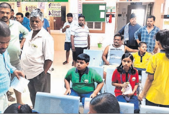
ଓଲଟି ପଡ଼ିଛି ସ୍କୁଲ ବସ୍। ସାମ୍ବାସକେନ୍ଦ୍ରକୁ ଚିକିତ୍ସା ପାଇଁ ଆସିଥିବା ଛାତ୍ରାଛାତ୍ରୀ।