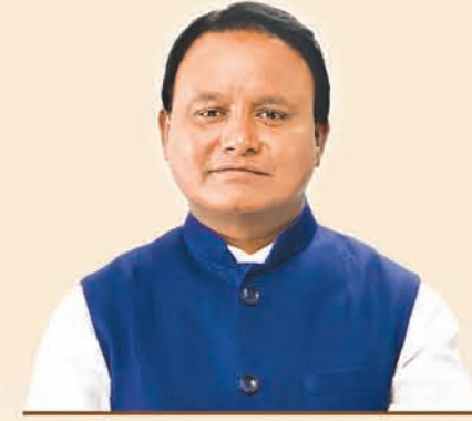
ଶ୍ରୀ ମୋହନ ଚରଣ ମାଝୀ ମୁଖ୍ୟମନ୍ତ୍ରୀ, ଓଡ଼ିଶା