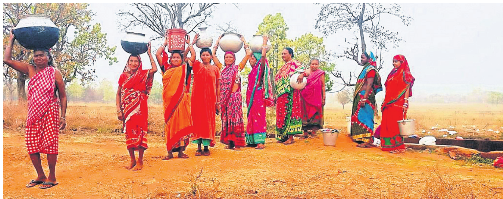
ଯାକପୁର ଜିଲ୍ଲା ସୁକିଆ ବ୍ଲକ୍ ବେଶାଗାଡ଼ିଆ ଗ୍ରାମର ନଳକୂପ ଜଳ ପାନୀୟ ଅନୁପଯୋଗୀ ହୋଇପଡ଼ିଥିବାରୁ ମହିଳାମାନେ ଗାଁ ନିକଟ ଏକ ନାଳକୁ ପାଣି ସଂଗ୍ରହ କରି ଆଣୁଛନ୍ତି । (ରିପୋର୍ଟ: ପୃଷ୍ଠା-୨)