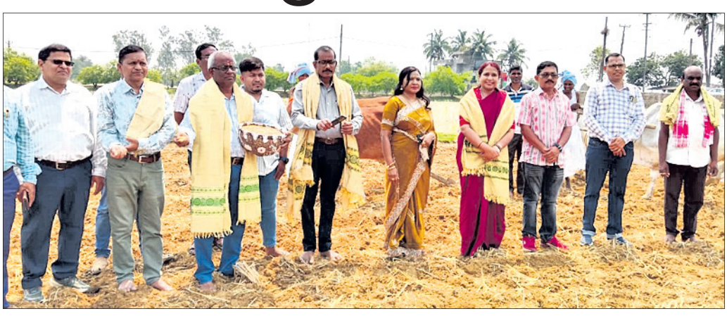
ଅତିଥି ଅଧ୍ୟକ୍ଷ ଅନୁକୂଳ କରୁଛନ୍ତି।

ମୟୂରଭଞ୍ଜ ଜିଲା ଶାମାଖୁଣ୍ଟସ୍ଥିତ କୃଷି ବିଜ୍ଞାନ କେନ୍ଦ୍ର-୧ ପରିସରରେ ଜିଲା ପ୍ରଶାସନ ଓ କୃଷି ବିଭାଗ ପକ୍ଷରୁ ଜିଲାସ୍ତରୀୟ ଅକ୍ଷୟ ଚୂଡ଼ାୟା ଓ କୃଷକ ଦିବସ ପାଳିତ ହୋଇଯାଇଛି।