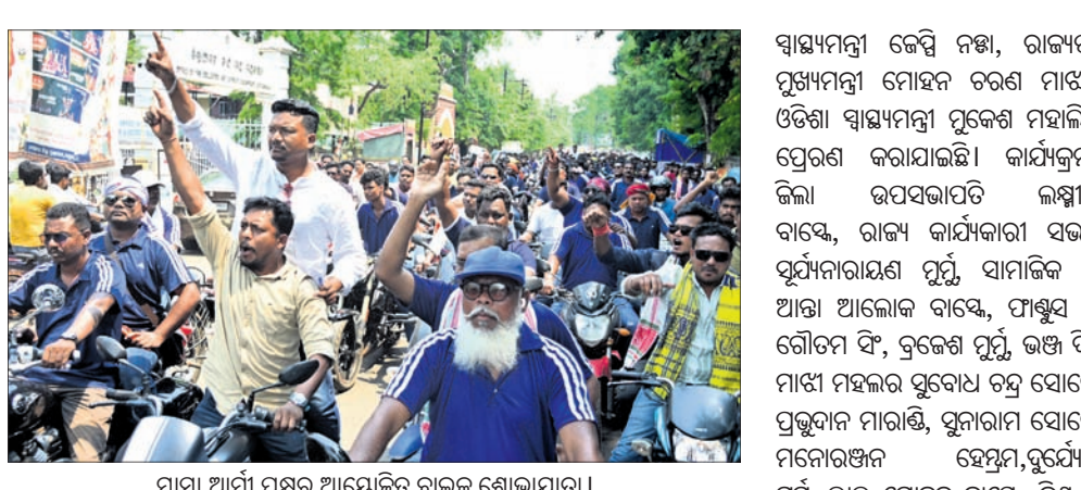
ମାଧ୍ୟମ ଆର୍ମି ପକ୍ଷରୁ ଆୟୋଜିତ ବାଇକ ଶୋଭାଯାତ୍ରା।

ମୟୂରଭଞ୍ଜ ଜିଲାରେ ବିପର୍ଯ୍ୟୟ ସ୍ୱାସ୍ଥ୍ୟସେବାକୁ ନେଇ ଉଦ୍‌ବେଗ ପ୍ରକାଶ ପାଇଛି।