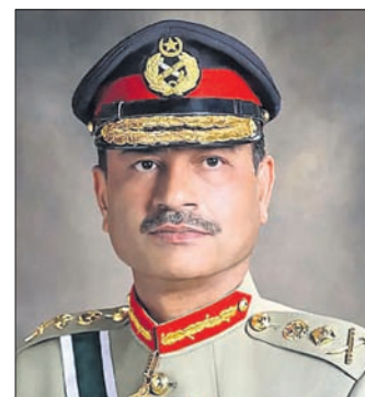
ଆସିମ ମୁନିର ଜଣାପଡ଼ିଛି। ଆମେରିକା-ଇରାନ ମଧ୍ୟରେ ୧୪ ଦିନିଆ ଅସ୍ତବିରତି ଅବଧି ଆସନ୍ତା ୨୨ରେ ଶେଷ ହେବାକୁ ଯାଉଛି। ଏଭଳି ସ୍ଥିତିରେ ମଙ୍ଗଳବାର ଇସ୍ଲାମାବାଦରେ ହେବାକୁ ଥିବା ଶାନ୍ତି ଆଲୋଚନାର ସଫଳ ହେବ କି ନାହିଁ ବୋଲି ପ୍ରଶ୍ନ ଉଠିଲାଣି। ପାକିସ୍ତାନର ସର୍ବୋଚ୍ଚ ସାମରିକ ଅଧିକାରୀ ଫିଲ୍ଡ ମାର୍ଶାଲ ଆସିମ ମୁନିର ଏନେଇ ଆମେରିକା ରାଷ୍ଟ୍ରପତି ଡୋନାଲ୍ଡ ଟ୍ରମ୍ପଙ୍କୁ ଫୋନ୍ କରି କହିଛନ୍ତି, ଫୁଣ୍ଡା-୧୦

ଆମେରିକା ପକ୍ଷରୁ ଇରାନୀୟ ବନ୍ଦରଗୁଡ଼ିକୁ ଅବରୋଧ କରାଯିବା ଶାନ୍ତି ଆଲୋଚନାରେ ପ୍ରତିରକ୍ଷକ ସାଜିଛି ବୋଲି ପାକିସ୍ତାନ ସେନାର ସର୍ବୋଚ୍ଚ ସାମରିକ ଅଧିକାରୀ ଫିଲ୍ଡ ମାର୍ଶାଲ ଆସିମ ମୁନିର ସୋମବାର ଆମେରିକା ରାଷ୍ଟ୍ରପତି ଡୋନାଲ୍ଡ ଟ୍ରମ୍ପଙ୍କୁ ଫୋନ୍‌ରେ ଜଣାଇଛନ୍ତି। ଚୁମ୍ବି ଏହା ଶୁଣିବା ପରେ ମୁନିରଙ୍କ ପରାମର୍ଶକୁ ନେଇ ବିଚାର କରିବେ ବୋଲି କହିଛନ୍ତି। ଆମେରିକା ଓ ଇରାନ ମଧ୍ୟରେ ହୋଇଥିବା ୧୪ ଦିନିଆ ଅସ୍ତବିରତି ଅବଧି ଏପ୍ରିଲ ୨୨ରେ ଶେଷ ହେଉଥିବାବେଳେ ସ୍ତ୍ରୀୟା ଭାବେ ଯୁଦ୍ଧ ବନ୍ଦ ପାଇଁ ପାକିସ୍ତାନ କୃତନୈତିକ ଉଦ୍ୟମ ଚଳାଇଛି। ପାକିସ୍ତାନ ମଧ୍ୟସ୍ତରରେ ଇସ୍ଲାମାବାଦରେ ଦ୍ୱିତୀୟ ପର୍ଯ୍ୟାୟ ଶାନ୍ତି ଆଲୋଚନା ପାଇଁ ସବୁ ପ୍ରସ୍ତୁତି ଶେଷ ହୋଇଛି। କିନ୍ତୁ ଆମେରିକୀୟ ପ୍ରତିନିଧି ଦଳ ଇସ୍ଲାମାବାଦରେ ପହଞ୍ଚିବା ପୂର୍ବରୁ ଇରାନ ଏଭଳି କୌଣସି ଆଲୋଚନା ପାଇଁ ନିଷ୍ପତ୍ତି ହୋଇନାହିଁ ବୋଲି କହିଥିଲା। ଏପରି କି ଆଲୋଚନାରେ ଯୋଗଦେବାକୁ ମନା କରିଥିଲା। ତେବେ ମୁନିର ଏନେଇ ଚୁମ୍ବିକୁ ବେତରାଳ ଦେଇଥିଲେ। ଆମେରିକୀୟ ନୌସେନା ଏବଂ ଇରାନର ଇସ୍ଲାମିକ୍ ରିଭୋଲ୍ୟୁସନାରୀ ଗାର୍ଡ କର୍ (ଆଇଆର୍‌ଜିସି) ମଧ୍ୟରେ ଚଣାଓଚରା ଯୋଗୁ ଷ୍ଟେଟ୍ ଅଫ୍ ହର୍ମ୍‌ଜ୍‌ରେ ଅଚଳାବସ୍ଥା ଉପୁଜିଛି। ଏହି ପ୍ରସଙ୍ଗ ବିଶ୍ୱବାସୀଙ୍କ ଦୃଷ୍ଟି ଆକର୍ଷଣ କରିବା ସହ ଏକ ମୁଖ୍ୟ ଆଲୋଚ୍ୟ ବିଷୟ ପାଲଟିଛି।