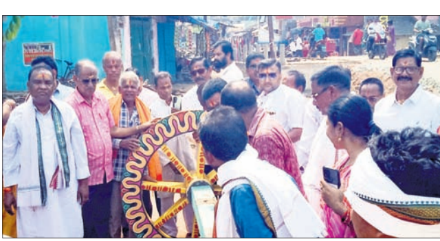
ଉଦ୍‌କାଠରେ ଅଖରେ ଚକ ଲାଗି କରାଯାଇଛି।

ଆରମ୍ଭ ହୋଇ ମୁଖ୍ୟ ମାର୍ଚ୍ଚକ ଦେଇ ସହର ପରିକ୍ରମା କରି ଜିଲାପାଳ କାର୍ଯ୍ୟାଳୟରେ ପହଞ୍ଚି ପ୍ରଧାନମନ୍ତ୍ରୀ ନରେନ୍ଦ୍ର ମୋଦୀଙ୍କ ଉଦ୍‌ଦେଶ୍ୟରେ ଏକ