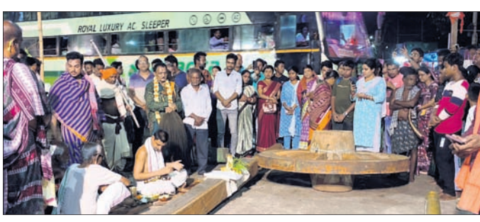
ରଥ କାଠ ପୂଜା କରାଯାଇଛି।

ଅକ୍ଷୟ ଚୂଡ଼ାୟା ତିଥିରେ ଦିତୀୟ ଶ୍ରୀକ୍ଷେତ୍ର ବାର୍ତ୍ତାପଦାରେ ଶ୍ରୀ ଶ୍ରୀ ହରିବଳଦେବ ଜାତ ବିଜେକ ମନ୍ଦିରରେ ରଥ ଅଖରେ ଚକ ଲାଗି ହୋଇଛି।