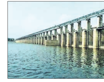
ପୁଷ୍ୟମନ୍ତ୍ରୀଙ୍କ ମଧ୍ୟରେ ଆଲୋଚନା ହେବ।