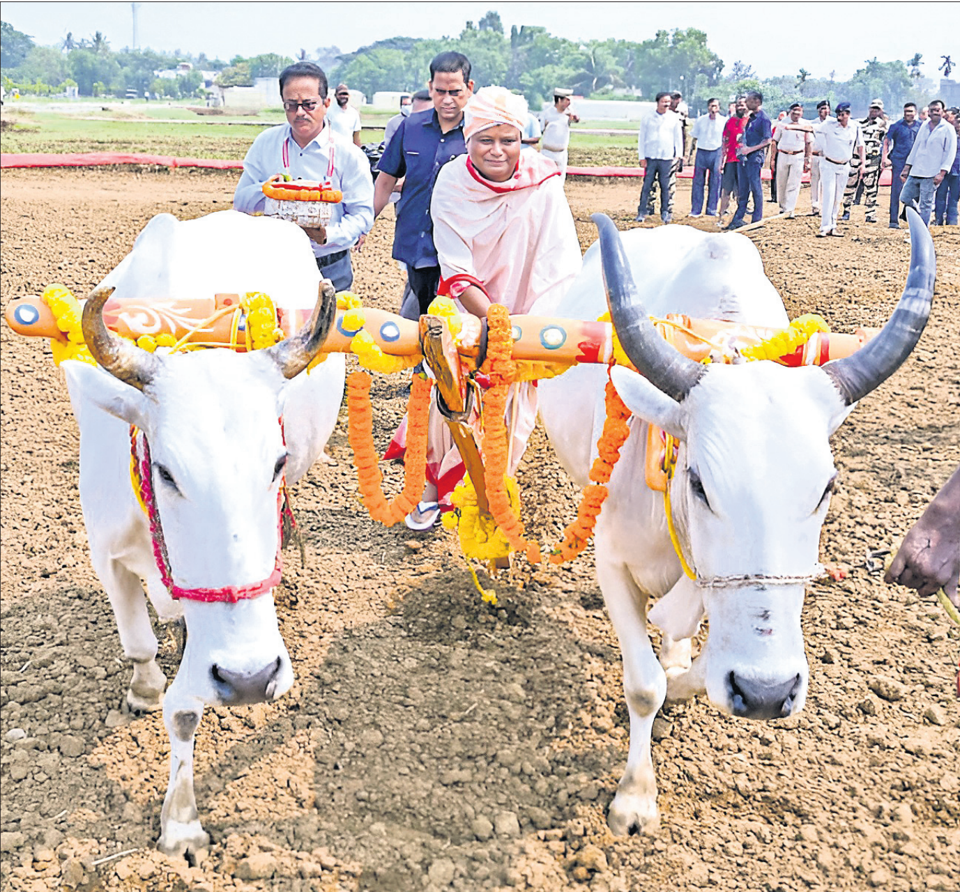
କଟକ ବିଦ୍ୟାଧରପୁର କେନ୍ଦ୍ରୀୟ ଧାନ ଗବେଷଣା ପ୍ରତିଷ୍ଠାନରେ ଯୋଗବାର ଅକ୍ଷୟଚୂଡ଼ାୟା ଅବସରରେ ପୁଷ୍ୟମନ୍ତ୍ରୀ ମୋହନ ଚରଣ ମାଝୀ ଅନୁକୂଳ କରି ଚାଷ କରୁଛନ୍ତି।