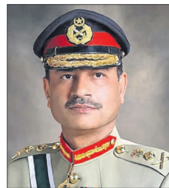
ଆସିମ ମୁନିର ଜଣାପଡ଼ିଛି। ଆମେରିକା-ଇରାନ ମଧ୍ୟରେ ୧୪ ଦିନିଆ ଅସ୍ତବିରତି ଅବଧି ଆସନ୍ତା ୨୨ରେ ଶେଷ ହେବାକୁ ଯାଉଛି। ଏଭଳି ସ୍ଥିତିରେ ମଙ୍ଗଳବାର ଇସ୍ଲାମାବାଦରେ ହେବାକୁ ଥିବା ଶାନ୍ତି ଆଲୋଚନାର ସଫଳ ହେବ କି ନାହିଁ ବୋଲି ପ୍ରଶ୍ନ ଉଠିଲାଣି। ପାକିସ୍ତାନର ସର୍ବୋଚ୍ଚ ସାମରିକ ଅଧିକାରୀ ଫିଲ୍ଡ ମାର୍ଶାଲ ଆସିମ ମୁନିର ଏନେଇ ଆମେରିକା ରାଷ୍ଟ୍ରପତି ଡୋନାଲ୍ଡ ଟ୍ରମ୍ପଙ୍କୁ ଫୋନ୍ କରି କହିଛନ୍ତି, ଫୁଣ୍ଡା-୧୦

ଆମେରିକା ପକ୍ଷରୁ ଇରାନୀୟ ବନ୍ଦରଗୁଡ଼ିକୁ ଅବରୋଧ କରାଯିବା ଶାନ୍ତି ଆଲୋଚନାରେ ପ୍ରତିରକ୍ଷକ ସାଜିଛି ବୋଲି ପାକିସ୍ତାନ ସେନାର ସର୍ବୋଚ୍ଚ ସାମରିକ ଅଧିକାରୀ ଫିଲ୍ଡ ମାର୍ଶାଲ ଆସିମ ମୁନିର ସୋମବାର ଆମେରିକା ରାଷ୍ଟ୍ରପତି ଡୋନାଲ୍ଡ ଟ୍ରମ୍ପଙ୍କୁ ଫୋନ୍‌ରେ ଜଣାଇଛନ୍ତି। ଚୁମ୍ବି ଏହା ଶୁଣିବା ପରେ ମୁନିରଙ୍କ ପରାମର୍ଶକୁ ନେଇ ବିଚାର କରିବେ ବୋଲି କହିଛନ୍ତି। ଆମେରିକା ଓ ଇରାନ ମଧ୍ୟରେ ହୋଇଥିବା ୧୪ ଦିନିଆ ଅସ୍ତବିରତି ଅବଧି ଏପ୍ରିଲ ୨୨ରେ ଶେଷ ହେଉଥିବାବେଳେ ସ୍ତ୍ରୀୟା ଭାବେ ଯୁଦ୍ଧ ବନ୍ଦ ପାଇଁ ପାକିସ୍ତାନ କୃତନୈତିକ ଉଦ୍ୟମ ଚଳାଇଛି। ପାକିସ୍ତାନ ମଧ୍ୟସ୍ତରରେ ଇସ୍ଲାମାବାଦରେ ଦ୍ୱିତୀୟ ପର୍ଯ୍ୟାୟ ଶାନ୍ତି ଆଲୋଚନା ପାଇଁ ସବୁ ପ୍ରସ୍ତୁତି ଶେଷ ହୋଇଛି। କିନ୍ତୁ ଆମେରିକୀୟ ପ୍ରତିନିଧି ଦଳ ଇସ୍ଲାମାବାଦରେ ପହଞ୍ଚିବା ପୂର୍ବରୁ ଇରାନ ଏଭଳି କୌଣସି ଆଲୋଚନା ପାଇଁ ନିଷ୍ପତ୍ତି ହୋଇନାହିଁ ବୋଲି କହିଥିଲା। ଏପରି କି ଆଲୋଚନାରେ ଯୋଗଦେବାକୁ ମନା କରିଥିଲା। ତେବେ ମୁନିର ଏନେଇ ଚୁମ୍ବିକୁ ଚେତାଇ ଦେଇଥିଲେ। ଆମେରିକୀୟ ନୌସେନା ଏବଂ ଇରାନର ଇସ୍ଲାମିକ୍ ରିଭୋଲ୍ୟୁଶନାରୀ ଗାର୍ଡ କର୍ (ଆଇଆର୍‌ଜିସି) ମଧ୍ୟରେ ଚଣାଓଚରା ଯୋଗୁଁ ଷ୍ଟ୍ରେଟ୍ ଅଫ୍ ହର୍ମୁଜରେ ଅଚଳାଚଳା ଉତ୍ପୁଜିଛି। ଏହି ପ୍ରସଙ୍ଗ ବିଶ୍ୱବାସୀଙ୍କ ଦୃଷ୍ଟି ଆକର୍ଷଣ କରିବା ସହ ଏକ ମୁଖ୍ୟ ଆଲୋଚ୍ୟ ବିଷୟ ପାଲଟିଛି।