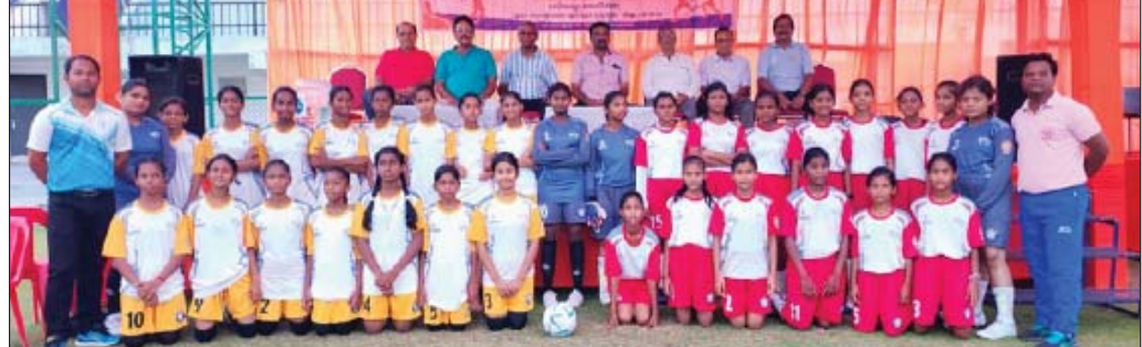
ବିଜୟୀ ହୋଇଥିବା ବୁକ୍ ଦଳର ଖେଳାଳିମାନେ ଅତିଥିଙ୍କ ଗହଣରେ ।