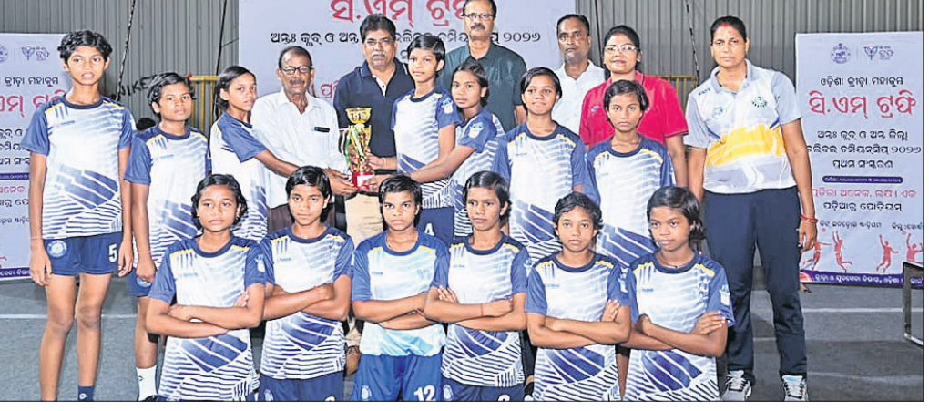
ଚୁପି ସହ ଚାମ୍ପିୟନ କିସ୍ ବାଲିକା ଦଳ।

ଭୁବନେଶ୍ୱର, ୨୧୪ (ବିଜୟ ରାଣା): ଓଡ଼ିଶା ସରକାରଙ୍କ ତତ୍ତ୍ୱାବଧାନରେ ଓଡ଼ିଶା ଭଲିବଲ୍ ଆସୋସିଏଶନ ଦ୍ୱାରା ଆୟୋଜିତ ଆନ୍ତର୍ଜାତୀୟ ଓ ଆନ୍ତର୍ଜାତୀୟ ୧୪ବର୍ଷରୁ କମ୍ ବାଲକ ଓ ବାଲିକା ସିଏମ୍ ଭଲିବଲ୍ ଚାମ୍ପିୟନଶିପ୍ (ଖୋର୍ଦ୍ଧା ଜିଲ୍ଲା) କିସ୍ ଯୁନିଭର୍ସିଟି କ୍ୟାମ୍ପସ୍ ପରିସରରେ ଥିବା ବିଜୁ ପଟ୍ଟନାୟକ ମଲଟି ପରଯୋଜ ଇନ୍ଡୋର ଷ୍ଟାଡିୟମରେ ସଫଳତାର ସହ ଅନୁଷ୍ଠିତ ହୋଇଯାଇଛି। ବାଲିକା ବିଭାଗ ପାଇନାଲରେ କିସ୍ ଯୁଗ୍ମ ୨-୦ରେ