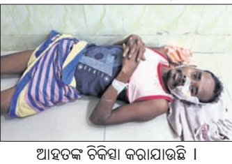
ଆହତକ ଚିକିତ୍ସା କରାଯାଉଛି ।