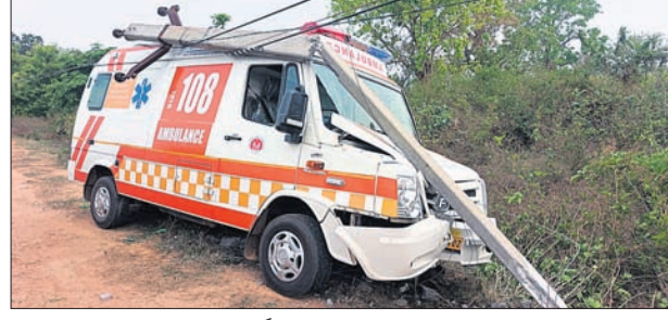
ଦୁର୍ଘଟଣାଗ୍ରସ୍ତ ଆୟୁଲାର୍ଡୁ ।