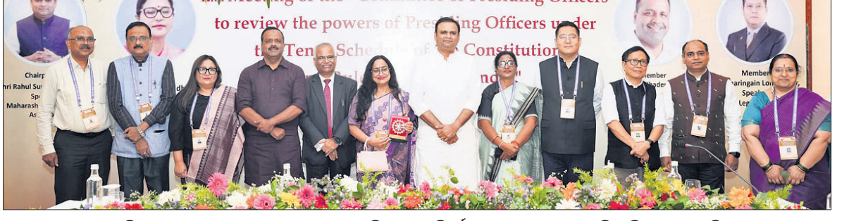
ସମିଳନୀରେ ଯୋଗଦେଇଥିବା ଲୋକ ସଭା ସଚିବାଳୟର ନିର୍ଦ୍ଦେଶକ, ୪ ଜଣଙ୍କର ବାଚସ୍ପତି ଓ ବିଧାନସଭା ସଚିବ।

ଭାରତୀୟ ସମ୍ବିଧାନର ଦଶମ ଅନୁସୂଚୀ ଅନୁଯାୟୀ ବିଧାନସଭା ଅଧ୍ୟକ୍ଷଙ୍କ କ୍ଷମତା ଓ ଦାୟିତ୍ୱ ସମାପ୍ତ ପାଇଁ ପୁରୀଠାରେ ମଙ୍ଗଳବାର ବାଚସ୍ପତି କମିଟି ସମିଳନୀ ଅନୁଷ୍ଠିତ ହୋଇଯାଇଛି।