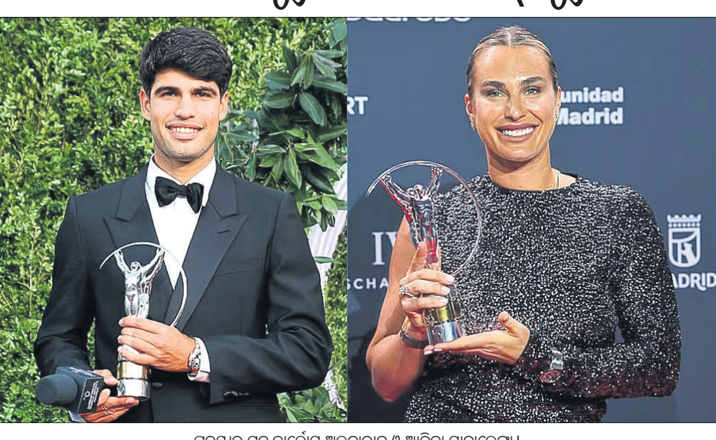
ପୁରସ୍କାର ସହ କାର୍ଲୋସ୍ ଅଲ୍‌କାରାଜ ଓ ଆରିନା ସାବାଲେଙ୍କା।

ମାଡ୍ରିଡ୍, ୨୧୪ (ଏସି): ଚେନିସ୍ ଖେଳାଳି କାର୍ଲୋସ୍ ଅଲ୍‌କାରାଜ ଓ ଆରିନା ସାବାଲେଙ୍କା ଯଥାକ୍ରମେ ସ୍ୱେଡିଶ ଓ ସ୍ୱେଡିଶ ଓପେନ ଅଫ୍ ଦି ଇୟର ପୁରସ୍କାର ଲାଭ କରିଛନ୍ତି। ପ୍ୟାରିସ୍ ସେଣ୍ଟ-ଜର୍ମେନ୍ (ସିଏସ୍ଜି) ଚିତ୍ ଅଫ୍ ଦି ଇୟର ବିବେଚିତ କରାଯାଇଛି। ଅଲ୍‌କାରାଜ ଗତବର୍ଷ ଫ୍ରେଞ୍ଚ୍ ଓ ଯୁଏସ୍ ଓପେନ ଚିତ୍ଥିବା ବେଳେ କାର୍ଲୋସ୍ ଅଲ୍‌କାରାଜ ଓପେନ ଚାଲେନ୍ଜର୍ ବିଜୟୀ ହୋଇଛନ୍ତି। ଅନ୍ୟପକ୍ଷରେ ଶୀର୍ଷ ର୍ୟାଙ୍କିଙ୍ଗ୍ ପ୍ରାପ୍ତ ମହିଳା ଖେଳାଳି ସାବାଲେଙ୍କା ଗତବର୍ଷ କ୍ରମାଗତ ଦ୍ୱିତୀୟ ଥର ଯୁଏସ୍ ଓପେନ ଚିତ୍ଥିଲେ। ୨୦୨୫ରେ ପ୍ରଥମ ଥର ଚାମ୍ପିୟନ୍ ଲିଭ୍ ଚାଲେନ୍ଜର୍ କିତି ଥିବାରୁ ସିଏସ୍ଜିକୁ ଲୌରିଅସ୍ ପୁରସ୍କାର ମିଳିଛି। ଗୋଟିଏ ମ୍ୟାଚ୍‌ଲମ୍ପ ଚଳିତ ମାସରେ ମାସିୟ ଚାଲେନ୍ଜର୍ ବଜାୟ ନାହିଁ। ଫଳରେ ସେ କମ୍ ବ୍ୟାକ୍ ଅଫ୍ ଦି ଇୟର ପୁରସ୍କାର ଲାଭ କରିଛନ୍ତି। ସେହିପରି ବାର୍ସିଲୋନା ଓ ସ୍ପେନ ଷ୍ଟାର୍ ଲାମିନେ ଯାମାଲ ଯଙ୍ଗ୍ ସ୍ୱେଡିଶ ଅଫ୍ ଦି ଇୟର ବିବେଚିତ ହୋଇଛନ୍ତି। ଫର୍ମାଲ୍