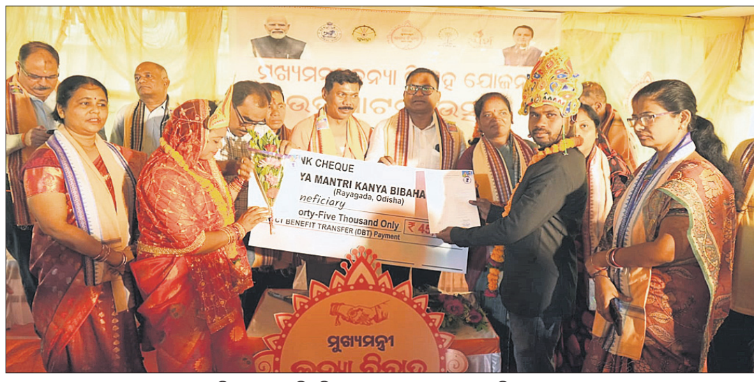
ଅତିଥିମାନେ ନବବିବାହିତା କନ୍ୟାଙ୍କୁ ଚେକ୍ ପ୍ରଦାନ କରୁଛନ୍ତି ।