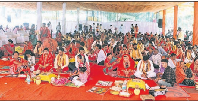
ମୁଖ୍ୟମନ୍ତ୍ରୀ କନ୍ୟା ବିବାହ ଯୋଜନାରେ ବରକନ୍ୟାଙ୍କ ବିବାହ ଚାଲିଛି ।