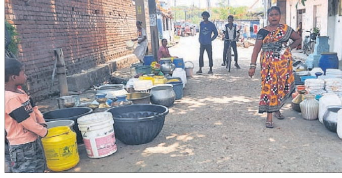
ପିଇବା ପାଣି ଅପେକ୍ଷାରେ ମହିଳାମାନେ ହାଣ୍ଡି ମାଠିଆ ରଖିଛନ୍ତି ।