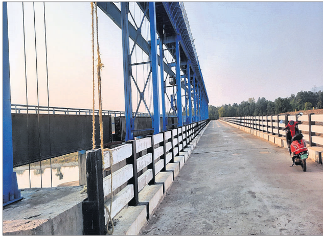
ଦର୍ବେ କେଳାରେ ନବନିର୍ମିତ ବ୍ୟାରେଜ