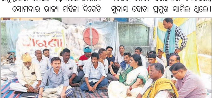
ଚାଷୀଙ୍କ ଧାରଣାରେ ବିଜେଡି ପ୍ରତିନିଧି ଦଳ ସାମିଲ ହୋଇଛନ୍ତି ।