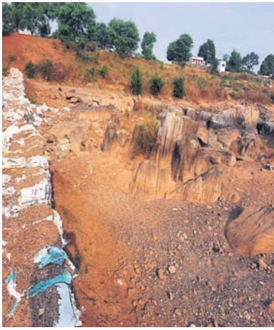
ନାଗେନ ଦହୀର ଅସ୍ଥାୟୀ ବନ୍ଧ ଶୁଖିଲା ପଡ଼ିଛି ।