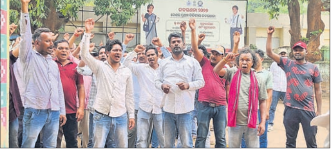
ବୁକ୍ ଅର୍ପଣ ଆଗରେ ବିକ୍ଷୋଭ ପ୍ରଦର୍ଶନ କରାଯାଇଛି।