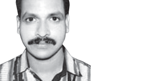
ସଂଗ୍ରାମ କେଶରୀ ପୃଷ୍ଟି

ଆବଶ୍ୟକ ପ୍ରକାର ସାଜି ସମାଜକୁ ଅନବରତ ବିଦ୍ୟୁତ୍ ଦେଇ ଚାଲୁଥିବା ଜଣେ ମହାନ୍ ବ୍ୟକ୍ତିତ୍ୱର ଅଧିକାରୀ ହେଉଛନ୍ତି - ଗୁରୁ । ସେ ହିଁ ବାସ୍ତବରେ ଜଣେ ଯୋଗ୍ୟତମ ଗୁରୁ । ଯିଏକି ନିଜକୁ ସବୁବେଳେ ଶିଷ୍ୟ ବୋଲି ବିବେଚନା କରିଥାନ୍ତି । ଯୋଗ୍ୟତମ ଗୁରୁଙ୍କ ସଂଜ୍ଞା ନିରୂପଣ କରିବାକୁ ଯାଇ ଷ୍ଟାଭ କବି ଗଙ୍ଗାଧର ମେହେର ଲେଖିଛନ୍ତି : “ ନିଜକୁ ସେ ନିରନ୍ତର ଶିଷ୍ୟ ରୂପେ ଗଣେ ନିଶ୍ଚୟ ସେ ଯୋଗ୍ୟତମ ଗୁରୁ ମଧ୍ୟେ ଜଣେ । ” ଅର୍ଥାତ୍ ଯେଉଁ ବ୍ୟକ୍ତି ନିଜକୁ ସର୍ବଦା ଜଣେ ଶିଷ୍ୟୁଆ ବ୍ୟକ୍ତି ବା ଶିଷ୍ୟ ବୋଲି ମନେକରନ୍ତି, ସେ ହିଁ ପ୍ରକୃତରେ ସବୁଠାରୁ ଜ୍ଞାନୀ ଓ ଶ୍ରେଷ୍ଠ ଗୁରୁ ହେବାର ଯୋଗ୍ୟତା ଲାଭ କରନ୍ତି । ଆମ ଜୀବନରେ ଶିଷ୍ୟବାର ପ୍ରକ୍ରିୟା କେବେ ସରିଯାଏ ନାହିଁ । ଏହି ଶିଷ୍ୟବାର ଆଗ୍ରହ ହିଁ ବ୍ୟକ୍ତିତ୍ୱକୁ ବିକଶିତ କରିଥାଏ । ଜଣେ ଆଦର୍ଶ ଶିକ୍ଷକ ହିଁ ଜଣେ ରାଜାଙ୍କର ଆତ୍ମବିଶ୍ୱାସ ନେଇ ଶ୍ରେଣୀଗୁହରେ ପ୍ରବେଶ କରନ୍ତି । ଆଉ ସେ ଯେତେବେଳେ ଶ୍ରେଣୀଗୁହରୁ ବାହାରନ୍ତି ସେତେବେଳେ ଛାତ୍ରଛାତ୍ରୀମାନେ ଜଣେ ଅସାଧାରଣ ସୂକ୍ଷ୍ମ ଶକ୍ତିସମ୍ପନ୍ନ ବ୍ୟକ୍ତିଙ୍କ ସହିତ ଭେଟ ହୋଇପାରି ଅନୁଭବ କରନ୍ତି । ସେହି ପିଲାମାନେ ଆନନ୍ଦରେ ତାଙ୍କଠାରୁ ପାଠ ପଢ଼ିବା ସହିତ ଶିକ୍ଷା ସରିବାର ବହୁ ବର୍ଷ ପରେ ମଧ୍ୟ ତାଙ୍କୁ ଜଣେ ଭଦ୍ର ତଥା ଜ୍ଞାନୀ ବ୍ୟକ୍ତି ଭାବରେ ସ୍ମରଣ କରନ୍ତି । ବାସ୍ତବରେ ଏହିପରି ଶିକ୍ଷକ ହେଉଛନ୍ତି ଜଣେ ଆଦର୍ଶ ଶିକ୍ଷକ ପଦବାଚ୍ୟ । ମହାତ୍ମା ଗାନ୍ଧୀଙ୍କ ମତରେ , ‘ଜୀବନ ଏକ ନିରନ୍ତର ଶିକ୍ଷା ପ୍ରକ୍ରିୟା’ । ଜଣେ ଯୋଗ୍ୟ ଗୁରୁ ସବୁବେଳେ ନୂତନ କିଛି ଶିଖିବାକୁ ଆଗ୍ରହ ପ୍ରକାଶ କରିଥାନ୍ତି । ଜ୍ଞାନ ଓ ନିପୁଣତା ହେଉଛି ତାଙ୍କର ଉତ୍ସାହ । ଅନୁଭବ, ପରିସ୍ଥିତି ଓ ବ୍ୟକ୍ତିତ୍ୱ ସବୁଠାରୁ ଶିଖିବାର ଆଧାର ଭାବେ ରଖେ । ପ୍ରତ୍ୟେକଟି ପରିସ୍ଥିତି ସହିତ ନିଜକୁ ସାମିଲ କରାଇ ତା’ ମଧ୍ୟରୁ ସଫଳତାର ବିଦ୍ୟା ହାସଲ କରିବାର କୌଶଳ ଶିଖିପାରିଲେ ଜୀବନ ସଫଳ ହୁଏ । ଏହାକୁ ହିଁ ସେ ପରବର୍ତ୍ତୀ ସମୟରେ ବାସ୍ତବ କ୍ଷେତ୍ରରେ ପ୍ରୟୋଗ କରି ଅନ୍ୟମାନଙ୍କ ପାଇଁ ସାଜିଥାନ୍ତି ପ୍ରେରଣାର ଉତ୍ସାହ ।