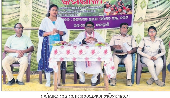
କର୍ମଶାଳାରେ ଯୋଗଦେଇଥିବା ଅତିଥିମାନେ।