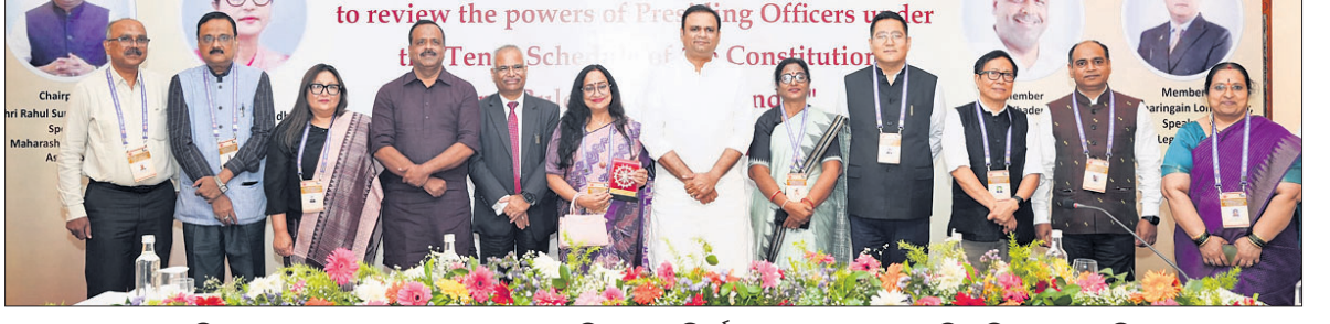
ସମିଳନୀରେ ଯୋଗଦେଇଥିବା ଲୋକ ସଭା ସଚିବାଳୟର ନିର୍ଦ୍ଦେଶକ, ୪ ଜଣଙ୍କର ବାଚସ୍ପତି ଓ ବିଧାନସଭା ସଚିବ।