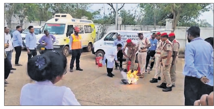
ମକ୍ତୁଲ ମାଧ୍ୟମରେ ସଚେତନ କରାଯାଇଛି।

କଳାହାଣ୍ଡି ଜିଲ୍ଲା ଲାଞ୍ଜିଗଡ଼ ଅଗ୍ନିଶମ ବିଭାଗ ତରଫରୁ ଏପ୍ରିଲ ୧୪ରୁ ୨୦ ତାରିଖ ପର୍ଯ୍ୟନ୍ତ ଅଗ୍ନିଶମ ସୁରକ୍ଷା ସପ୍ତାହ ପାଳିତ ହୋଇଯାଇଛି। ଏହି ଅବସରରେ ବିଭାଗ ସୁରକ୍ଷା ପ୍ରତିରୋଧ, ସତର୍କତା ଓ ଜରୁରିକାଳୀନ ସୁରକ୍ଷା ସମ୍ପର୍କରେ କର୍ମଚାରୀଙ୍କୁ ପ୍ରଶ୍ନୋତ୍ତର ପ୍ରଶ୍ନୋତ୍ତର ଆଧାରରେ ଶିକ୍ଷା ଦିଆଯାଇଛି। ଏହାଛଡ଼ା ଲୋକଙ୍କ ସମେତ ବିଭିନ୍ନ ସ୍କୁଲ, କଲେଜ, ଡାକ୍ତରଖାନା ଓ ସଙ୍ଗଠନକୁ ସଚେତନ କରାଯାଇଥିଲା। ବିଶ୍ୱନାଥପୁର ଡାକ୍ତରଖାନା, ଦେବାନ୍ତ ଡାକ୍ତରଖାନା, ଯୋଡ଼ାବନ୍ଧ, ଛତ୍ରପୁର ସରକାରୀ ବିଦ୍ୟାଳୟ, ମହାରଣା ପ୍ରମୁଖ ସହଯୋଗ କରିଥିଲେ।