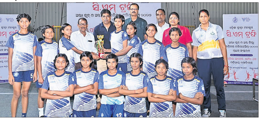
ତ୍ରୁପି ସହ ଚାମ୍ପିୟନ କିସ୍ ବାଲିକା ଦଳ।

ଭୁବନେଶ୍ୱର, ୨୧।୪ (ବିଜୟ ରାଣା) ଓଡ଼ିଶା ସରକାରଙ୍କ ତତ୍ତ୍ୱାବଧାନରେ ଓଡ଼ିଶା ଭଲିବଲ୍ ଆସୋସିଏଶନ୍ ଦ୍ୱାରା ଆୟୋଜିତ ଆନ୍ତର୍ଜାତୀୟ ଓ ଆନ୍ତର୍ଜାତୀୟ ୧୪ବର୍ଷରୁ କମ୍ ବାଲକ ଓ ବାଲିକା ସିଏମ୍ ଭଲିବଲ୍ ଚାମ୍ପିୟନଶିପ୍ (ଖୋର୍ଦ୍ଧା ଜିଲ୍ଲା) କିସ୍ ଯୁନିଭର୍ସିଟି କ୍ୟାମ୍ପସ୍ ପରିସରରେ ଥିବା ବିଜୁ ପଟ୍ଟନାୟକ ମଲ୍ଟି ପରଯୋଜ୍ ଇନ୍ଡୋର ଷ୍ଟାଡିୟମରେ ସଫଳତାର ସହିତ ଅନୁଷ୍ଠିତ ହୋଇଯାଇଛି। ବାଲିକା ବିଭାଗ ଫାଇନାଲରେ କିସ୍ ସ୍କୁଲ ୨-୦ରେ