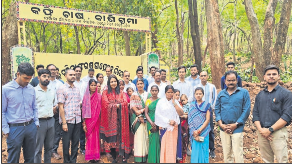
କାଶୀଗୁମ୍ଫା କର୍ମ ଉତ୍ସାହୀନ ପରିଦର୍ଶନ ସମୟରେ କେନ୍ଦ୍ରୀୟ ପ୍ରଭାଚାରୀ।