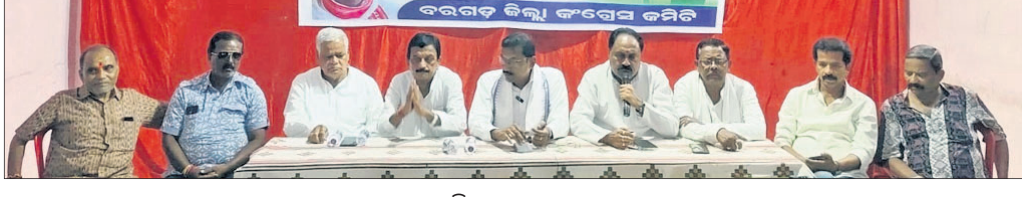
ଖବରଦାତା ସମ୍ମିଳନୀରେ କଂଗ୍ରେସ ନେତୃବୃନ୍ଦ ।

ବରଗଡ଼, ୨୧୪ (ପ୍ରମାଣ ସମାଚାର) ମହିଳା ଆରକ୍ଷଣ ବିଲ୍ ୨୦୨୩ରେ ପାର୍ଲିାମେଣ୍ଟରେ ପାସ୍ ହେଲା ପରେ କେନ୍ଦ୍ର ମୋଦି ସରକାରଙ୍କ କୌଶଳ ଆକ୍ରମିକତା ନ ଥିଲା । ନଚେତ୍ ତାକୁ ଆଇନରେ ପରିଣତ କରାଯାଇ ପାରିଥାନ୍ତା । ବର୍ତ୍ତମାନ ମହିଳା ବିଲ୍ ଆଳ କରି ଲୋକ ସଭା ଆସନ ଯାମା ନିର୍ବାହୀ ବିଲ୍ ପାସ୍ କରିବାର ଷଡ଼ଯନ୍ତ୍ର ରଚିଥିଲା ଭାଜପା । ଏହା ଧରାପଡ଼ିଯିବା ଫଳରେ ଭାଜପା ଏବେ କୁସୀର କାନ୍ଦଣା କାନ୍ଦୁଛି ବୋଲି ମଙ୍ଗଳବାର ବରଗଡ଼ ଜିଲା