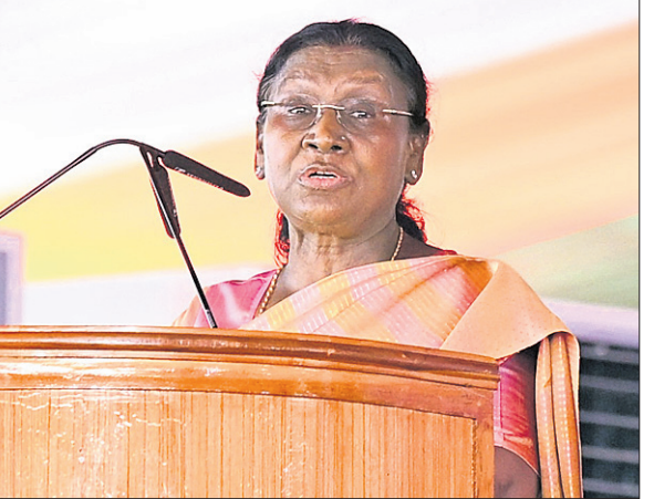
ଜନସମାବେଶକୁ ରାଷ୍ଟ୍ରପତି ଦ୍ରୌପଦୀ ମୁମୁଁ ଉଦ୍‌ବୋଧନ ଦେଉଛନ୍ତି।

ରାଷ୍ଟ୍ରପତି ଦ୍ରୌପଦୀ ପୂର୍ଣ୍ଣିକା ଦିନିକିଆ ରାଉରକେଲା ଗସ୍ତ ୧୫୮ କୋଟି ଟଙ୍କାର ୫ ପ୍ରକଳ୍ପକୁ ଜଳେ ଲୋକାର୍ପଣ