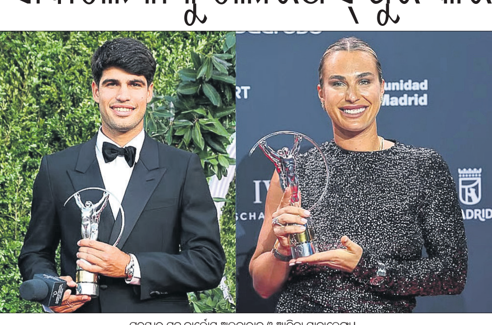
ପୁରସ୍କାର ସହ କାର୍ଲୋସ୍ ଅଲ୍‌କାରାଜ ଓ ଆରିନା ସାବାଲେଙ୍କା।

ନାହିରୁ, ୨୧।୪ (ଏସି) ଡେନିସ୍ ଖେଳାଳି କାର୍ଲୋସ୍ ଅଲ୍‌କାରାଜ ଓ ଆରିନା ସାବାଲେଙ୍କା ଯଥାକ୍ରମେ ସ୍ୱେଡିଶ୍ ଓ ସ୍ୱେଡିଶ୍ ଓସିଏନିଆ ଅଫ୍ ଦି ଇୟର୍ ପୁରସ୍କାର ଲାଭ କରିଛନ୍ତି। ପ୍ୟାରିସ୍ ସେଣ୍ଟ-ଜର୍ମେନ୍ (ସିଏସ୍‌ଜି) ଟିମ୍ ଅଫ୍ ଦି ଇୟର୍ ବିବେଚିତ କରାଯାଇଛି। ଅଲ୍‌କାରାଜ ଗତବର୍ଷ ଫ୍ରେଞ୍ଚ୍ ଓ ଯୁଏସ୍ ଓପନ ଚିତ୍ରିତ୍ୱ ବେଳେ ଜାଣୁଆରୀରେ ଅଷ୍ଟ୍ରେଲିଆନ ଓପନ ଟାଇଟଲ୍ ବିଜୟୀ ହୋଇଛନ୍ତି। ଅନ୍ୟପକ୍ଷରେ ଶୀର୍ଷ ର୍ୟାଙ୍କିଙ୍ଗ୍ ପ୍ରାପ୍ତ ମହିଳା ଖେଳାଳି ସାବାଲେଙ୍କା ଗତବର୍ଷ ଜୁମାଗତ ଦ୍ୱିତୀୟ ଥର ଯୁଏସ୍ ଓପନ ଚିତ୍ରିତ୍ୱରେ ଲାଭ କରିଥିଲେ। ୨୦୨୫ରେ ପ୍ରଥମ ଥର ଚାମ୍ପିୟନ୍ ଲିଗ୍ ଟାଇଟଲ୍ ଜିତି ଥିବାରୁ ସିଏସ୍‌ଜିକୁ ଲୌରିଅସ୍ ପୁରସ୍କାର ମିଳିଛି। ଗୋଟି ମ୍ୟାଚ୍‌ଲରସ୍ ଚଳିତ ମାସରେ ଚାମ୍ପିୟନ୍ ଟାଇଟଲ୍ ବଜାୟ ନାସ୍‌କରିଛି। ଫଳରେ ସେ କମ୍ ବ୍ୟାକ୍ ଅଫ୍ ଦି ଇୟର୍ ପୁରସ୍କାର ଲାଭ କରିଛନ୍ତି। ସେହିପରି ବାର୍ସିଲୋନା ଓ ସ୍ପେନ ସ୍ଥାନୀୟ ଯୋଗାଳ ଯଜ୍ଞ ସ୍ୱେଡିଶ୍ ଅଫ୍ ଦି ଇୟର୍ ବିବେଚିତ ହୋଇଛନ୍ତି। ଫର୍ମାଲ୍