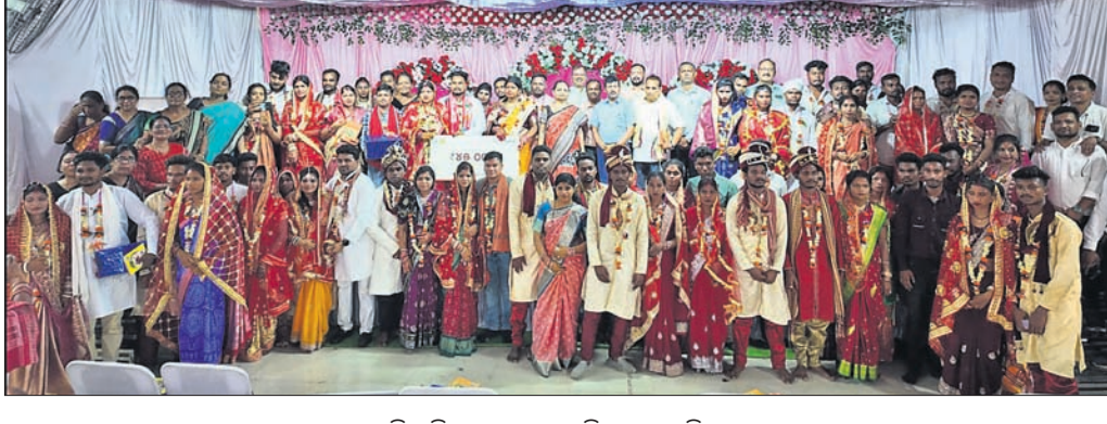
ଭବାନୀପାଟଣାରେ ସାମୁହିକ ବିବାହ ପରେ ଦମ୍ପତିଙ୍କ ସହ ଅତିଥିମାନେ।