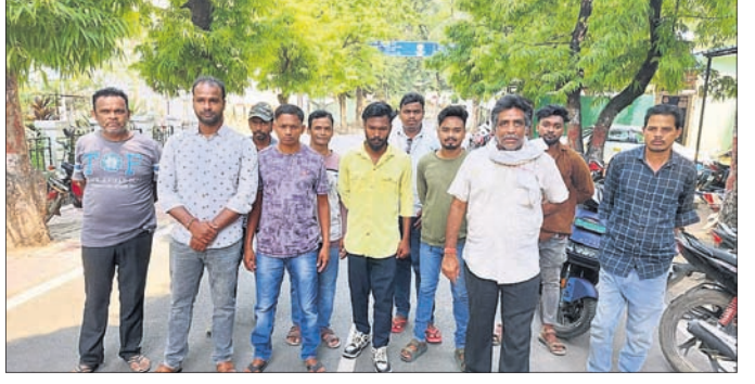
ଛଟେଇ ପ୍ରତିବାଦରେ ଜିଲାପାଳଙ୍କୁ ଫେରାଦ ହୋଇଥିବା କର୍ମଚାରୀବୃନ୍ଦ ।