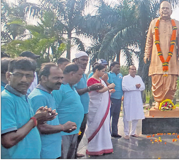
ଖୋର୍ଦ୍ଧା, ୨୧୪ (ପ୍ରଭାତ ପାଣିଗ୍ରାହୀ) ଜାନକୀବଲ୍ଲଭ ସ୍ମୃତି କମିଟି ଆରମ୍ଭରେ ଆସାମୀୟ ପୂର୍ବତନ ରାଜ୍ୟପତି ତଥା ଓଡ଼ିଶାର ପୂର୍ବତନ ମୁଖ୍ୟମନ୍ତ୍ରୀ ଜାନକୀବଲ୍ଲଭ ପଟ୍ଟନାୟକଙ୍କ ଏକାଦଶତମ ଶ୍ରାଦ୍ଧବାର୍ଷିକୀ ମଙ୍ଗଳବାର ଖୋର୍ଦ୍ଧା ଜିଲ୍ଲାପାଳଙ୍କ କାର୍ଯ୍ୟାଳୟ ନିକଟସ୍ଥ ଜାନକୀବଲ୍ଲଭ ପଟ୍ଟନାୟକ ଉଦ୍ୟାନ ପରିସରରେ ଅନୁଷ୍ଠିତ ହୋଇଯାଇଛି।