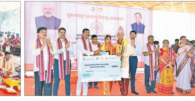
ନବବିବାହିତାଙ୍କୁ ସହାୟତା ରାଶି ପ୍ରଦାନ କରିଯାଉଛି ।