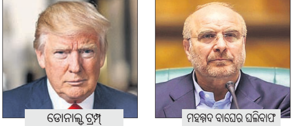
ଡୋନାଲ୍ଡ ଚୁମ୍ବି (ବାମ) ମହମ୍ମଦ୍ ବାୟେର ଘଲିବାଫ (ଡାହାଣ)

ପାଇଁ ରାଜି ଅଛି। କିନ୍ତୁ ଇରାନକୁ ଅସ୍ତବିରତି ବିକଶିତ କରିବାକୁ ଆମେରିକା ଦେବ ନାହିଁ ବୋଲି ସେ ଦାବିକରିଛନ୍ତି। ଅନ୍ୟପକ୍ଷରେ ଆମେରିକା ସହ ଆଲୋଚନା ପାଇଁ ଇରାନର କୌଣସି ପ୍ରତିନିଧି ପାକିସ୍ତାନ ଯାଇ ନ ଥିବା ଚେହରାନ୍ଦର ଏକ ସରକାରୀ ଟେଲିଭିଜନ ପକ୍ଷରୁ କୁହାଯାଇଛି। ତେବେ ଆମେରିକା ପକ୍ଷରୁ ଆଲୋଚନାର ନେତୃତ୍ୱ ନେବାକୁ ଥିବା ଉପରାଷ୍ଟ୍ରପତି ଜେ.ଡି. ଭାନ୍ସ ପାକିସ୍ତାନ ଆସୁଥିବା ସୁତନା ମିଳିଛି। ୨ ସପ୍ତାହର