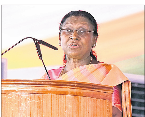
ଜନସମାବେଶକୁ ରାଷ୍ଟ୍ରପତି ଦ୍ରୌପଦୀ ମୁମୁଁ ଉଦ୍‌ବୋଧନ ଦେଉଛନ୍ତି।

ରାଷ୍ଟ୍ରପତି ଦ୍ରୌପଦୀ ପୂର୍ଣ୍ଣିକା ଦିନିକିଆ ରାଉରକେଲା ଗସ୍ତ ୧୫୮ କୋଟି ଟଙ୍କାର ୫ ପ୍ରକଳ୍ପକୁ ଜଳେ ଲୋକାର୍ପଣ