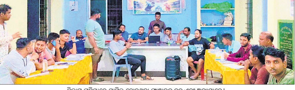
ନିଲାମ ପ୍ରକ୍ରିୟାରେ ସାମିଲ ହୋଇଥିବା ପ୍ରାଞ୍ଚାଳକ ଏବଂ ଅନ୍ୟମାନେ।

ବୋଲଗଡ଼, ୨୧୪ (ଦେବବ୍ରତ ହୋତା) ବୋଲଗଡ଼ ହାଇସ୍କୁଲ ଖେଳପଡ଼ିଆରେ ଆୟତ୍ତ ୨୬ ତାରିଖରୁ ବୋଲଗଡ଼ ପ୍ରମିୟର ଲିଟ୍ (ବିଏଏଲ) କ୍ରିକେଟ ଟୁର୍ନାମେଣ୍ଟର ବ୍ୟବସ୍ଥା ସଂସ୍କରଣ ଆରମ୍ଭ ହେବ। ମେ' ୧୦ ତାରିଖ ପର୍ଯ୍ୟନ୍ତ ଚାଲିବାରୁ ଥିବା ସ୍ମୃତିଚାଳକ ବ୍ରହ୍ମବିରି ଅଞ୍ଚଳର ହୋଇଥିବା ବେଳେ ସେ ମଧ୍ୟ ଗୁରୁତର ଆହତ ହୋଇ ରହିବେ। ଏହି ଦୁର୍ଘଟଣାକୁ ନେଇ ବୋଲଗଡ଼ ଥାନାରେ ଅଭିଯୋଗ ଯାଇଥିବା ବେଳେ ପୋଲିସ୍ ଏକ ମାମଲା (ନଂ.୧୬୫/୨୬) ରୁଜୁ କରିବା ସହ ସ୍ମୃତିକୃତ ଜବତ କରି ତଦନ୍ତ ଚଳାଇଛି।