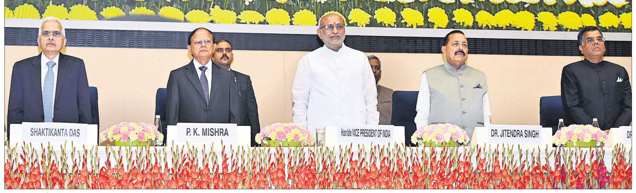
ଅଧ୍ୟକ୍ଷ ସିଦ୍ଧିଲ ସର୍ବିସ ଦେବ ଅବସରରେ ନୂଆଦିଲ୍ଲୀର ବିଜ୍ଞାନ ଭବନରେ ମଙ୍ଗଳବାର ଅନୁଷ୍ଠିତ ଉପସରରେ ବାମରୁ ପ୍ରଧାନମନ୍ତ୍ରୀଙ୍କ ପୁତ୍ରଙ୍କ ସହିତ ଶକ୍ତିକାନ୍ତ ଦାସ ଏବଂ ପି.କେ. ମିଶ୍ର, ଉପରାଷ୍ଟ୍ରପତି ସି.ପି. ରାଧାକୃଷ୍ଣନ, କେନ୍ଦ୍ରମନ୍ତ୍ରୀ ଜିତେନ୍ଦ୍ର ସିଂ ପ୍ରଭୃତି ଯୋଗ ଦେଇଛନ୍ତି।