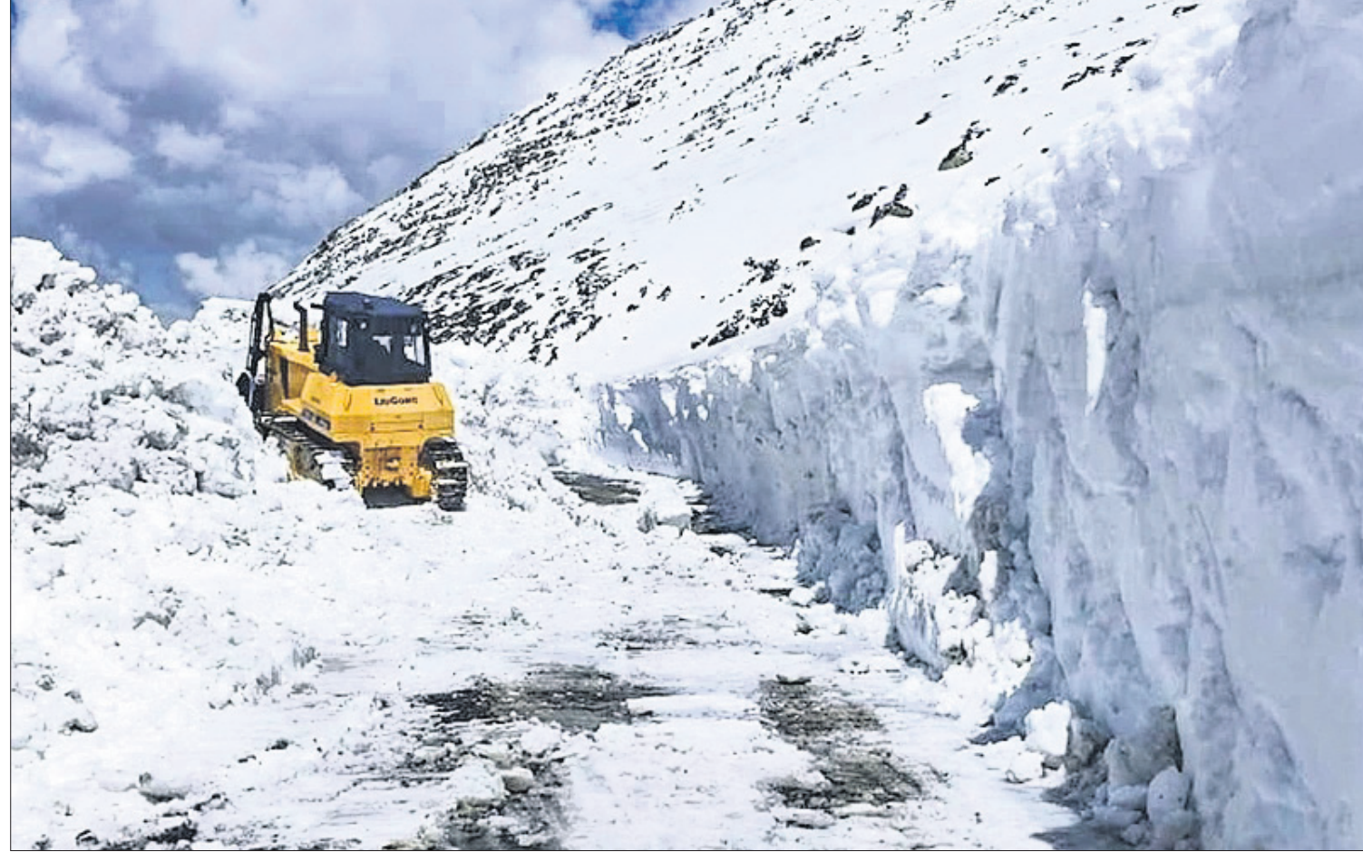
କମ୍ପ୍ୟୁଟର କିମ୍ପାରେ ଲିମା ଅନ୍ତର୍ଗତ ତାକସୁନ-କିମ୍ପାରେ ରାସ୍ତାରେ ଗାଡ଼ି ଚଳାଚଳ ସ୍ୱାଭାବିକ କରିବା ପାଇଁ ମଙ୍ଗଳବାର ବରଫ ସଫା କରାଯାଇଛି ।