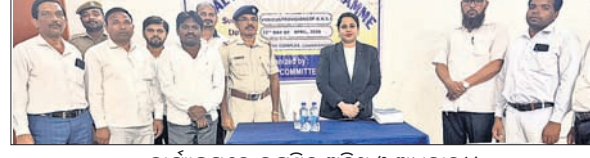
କାର୍ଯ୍ୟକ୍ରମରେ ଉପସ୍ଥିତ ଅତିଥି ଓ ଅଧିକାରୀ।