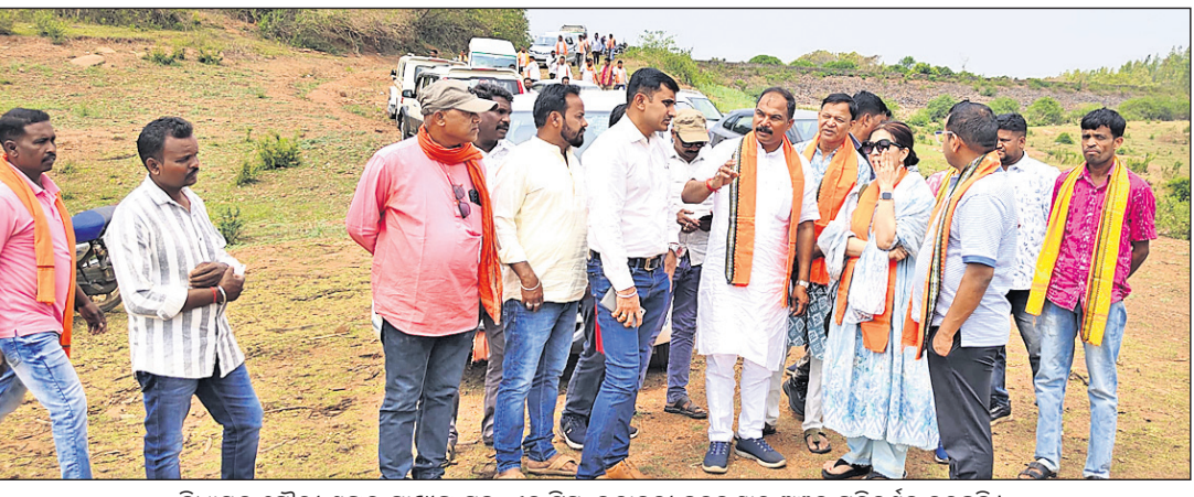
ବିଧାୟକ ଚୌରା ଶଙ୍କର ମାଝାଙ୍କ ସହ ଏକ ଚିନ୍ତା ଇନ୍ଦ୍ରାବତୀ ଜଳଭଣ୍ଡାର ଅଞ୍ଚଳ ପରିଦର୍ଶନ କରୁଛନ୍ତି।