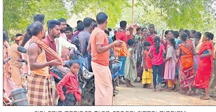
ଖରା ଯୋଗୁ ଗଛଛାଇରେ ଆଶ୍ରୟ ନେଇଥିବା ଖୁରୁରୁଡ଼ା ଗ୍ରାମବାସୀ।

ରାଜ୍ୟରେ ପ୍ରବଳ ଗ୍ରୀଷ୍ମ ପ୍ରବାହ ଜାରି ରହିଥିବା ବେଳେ ଜନଜୀବନ ଅସୁବିଧା ହୋଇପଡ଼ିଛି । ଏହାକୁ ଦୃଷ୍ଟିରେ ରଖି ଚଳିତ ବର୍ଷ କୌଶିଏ ପରିସ୍ଥିତିରେ ବିଦ୍ୟୁତ୍ କାଟ ନ କରିବାକୁ ସରକାର କଡ଼ା ନିର୍ଦ୍ଦେଶ ଦେଇଛନ୍ତି।