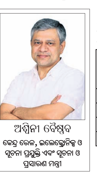
ଅଶ୍ୱିନୀ ଚୌଧୁରୀ କେନ୍ଦ୍ର ରେଳ, କଲେକ୍ଟୋରିକ୍ଟ ଓ ସୁଚନା ପ୍ରଯୁକ୍ତି ଏବଂ ସୁଚନା ଓ ପ୍ରସାରଣ ମନ୍ତ୍ରୀ

ପ୍ରତିଦିନ ସାରା ଭାରତରେ ୨୫,୦୦୦ରୁ ଅଧିକ ଟ୍ରେନ୍ ଚାଲିଥାଏ। ୧,୩୭,୦୦୦ କିଲୋମିଟରରୁ ଅଧିକ ଟ୍ରାକ୍ ନେବେଶନରେ ସେଗୁଡ଼ିକ ଦୈନିକ ୨ କୋଟିରୁ ଅଧିକ ଯାତ୍ରୀଙ୍କୁ ପରିବହନ କରିବା ସହିତ ବହୁ ପରିମାଣରେ ବୋଲାଇ, ଲୁହାପଥର, ଶସ୍ୟ, ଲକ୍ଷ୍ମୀ, ସିମେଣ୍ଟ ଏବଂ ଅନ୍ୟାନ୍ୟ ସାମଗ୍ରୀ ପରିବହନ କରନ୍ତି। ରେଳ ଟ୍ରାକ୍ ହେଉଛି ସେହି ଭିତ୍ତିଭୂମି, ଯାହା ଉପରେ ଏହି ସମଗ୍ର ବ୍ୟବସ୍ଥା କାମ କରେ। ଯେତେବେଳେ ଏହା ଭଲ ଅବସ୍ଥାରେ ଥାଏ, ଟ୍ରେନ୍‌ଗୁଡ଼ିକ ଅଧିକ ବେଗରେ ଓ ସୁରକ୍ଷିତ ଭାବରେ ଚାଲିଥାଏ। ଏହା ଭଲ ଅବସ୍ଥାରେ ନ ଥିଲେ, ଗତି ପ୍ରତିବନ୍ଧକ ଏବଂ ବିଳମ୍ବଠାରୁ ଆରମ୍ଭ କରି ସୁରକ୍ଷା ସହ ଜଡ଼ିତ ବିପଦ ପର୍ଯ୍ୟନ୍ତ ବିଭିନ୍ନ ଅହୁନିଧା ହୋଇଥାଏ। ଭଙ୍ଗା ରେଳ, ଜିଲ୍ଲା ଫିଟ୍ କିମ୍ବା ଗତି ପରସ୍ତ ଟ୍ରେନ୍ ଗତିକୁ ପ୍ରଭାବିତ କରିପାରେ।