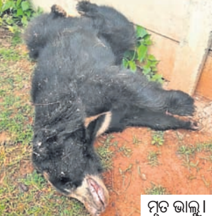
ମୃତ ଭାଲୁ। ପାପଡ଼ାହାଣ୍ଡି, ୨୨ ୧୪

ନବରଙ୍ଗପୁର ଜିଲ୍ଲା ପାପଡ଼ାହାଣ୍ଡି ବ୍ଲକ୍ ତୋଳାଗୁଡ଼ା ଦେଇଯାଇଥିବା ଭାରତମାଳା ରାସ୍ତାର ଦିଉନାଗୁଡ଼ା ନିକଟରେ ମଙ୍ଗଳବାର ରାତିରେ ଗାଡ଼ି ଧକ୍କାରେ ଏକ ଭାଲୁ ମୃତ୍ୟୁ ହୋଇଛି।