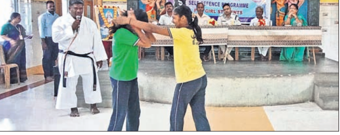
୨ ଛାତ୍ରୀଙ୍କୁ ଆତ୍ମରକ୍ଷା କୌଶଳ ତାଲିମ ଦିଆଯାଇଛି।