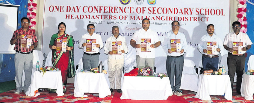
ଅତିଥି ପ୍ରମୁଖ ଉଦ୍ଦେଶ୍ୟ କରୁଛନ୍ତି।