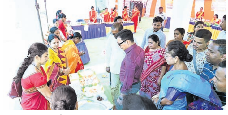
କାର୍ଯ୍ୟକ୍ରମରେ ଅତିଥି ଖାଦ୍ୟ ଖୁଲି ଦେଖୁଛନ୍ତି।

ମାଲକାନଗିରି ପ୍ରକଳ୍ପପ୍ରାୟ ପୋଷଣ ପଦ୍ଧତିରୁ ପ୍ରାୟ ୧୦ ପାଖାପାଖି ମା ଓ ଶିଶୁଙ୍କ ମଧ୍ୟରେ ପ୍ରସାର, ପୋଷଣ ସଚେତନତା ସୃଷ୍ଟି କରିବା ଓ ଅପହରଣ ନିରାକାର କରିବା କାର୍ଯ୍ୟକ୍ରମ ପୁଣ୍ୟ ଉଦ୍ଦେଶ୍ୟ ଥିଲା। ଏଥିରେ ପୁଣ୍ୟ ଅତିଥି ଉପକ୍ରମାପାଳ ବୃହସ୍ପତି ଶ୍ରୀ ଶ୍ରୀ, ବୃକ୍ଷ ଉପାଧ୍ୟକ୍ଷ ନିରଞ୍ଜନ ହାଲଦାର, ଅତିରିକ୍ତ ଜିଲ୍ଲା ସମାଜ ମଙ୍ଗଳ ଅଧିକାରୀ, ସଚେତନତା ପ୍ରୋଗ୍ରାମ ଅଧିକାରୀ ଓ ଆଦିଭବନମାଳିକା ଡିପ୍ଟିମ୍ବି ପ୍ରୋଗ୍ରାମ ପକ୍ଷରୁ ରାଜାରାମ ଶତପଥୀ ପ୍ରମୁଖ ଯୋଗଦେଇଥିଲେ। ମାଲକାନଗିରି ଶିଶୁ ବିକାଶ ପ୍ରକଳ୍ପ ଅଧିକାରୀ ରେଖା ଶୁକ୍ଳା