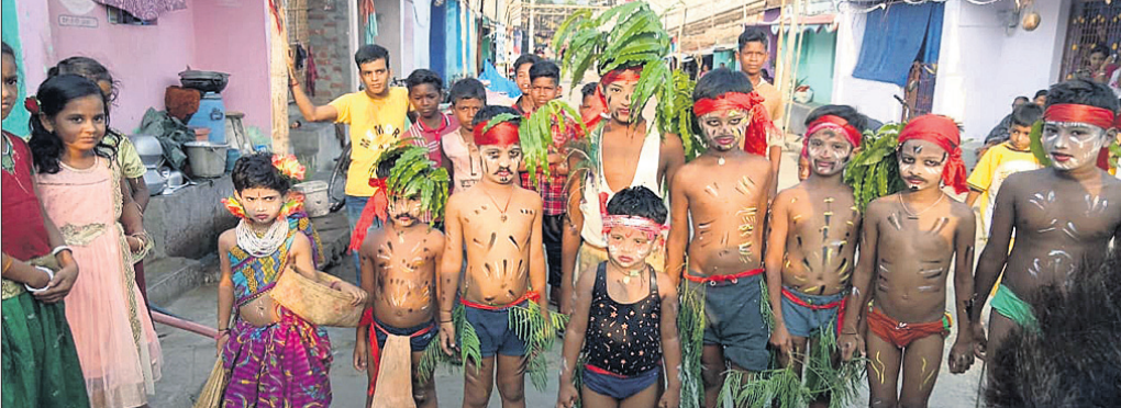
ମା'ଠାକୁରାଣୀଙ୍କ ପୂଜାରେ ଆଦିବାସୀ ବେଶଭୂଷାରେ ସଜିତ ପିଲାମାନେ।