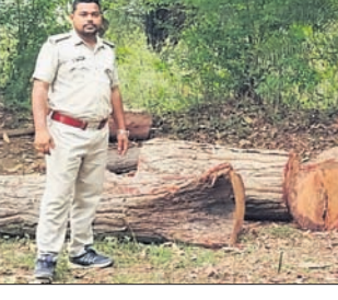
ରାସୋଳ, ୨୨୧୪ (ସରୋଜ ମିଶ୍ର)

ଦେଶାନ୍ତରାଳ ଜିଲ୍ଲା ହିନ୍ଦୋଳ ରେଞ୍ଜ ରାସୋଳ ଅଞ୍ଚଳରୁ ବିପୁଳ ପରିମାଣର କାଠ ଜବତ ହୋଇଛି। ହିନ୍ଦୋଳ ରେଞ୍ଜର ଡ୍ରିଗ୍ମାଟନ ଦେହୁରାଙ୍କ ନେତୃତ୍ୱରେ ଏକ ଟିମ୍ ମଙ୍ଗଳବାର ସନ୍ଧ୍ୟାରେ ରାସୋଳ ବିରିପୁରସାହି ଆୟତନରୁ ୪୦୦୦ ଶାଳକାଠ ଓ ବୁଧବାର ସକାଳୁକଳିକାପାଳ ପୁରାପାଳ ସାହିରୁ ୧୦୦୦୦ ଶାରୁଆନ ପଟା ଜବତ କରିଛନ୍ତି। ଏହି ଘଟଣାରେ କାହାକୁ ଚିରଫ କରାଯାଇ ନ ଥିବା ବେଳେ ସମସ୍ତ କାଠ ରାସୋଳ ବିରେରେ ରଖାଯାଇଛି ବୋଲି ରେଞ୍ଜର କହିଛନ୍ତି।