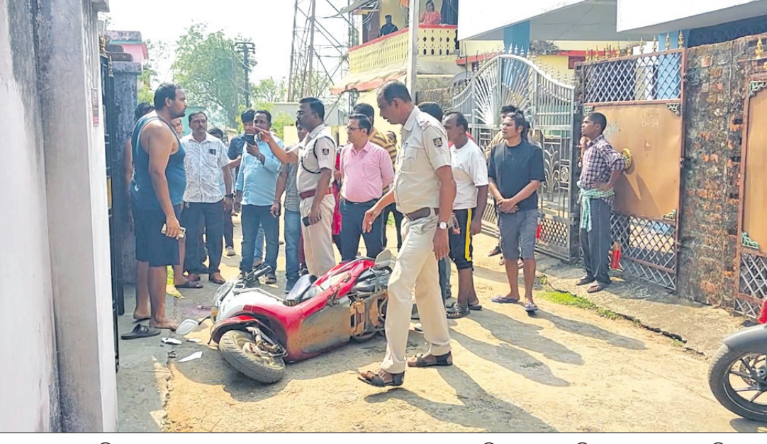
ଦେଶାନ୍ତରାଳ ଜିଲ୍ଲା କାମାକ୍ଷାନଗର ଅଞ୍ଚଳରେ ଜନଗଣ ଆଧୁନିକୀକୃତ କରିବା ପରେ ପୋଲିସ୍ ପହଞ୍ଚି ତଦନ୍ତ କରୁଛି।

ଆବାସ ଯୋଜନାରେ ଦେଶାନ୍ତରାଳ ଜିଲ୍ଲା ପରିଷଦ ତୃତୀୟସ୍ଥାନ ଅଧିକାର କରିଥିବା ବେଳେ କାମାକ୍ଷାନଗର ବ୍ଲକ୍ ବାଙ୍କୁଆଳ ଗ୍ରାମପଞ୍ଚାୟତ ତୃତୀୟ ସ୍ଥାନ ଅଧିକାର କରିଛି । ପ୍ରଥମସ୍ଥାନ ଅଧିକାର କରିଥିବା ହିନ୍ଦୋଳ ବ୍ଲକ୍ ୧୦ଲକ୍ଷ ଟଙ୍କା ଅର୍ଥରାଶି ପୁରସ୍କାର ବାବଦକୁ ମିଳିବାରୁ ରହିଥିବା ବେଳେ ତୃତୀୟସ୍ଥାନ ଅଧିକାର କରିଥିବା ଦେଶାନ୍ତରାଳ ଜିଲ୍ଲା ପରିଷଦକୁ ୫ଲକ୍ଷ ଓ ବାଙ୍କୁଆଳ ଗ୍ରାମପଞ୍ଚାୟତକୁ ୩ଲକ୍ଷ ଟଙ୍କା ମିଳିବ ବୋଲି ଜଣାପଡ଼ିଛି।