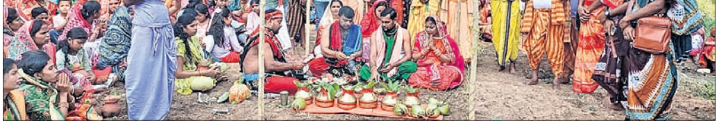
କଳସ ଶୋଭାଯାତ୍ରା ପାଇଁ ପ୍ରସ୍ତୁତି ଚାଲିଛି।

ଜଳସେଚନ ପ୍ରକଳ୍ପ କାର୍ଯ୍ୟକାରୀ କରିବା ପାଇଁ ଦାମ୍‌ବର୍ଷ ଧରି ଦାବି କରାଯିବା ସତ୍ତ୍ୱେ ସରକାର ପଦକ୍ଷେପ ନେଉନାହାନ୍ତି। ଶିଳ୍ପ ପ୍ରତିଷ୍ଠା ପାଇଁ ଯେତିକି ଜଳସେଚିତ ଚାଷ ଜମି ଅଧିଗ୍ରହଣ ହେବ, ସେତିକି ଅଣଜଳସେଚିତ ଚାଷ ଜମିକୁ ଜଳସେଚନ ପାଇଁ ଶିଳ୍ପସଂସ୍ଥା ପାଣି ପ୍ରଦାନ କରିବା ଧର୍ମକୁ ଆଖିଠାର ସଦୃଶ ବୋଲି କମିଟି ପକ୍ଷରୁ କୁହାଯାଇଛି। କେବଳ କମିଟି ପକ୍ଷରୁ କୁହାଯାଇଛି। କେବଳ କମିଟି ପକ୍ଷରୁ କୁହାଯାଇଛି।