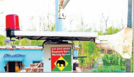
ଦେଶାନ୍ତରାଳ, ୨୨୧୪ (ରତନ ନାୟର)

ହାତୀ ଉପଦ୍ରବରୁ ରକ୍ଷା ପାଇଁ ବନ ବିଭାଗ ଓ ପ୍ରଶାସନର ପ୍ରସ୍ତୁତି