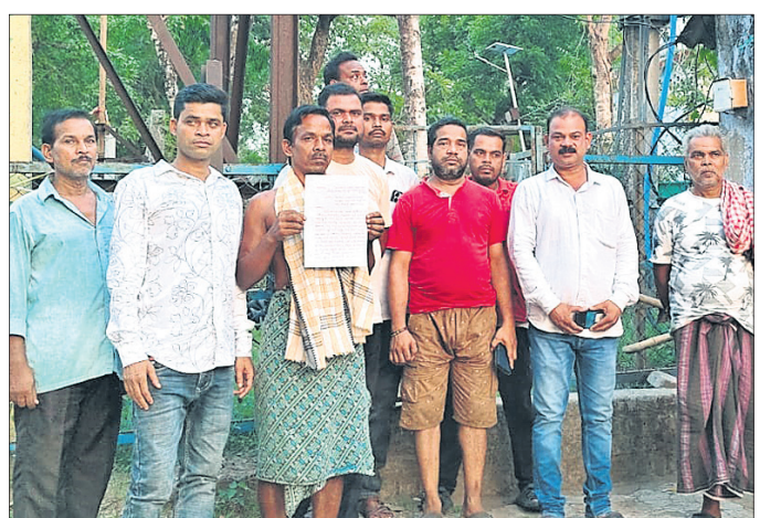
ସମସ୍ୟା ସମ୍ପର୍କରେ ଅଭିଯୋଗ କରିବାକୁ ଆସିଥିବା ମହାଧରପୁର ଗ୍ରାମବାସୀ।