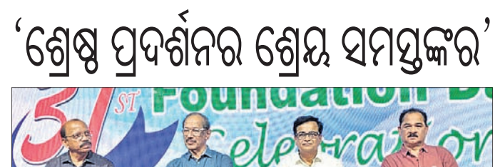
‘ଶ୍ରେଷ୍ଠ ପ୍ରଦର୍ଶନର ଶ୍ରେୟ ସମସ୍ତଙ୍କର’