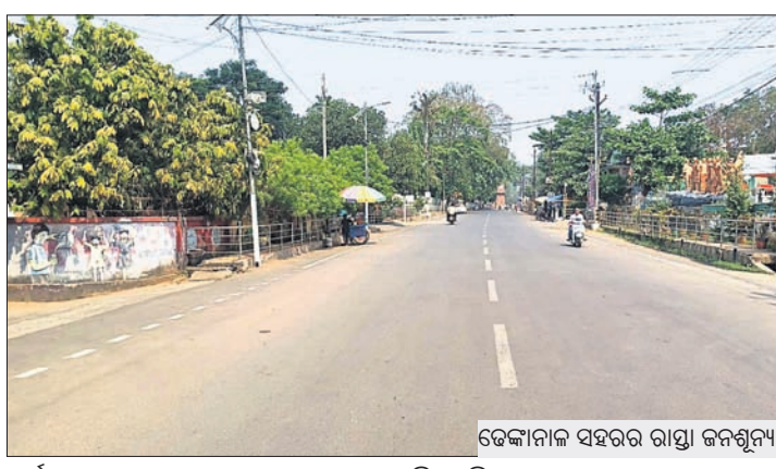
ଦେଶାନ୍ତରାଳ ସହରର ରାସ୍ତା ଜନଗୁଣ୍ଠ

ଅନୁଗୋଳ ଜିଲ୍ଲା ତାଳଚେର ରୁକ୍ମ ଚାଉଳପାଳ ରେଳ ଫାଟକ ନିକଟ ଧାରଣାରୁ ଜଣେ ମୃତଦେହ ଜବତ ହୋଇଛି। ମଙ୍ଗଳବାର ରାତିରେ କୌଣସି ଏକ ଟ୍ରେନ୍‌ରୁ ଖସିପଡ଼ି ତାଙ୍କର ମୃତ୍ୟୁ ହୋଇଥିବାର ରେଳଠାରେ ପୋଲିସ୍ ଅନୁମାନ କରିଛି। ମୃତଦେହ ବୟସ ପ୍ରାୟ ୨୮ରୁ ୩୦ ବର୍ଷ ମଧ୍ୟରେ ହୋଇଥିବାବେଳେ ସେ ଧୂସର ରଙ୍ଗର ଜିନ୍ସ ପ୍ୟାଣ୍ଟ ଏବଂ ସବୁଜ ଏବଂ ଧଳା ରଙ୍ଗର ଷ୍ଟ୍ରିପ୍ ସାର୍ଟ ପିନ୍ଧିଛନ୍ତି। ବାମ ହାତରେ ଗୋଟିଏ ଗାଠୁ ରହିଛି। ପୋଲିସ୍ ମୃତଦେହ ଜବତ କରିବା ସହ ପ୍ରାରମ୍ଭିକ ତଦନ୍ତ ପରେ ଅନୁଗୋଳ ମେଡିକାଲକୁ ବ୍ୟବହାର ପାଇଁ ପଠାଇଦେଇଛି।