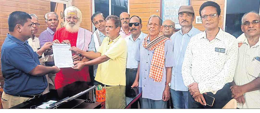
ଗୈଆ, ୨୨୧୪ (ବିଶ୍ୱ ମୋହନ ସାହୁ)

ଦେଶାନ୍ତରାଳ ଜିଲ୍ଲା ଯୋରନ୍ଦା ଆଞ୍ଚଳିକ କର୍ମଚାରୀ ସଂଘ ପକ୍ଷରୁ ପ୍ରଧାନମନ୍ତ୍ରୀ ଓ ମୁଖ୍ୟମନ୍ତ୍ରୀଙ୍କ ଉଦ୍ଦେଶ୍ୟରେ ମଙ୍ଗଳବାର ଦୁଇଟି ସ୍ମାରକପତ୍ର ବିଡ଼ଓଙ୍କୁ ଜରିଆରେ ପ୍ରଦାନ କରାଯାଇଛି । ଆଞ୍ଚଳିକ କର୍ମଚାରୀ ରାଉତଙ୍କ ସମେତ ଅନେକ ବ୍ୟକ୍ତି ଶେଷ ଦର୍ଶନକରି ଶ୍ରଦ୍ଧାଞ୍ଜଳି ଅର୍ପଣ କରିଥିଲେ।