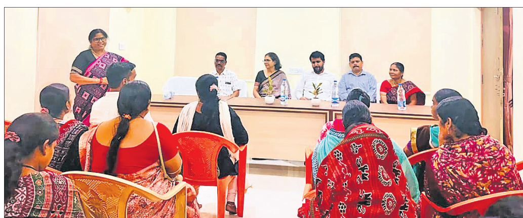
ବୈଠକରେ ରାଜ୍ୟ ଜଳ ସମ୍ପଦ ବିଭାଗ ପ୍ରମୁଖ ଶାସନ ସଚିବ, ଜିଲ୍ଲାପାଳ ଓ ଅନ୍ୟମାନେ।