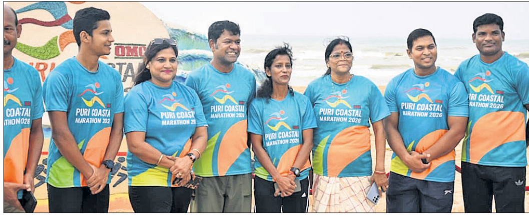
ପୁରୀ ରୁ ଫୁଲ ବିକରେ ଉପସ୍ଥିତ ରାଜ୍ୟର କିନ୍ଦରୀ କ୍ରୀଡ଼ାବିତ୍ ।