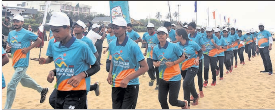
ସେତେବେଳେ ପୁଣି ପାଇଁ ପୁରୀ ବିକରେ ରୁଧିର ଅନୁଷ୍ଠିତ ମାରାଥନ।