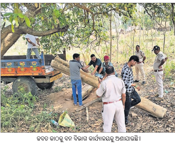
ଜବତ କାଠକୁ ବନ ବିଭାଗ କାର୍ଯ୍ୟକଳାପକୁ ଆଣିଯାଇଛି ।