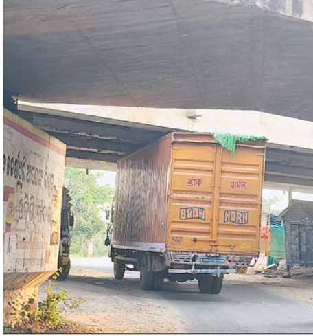
ଯାତାୟାତ କରିଥାଏ। ଏହି ରାସ୍ତା ଦେଇ ଡକ୍ସୁଦି ଗ୍ରାମରେ ଯାତାୟାତ କରାଯାଏ।

୧୪୯୪) ନୟର ବିଶିଷ୍ଟ ଟ୍ରେଲର ଅପରାଧ ଧରାରେ ଅତିକ୍ରମ କରିବା ସମୟରେ ଏହାର ଉପର ଭାଗଜାତୀୟ ରାଜପଥରେ ନିର୍ମାଣାଧୀନ ପୋଲରେ ଲାଗିଥିଲା। ଏଠାରେ ଧକ୍କା ଘଟଣା ଘଟିଥିଲା।