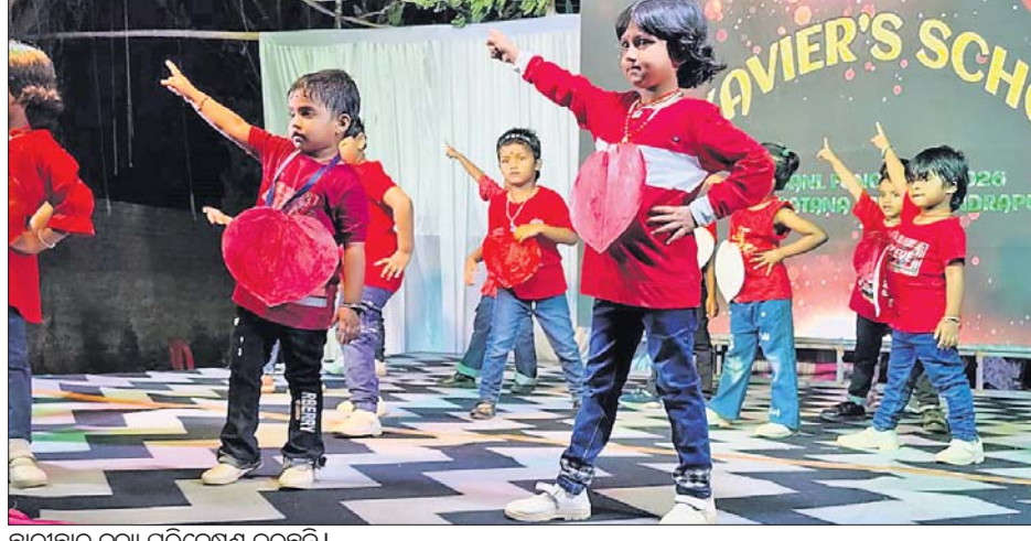
କଣ୍ଠଶୋଳା, ୨୨୧୪ (ପ୍ରଦୀପ୍ତ କୁମାର ଦୁଷ୍ଟ): ଛାତ୍ରଛାତ୍ରୀମାନଙ୍କୁ ନୃତ୍ୟ ପରିବେଷଣ କରୁଛନ୍ତି।

ଖାଦ୍ୟନରେ ଅଧିକ ଯାନ୍ତ୍ରିକ ବ୍ୟବହାର ଯୋଗୁଁ ସେଠାରେ ରୋଜଗାର ମଧ୍ୟ ପାଉନାହାନ୍ତି। ଏହାସହ ରାଜ୍ୟ ବାହାର ଠିକାସଂସ୍ଥା କରିଆରେ ଅଣଓଡ଼ିଆଙ୍କୁ ଅଧିକ ନିଯୁକ୍ତି ମିଳୁଛି। ଏଥିଯୋଗୁଁ ପରିବାରର ପୁରୁଷମାନେ ରାଜ୍ୟ ବାହାରକୁ ଯାଇ ଖିରିପାଳୁ ବାଧ୍ୟ ହେଉଛନ୍ତି।