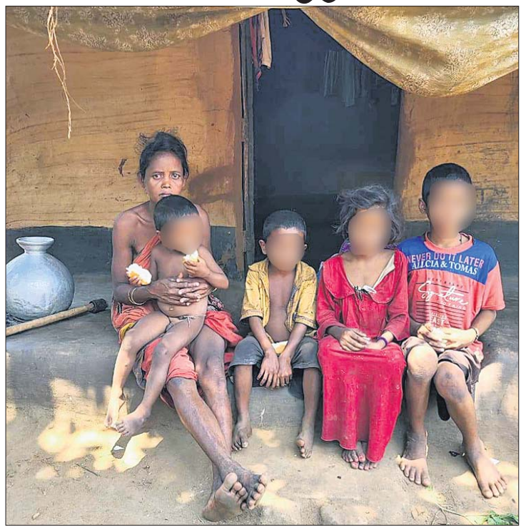
ସାମୁଦ୍ରିକ ପ୍ରଧାନଙ୍କ ପ୍ରାଣ ଓ ପିଲାମାନେ।

ଯାଜପୁର ଜିଲ୍ଲା ସୁକିନ୍ଦା ବ୍ଲକ୍ ଚିଲୁଡ଼ିପାଳ ପଞ୍ଚାୟତ ନଗଡ଼ା ଗ୍ରାମରେ ଶିଶୁ ମୃତ୍ୟୁ ଘଟଣା କାହାକୁ ଅଛପା ନାହିଁ। ୨୦୧୬ ଲୁଲାଇରେ ଏହି ଖବର ପ୍ରଚାରିତ ହେବା ପରେ ରାଜ୍ୟ ସରକାରଙ୍କ ପକ୍ଷରୁ ଏକାଧିକ ଯୋଜନା ନଗଡ଼ାରେ ଓକାଡ଼ି ଦିଆଯାଇଥିଲା।