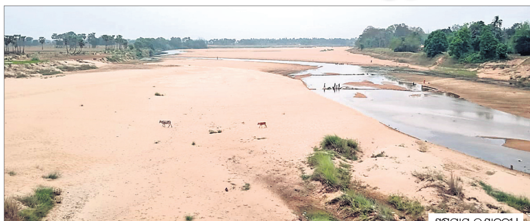
ଶୁଷ୍କପ୍ରାୟ ଲୁଣାବଦୀ ।

■ ୧୦ ହଜାରରୁ ଊର୍ଦ୍ଧ୍ୱ ନିଳକୂପରୁ ବାହାରିଛି ଲୁଣିପାଣି ■ ଟ୍ୟାପ୍ ପାଣି ସଂଯୋଗ ଏବେ ବି ସ୍ୱପ୍ନ ■ ଭୂତଳ ଜଳ ରିଚାର୍ଜ ଯୋଜନାର କାର୍ଯ୍ୟକାରୀ ନାହିଁ