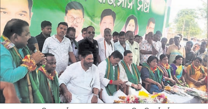
ବନ୍ଧୁ ମିଳନ କାର୍ଯ୍ୟକ୍ରମରେ ଯୋଗଦେଇଥିବା ବିଜେଡି କର୍ମୀକର୍ତ୍ତା ।