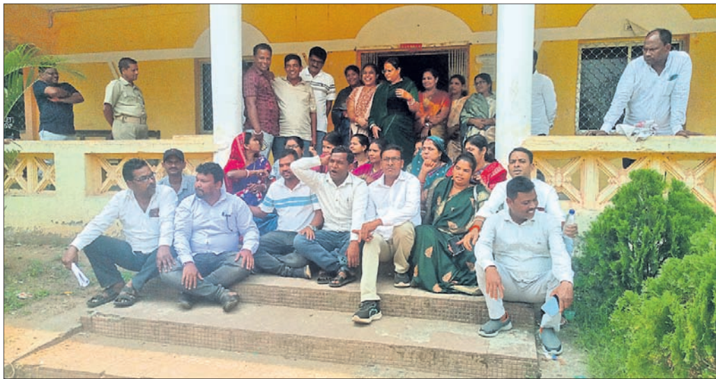
କକ୍ଷତ୍ୟାଗ କରି ପାହାଚଠାରେ ସମିତି ସଭ୍ୟ ଓ ସରପଞ୍ଚ ଧାରଣା ।

ନୂଆଗାଁ ପଞ୍ଚାୟତ ସମିତି ଦ୍ୱାଦଶ ସାଧାରଣ ଅଧିବେଶନ ■ ବିତିଓଙ୍କ ବୁଝାଶୁଝା ପରେ ଫେରିଲେ ■ ଅସନ୍ତୋଷ ବ୍ୟକ୍ତି କରି କକ୍ଷ ତ୍ୟାଗ କଲେ ସୋରଡ଼ା ସମିତି ସଭ୍ୟ