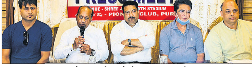
ଚୁର୍ଣ୍ଣମେଷ୍‌ ସମ୍ପର୍କରେ କର୍ମକର୍ମୀମାନେ ସୂଚନା ଦେଉଛନ୍ତି ।