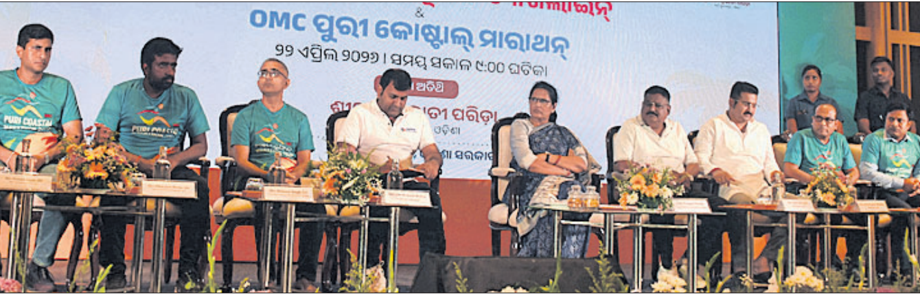
ପୁରୀରେ ରୁଧିର କୋଷ୍ଠାଳ ମାରାଥନର ଲୋଗୋ ଓ ଟ୍ୟାଗ୍ ଲାଇନ୍ ଉନ୍ମୋଚନ ଅବସରରେ ଉପସ୍ଥାପନା ପ୍ରକାଶ ପରିଡ଼ା ଓ ଅନ୍ୟ ଅତିଥିବୃନ୍ଦ ।