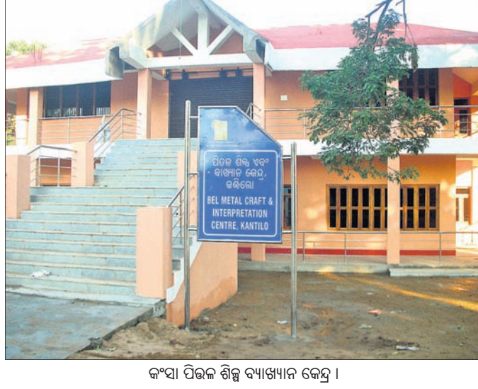
କଂସା ପିତ୍ତଳ ଶିଳ୍ପ ବ୍ୟାଖ୍ୟାନ କେନ୍ଦ୍ର ।

ଉପଭୋଗ କରୁଥିବା ଜଣାପଡ଼ିଛି । ବିଭିନ୍ନ ଯାନିଯାତ୍ରା, ବିବାହ, ବ୍ରତ କାର୍ଯ୍ୟ ସଂପନ୍ନ ହେବାପରେ ବିଭାଗ ଦାକ୍ଷିଣ୍ୟରେ ରହିଛି ଓ ପର୍ଯ୍ୟଟନମାନଙ୍କ ସ୍ୱାଗତ ଶୈଳୀରେ ପାଇଁ ବ୍ୟବହାର କରାଯାଇ ଦେବୋତ୍ତର ବିଭାଗ ଅର୍ଥ ଆଦାୟ କରୁଥିବା ଜଣାପଡ଼ିଛି । ଫଳରେ ଯେଉଁ ଲକ୍ଷ ନେଇ ଏହି ପ୍ରକଳ୍ପଟି ନିର୍ମାଣ କରା ଯାଇଥିଲା, ଏହା ତା'ର ପ୍ରକୃତ ଲକ୍ଷ୍ୟରୁ ଦୂରରେ ଯାଉଛି । ଏଠାରେ ଥିବା ଏକ କୋଠାରେ କଂସା