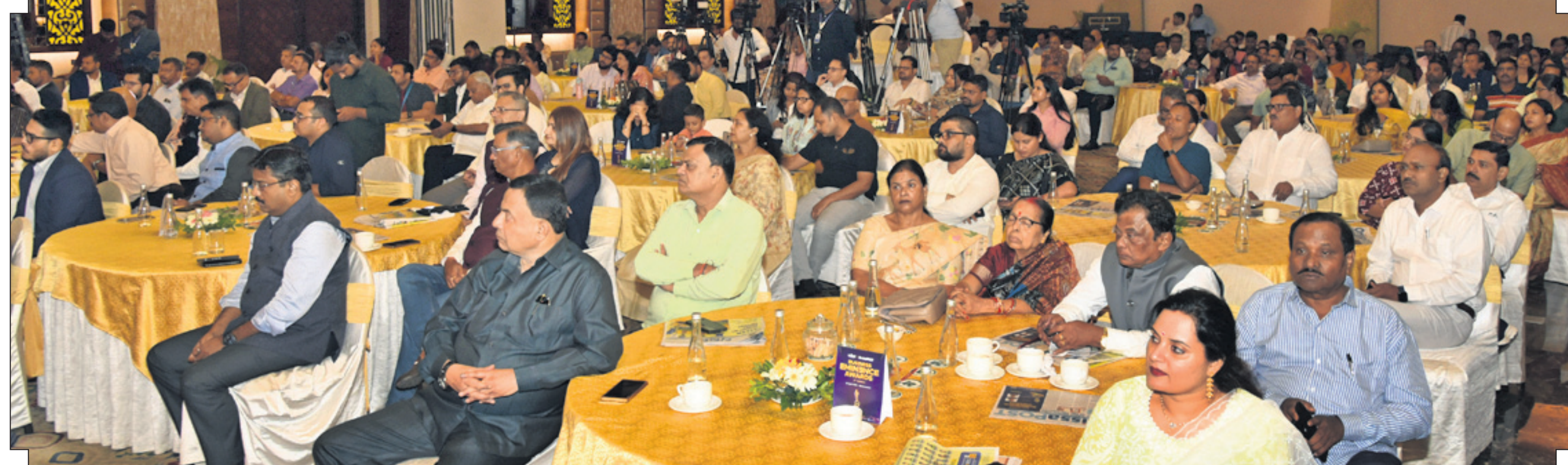
ଧରିତ୍ରୀ ଏବଂ ଓଡ଼ିଶା ପୋଷ୍ଟ ପକ୍ଷରୁ ଭୁବନେଶ୍ୱର ସ୍ଥିତି ପ୍ରତିଯୋଗୀରେ ଆୟୋଜିତ 'ବିଜ୍ଞାନେତ୍ସ ଏମିନେନ୍ସ ଆୱାର୍ଡ' ପ୍ରଦାନ କାର୍ଯ୍ୟକ୍ରମରେ ଉପସ୍ଥିତ ମାନ୍ୟବର ବ୍ୟକ୍ତି।