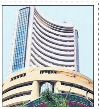
ବିଏସ୍‌ଇ ସେନ୍‌ସେକ୍ସ ୭୭,୬୬୪ (-୮.୫୨)

ରାଷ୍ଟ୍ରୀୟ ଟେକ କମ୍ପାନୀଗୁଡ଼ିକ ମୂଲ୍ୟବୃଦ୍ଧି କରି ନ ଥିଲେ ମଧ୍ୟ ଆଗାମୀ ଦିନରେ ଆଉ କିଛି ସହିବାକୁ ସମର୍ଥନ ହେବେ ନାହିଁ ଏବଂ ମୂଲ୍ୟବୃଦ୍ଧି କରିବାକୁ ବାଧ୍ୟ ହେବେ ବୋଲି କୋଟକ ଇନ୍‌ଷ୍ଟିଚ୍ୟୁଟିନାଲ ଇକ୍ସପର୍ଟ୍‌ମେଣ୍ଟ ମତ ଦେଇଛନ୍ତି।