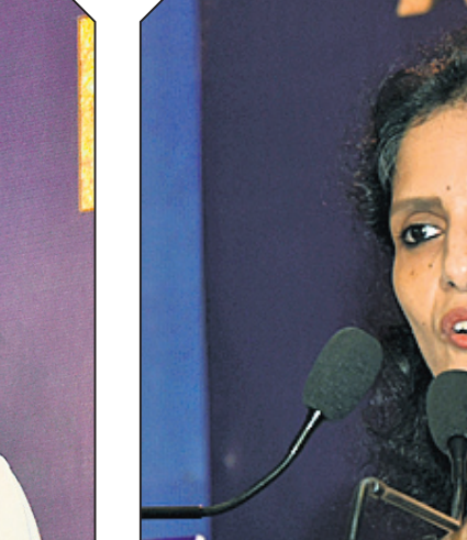
ଧରିତ୍ରୀ ଏବଂ ଓଡ଼ିଶା ପୋଷ୍ଟର ପୁଞ୍ଜ୍ୟ କାର୍ଯ୍ୟନିର୍ବାହୀ ଆଦ୍ୟାଶା ସରପଞ୍ଚା ସାଥରେ ଭାଷଣ ଦେଇଛନ୍ତି।