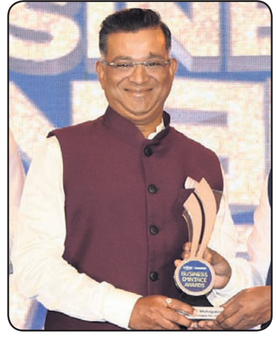
ପ୍ରିୟବର୍ତ୍ତୀ ମହାପାତ୍ର ଡିଓଡ଼େଲ