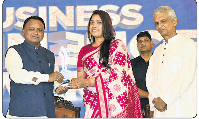
'ବିଜ୍ଞାନେତ୍ସ ଏମିନେନ୍ସ ଆୱାର୍ଡ' ର ଏକ୍ସ ପ୍ରଫରାଣର ସମ୍ପର୍କିତ ଉଦ୍ୟୋଗୀ