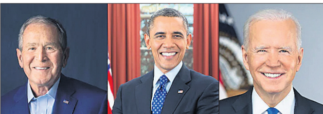
ଜର୍ଜ୍ ଜେର୍ଜ୍ ବୁଷ୍, ବାରାକ୍ ଓବାମା, ଜୋ ବାଇଡେନ୍

ଭଲ୍ ପ୍ରସ୍ତାବକୁ ଅଗ୍ରାହ୍ୟ କରିଦେଇଥିଲେ। ପୂର୍ବତନ ରାଷ୍ଟ୍ରପତିମାନେ ଇରାନ ବିରୋଧରେ ମୁକ୍ତ କରିବାକୁ ରାଜି ହୋଇ ନ ଥିଲେ, କାରଣ ଶାନ୍ତିପୂର୍ଣ୍ଣ ଉପାୟରେ ସମାଧାନର ବିକଳ ଶେଷ ହୋଇ ନ ଥିଲା। ଭଲ୍ ଭିଏଟ୍ନାମ ଏବଂ ଇରାନ ମୁକ୍ତ ସମାନ ଶିକ୍ଷା ଦେଇଥାଏ, ଯାହା ସେ ଭିଏଟ୍ନାମ ମୁକ୍ତ ଜଣେ ଅନୁଭବୀ ସୈନିକ ଭାବେ ପ୍ରତ୍ୟକ୍ଷ କହିଛନ୍ତି। ଦି ଲେଡ୍ ଶୋ' ଫ୍ରେ ଷ୍ଟିଫେନ୍ କୋଲବର୍ଡରେ ଉଦ୍‌ବୋଧନ ଦେଇ କେରି କହିଛନ୍ତି, ଇରାନ ବିରୋଧରେ ମୁକ୍ତ ପାଇଁ ନେତାନ୍ୟାହୁଙ୍କ ପ୍ରସ୍ତାବକୁ ଆମେରିକାର ପୂର୍ବତନ ରାଷ୍ଟ୍ରପତି ବାରାକ୍ ଓବାମା ଗ୍ରହଣ କରି ନ ଥିଲେ। ସେହିପରି ରାଷ୍ଟ୍ରପତି ଜର୍ଜ୍ ଜେର୍ଜ୍ ବୁଷ୍ ଏବଂ ଜୋ ବାଇଡେନ୍ ମଧ୍ୟ