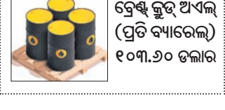
ବ୍ରେକ୍ ଫୁଟ୍ ଅଏଲ୍ (ପ୍ରତି ବ୍ୟାରେଲ୍) ୧୦୩.୬୦ ଡଲାର