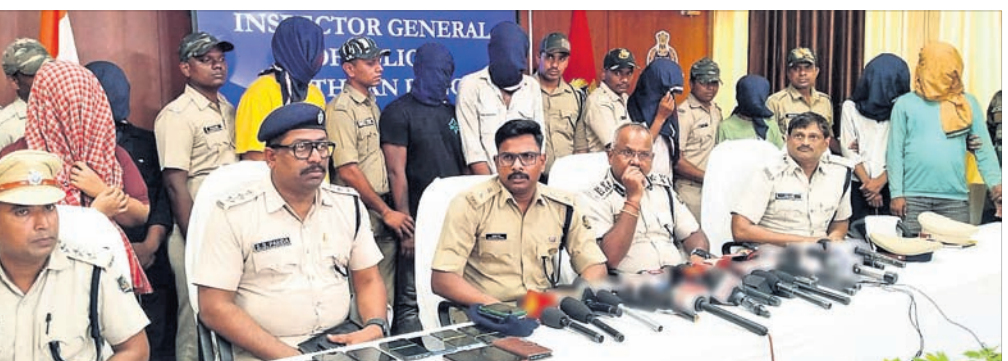
ଖବରଦାତା ସମ୍ମିଳନୀରେ ଆଇଡି ନୀତିଶେଖର ସୂଚନା ଦେଉଛନ୍ତି।

ଅପହୃତ ଜମି ବ୍ୟବହାରୀଙ୍କ ମୃତଦେହ ମିଳିବା ଘଟଣା ■ ଗୁଣିଗାରେଡ଼ି, ସମ୍ପତ୍ତି ଲୋଭ ହତ୍ୟାର କାରଣ, ୯ ଗିରଫ ବ୍ରହ୍ମପୁର, ୨୩୪ (ଭୁବନେଶ୍ୱର ସମ୍ବାଦ)