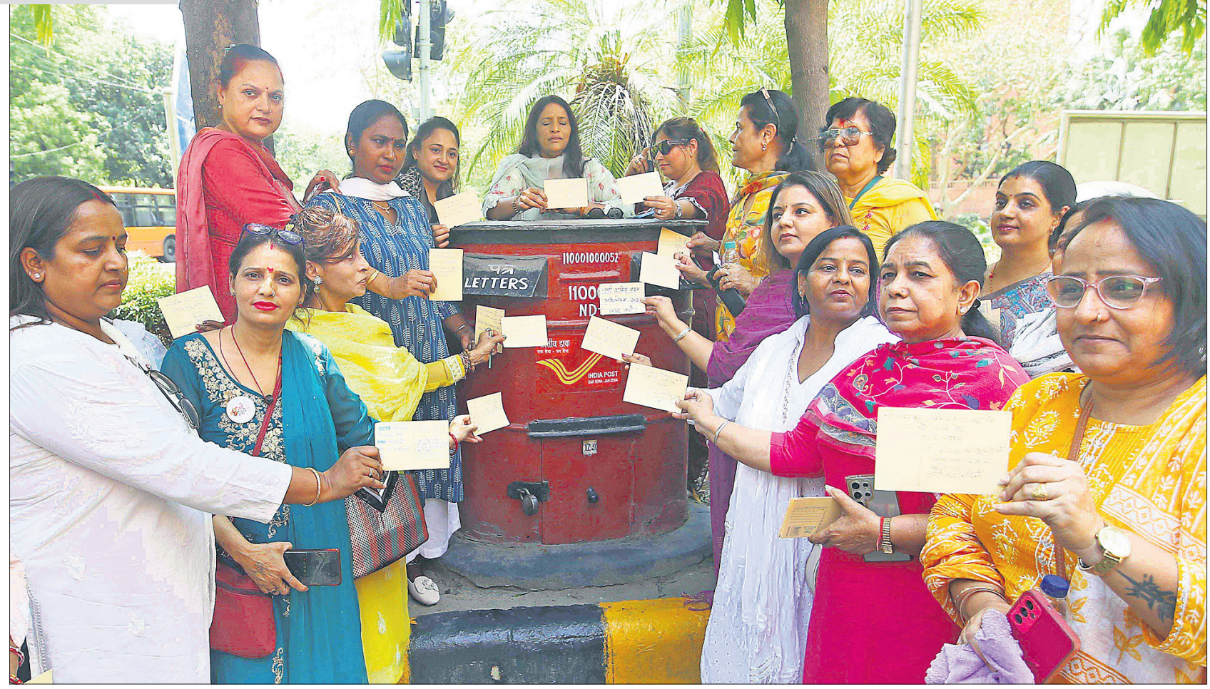
ନାରୀ ଶକ୍ତି ବନ୍ଦନ ଅଧିକାରୀଙ୍କ କାର୍ଯ୍ୟକାରୀତା ଦାବିରେ ମହିଳା କଂଗ୍ରେସ ସଦସ୍ୟମାନେ ଗୁରୁବାର ଦୁଆବିଲ୍ଲୀର ଗୋଲ୍ ଡାକ୍ ଖାନାଠାରେ ଏକାଠି ହୋଇ ପ୍ରଧାନମନ୍ତ୍ରୀଙ୍କୁ ଭେଦଶ୍ୟରେ ପୋଷ୍ଟକାର୍ଡ ପଠାଇଛନ୍ତି।