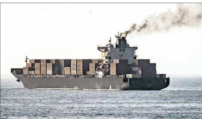
ପାଇଁ ଷ୍ଟେଟ୍ ଅଫ୍ ହର୍ମୁଜରୁ ବନ୍ଦ ରଖାଯିବ ବୋଲି ତେହରାନ କହିଛି। ଆମେରିକାର ଧନ ଆଗରେ ପୁଣି ନୋଇଁବା, ହର୍ମୁଜକୁ ଚଳାଚଳ ବାଟିକ ଲେଲି। ଆମେରିକା ଯେପର୍ଯ୍ୟନ୍ତ ଇରାନୀୟ ବନ୍ଦରଗୁଡ଼ିକୁ ଅବରୋଧ କରି ରଖୁଛି, ସେ ପର୍ଯ୍ୟନ୍ତ ଅନୁମୋଦିତ ଅଣୁ କେତେକ ଜାହାଜକୁ ବାନ୍ଦ ଦେଲେ ଅନ୍ୟ ସମସ୍ତ ଜାହାଜ

ଆମେରିକା ଓ ଇରାନ ମଧ୍ୟରେ ଶାନ୍ତି ଆଲୋଚନାକୁ ନେଇ ଅନିଶ୍ଚିତତା ଜାରି ରହିଥିବାବେଳେ ତେହରାନ ଗୁରୁବାର ପ୍ରଥମ ଥର ପାଇଁ ଷ୍ଟେଟ୍ ଅଫ୍ ହର୍ମୁଜରେ ଜାହାଜରୁ ଟୋଲ୍ ଆଦାୟ ଆରମ୍ଭ କରିଥିବା ସହର ଜଣେ ବରିଷ୍ଠ ଅଧିକାରୀ କହିଛନ୍ତି। ଇରାନ ଉପରେ ଆମେରିକା ଓ ଇସ୍ରାଏଲର ମିଳିତ ଆକ୍ରମଣ ଯୋଗୁ ସୃଷ୍ଟି ହୋଇଥିବା ଅସ୍ଥିରତା ବିଶ୍ଵ ଅର୍ଥନୀତିକୁ କ୍ରମାଗତ ଭାବେ କ୍ଷତି ପହଞ୍ଚାଇଥିବାବେଳେ ଅଣୋଲ୍ଡ ଟେଲ ଏବଂ ପ୍ରାକୃତିକ ଗ୍ୟାସ୍ ପରିବହନର ଗୁରୁତ୍ୱପୂର୍ଣ୍ଣ ସାମ୍ପ୍ରତିକ ପଥ