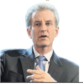
ଗୋତ ଡି. କୁନ୍ଦହୋଇ