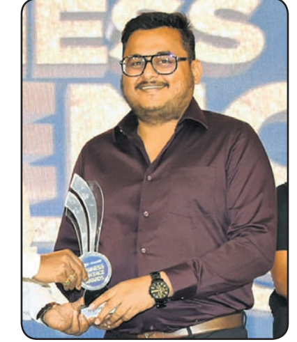
ପୁରୀ ପ୍ରିୟବର୍ତ୍ତନୀ ଗୋମାୟା ଏଗ୍ରୋ ପ୍ରା.ଲି.