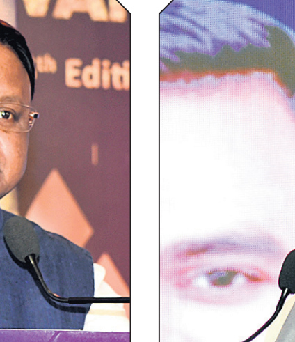
ପୁଞ୍ଜ୍ୟ ଅତିଥି ଭାବେ ଅଭିଭାଷଣ ଦେଖାଇଥିବା ପୁଞ୍ଜ୍ୟମନ୍ତ୍ରୀ ମୋହନ ଚରଣ ମାତ୍ରା।