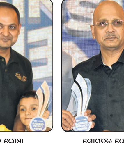
ସର୍ବତ୍ତ ଲୋଧା କରବୟା ଅପୋମୋବାଇଲ୍