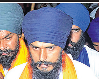
ହାରା ଗିରଫ ହେବା ପରେ ଅମ୍ବିତପାଲ୍ ୨୦୨୩ ଏପ୍ରିଲ ୨୩ରୁ ଦିବ୍ରୁଗଡ଼ କେନ୍ଦ୍ରୀୟ ଜେଲରେ ରହିଆସୁଛନ୍ତି।

୨୦୨୩ର ଅଜନାଲା ହିଂସା ମାମଲାରେ ପଞ୍ଜାବ ଏମ୍ପି ଅମ୍ବିତପାଲ୍ ହିଁ ଗୁରୁବାର ଗିରଫ କରାଯାଇଛନ୍ତି। ଅଜନାଲା ଥାନା ଆକ୍ରମଣ ସହ ଅମ୍ବିତପାଲ୍ ସମ୍ପୂର୍ଣ୍ଣ ଥିଲେ। ତାଙ୍କର ଏମ୍ପି ସ୍ୱତ୍ତ୍ୱ ହାକିତ ମିଆଦ ଶେଷ ହେବା ପରେ ପୁନର୍ବାର ଗିରଫ କରାଯାଇ ଦିବ୍ରୁଗଡ଼ ଜିଲ୍ଲା କର୍ମଚାରୀଙ୍କୁ କଟିଆରେ ଅଜନାଲା କୋର୍ଟରେ ହାଜର କରାଯାଇଥିଲା। ଏବେ ସେ ଦିବ୍ରୁଗଡ଼ କେନ୍ଦ୍ରୀୟ ଜେଲରେ ରହିବେ। ସୂଚନାଯୋଗ୍ୟ, ଏମ୍ପି ସ୍ୱତ୍ତ୍ୱ