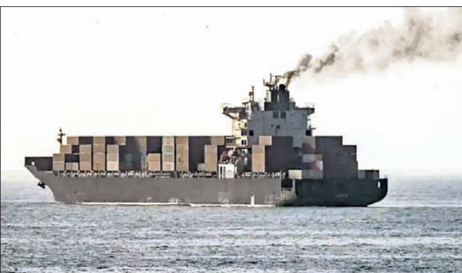
ପାଇଁ ସ୍ଵେଚ୍ଛା ସହ ହର୍ମୁଜରୁ ବନ୍ଦ ରଖାଯିବ ବୋଲି ତେହରାନ କହିଛି। ଆମେରିକାର ଧନକ ଆଗରେ ପୁଣି ନୋଇଁବା, ହର୍ମୁଜକୁ ଖୋଲିବା ଏବଂ ସମ୍ପୂର୍ଣ୍ଣ ସ୍ଵାଧୀନତାକୁ ସମର୍ଥନ କରିବା ପାଇଁ ଟ୍ରମ୍ପଙ୍କ ଦାବିକୁ ତେହରାନ ପ୍ରତ୍ୟାଖ୍ୟାନ କରିଦେଇଛି। ଗତ ୮ ତାରିଖରୁ ୨ ସପ୍ତାହବ୍ୟାପୀ ଅସ୍ଵାଭିଚାରିତ ଆରମ୍ଭ ହେବା ପରେ ଆକ୍ରମଣ

ସ୍ଵେଚ୍ଛା ସହ ହର୍ମୁଜରେ ଜାହାଜରୁ ଟୋଲ୍ ଇରାନର ଟୋଲ୍ ସଂଗ୍ରହ ଟେଲିକାମରେ ଆହୁରି ପ୍ରଭାବିତ କରିବ। ଆମେରିକା ରାଷ୍ଟ୍ରପତି ତୋନାଲ୍ ଟ୍ରମ୍ପ ଇରାନ ସହ ଅସ୍ଵାଭିଚାରିତ ଅବସ୍ଥା ଅନିଶ୍ଚିତତା କାଳ ପାଇଁ ବୁଝି କରିଥିଲେ ମଧ୍ୟ ଦ୍ଵିତୀୟ ପର୍ଯ୍ୟାୟ ଶାନ୍ତି ଆଲୋଚନାକୁ ନେଇ ଅନିଶ୍ଚିତତା ଜାରି ରହିଥିବାରୁ ଅନ୍ତର୍ଜାତୀୟ ବଜାରରେ ଟେଲିକାମ ବୁଝି ପାରିବ। ଇରାନ ଅଭାବରୁ ଅନେକ ସମ୍ପର୍କାଳାପକ କମାନ ରକାଚକ ବାଟିକ ଲେଇଣି। ଆମେରିକା ଯେପର୍ଯ୍ୟନ୍ତ ଇରାନୀୟ ବନ୍ଦରଗୁଡ଼ିକୁ ଅବରୋଧ କରି ରଖିଛି, ସେ ପର୍ଯ୍ୟନ୍ତ ଅନୁମୋଦିତ ଅଳ୍ପ କେତେକ ଜାହାଜକୁ ବାନ୍ଦ ଦେଲେ ଅନ୍ୟ ସମସ୍ତ ଜାହାଜ