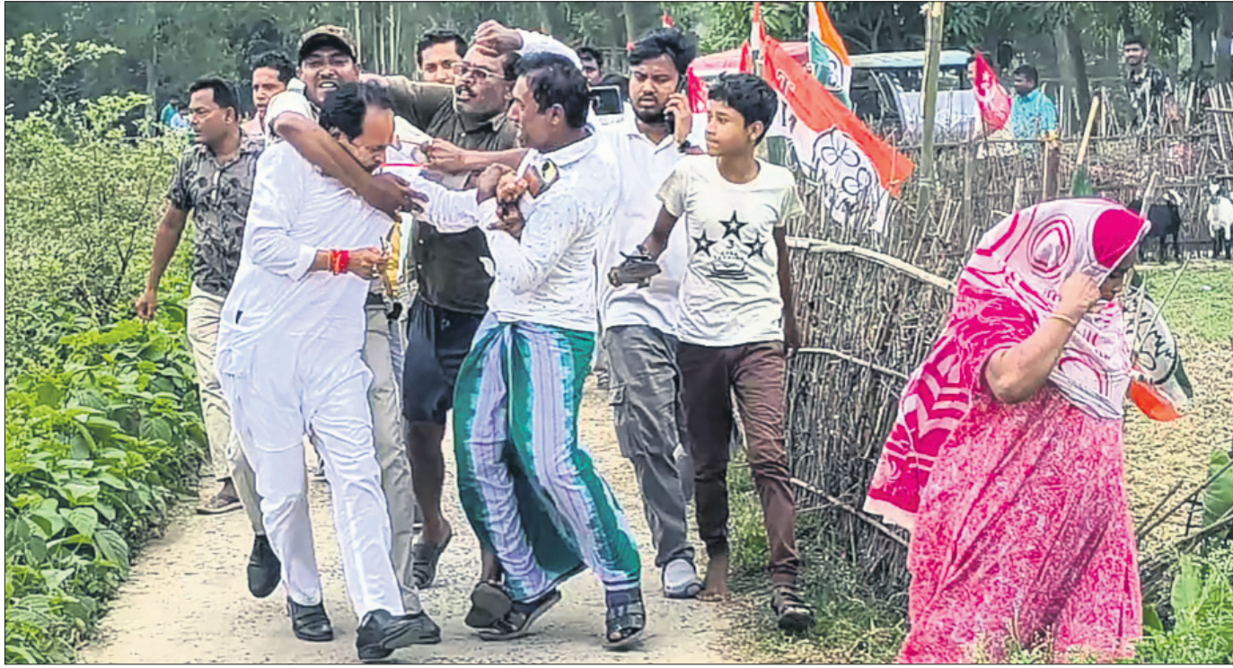
ପଶୁମରଙ୍ଗ ବିଧାନସଭା ନିର୍ବାଚନର ପ୍ରଥମ ପର୍ଯ୍ୟାୟ ମତଦାନ ବେଳେ ଗୁରୁବାର ଦକ୍ଷିଣ ଦିଗରୁ ଦିଶୁଥିବା ଝାରସୁଗୁଡ଼ା ପ୍ରାଥମିକ ସ୍ତରରୁ ସରକାରଙ୍କୁ ମାଡ଼ ମରାଯାଇଛି।

ଏବଂ ଏହାକୁ କର୍ମୀଙ୍କ ମଧ୍ୟରେ ସଂଘର୍ଷ ଚଳୁଥିବା ଏକ ଭିଡ଼ିଠାରୁ ଦେଖିବାକୁ ମିଳିଛି। ମତଦାନ ଚାଲିଥିବାବେଳେ ଦଳୀୟ କର୍ମୀ ଓ ପୋଲିସ୍ ମଧ୍ୟରେ ଉତ୍ତେଜନା ସୃଷ୍ଟି ହେବାକୁ ଦେଖିବାକୁ ମିଳିଛି।