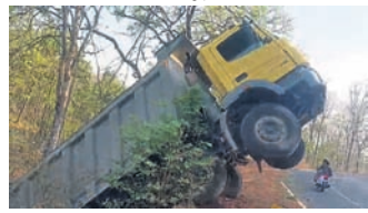
ବାଲିଗୁଡ଼ା, ୨୩୪ (ସଞ୍ଜୟ କୁମାର ପାଣିଗ୍ରାହୀ)

ବାଲିଗୁଡ଼ା ଥାନା ୪୧ ନଂ. ରାଜ୍ୟ ରାଜପଥର ପୁଖ୍ୟ ରାସ୍ତାର ଗଡ଼ଜାତ ନିକଟରେ ଗୁରୁବାର ଭାରସାମ୍ୟ ହରାଇ ଗାର୍ଡ଼ିଆଲରେ ଟିପ୍ପି ବୋହେଇ ହାଇଡ୍ରୋ ଝୁଲି ରହିଛି। ଚେବେ ଏଥିରୁ ଡ୍ରାଇଭର ବର୍ତ୍ତି ଯାଇଛନ୍ତି। ଚେବେ ଲଘୁଗାଁ ପରୁ ବାଲିଗୁଡ଼ା ଅଧିଗୁଡ଼ା ଟିପ୍ପି ବୋହେଇ ହାଇଡ୍ରୋ ଅଧିଗୁଡ଼ା ବେଳେ ହଠାତ୍ ସ୍ପେରିଟ୍ ଅଟକ ହୋଇଯାଇଥିଲା। ଫଳରେ ଡ୍ରାଇଭର ନିୟନ୍ତ୍ରଣ ହରାଇବା ପରେ ଗାର୍ଡ଼ିଆଲରେ ଝୁଲି ରହିଥିଲା। ସ୍ଥାନୀୟ ଲୋକେ ଘଟଣା ସ୍ଥଳରେ ପହଞ୍ଚି ଡ୍ରାଇଭରକୁ ହାଇଡ୍ରୋ ଉଦ୍ଧାର କରି ବାହାରକୁ ଆଣିଥିଲେ।