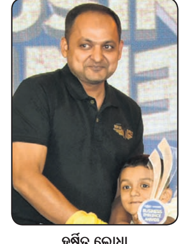
ସୋମନର ବେହେରା କେଟି ଗ୍ଲୋବାଲ୍ ସ୍କୁଲ