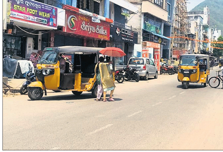
ଖରାଯୋଗୁ ଶୁନଶାନ ହୋଇପଡ଼ିଥିବା ପାରଳାଖେମୁଣ୍ଡିର ମୁଖ୍ୟବଜାର।