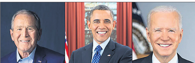
ଜର୍ଜ୍ ବୁଷ୍, ବାରାକ ଓବାମା, ଜୋ ବାଇଡେନ୍ କରାଯାଇଥିଲା ଯେ, ଶାସନ ବଦଳିବ, ଲୋକେ ବିପ୍ଳାବ କରିବେ, କିନ୍ତୁ କିଛି ଘଟଣା ନାହିଁ ବୋଲି ଇରାନ ପ୍ରେସ୍ ଚିତ୍ରି ଲେଖିଛି। ତେବେ ନେତାନ୍ୟାହୁ ଇରାନ ଆକ୍ରମଣ ପାଇଁ ଆମେରିକା ରାଷ୍ଟ୍ରପତି ତୋନାଲ୍ ଟ୍ରମ୍ପଙ୍କୁ ନିର୍ଦ୍ଦେଶ ଦେଇଛନ୍ତି, ଯାହାର ସର୍ବଶେଷ ରିପୋର୍ଟ ଦ୍ଵାରା ଗଠନ ପ୍ରକାଶ ପାଇଥିଲା। ଫେବୃଆରୀ ୧୧ରେ ସିଦ୍ଧିଶିଳ ଗୁମରେ ନେତାନ୍ୟାହୁ କହିଥିଲେ, ଇରାନର ବର୍ତ୍ତମାନ ସରକାର ଦୁର୍ବଳ ଏବଂ ଏହାକୁ ବଦଳାଯାଇପାରିବ। ସେ ଆମେରିକାକୁ ଇସ୍ରାଏଲ୍ ସହ ମିଶ୍ରି ଇରାନ ଶାସନ ପରିବର୍ତ୍ତନ ପାଇଁ ସାମରିକ ଅଭିଯାନରେ ସାମିଲହେବା ନିମନ୍ତେ ଟ୍ରମ୍ପଙ୍କୁ ମନାକରିବାରେ ସଫଳ ହୋଇଥିଲେ।

ଉକ୍ତ ପ୍ରସ୍ତାବକୁ ଅଗ୍ରାହ୍ୟ କରିଦେଇଥିଲେ। ପୂର୍ବତନ ରାଷ୍ଟ୍ରପତିମାନେ ଇରାନ ବିରୋଧରେ ମୁକ୍ତ କରିବାକୁ ରାଜି ହୋଇ ନ ଥିଲେ, କାରଣ ଶାନ୍ତିପୂର୍ଣ୍ଣ ଉପାୟରେ ସମାଧାନର ବିକଳ ଶେଷ ହୋଇ ନ ଥିଲା। ଉଭୟ ଭିଏଟ୍‌ନାମ ଏବଂ ଇରାନ ମୁକ୍ତ ସମାନ ଶିକ୍ଷା ଦେଇଥାଏ, ଯାହା ସେ ଭିଏଟ୍‌ନାମ ମୁକ୍ତ ଜଣେ ଅନୁଭବୀ ସୈନିକ ଭାବେ ପ୍ରତ୍ୟକ୍ଷ ଭାବେ ଜାଣିଛନ୍ତି ବୋଲି କେହି କହିଛନ୍ତି। କେରିକ୍ ଅତି ଲୁଚ୍‌ଲୁଚ୍ ଇରାନର ପ୍ରେସ୍ ଚିତ୍ରି ଶେୟାର କରିଛି। ନେତାନ୍ୟାହୁଙ୍କ ମୁକ୍ତ ପ୍ରସ୍ତାବକୁ ଆମେରିକାର ପୂର୍ବତନ ରାଷ୍ଟ୍ରପତି ବାରାକ ଓବାମା ଗ୍ରହଣ କରି ନ ଥିଲେ। ସେହିପରି ରାଷ୍ଟ୍ରପତି ଜର୍ଜ୍ ବୁଷ୍ ଏବଂ ଜୋ ବାଇଡେନ୍ ମଧ୍ୟ