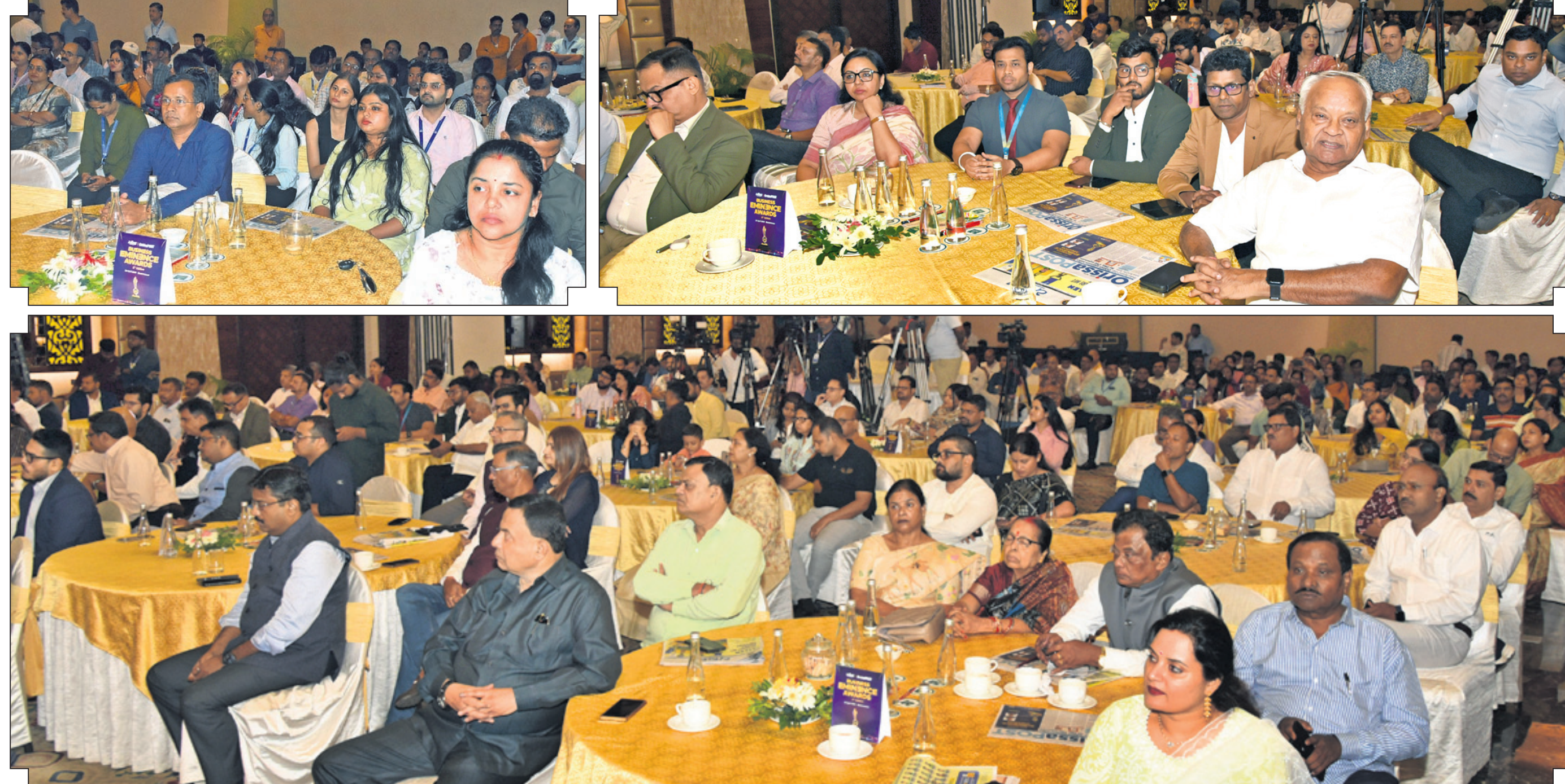
ଧରିତ୍ରୀ ଏବଂ ଓଡ଼ିଶା ପୋଷ୍ଟ ପକ୍ଷରୁ ଭୁବନେଶ୍ୱର ସ୍ଥିତି ପ୍ରତିଯୋଗୀରେ ଆୟୋଜିତ 'ବିଜ୍ଞାନେୟ ଏମିନେନ୍ସ ଆୱାର୍ଡ' ପ୍ରଦାନ କାର୍ଯ୍ୟକ୍ରମରେ ଉପସ୍ଥିତ ମାନ୍ୟଗଣ୍ୟ ବ୍ୟକ୍ତି ।