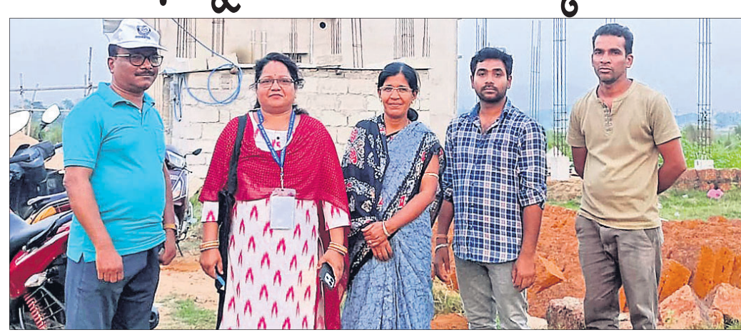
ଜନଗଣନାରେ ସାମିଲ ହୋଇଥିବା କର୍ମଚାରୀ ।

ନୟାଗଡ଼, ୨୩/୪ (ଲୋକନାଥ ମିଶ୍ର) ଭାରତ ସରକାରଙ୍କ ପ୍ରଥମ ପର୍ଯ୍ୟାୟ ଜନଗଣନାରେ ଗୃହଗଣନା ଆରମ୍ଭ ହୋଇଛି । ଚଳିତ ମାସ ୧୬ ତାରିଖରୁ ଆରମ୍ଭ ହୋଇଥିବା ଗୃହଗଣନା କାର୍ଯ୍ୟକ୍ରମ ୧୫ ତାରିଖ ପର୍ଯ୍ୟନ୍ତ ଚାଲିବ । ନୟାଗଡ଼ ମୁନିସିପାଲିଟି ଅଞ୍ଚଳ ଅନ୍ତର୍ଗତ ୧୬ ଖଣ୍ଡରେ ଚାଲିଛି ଗୃହଗଣନା କାର୍ଯ୍ୟ । ଗୃହଗଣନା କାର୍ଯ୍ୟ ପାଇଁ ୧୬ ଖଣ୍ଡକୁ ୫୮ ଗୃହ ଚାଲିବା କୁଳରେ ବିଭକ୍ତ କରାଯାଇ ୫୮ ଶିଖରୀ ଶିଖରୀ ଗଣନାକାରୀ