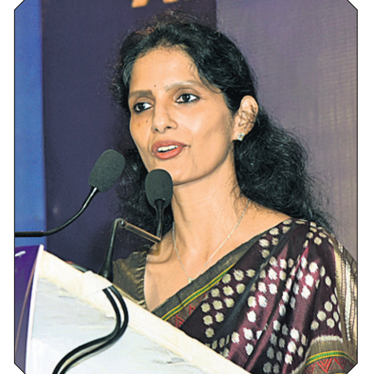
ଧରିତ୍ରୀ ଏବଂ ଓଡ଼ିଶା ପୋଷ୍ଟର ପୁଞ୍ଜ୍ୟ କାର୍ଯ୍ୟନିର୍ବାହୀ ଆଦ୍ୟାଶା ସରପଞ୍ଚା ସ୍ୱାଗତ ଭାଷଣ ଦେଇଛନ୍ତି ।