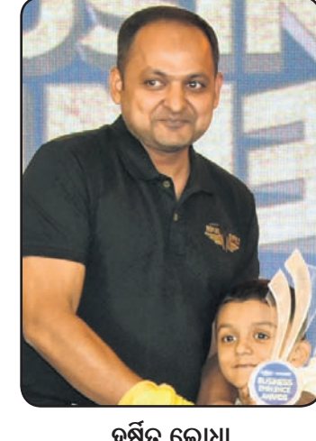
ସର୍ବତ୍ କୋଥା କରବ୍ୟା ଅପୋମୋବାଲ୍