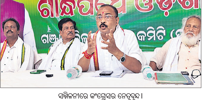
ସମ୍ମିଳନୀରେ କଂଗ୍ରେସର ନେତୃବୃନ୍ଦ।

ପ୍ରମୁଖ କହିଥିଲେ ଯେ, ଏହି ବିଲ କାଟ ଖାଇଯିବାରୁ ନରେନ୍ଦ୍ର ମୋଦି କଂଗ୍ରେସ ଉପରେ ବୋଧାତ୍ମକ କରିଛନ୍ତି। ମହିଳା ସଂରକ୍ଷଣ ବିଲ ପାରିତକୁ ନେଇ ତତ୍ତ୍ୱାନ୍ତ ଥିଲା। ଦେଶରେ ଗୋଟିଏ ନିର୍ବାଚନ ଚାଲିଛି। ଆସନ୍ତା ୨୯ ତାରିଖ କେନ୍ଦ୍ର ଓ ପଶ୍ଚିମବଙ୍ଗ ଗୁଡ଼ିକ ରାଜ୍ୟ ନିର୍ବାଚନ ସରିବ। ମହିଳାଙ୍କ ଭୋଟ ହାତେଇ ନିର୍ବାଚନକୁ ପ୍ରଭାବିତ କରିବା ପାଇଁ ଥିଲା ଏହାର ଉଦ୍ଦେଶ୍ୟ। ୨୯ ପରେ