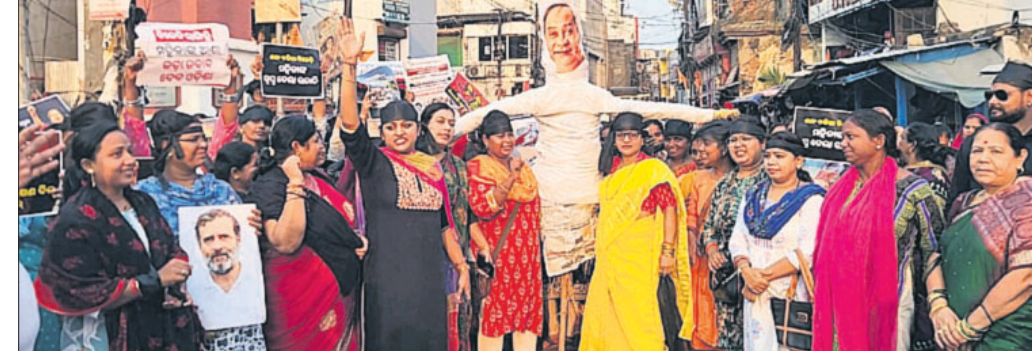
ମହିଳା ଓ ଯୁବତୀମାନଙ୍କ କଂଗ୍ରେସ ଓ ବିଜେଡି ବିରୋଧରେ ନାରାବାଜି।