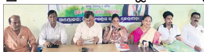
ଖବରଦାତା ସମ୍ମିଳନୀରେ କଂଗ୍ରେସ ନେତୃବର୍ଗ ।