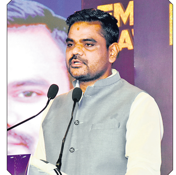
ପୁଞ୍ଜ୍ୟ ପଦ୍ମା ଶିଳ୍ପ ମନ୍ତ୍ରୀ ସମ୍ପଦ ଚନ୍ଦ୍ର ସାହି ଉଦ୍‌ଘାଟନ କରୁଛନ୍ତି ।