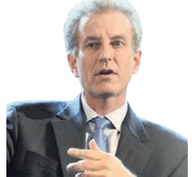
ଗୋତ ଲ. କୁଚ୍ଛୋକ୍

ଅଧିକାଂଶ ସ୍ୱଳପିଲାଙ୍କୁ ଶିକ୍ଷା ଦିଆଯାଇଛି ଯେ, ପୃଥ୍ୱୀର ପରିଧିର ଲମ୍ବ ପାଖାପାଖି ୨୫,୦୦୦ ମାଇଲ ବା ୪୦,୦୦୦ କିଲୋମିଟର । ହେଲେ ସେମାନେ ଜାଣିନାହାନ୍ତି ଯେ, ଏହା ମଧ୍ୟରୁ ମାତ୍ର ୧୦୦ କିଲୋମିଟର ଉପରେ ବିଶ୍ୱର ଅର୍ଥ ବ୍ୟୟ ହାତକୁ ନିର୍ଭର କରେ । ତୁଳନିତ ଅଣ୍ଡାଓସାରିଆ ଜଳପଥ ଯଥା ଷ୍ଟେଟ୍ ଅଫ୍ ହର୍ମୁଜ ଏବଂ ତାଳଝାନ ଷ୍ଟେଟ୍ସ୍ ବନ୍ଦ କରି ଏହା ବିଶ୍ୱ ଅର୍ଥ ବ୍ୟୟକୁ କିଛି ଦଶମି ପୂର୍ବାବସ୍ଥାକୁ ନେଇଯାଇ ଧ୍ୟାୟ କରିଦେଇପାରେ । ତେବେ ସମ୍ପୂର୍ଣ୍ଣ ଭାବେ ପ୍ରସ୍ତର ଯୁଗକୁ ନ ନେଲେ ମଧ୍ୟ ଆମେରିକାର ରାଷ୍ଟ୍ରପତି ଇଲାନ୍ ଉପରେ ବୋମାବର୍ଷଣ କରି ତାହାର ଅର୍ଥନୈତିକ ବ୍ୟୟକୁ ଅତିକମରେ ଦିଂଶ ଶତାବ୍ଦୀର ମଧ୍ୟଭାଗକୁ ଫେରାଇ ନେଇଯିବେ ବୋଲି ଧନକ ଦେଇଛନ୍ତି । ଦେଢ଼ ମାସରୁ ଅଧିକ ସମୟ ଧରି ଇରାନ ହର୍ମୁଜ ଷ୍ଟେଟ୍ସ୍ ସବୁରୁ ଅଣ୍ଡାଓସାରିଆ ଅଂଶ ୨୧ ମାଇଲରେ କିଛି ପରିକଳ୍ପନ ଆଣି ତାହାକୁ ଏକ ଭାସମାନ ଗୁମ୍ଫା ଗ୍ୟାଲେରିରେ ପରିଣତ କରିଛି । ଏହି ଷ୍ଟେଟ୍ ଦେଇ କାହାନ୍ତି ଚଳାଟଳ ପୂରା ହୁଏପାଇଛି । ଏଠାରେ ଇରାନର ସିନ୍ଦୁବାଟ ଏବଂ ଗ୍ରେନ୍ସ୍ପାଉଟ୍ରିକ ଯାତାଯାତ କରିବା ଯୋଗୁ ଚାଳକରଗୁଡ଼ିକ ଯାବତେଇ ଯାଇ ଏଠିପର୍ଯ୍ୟନ୍ତ ଘୁରି ଚାଲୁଛନ୍ତି । ଏତକ ଅବରୋଧ ବିଶ୍ୱ ଅର୍ଥ ବ୍ୟୟକୁ ଯୋଗ ପ୍ରଭାବିତ କରିଛି । କାରଣ ଏହି ହର୍ମୁଜ ଷ୍ଟେଟ୍ସ୍ ଦେଇ ବିଶ୍ୱର ସବୁରୁ ଅଧିକ ଭାଗ ତିଳ ଓ ତରଳ ପ୍ରାକୃତିକ ଗ୍ୟାସ୍ ପରିବହନ ହୋଇଥାଏ । ଏହା କେବଳ ମଧ୍ୟପ୍ରାଚୀନ ସମସ୍ୟା ନୁହେଁ, ଏହା ହେଉଛି ଏସିଆରେ ମୁଖ୍ୟ ପାଇଁ ଏକ ପୂର୍ବ ଅଭ୍ୟାସ, ଯାହା ତାଳଝାନ ପାଇଁ ଚାଲିନାହିଁ ପୂର୍ବକୁ କିଛି ଯୋଜନା କରିବାକୁ ସୁଯୋଗ ଦେଇଛି । ତାଳଝାନ ଷ୍ଟେଟ୍ସ୍ ସବୁରୁ ଅଣ୍ଡାଓସାରିଆ ଭାଗର ଚଉଡ଼ା ୮୯ ମାଇଲ । ଏହି ବାଟଦେଇ ସେମିକଣ୍ଟିନେଣ୍ଟ ପରିବହନ ଅଧିକ ହୋଇଥାଏ । ତାଳଝାନ ସେମିକଣ୍ଟିନେଣ୍ଟ କମ୍ପାନୀ ବିସ୍ତାପନଦ୍ୱି ବିଶ୍ୱର ଅତ୍ୟାଧୁନିକ ଚିପ୍ସର ୯୦ ପ୍ରତିଶତକୁ ଅଧିକ ଉତ୍ପାଦନ କରିଥାଏ, ଯାହା ଏଆଇ ଟେକା ସେକ୍ଟର, ଫାଇବର