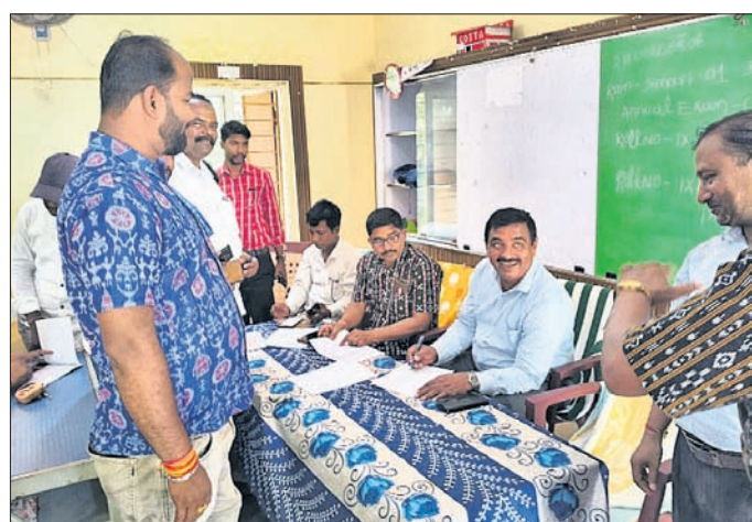
ଅଧିକାରୀମାନେ ଗୃହଗଣନା ଜନଗଣନାର ସମୀକ୍ଷା କରୁଛନ୍ତି ।

ମାଣିଆପାଳ, ୨୩୧୪(ଶୁଭେନ୍ଦୁ ପ୍ରସାଦ ଚୌଧୁରୀ) କେନ୍ଦ୍ରାପଡ଼ା ଜିଲ୍ଲା ଆଜି ଅଞ୍ଚଳରେ ପ୍ରଥମ ଗ୍ରୀଷ୍ମପ୍ରବାହ ଜନଜୀବନକୁ ଅସୁବିଧା କରୁଛି । ମୁଖ୍ୟତଃ ଖରା ଯୋଗୁ ପ୍ରବାହ ୧୨ଟା ପରେ ଅଞ୍ଚଳର ପ୍ରମୁଖ ବ୍ୟବସାୟିକ ପେଟ୍ରୋଲ୍ ଆଜି କଳାଗରେ ରାସ୍ତାଘାଟ ଶୁନ୍ୟରେ ହୋଇଯାଇଛି । ବିଶେଷ କାମ ଥିଲେ ଲୋକେ ଗୋପି, ଓଦା ଗାମୁଛା ଦେଇ ଯାତାୟତ କରୁଥିବା ଦେଖିବାକୁ ମିଳୁଛି । ପ୍ରଶାସନ ପକ୍ଷରୁ ରାସ୍ତାରେ ଜଳଛତ୍ର ଖୋଲିବାର ବ୍ୟବସ୍ଥା ଥିବା ବେଳେ ତାହା ଆଜି ପର୍ଯ୍ୟନ୍ତ ହୋଇନାହିଁ । କୁଳ ପ୍ରଶାସନ ପକ୍ଷରୁ ମୁଖ୍ୟ ରାସ୍ତା ବିଭିନ୍ନ ଛକରେ ବିଶ୍ରାମଗାର ଓ ଜଳଛତ୍ର ଖୋଲିବାକୁ ସାଧାରଣରେ ଦାବି ହୋଇଛି । ବିତି ଓ ଅନିରୀକ୍ଷିତ ସେଠାକୁ ପଚାରିବାରୁ ଖୁବ୍‌ଶୀଘ୍ର ଜଳଛତ୍ର ଖୋଲିଯିବ ବୋଲି କହିଛନ୍ତି ।