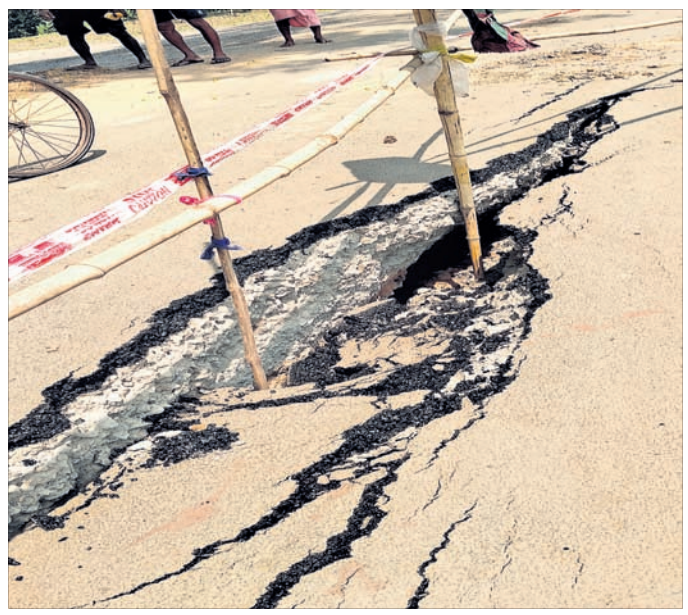
ବିହାନବିପୁର ସ୍କୁଲ ଓ ପୋଲ ନିକଟରେ ରାସ୍ତା ମଝିରୁ ଫାଟି ଦୁଇ ଫାଳ ହୋଇଯାଇଛି।

ରାଜ୍ୟ ସରକାରଙ୍କ ପକ୍ଷରୁ ଯୋଗାଯୋଗ ବ୍ୟବସ୍ଥାକୁ ସହଜ ଓ ସୁରକ୍ଷିତ କରିବାର ଲକ୍ଷ୍ୟ ନେଇ ମୁଖ୍ୟମନ୍ତ୍ରୀ ଗ୍ରାମ୍ୟ ସଡ଼କ ଯୋଜନା (ଏମ୍ପାଏମ୍‌ସିଏସ୍‌ଡ୍ୱାଇ) ପ୍ରଣୟନ କରାଯାଇଛି। ଏହି ଯୋଜନା ଅଧୀନରେ ଯାଜପୁର ଜିଲ୍ଲା ଗ୍ରାମ୍ୟ ନିର୍ମାଣ ବିଭାଗ ଯାଜପୁର ଡିଭିଜନ-୧ ଅଧୀନରେ ବିଭିନ୍ନ ରାସ୍ତା ନିର୍ମାଣ ତଥା ମରାମତି ନାମରେ ବହୁ କୋଟି ଟଙ୍କା ବ୍ୟୟବ୍ୟୟ ହେଉଛି। କିନ୍ତୁ କମିଶନ କାରବାର ଏବଂ ଅତି ନିମ୍ନମାନର କାର୍ଯ୍ୟ ଯୋଗୁ ରାସ୍ତାର କମ୍ପ୍ୟୁଟରରେ ଅର୍ଦ୍ଧସମ୍ପୂର୍ଣ୍ଣ ହେବାର ୮ ମାସ ମଧ୍ୟରେ ୮ କୋଟି ଟଙ୍କାର ଏହି ପ୍ରକଳ୍ପ ରାସ୍ତା ଦୁଇଫାଳ ହୋଇଯାଇଛି। ଫଳରେ ତାହା ଲୋକଙ୍କ ପାଇଁ ବିପଦାପନ ହୋଇଛି। ଏଠାରେ ଜିଲାର ବଣରଥପୁର ବ୍ଲକ ଅଧୀନ ମଙ୍ଗଳପୁରଠାରୁ ବଡ଼କୁଆଁଳ ପର୍ଯ୍ୟନ୍ତ ନିର୍ମାଣାଧୀନ ରାସ୍ତାକୁ ଉଦାହରଣ ଭାବେ ନିଆଯାଇପାରେ। ଏଥିରୁ ଏହି ବିଭାଗରେ କ୍ରମଶଃ ମହା ରୋଗୀଙ୍କ ହେବାରେ ଲାଗିଛି ବୋଲି ମତପ୍ରକାଶ ପାଇଛି। ରାସ୍ତା କାର୍ଯ୍ୟର ଉପଯୁକ୍ତ