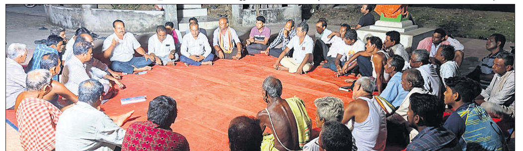
ବନ୍ଧୁମିଳନରେ ଯୋଗଦେଇଥିବା ଭାଜପା ନେତା ଓ କର୍ମୀ ।

ସୁଭା ୪ଟି ଦାବି ପୂରଣ କରିବାକୁ ପ୍ରତିଶ୍ରୁତି ଦେବା ପରେ ଧାରଣା ପ୍ରତ୍ୟାହତ ହୋଇଥିଲା । ସୋମବାର ସୁଭା ଦାବି କାନୁନ୍ଗୋ ଫୋନ ଯୋଗେ ସେବା ସମବାୟ ସମିତି କର୍ମଚାରୀ ସଂଘ ସହ ଆଲୋଚନା କରିଥିଲେ । ସୋମବାର