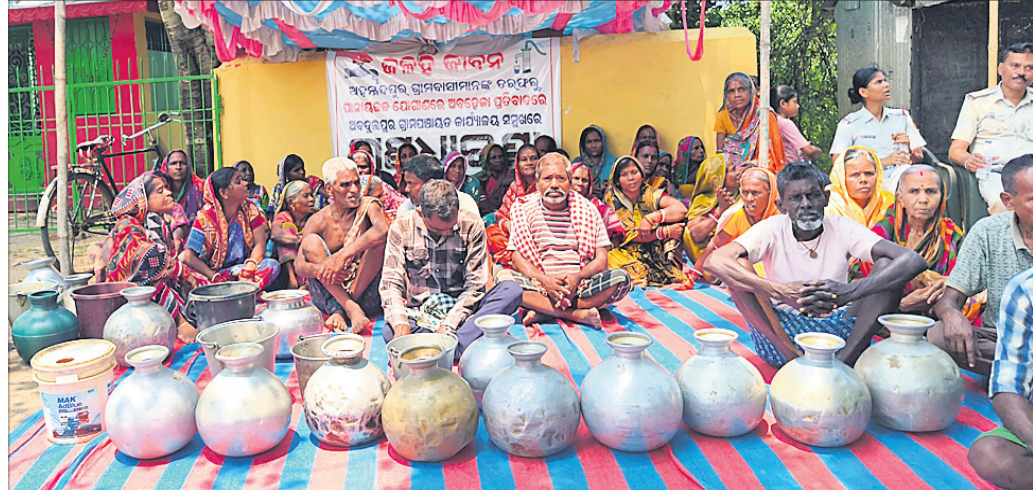
ଗରା, ବାଲୁଟି ଧରି ପଞ୍ଚାୟତ ଅର୍ପଣ ସମ୍ମୁଖରେ ଗ୍ରାମବାସୀ ଧାରଣାରେ ବସିଛନ୍ତି।

କେନ୍ଦ୍ରାପଡ଼ା ଜିଲ୍ଲା ରାଜକନିକା ବ୍ଲକ ଅଧୀନ ପଶ୍ଚିମ କନିକାର ଅବଦଳପୁର ପଞ୍ଚାୟତ ଅହମ୍ମଦପୁର ଗାଁରେ ପାନୀୟ ଜଳ ସମସ୍ୟା ଉତ୍ତମ ହୋଇଛି। ଉକ୍ତ ସମସ୍ୟାକୁ ନେଇ ଅହମ୍ମଦପୁର ଗାଁର ଲୋକେ ପଞ୍ଚାୟତ କାର୍ଯ୍ୟାଳୟ ସମ୍ମୁଖରେ ଗଣଧାରଣା ଦେଇଛନ୍ତି। ପ୍ରତିବର୍ଷ ଗ୍ରୀଷ୍ମ ଆସିଲେ ଗ୍ରାମବାସୀ ପାନୀୟ ଜଳ ପାଇଁ ତହଲବିତଳ ହୋଇଥାନ୍ତି। ଚଳିତବର୍ଷ ମଧ୍ୟ ସମାନ ସ୍ଥିତି ଉପସ୍ଥାପିତ। ଏହି ନିବାସ ଗ୍ରାମରେ ଗାଁର ୧୫୦ରୁ ଊର୍ଦ୍ଧ୍ୱ ପରିବାର ପାଣି ପାଇଁ ହତହତା ହେଉଛନ୍ତି। ବହୁ ଯୋଜନାରେ ପଞ୍ଚାୟତରେ ରୁଚି ପ୍ରକଳ୍ପ ଅଛି, ହେଲେ ସେଥିରୁ ଅହମ୍ମଦପୁର ଗାଁ ବାଦ୍ ପଡ଼ିଛି। ଗାଁରେ ରୋଗିଏ ନଳକୂପ ଅଛି। ହେଲେ ସେଥିରେ ଆବଶ୍ୟକ ପୂରଣ କଲାଜଳ ପାଣି ଆହୁରି ପାଣି ପାଇଁ ସେମାନଙ୍କୁ