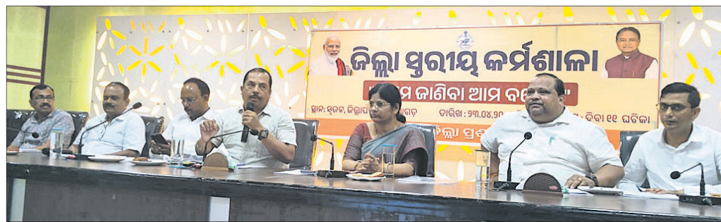
କାର୍ଯ୍ୟକ୍ରମରେ ଯୋଗ ଦେଇଥିବା ଅଧିକାରୀ ।

ଦୟାଗଡ଼ ଜିଲ୍ଲା ପରିଷଦ ସମ୍ପର୍କୀୟ କର୍ମୀଙ୍କୁ ସୂଚନା ଦେବାକୁ ଉଦ୍ଦେଶ୍ୟରେ ଗୁରୁବାର ଆମେ ଜାଣିବା ଆମ ବଜେଟ ଉପରେ ଜିଲ୍ଲାସ୍ତରୀୟ କର୍ମଶାଳା ଅନୁଷ୍ଠିତ ହୋଇଯାଇଛି । ସରକାରୀ ବଜେଟ ଏବଂ ଏହାର ପ୍ରକ୍ରିୟା ସମ୍ପର୍କରେ ସଚେତନ କରିବା ଉଦ୍ଦେଶ୍ୟରେ ଜିଲ୍ଲା ପ୍ରଶାସନ ପକ୍ଷରୁ ଏହି ସ୍ୱତନ୍ତ୍ର କାର୍ଯ୍ୟକ୍ରମ ଆୟୋଜନ କରାଯାଇଥିଲା । ୨୦୨୪-୨୫ ଆର୍ଥିକ ବର୍ଷ ବଜେଟର ଜଳ ସମ୍ବଳ ଓ ପରିଚାଳନା, ଗ୍ରାମୀଣ ବିକାଶ, ଶିକ୍ଷା, ସହରୀ ବିକାଶ, ଜଳସେଚନ ଓ ନିୟମାବଳୀ, ସାମାଜିକ କଲ୍ୟାଣ ଓ ପୁଷ୍ଟିକର, କୃଷି ଓ ଆନୁଷ୍ଠାନିକ, ସ୍ୱାସ୍ଥ୍ୟ ଓ ପରିବାର କଲ୍ୟାଣ, ପୋଲିସ ବିଭାଗରେ ଅନୁଦାନ ରାଶି ଖର୍ଚ୍ଚ ହୋଇପାରି ନ ଥିବାରୁ ଉଦ୍‌ବେଗ ପ୍ରକାଶ ପାଇଛି । ଆଗାମୀ ଦିନରେ ଆଉ ଏକ ସ୍ୱତନ୍ତ୍ର ବୈଠକରେ ଏହି ଅର୍ଥକୁ ବ୍ୟବହାର କରିବାକୁ ଆଲୋଚନା କରାଯିବ ବୋଲି ସେ କହିଥିଲେ ।