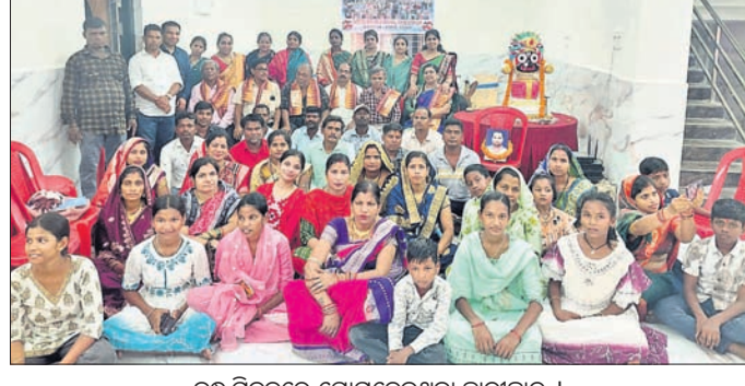
ବନ୍ଧୁ ମିଳନରେ ଯୋଗଦେଇଥିବା ଛାତ୍ରଛାତ୍ରୀ ।