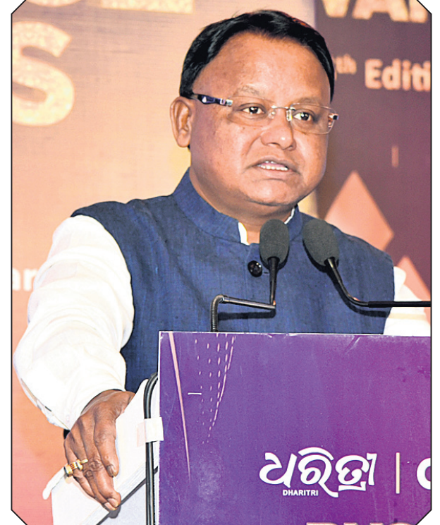
ପୁଞ୍ଜ୍ୟ ଅତିଥି ଭାବେ ଅଭିଭାଷଣ କରୁଛନ୍ତି ପୁଞ୍ଜ୍ୟମନ୍ତ୍ରୀ ମୋହନ ଚରଣ ମାତ୍ରା ।