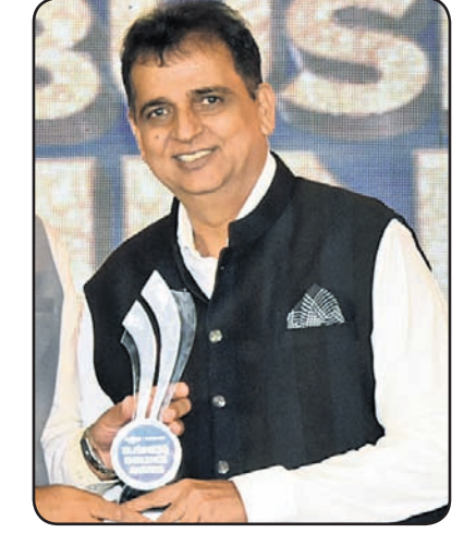
ସମିତ ରଞ୍ଜନ ସାହୁ ଅର୍ଗାନିକ ମା'