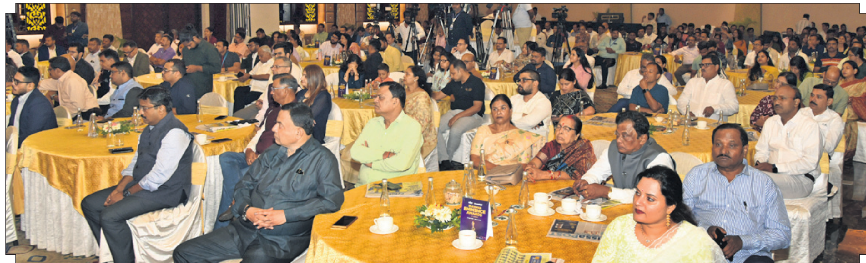
ଧରିତ୍ରୀ ଏବଂ ଓଡ଼ିଶା ପୋଷ୍ଟ ପକ୍ଷରୁ ଭୁବନେଶ୍ୱର ସ୍ଥିତି ପ୍ରତିଯୋଗୀରେ ଆୟୋଜିତ 'ବିଜ୍ଞାନେତ୍ସ୍ ଏମିନେନ୍ସ ଆୱାର୍ଡ' ପ୍ରଦାନ କାର୍ଯ୍ୟକ୍ରମରେ ଉପସ୍ଥିତ ମାନ୍ୟବର ବ୍ୟକ୍ତି ।