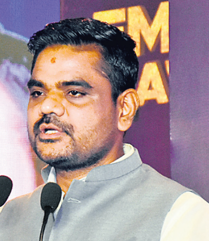
ପୁଷ୍ପ ପଦ୍ମା ଶିଳ୍ପ ମନ୍ତ୍ରୀ ସମ୍ପଦ ଚନ୍ଦ୍ର ସାହି ଉଦ୍‌ଘାଟନ କରୁଛନ୍ତି ।