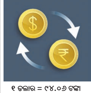
୧ ଡଲାର = ୯୪.୦୭ ଟଙ୍କା