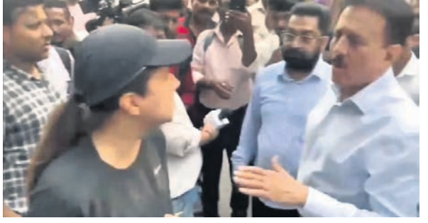
କରୁଛନ୍ତି। ଖୋଲା ସ୍ଥାନରେ କାର୍ଯ୍ୟକାରୀ ରାଲି କରାଯାଇପାରିଲା ନାହିଁ ବୋଲି ମହିଳା ଜଣକ ମନ୍ତ୍ରୀଙ୍କୁ ପ୍ରଶ୍ନ କରିଥିଲେ। ଭିଡ଼ି ଓ ଭାଇରାଲ ହେବା ପରେ ମନ୍ତ୍ରୀ ଟ୍ରାଫିକ୍ ଜାମ୍ ପାଇଁ କ୍ଷମା ମାଗିଛନ୍ତି। ମହିଳା ସଂଗଠନ ବିଲୁକୁ ସମର୍ଥନ କରି ଭାଜପା ପକ୍ଷରୁ ଶୋଭାଯାତ୍ରାର ଆୟୋଜନ କରାଯାଇଥିବା ମନ୍ତ୍ରୀ କହିଛନ୍ତି।