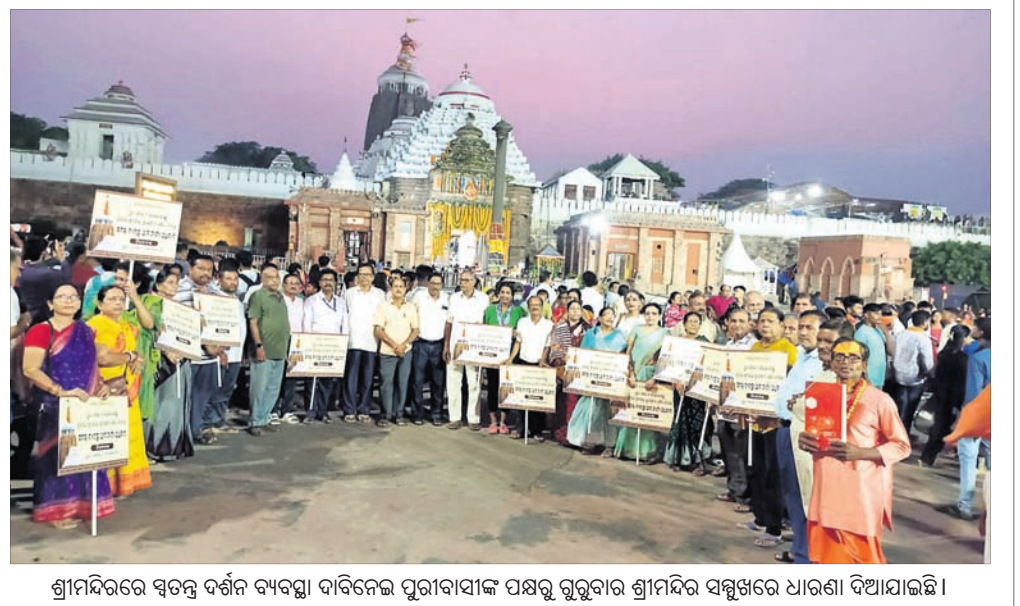
ଶ୍ରୀମନ୍ଦିରରେ ସ୍ୱତନ୍ତ୍ର ଦର୍ଶନ ବ୍ୟବସ୍ଥା ଦାବିକରି ପୁରୀବାସୀଙ୍କ ପକ୍ଷରୁ ଗୁରୁବାର ଶ୍ରୀମନ୍ଦିର ସମ୍ମୁଖରେ ଧାରଣା ଦିଆଯାଇଛି।

ସେଲ୍ଫି ପଠାଇବା ସମୟରେ ନିଜର ନାମ ଏବଂ ମୋବାଇଲ୍ ନମ୍ବର ଦେବାକୁ ଭୁଲ୍ ନାହିଁ। ଯୋଗ୍ୟ ବିବେଚିତ ପଠେ ପ୍ରକାଶ ପାଇବ।