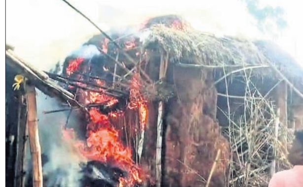
ବାଙ୍କୀରେ ଜଳିଯାଇଥିବା ଘର।

ବାଙ୍କୀ/ବାରଙ୍ଗ, ୨୩/୪ (ଶୁଭେନ୍ଦୁ ମହାପାତ୍ର/ଲିଙ୍ଗରାଜ ରାଉତ/ଭୂଷାରକାନ୍ତ ବେହେରା)