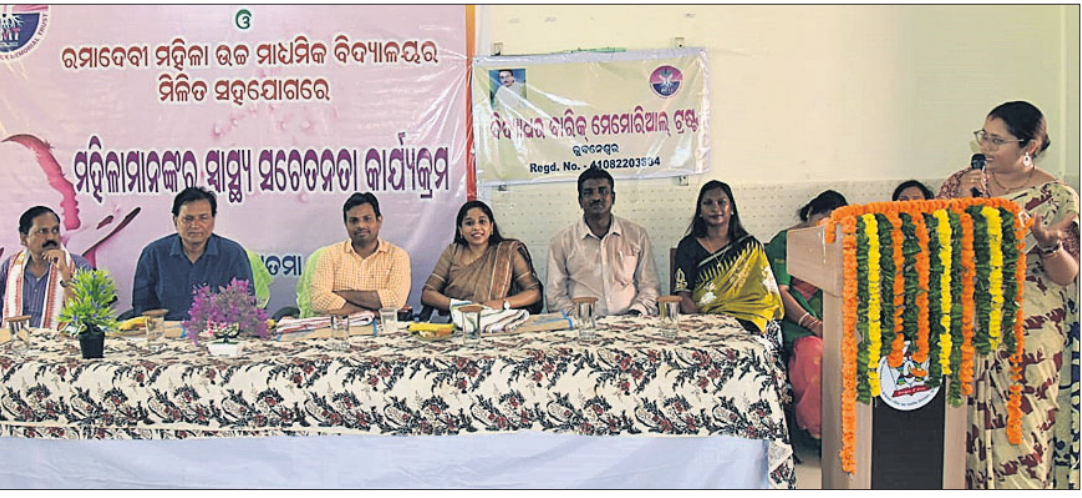
ସଚେତନତା କାର୍ଯ୍ୟକ୍ରମରେ ଯୋଗଦେଇଥିବା ସ୍ୱାସ୍ଥ୍ୟ ବିଶେଷଜ୍ଞଙ୍କ ସହ ଅନ୍ୟ ଅତିଥିମାନେ ।