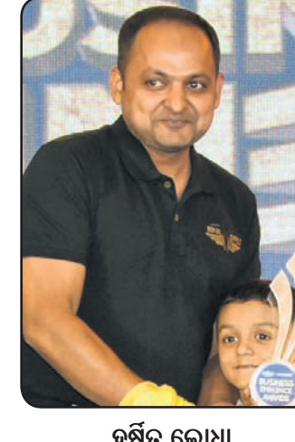
ସର୍ବତ୍ କୋଥା କରମ୍ୟା ଅପୋମୋବାଲ୍