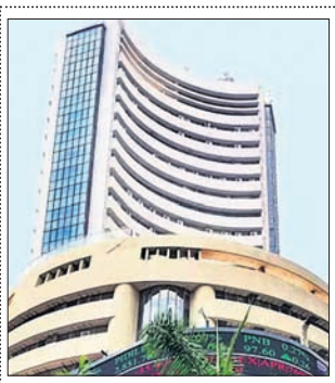
ବିଏସ୍‌ଏଲ୍ ସେନ୍‌ସେକ୍ସ ୭୭,୬୬୪ (-୮.୫୨)

ରାଷ୍ଟ୍ରପତିଙ୍କ ଦାବି କମ୍ପାନୀଗୁଡ଼ିକ ମୂଲ୍ୟବୃଦ୍ଧି କରି ନ ଥିଲେ ମଧ୍ୟ ଆଗାମୀ ଦିନରେ ଆଉ କିଛି ସହଜାକୁ ସମ୍ଭବ ହେବେ ନାହିଁ।