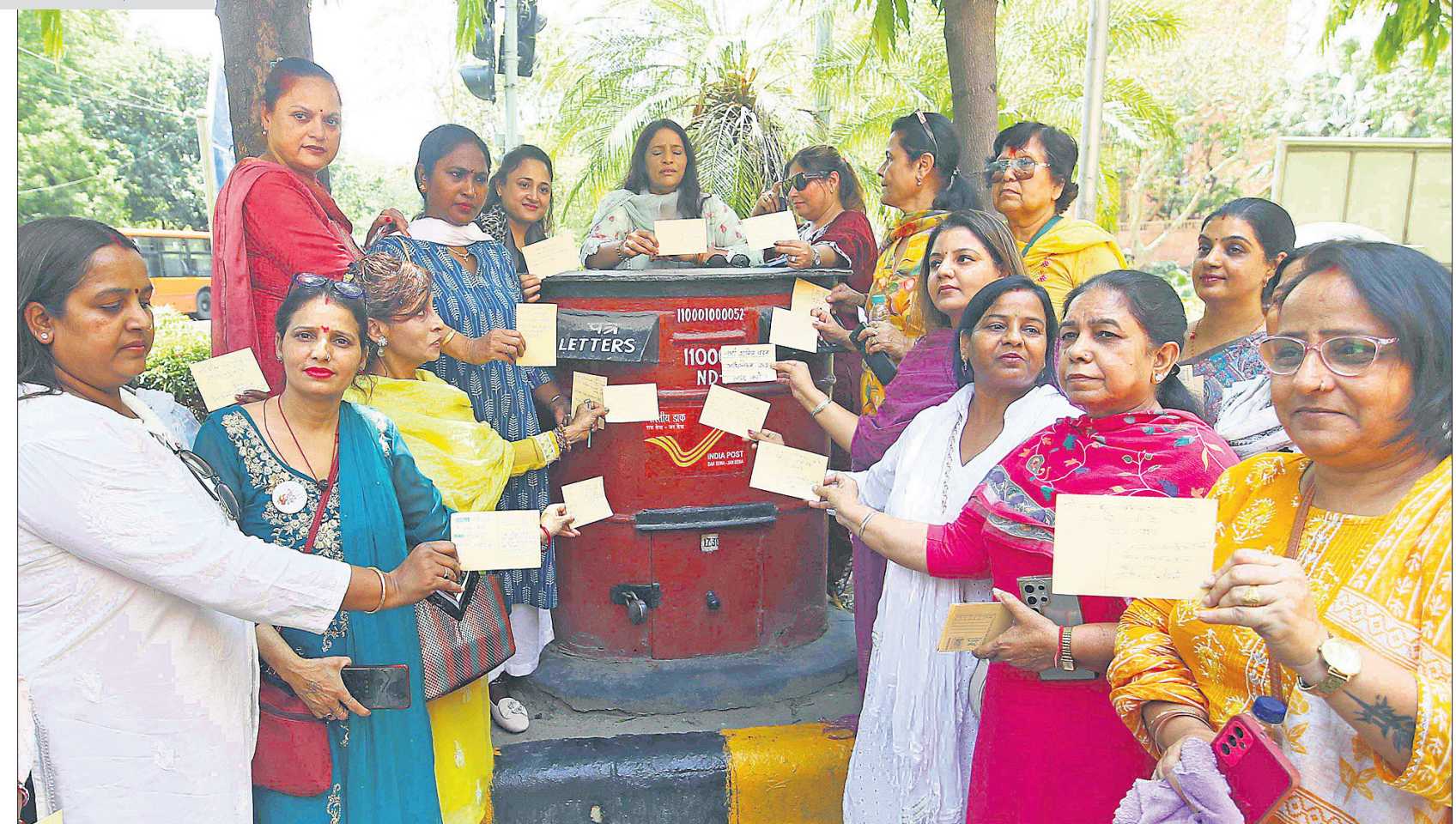
ନାରୀ ଶକ୍ତି ବନ୍ଦନ ଅଧିକାରୀଙ୍କ କାର୍ଯ୍ୟକାରୀତା ଦାବିରେ ମହିଳା କଂଗ୍ରେସ ସଦସ୍ୟମାନେ ରୁରୁବାର ନୂଆଦିଲ୍ଲୀର ରୋଲ ଡାକ୍ ଖାନାଠାରେ ଏକାଠି ହୋଇ ପ୍ରଧାନମନ୍ତ୍ରୀଙ୍କ ଉଦ୍ଦେଶ୍ୟରେ ପୋଷ୍ଟକାର୍ଡ ପଠାଇଛନ୍ତି।