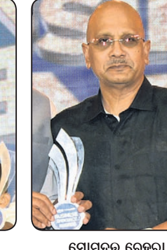
ସୋମନର ବେହେରା କେଟି ଗ୍ଲୋବାଲ୍ ସ୍କୁଲ