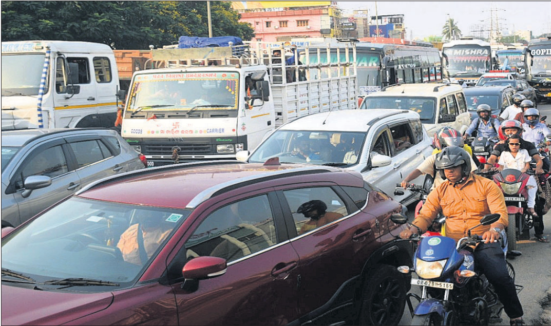
ପକାଣ୍ଡୁଣୀ ଓଭରବ୍ରିଜ୍ ଉପରେ ଅଟକି ରହିଥିବା ଯାନବାହନ ।

ଭୁବନେଶ୍ୱର, ୨୩୪ (ପ୍ରସନ୍ନକିର୍ ପାଠୁ) ରାଜଧାନୀ ଭୁବନେଶ୍ୱରର ଗ୍ରାମିଣଙ୍କୁ ସମସ୍ୟା ଦିନକୁ ଦିନ ବଢ଼ିବାରେ ଲାଗିଛି। ଅସହ୍ୟ ଗରମ ସାଜକୁ ଗ୍ରାମିଣଙ୍କ ଯାତ୍ରାକର୍ତ୍ତାଙ୍କ ମୁଖ୍ୟ ବିଷୟ କାରଣ ପାଇଛି। ଭୁବନେଶ୍ୱର