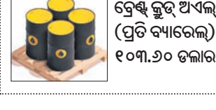
ବ୍ରେକ୍ ଫୁଟ୍ ଅଏଲ୍ (ପ୍ରତି ବ୍ୟାରେଲ୍) ୧୦୩.୬୦ ଡଲାର