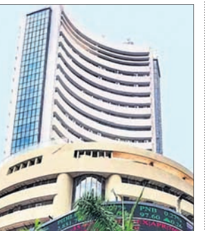
ବିଏସ୍ ସେନ୍ ସେକ୍ଟର ୭୬, ୭୬୪ (-୯୯୯)

ସଭାପତି: ଏହି କୁପନ ବ୍ୟବହାର କରି ସମ୍ପୂର୍ଣ୍ଣ ମାତ୍ରାରେ ଜନ୍ମଦିନର ଶୁଭେଚ୍ଛା କରାଯାଇ ପାରେ। ଏହାକୁ ପ୍ରଦାନ କରିବା ପାଇଁ ପ୍ରକାଶନ ତାରିଖର ୭ ଦିନ ପୂର୍ବରୁ ଜନ୍ମଦିନ ଶୁଭେଚ୍ଛା, ଧରିତ୍ରୀ, ବି-୨୬, ରଘୁନାଥ ଶିଖରୀ, ଭୁବନେଶ୍ୱର-୧୦୦୧୦୧ରେ ପଠାଇବା ଆବଶ୍ୟକ।