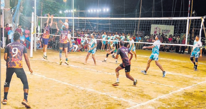
ପ୍ରଥମ ସେମିନାଲନାଲ ମ୍ୟାଚ୍ରେ ଏକ ଦୃଶ୍ୟ ।