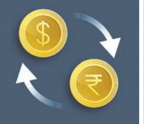
୧ ଡଲାର = ୯୪.୨୩ ଟଙ୍କା