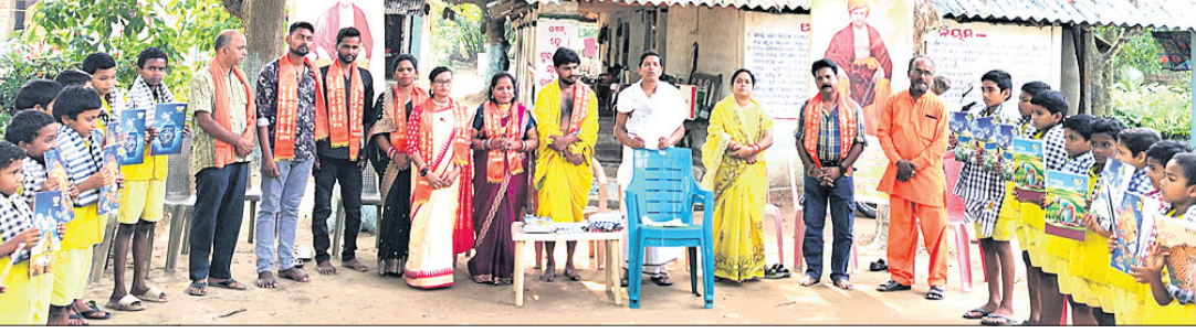
ଅନ୍ତରାଷ୍ଟ୍ରୀୟ ଗଣତନ୍ତ୍ର ଦମ୍ପତି ଓ ଅତିଥି ।