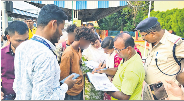
ଷ୍ଟେସନରେ ଚିନ୍ତା ପକ୍ଷରୁ ଚାଲାଇ ବେଳେ ଚେନ୍ନୁ ୫ ଶିଶୁ ଶ୍ରମିକ ଉଦ୍ଧାର କରାଯାଇଛି ।

ବାଲେଶ୍ୱର ରେଳ ଷ୍ଟେସନରେ ଶୁକ୍ରବାର ଉଦ୍ଧାର-ବାଙ୍ଗାଲୋର ଉଦ୍ଧାର ଶିଶୁ ଶ୍ରମିକଙ୍କୁ ଉଦ୍ଧାର କରାଯାଇଛି । ସେମାନଙ୍କୁ ବାଲେଶ୍ୱର ସିଟିକୁ ସ୍ଥାନାନ୍ତରଣ କରାଯାଇଛି । ଉଦ୍ଧାର ଶିଶୁ ଶ୍ରମିକ ଚାଲାଇ ବେଳେ ଚେନ୍ନୁ ୫ ଶିଶୁ ଶ୍ରମିକ ଉଦ୍ଧାର କରାଯାଇଛି । ଉଦ୍ଧାର ଶିଶୁ ଶ୍ରମିକ ଚାଲାଇ ବେଳେ ଚେନ୍ନୁ ୫ ଶିଶୁ ଶ୍ରମିକ ଉଦ୍ଧାର କରାଯାଇଛି । ଉଦ୍ଧାର ଶିଶୁ ଶ୍ରମିକ ଚାଲାଇ ବେଳେ ଚେନ୍ନୁ ୫ ଶିଶୁ ଶ୍ରମିକ ଉଦ୍ଧାର କରାଯାଇଛି ।