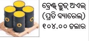
ବେଞ୍ଚ କ୍ରୟ ଅଧିକ (ପ୍ରତି ବ୍ୟାରେଲ) ୧୦୪.୦୦ ଡଲାର