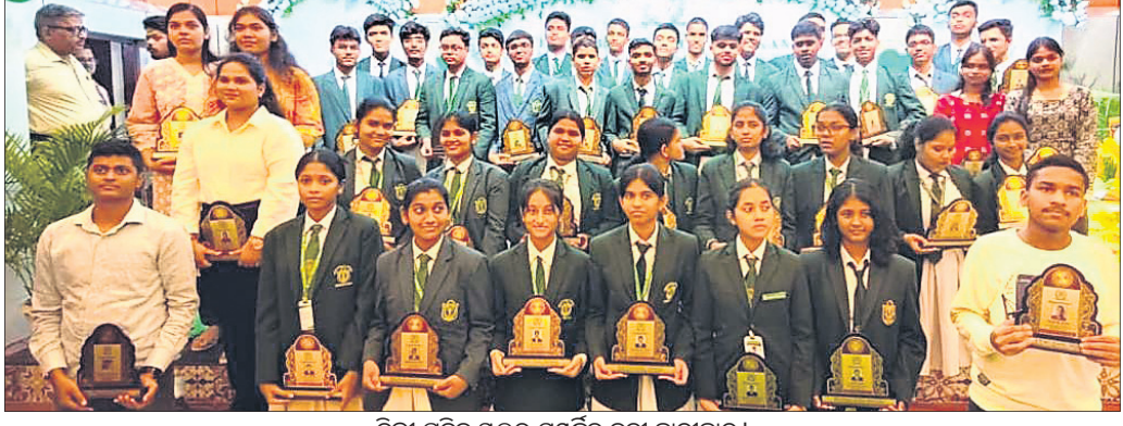
ଦିଲ୍ଲୀ ପବ୍ଲିକ ସ୍କୁଲର ସମର୍ଦ୍ଧିତ କୃତୀ ଛାତ୍ରାଛାତ୍ରୀ।