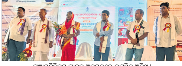
ପଞ୍ଚାୟତରାଜ ଦିବସ ଅବସରରେ ଉପସ୍ଥିତ ଅତିଥି ।

ବାହାମା, ୨୪୪(ଅରୁଣ କୁମାର ଦାସ) ମଣ୍ଡଳ ବିଧାନସଭା ପ୍ରତିନିଧି ପ୍ରଭୁଙ୍କୁ ସାମ୍ମାନିତ କରାଯାଇଛି । ପଞ୍ଚାୟତରାଜ ଦିବସ ସମାରୋହ ଶୁକ୍ରବାର ଅନୁଷ୍ଠିତ ହୋଇଛି । ଏହି ସମାରୋହରେ ରୁକ୍ମପୁରୀ ପଞ୍ଚାୟତରାଜ ଦିବସ ପ୍ରତିନିଧି ଭାବେ ଉପସ୍ଥିତ ହୋଇଥିଲେ । ପଞ୍ଚାୟତରାଜ ଦିବସ ପ୍ରତିନିଧି ଭାବେ ରୁକ୍ମପୁରୀ ପଞ୍ଚାୟତରାଜ ଦିବସ ପ୍ରତିନିଧି ଭାବେ ଉପସ୍ଥିତ ହୋଇଥିଲେ ।