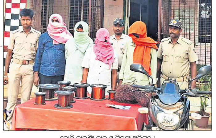
ଚୋରି ବାଉଁଶ ଚାଉଳ ଓ ଗିରଫ ଅଭିଯୁକ୍ତ।