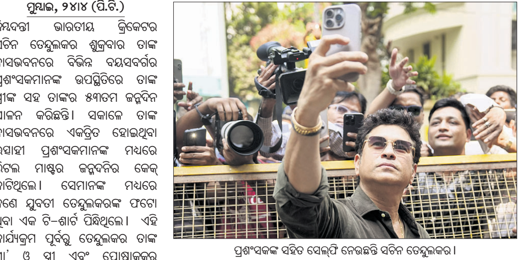
ପ୍ରଶଂସକଙ୍କ ସହ ତେଜୁଲକର ଜନ୍ମଦିନ ପାଳିଲେ।

ଭୁବନେଶ୍ୱର, ୨୪୪୪ (ପି.ଟି.) ଜୟଦେବୀ ଭାରତୀୟ କ୍ରିକେଟର ସିନିୟର ତେଜୁଲକର ଶୁକ୍ରବାର ତାଙ୍କ ବାସଭବନରେ ବିଭିନ୍ନ ବୟସବର୍ଗର ପ୍ରଶଂସକମାନଙ୍କ ଉପସ୍ଥିତିରେ ତାଙ୍କ ୩୯ ବର୍ଷ ବୟସ ପୂର୍ଣ୍ଣ ହେବାରୁ ପ୍ରଶଂସକମାନଙ୍କ ମଧ୍ୟରେ ଲିଜଲ ମାଷ୍ଟର କଳ୍ପନା କେନ୍ଦ୍ର କାରିଥିଲେ। ସେମାନଙ୍କ ମଧ୍ୟରେ ଜଣେ ଯୁବତୀ ତେଜୁଲକରଙ୍କ ଫଟୋ ଥିବା ଏକ ଟି-ଶାର୍ଟ ପିନ୍ଧିଥିଲେ। ଏହି କାର୍ଯ୍ୟକ୍ରମ ପୂର୍ବରୁ ତେଜୁଲକର ତାଙ୍କ ମା' ଓ ସ୍ତ୍ରୀ ଏବଂ ପୋଷାକକୁଳର ସହିତ ସୋସିଆଲ ମିଡ଼ିଆରେ ଏକ ଫଟୋ ପୋଷ୍ଟ କରିଥିଲେ। ସିନିୟର ଜନ୍ମଦିନ ଅବସରରେ ଏକ ଲିଜେଣ୍ଡୁ କ୍ଲବ କାର୍ଯ୍ୟକ୍ରମରେ ଉପସ୍ଥିତ ପୂର୍ବତନ