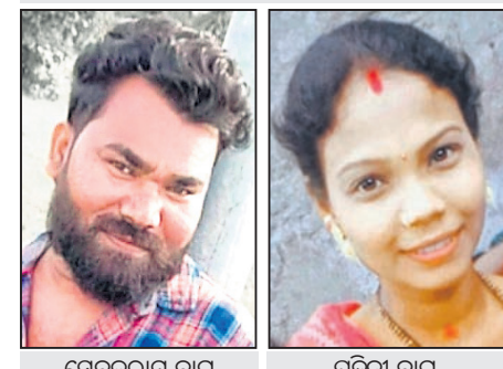
ସେବକରାମ ବାଗ ପଡ଼ିନୀ ବାଗ ମିଳିଥିବା ପୁତ୍ରୀ ଅନୁଯାୟୀ, ବଲାଙ୍ଗୀର ଜିଲ୍ଲା ପୁଲିସ୍ ଥାନା ଅନ୍ତର୍ଗତ ଦୁଷ୍ଟି କରୁଥିବା ବେଳେ ଦମ୍ପତିଙ୍କ ୩ ଡୁମ୍ପେରବାହୀନ ଗାଁର ସେବକ ରାମ ବାଗ ସନ୍ତାନ ଅସହାୟ ହୋଇ ପଡ଼ିଛନ୍ତି । (୩୫) ଗୁରୁବାର ପୃଷ୍ଠା-୪

ବଲାଙ୍ଗୀର ଭୀମ ଭୋଇ ମେଡିକାଲ କଲେଜ ଓ ହସ୍ପିଟାଲରେ ଅଭାବନୀୟ ଘଟଣା