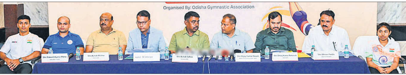
ଖବରଦାତା ସମ୍ମିଳନୀରେ ଉପସ୍ଥିତ କର୍ମକର୍ତ୍ତା, ଖେଳାଳି, କୋଚ୍ ଓ ରାଜ୍ୟ କ୍ରୀଡ଼ା ବିଭାଗର ଅଧିକାରୀମାନେ।