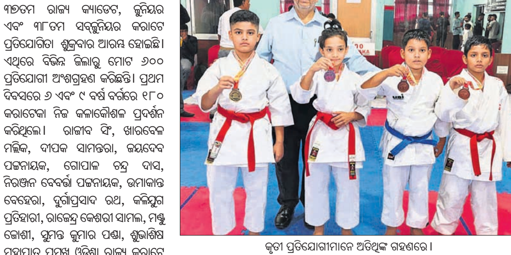
କୃତୀ ପ୍ରତିଯୋଗୀମାନେ ଅତିଥିଙ୍କୁ ଗୃହଣରେ।