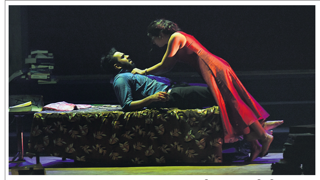
ଜୀବନ ରେଖା ସୁବର୍ଣ୍ଣ ପକ୍ଷରୁ ଶୁକ୍ରବାର ଭୁବନେଶ୍ୱର ରବାସ ମଣ୍ଡପରେ ଆୟୋଜିତ ରଙ୍ଗ ଉତ୍ସବରେ ପରିବେଷିତ ନାଟକ 'ଜାଲମ୍ ଆଣ୍ଡ ପିନିସେଣ୍ଟ'ର ଏକ ଦୃଶ୍ୟ।