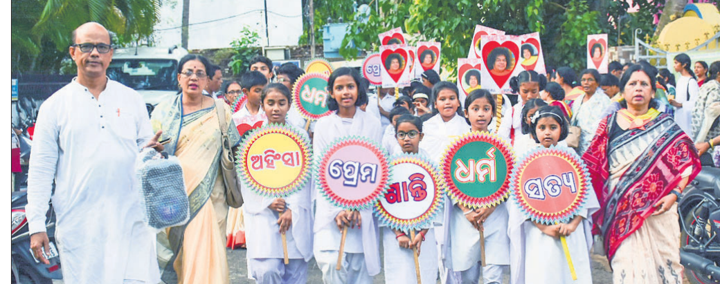
ସାଇ ଆଶ୍ରମ ଉତ୍ତରାଞ୍ଚଳମାନେ ନଗର ପରିକ୍ରମା କରୁଛନ୍ତି।