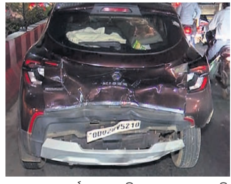
ଦୁର୍ଘଟଣାରେ କ୍ଷତିଗ୍ରସ୍ତ କାର୍ ଓ ଅନ୍ୟ ଗାଡ଼ି । ଘଟଣାସ୍ଥଳରେ ପୋଲିସ୍ ଚଢ଼କ କରୁଛି ।