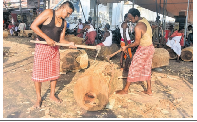
ଅକ୍ଷୟତୃତୀୟାଠାରୁ ମହାପ୍ରଭୁଙ୍କ ବିଶ୍ୱପ୍ରସିଦ୍ଧ ଯୋଗସାଗ୍ରା ନିମନ୍ତେ ଶ୍ରୀମନ୍ଦିରରୁ ଅଗ୍ରାୟା ରଥ ଖଳାରେ ୩ ରଥର ନିର୍ମାଣ କାର୍ଯ୍ୟ ଆରମ୍ଭ ହୋଇଛି।

ଅକ୍ଷୟତୃତୀୟାଠାରୁ ମହାପ୍ରଭୁଙ୍କ ବିଶ୍ୱପ୍ରସିଦ୍ଧ ଯୋଗସାଗ୍ରା ନିମନ୍ତେ ଶ୍ରୀମନ୍ଦିରରୁ ଅଗ୍ରାୟା ରଥ ଖଳାରେ ୩ ରଥର ନିର୍ମାଣ କାର୍ଯ୍ୟ ଆରମ୍ଭ ହୋଇଛି। ରଥ ନିର୍ମାଣର ୪ର୍ଥ ଦିବସରେ ରଥ ନିର୍ମାଣକାରୀ ସେବକମାନେ କାର୍ଯ୍ୟ ଭାରି ରଖୁଛନ୍ତି। ଶୁକ୍ରବାର ଶେଷ ଭୂଷା ୩ ରଥର ୪୨ଟି ତୁମ୍ଭ ମଧ୍ୟରୁ ମୋଟ ୨୬ଟି ତୁମ୍ଭର ଗୋଲେଇ କାର୍ଯ୍ୟ ଶେଷ ହୋଇଛି। ଆଜିର ନିର୍ମାଣ କାର୍ଯ୍ୟ ଶେଷ ହୁଏ ବେବଦଳନ ରଥ ଏବଂ ନନ୍ଦିଘୋଷ ରଥର ୮ଟି ଲେଖାଏଁ ତୁମ୍ଭର ଗୋଲେଇ କାର୍ଯ୍ୟ ଶେଷ ହୋଇଥିବାବେଳେ ତାଳଧ୍ୱଜ ରଥର ୧୦ଟି ତୁମ୍ଭର ଗୋଲେଇ କାର୍ଯ୍ୟ ଶେଷ ହୋଇଛି। ଦୋଳବେଦି ଅଗ୍ରାୟା କମାରଖଳାରେ ୩ ରଥର ମୋଟ ୪୨ଟି ଚକ ପାଇଁ ଅରକ୍ଷ୍ୟ ପ୍ରସ୍ତୁତ କାରି ରହିଛି। କାର୍ଯ୍ୟ ଶେଷ ବେଳକୁ ଗୋଟିଏ ଗୋଟିଏ ଚକ ପାଇଁ ଆବଶ୍ୟକ ୬/୬ ଲକ୍ଷ୍ୟ ଆରକ୍ଷ୍ୟ ପ୍ରସ୍ତୁତ ସହ ବାକି ଚକଗୁଡ଼ିକର ଅରକ୍ଷ୍ୟ ନିର୍ମାଣ ପାଇଁ ତିଆରି କରାଯାଇ ରକ୍ଷାପ ପ୍ରକାରେ କଟି କରାଯାଇଛି।