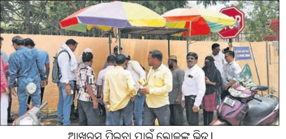
ଆଖୁରସ ପିଇବା ପାଇଁ ଲୋକଙ୍କ ଭିଡ଼।