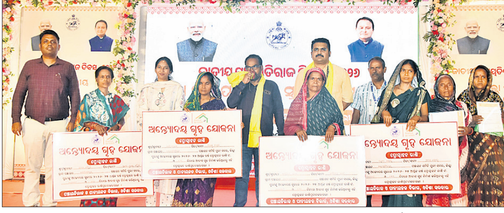
ପୁରୀ ଜିଲାପ୍ରାୟ ପଞ୍ଚାୟତରାଜ ଦିବସ ପାଳନ ଅବସରରେ ହିତାଧିକାରୀଙ୍କୁ ଅନ୍ତର୍ଦ୍ଧାତମ ଗୃହ ଯୋଜନାରେ କାର୍ଯ୍ୟାଦେଶ ପ୍ରଦାନ କରାଯାଇଛି।

ପୁରୀ ଜିଲାପ୍ରାୟ ପଞ୍ଚାୟତରାଜ ଦିବସ ଶୁକ୍ରବାର ଅପରାହ୍ନରେ ତାନ୍ତ୍ରିକ ହଳଠାରେ ଅନୁଷ୍ଠିତ ହୋଇଯାଇଛି। ପୁରୀ ପଞ୍ଚାୟତରାଜ ଓ ପାନୀୟ ଜଳ ବିଭାଗ ପକ୍ଷରୁ ଆୟୋଜିତ ଏହି ଦିବସରେ ମୁଖ୍ୟ ଅତିଥି ଭାବେ ପୁରୀ ବିଧାୟକ ସୁନୀଲ କୁମାର ମହାନ୍ତି ଯୋଗଦେଇ ପଞ୍ଚାୟତରାଜ ବ୍ୟବସ୍ଥା ସାଧାରଣ ଲୋକଙ୍କ ଆଶା ଓ ଭରସାର ପ୍ରତୀକ ରାସ୍ତା ଘାଟ ନିର୍ମାଣ, ଗମନାଗମନ, ସ୍ୱାସ୍ଥ୍ୟସେବା, ଶିକ୍ଷା, ପାନୀୟ ଜଳ ଯୋଗାଣ ଇତ୍ୟାଦି ମୌଳିକ ଆବଶ୍ୟକତାକୁ ପୂରଣ ଦିଗରେ ପଞ୍ଚାୟତରାଜ ବିଭାଗର ଭୂମିକା ଗୁରୁତ୍ୱପୂର୍ଣ୍ଣ। ଆମ ରାଜ୍ୟରେ ତ୍ରିପୁରାୟ ପଞ୍ଚାୟତରାଜ ବ୍ୟବସ୍ଥା ପ୍ରଚଳିତ। ପ୍ରତ୍ୟେକକ ବିକାଶ ଓ ଉନ୍ନତି ପାଇଁ ଏହା କାର୍ଯ୍ୟ କରୁଛି ବୋଲି ମହାନ୍ତି କହିବା ସହ ଅନ୍ତର୍ଦ୍ଧାତମ ଗୃହ ଯୋଜନାରେ ହିତାଧିକାରୀମାନେ ନିର୍ଦ୍ଧାରିତ ସମସ୍ତ ମଧ୍ୟରେ ଗୃହ ନିର୍ମାଣ କରି ପ୍ରୋତ୍ସାହନ ରାଶି ହାତେଇବାକୁ ଅନୁରୋଧ କରିଥିଲେ।