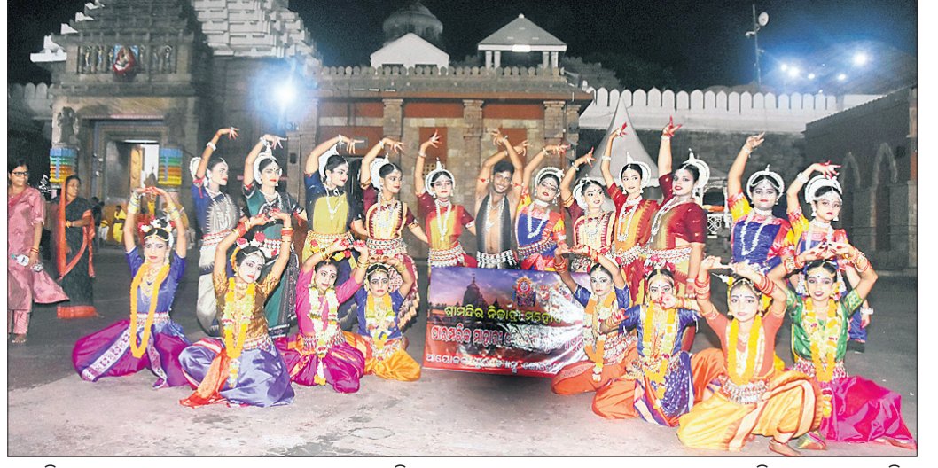
ନାଳାଦ୍ରି ମହୋଦୟାଷ୍ଟମୀ ଉତ୍ସବ ଅବସରରେ ଶୁକ୍ରବାର ଶ୍ରୀମନ୍ଦିର ସମ୍ମୁଖରେ ପୁରୀ ତ୍ୟାଗ୍ ସକାତେନୀ ପକ୍ଷରୁ ନୃତ୍ୟ ପରିବେଷଣ କରାଯାଇଛି।