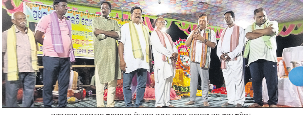
ମହୋତ୍ସବର ଉଦ୍‌ଯାପନ ଅବସରରେ ବିଧାନସଭା ପୁଣ୍ୟାଳୟର ରାଉତଙ୍କ ସହ ଅନ୍ୟ ଅତିଥି।

ଭୁବନେଶ୍ୱର ମହାନଗର ନିଗମର ୪୯ ମ ଔର୍ତ୍ତର ଘୋଡ଼ା ଗ୍ରାମ ବୋକମଣ୍ଡପ ପରିସରରେ ୨ ଦିନ ଧରି ଚାଲିଥିବା ପ୍ରଥମ ବାର୍ଷିକ ଚଇତି ଘୋଡ଼ା ନାଟ ମହୋତ୍ସବ ଗୁରୁବାର ରାତିରେ ଉଦ୍‌ଯାପିତ ହୋଇଯାଇଛି। ଘୋଡ଼ା ଗ୍ରାମର ମା' ବାସେକା କୈବର୍ତ୍ତ ସଂଘ ପକ୍ଷରୁ ଆୟୋଜିତ ଏହି ସାଂସ୍କୃତିକ କାର୍ଯ୍ୟକ୍ରମକୁ ଭୁବନେଶ୍ୱର ଉତ୍ତର ବିଧାନସଭା ପୁଣ୍ୟାଳୟର ରାଉତ ଉଦ୍‌ଯାପନ କରିଥିଲେ। ସେ ତାଙ୍କ ବକ୍ତବ୍ୟରେ ବର୍ତ୍ତମାନ ଲୋକେ ପାଣ୍ଡ୍ୟ ସଭ୍ୟତା ଆଡ଼କୁ ଗତି କରୁଥିବା ବେଳେ ପୁରୁଣା ସଂସ୍କୃତି ଓ ପରମ୍ପରା କଳାକୁ ବଞ୍ଚାଇ ରଖିବା ଦିଗରେ ଏହି କୈବର୍ତ୍ତ ସଂଘ ଆଗେଇ ଆସିଥିବାରୁ ସେ ସମସ୍ତ କର୍ମକର୍ତ୍ତାଙ୍କୁ ସାଧୁବାଦ ସଂଯୋଜନା କରିଥିଲେ। ଏହି ଉଦ୍‌ଯାପନା ଉତ୍ସବରେ ସ୍ଥାନୀୟ କର୍ତ୍ତାବିଭାଗର