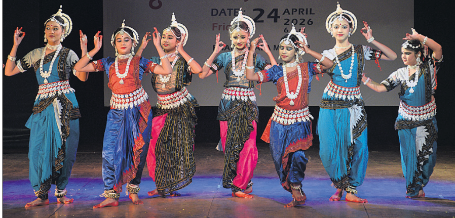
ଉତ୍ସବରେ ଶିଳ୍ପୀମାନେ ନୃତ୍ୟ ପରିବେଷଣ କରୁଛନ୍ତି ।