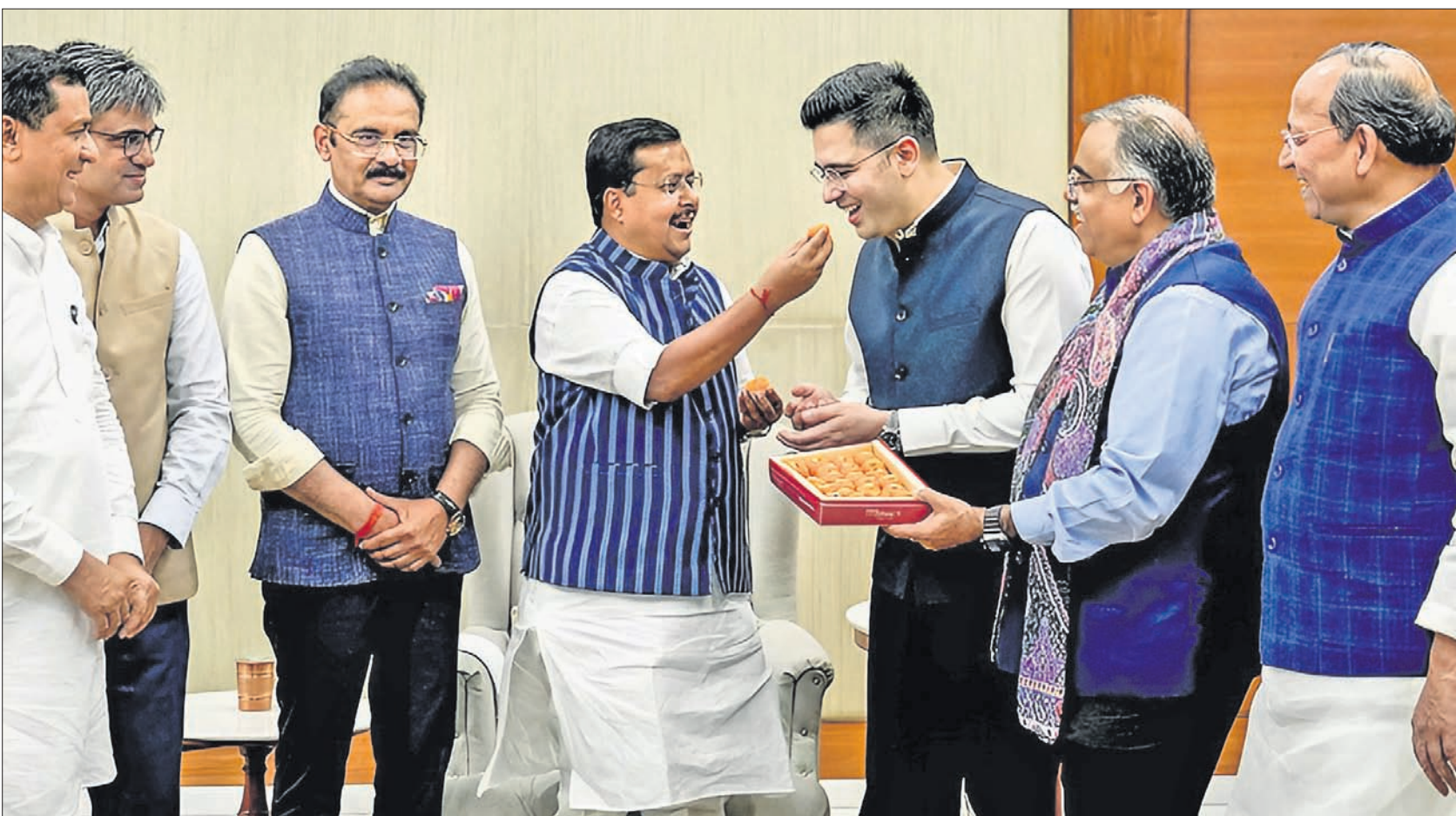
ଆପ୍ତ ଭଣ୍ଡାରୀ ବେଲିଆର ରାଜ୍ୟ ସଭା ସଦସ୍ୟ ରାଘବ ଚଟ୍ଟା, ସମାପ୍ତ ପାଠକ ଓ ଅଶୋକ ମିଲଲକୁ ଭାଜପା ରାଷ୍ଟ୍ରୀୟ ଅଧ୍ୟକ୍ଷ ନୀତନ ନବୀନ ଶୁକ୍ରବାର ନୂଆଦିଲ୍ଲୀରେ ଭାଜପା ମୁଖ୍ୟମନ୍ତ୍ରୀଙ୍କୁ ଭେଟୁଛନ୍ତି । ଏମାନଙ୍କ ସମେତ ଆପ୍ତ ଭାଜପାରେ ଯୋଗଦେଇଛନ୍ତି ।