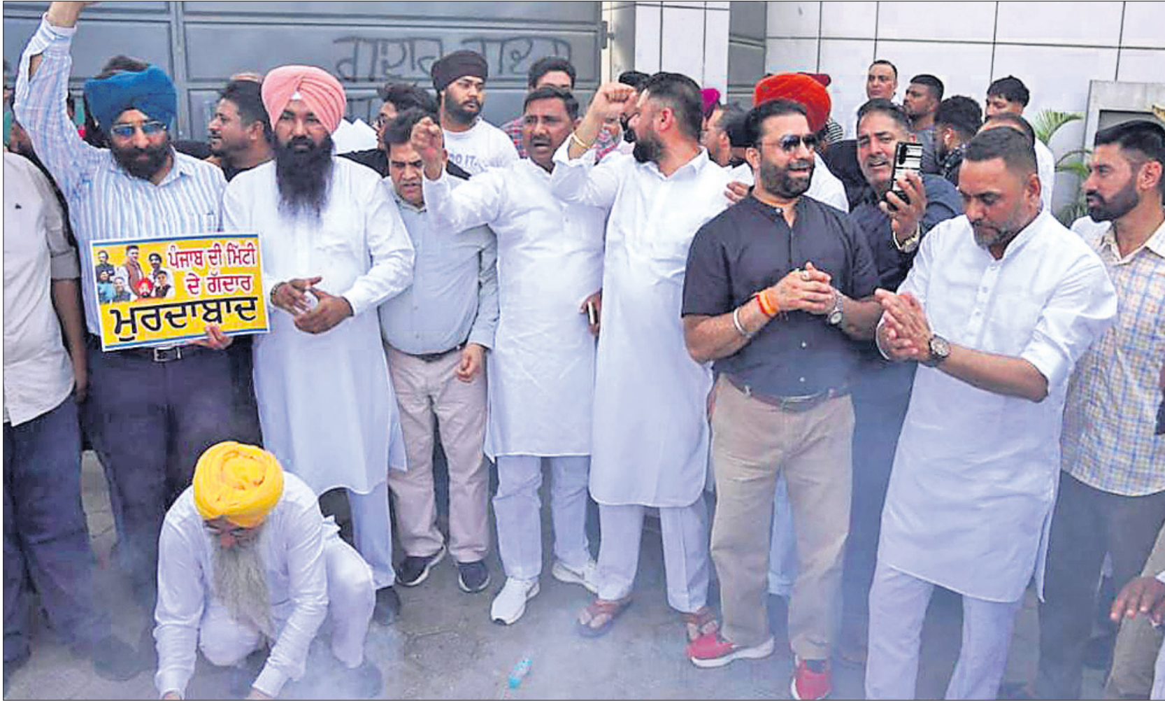
ଦଳ ଛାଡ଼ିଥିବା ରାଜ୍ୟସଭା ସଦସ୍ୟମାନଙ୍କୁ ବିରୋଧ କରି ପଞ୍ଜାବର ଲୁଧିଆନା ଓ କଳକଟରରେ ସେମାନଙ୍କ ଘର ଆଗରେ ଆୟୁ କର୍ମୀମାନେ ବିରୋଧ କରିବା ସହ ପୋଷ୍ଟର ଲଗାଇଛନ୍ତି ।