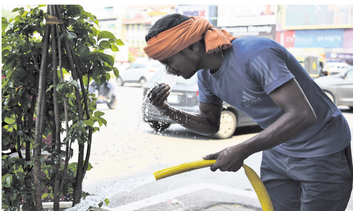
ଭୁବନେଶ୍ୱରରେ ଶନିବାର ପ୍ରବଳ ଗରମ ଓ ଗୁଳୁଗୁଳି ହୋଇଥିଲା ବେଳେ ସେଥିରୁ ଗ୍ରାହୀ ପାଇବା ପାଇଁ ରାଜନହଳ ଓଭରସ୍ପ୍ରିଙ୍କ ଡକ୍ଟର ଗଛରେ ପାଣିଦେବା ବେଳେ ଜଣେ ବ୍ୟକ୍ତି ମୁହଁ ଓ ଦେହକୁ ଓଦା କରୁଛନ୍ତି। ରିପୋର୍ଟ: ପୂ-୪