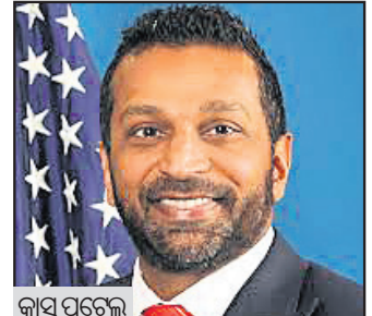
କାସ୍ ପଚେଲ । ନିଶ୍ଚୟ ଅବସ୍ଥାରେ ଗିରଫ ହୋଇଥିଲେ । ଏହା ପରେ ମଧ୍ୟାହ୍ନରେ ଏକ ବାର୍ତ୍ତାରେ ମଦପାନ କରି ରାସ୍ତାରେ ପଡ଼ିଥିବା ଅଭିଯୋଗରେ ଗିରଫ ହୋଇଥିବା ବିଷୟକୁ ସେ ସ୍ୱୀକାର କରିଛନ୍ତି ।

ଆମେରିକାର ପୂର୍ଣ୍ଣ ଗୋପନୀୟ ବିଭାଗ ଏଫ୍‌ବିଆଇ ପୂର୍ଣ୍ଣ ଆରତୀୟ ବଂଶୋତ୍ତର କାସ୍ ପଚେଲଙ୍କୁ ନେଇ ଏବେ ବିବାଦ ତେଜିଛି । ସେ ଡୋନାଲ୍ଡ ଟ୍ରମ୍ପ ପ୍ରଶାସନର ଜଣେ ବରିଷ୍ଠ ଅଧିକାରୀ ଭାବେ ରାଷ୍ଟ୍ରପତିଙ୍କ ଘନିଷ୍ଠ ହୋଇଥିଲେ । ମଧ୍ୟ ତାଙ୍କର ମଦ ପିଇବା ଅଭ୍ୟାସକୁ ନେଇ ଆମେରିକା ଗଣମାଧ୍ୟମରେ ବିତର୍କ ବଢ଼ିବାରେ ଲାଗିଛି । ଏହା ମଧ୍ୟରେ ପୂର୍ବରୁ ଛାଡ଼ାଦିଆରେ ମଦ ପିଇବା ଯୋଗୁଁ କାସ୍ ୨ଥର ଗିରଫ ହୋଇଥିବା ବିଷୟକୁ ସ୍ୱୀକାର କରିଛନ୍ତି । ସେ ଆଜନ ବିଷୟରେ ପାଠ ପଢ଼ୁଥିବାବେଳେ