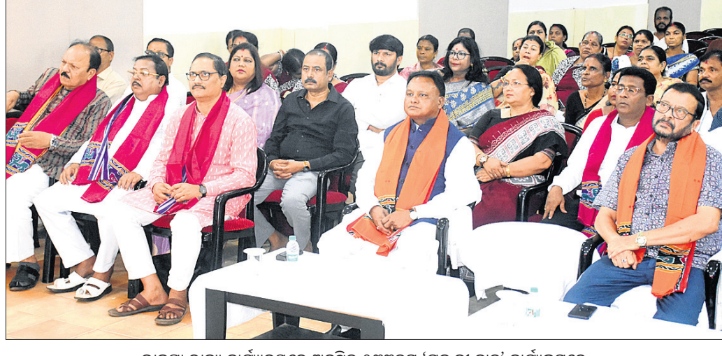
ଭାଜପା ରାଜ୍ୟ କାର୍ଯ୍ୟାଳୟରେ ଅନୁଷ୍ଠିତ ୧୩ମାର୍ଚ୍ଚ 'ମନ୍ କା ବାଡ଼' କାର୍ଯ୍ୟକ୍ରମରେ ମୁଖ୍ୟମନ୍ତ୍ରୀ ମୋହନ ଚରଣ ମାଝୀ, ରାଜସ୍ୱ ମନ୍ତ୍ରୀ ସୁରେଶ୍ ପୂଜାରୀ ଓ ଅନ୍ୟମାନେ ।