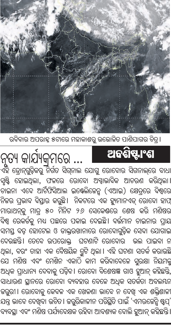
ରବିବାର ଅପରାହ୍ନ ୫ଟାରେ ମହାଶାଶୁରୀ ଉଦ୍‌ଘାଟିତ ପାଣିପାଗର ବିତ୍ତ ।

ଇନ୍ଦ୍ରମର ପୁଣି ... ଏସଂକ୍ରାନ୍ତରେ କୌଣସି ଆଇନ ନାହିଁ । ତେଣୁ ସରକାର ଘଟଣାକୁ ଗୁରୁତ୍ୱ ସହ ଗ୍ରହଣ କରି ଏକ କଡ଼ା ଆଇନ ଆଣିବାର ଆବଶ୍ୟକତା ରହିଛି ବୋଲି ପ୍ରଧାନ ମତ ଦେଇଛନ୍ତି । ମହାପ୍ରଭୁଙ୍କ ପରମ୍ପରା ଓ ତ୍ରି ଅନୁଯାୟୀ ଆମକୁ ତାଙ୍କ ଯାଦିପାତ୍ରା ପାଳନ