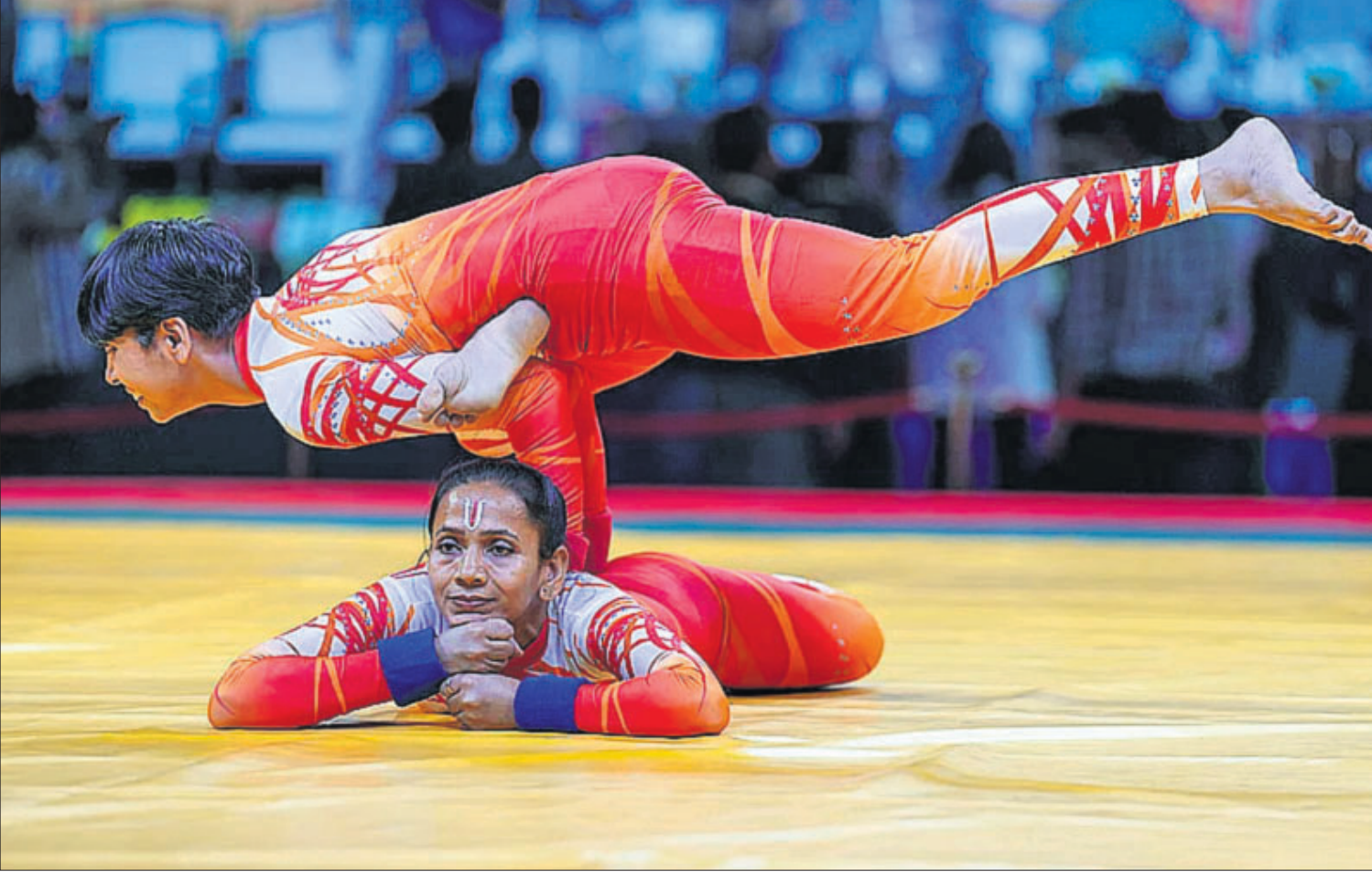
କୃତ୍ରିମତାଳାରେ ରବିବାର ଆୟୋଜିତ ବୃତ୍ତୀୟ ଏସୀୟ ଯୋଗାସନ ଷୋର୍ଟ୍ ଚାମ୍ପିୟନଶିପ୍‌ରେ ଯୋଗଦୁଦ୍ଧାରେ ୨ଜଣ ପ୍ରତିଯୋଗୀ।