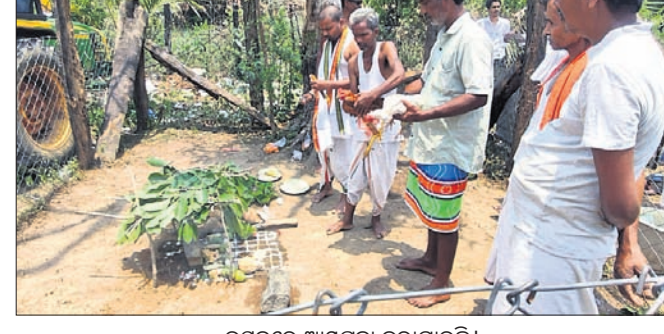
ଉତ୍ସବରେ ଆମପୂଜା କରାଯାଇଛି।

ସ୍ମରଣ କରିବା ସହ ଚାକଂର ଆଶୀର୍ବାଦ ଲାଭ କରିବାର ଏକ ପବିତ୍ର ଅବସର ବୋଲି କୁହାଯାଇଛି। ଏହି ଅବସରରେ ପରିବାରର ଆରାଧ୍ୟ ଦେବୀ ପୂଜାଲକ୍ଷ୍ମୀ ଠାକୁରାଣୀଙ୍କୁ ପୂଜାର୍ଚ୍ଚନା କରାଯାଇଥିଲା। ଦୁଆରି ପରିବାର ପକ୍ଷରୁ ଉତ୍ସବ ପ୍ରତିବର୍ଷ ନିରବଚ୍ଛିନ୍ନ ଭାବେ ପାଳନ କରାଯାଇଛି। ଉତ୍ସବ ପାରିବାରିକ ଏକତାକୁ ମଜବୁତ କରିବା ସହ ପାରମ୍ପରିକ ସଂସ୍କୃତିକୁ ବାଲ୍ମୀକି ଓ ପରିବାରର ପୂର୍ବଜମାନଙ୍କୁ