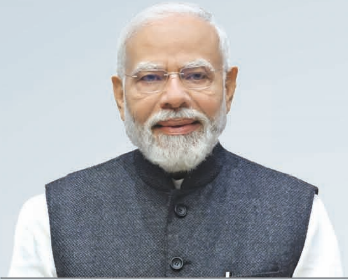
ଶ୍ରୀ ନରେନ୍ଦ୍ର ମୋଦୀ ମାନ୍ୟବର ଭାରତର ପ୍ରଧାନମନ୍ତ୍ରୀ