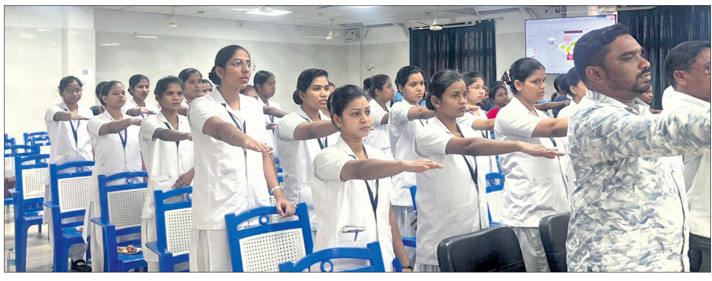
ମ୍ୟାଲେରିଆରୁ ମାଲକାନଗିରି ଗଠନ ପାଇଁ ସମସ୍ତେ ଶପଥ ନେଉଛନ୍ତି।

ମାଲକାନଗିରି, ୨୬୪ (ସୁଯ୍ୟୋଧନ ପାତ୍ର) ଜିଲ୍ଲା ସ୍ୱାସ୍ଥ୍ୟ ସମିତି ଓ ପିରାମଲ୍ ଫାଉଣ୍ଡେସନର ମିଳିତ ସହଯୋଗରେ ରବିବାର ବିଶ୍ୱ ମ୍ୟାଲେରିଆ ଦିବସ ୨୦୨୬ ଜିଲ୍ଲାସ୍ତରୀୟ ପ୍ରଶିକ୍ଷଣ କାର୍ଯ୍ୟକ୍ରମ କରାଯାଇଛି। କାର୍ଯ୍ୟକ୍ରମରେ ମ୍ୟାଲେରିଆ ପୂଜ୍ଞ ମାଲକାନଗିରି ପଠନ କରୁଥିବା ବର୍ତ୍ତମାନ ମାଲକାନଗିରିର ଅଧିକାରୀଙ୍କୁ ନେଇ ଆଲୋଚନା ହୋଇଥିଲା। ମ୍ୟାଲେରିଆ ନିର୍ମୂଳ ଆରୁଆ