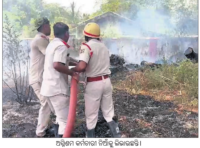
ଅଗ୍ନିଶମ କର୍ମଚାରୀ ନିଆଁକୁ ଲିଭାଇଛନ୍ତି।

ଆଦି ନିଆଁକୁ ଆୟତ୍ତ କରିଥିଲେ। କାର୍ଯ୍ୟାଳୟ କିମ୍ବା ଅନ୍ୟ କୌଣସି ଘର ଓ ବ୍ୟକ୍ତି ବିଶେଷଙ୍କ ଏଥିରେ କୌଣସି କ୍ଷୟକ୍ଷତି ହୋଇ ନ ଥିବା ଜଣାପଡ଼ିଛି। ନିଆଁ ଲାଗିବା କାରଣ ଅସ୍ପଷ୍ଟ ରହିଛି। ନିଆଁକୁ ଅଗ୍ନିଶମ ବାହିନୀ ଠିକ୍ ସମୟରେ ଆୟତ୍ତ କରିଥିବାରୁ ଏକ ବହୁଧରଣର ଅଗ୍ନିଶମକୁ ବିଭାଗୀୟ ଅଧିକାରୀଙ୍କୁ କୃତଜ୍ଞତା ଜଣାଇ ଦିଆଯାଇଛି।