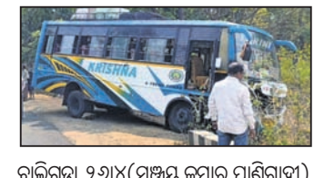
ବାଲିଗୁଡ଼ା, ୨୬୪ (ସଞ୍ଜୟ କୁମାର ପାଣିଗ୍ରାହୀ)

ହିଞ୍ଜିଳିକାରୁ ବସ୍ ଚର୍ଚ୍ଚନା ପରିସରରେ ଶନିବାର ସକାଳେ ଏକ ଘରୋଇ ବସ୍ କଣ୍ଟ୍ରୋଲରୁ ଆକ୍ରମଣ କରିବା ସହ ପୁନା ଚେନ ଓ ଚକା କୁଟ ଅଭିଯୋଗ ହୋଇଥିଲା। ଏହି ଘଟଣାରେ ସମସ୍ତଙ୍କୁ ଥିବା ପୌରାଧିକାରୀ ୨ ଜଣ ନାବାଳକଙ୍କୁ ହିଞ୍ଜିଳି ପୋଲିସ୍ ଟ୍ରହ୍ମପୁର ବାକପୁଧାର ଗୃହକୁ ପଠାଇଛି। ଏନେଇ କେମ୍ ନଂ. ୨୬୩/୨୬ରେ ଏକ ମାମଲା ରୁଜୁ ହୋଇଛି।