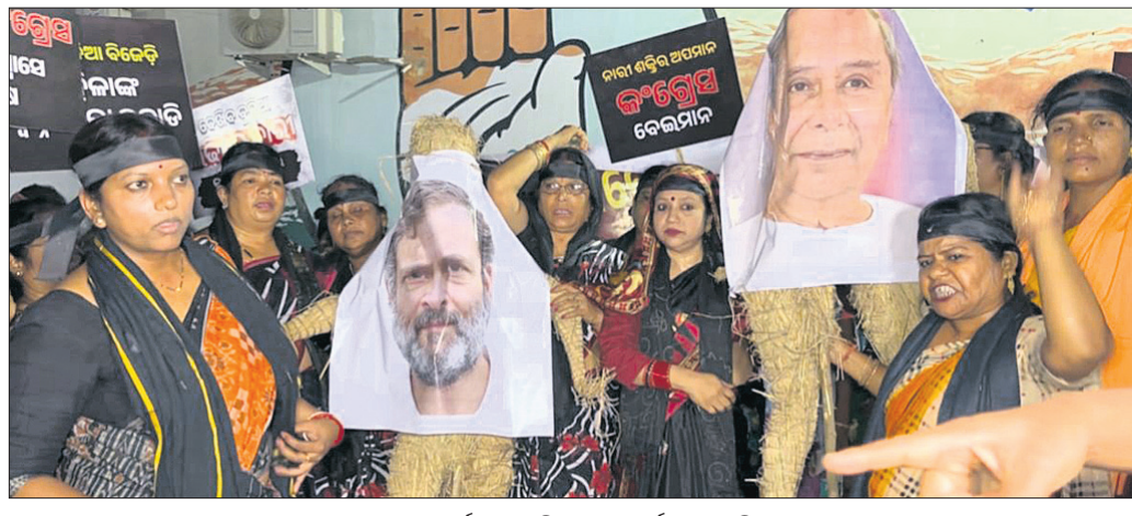
ଭାଜପା କର୍ମୀମାନେ ବିରୋଧ ପ୍ରଦର୍ଶନ କରୁଛନ୍ତି।