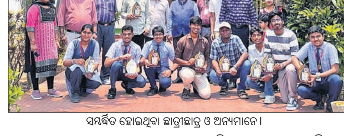
ସମର୍ଥନ ହୋଇଥିବା ଛାତ୍ରୀଛାତ୍ର ଓ ଅନ୍ୟମାନେ।