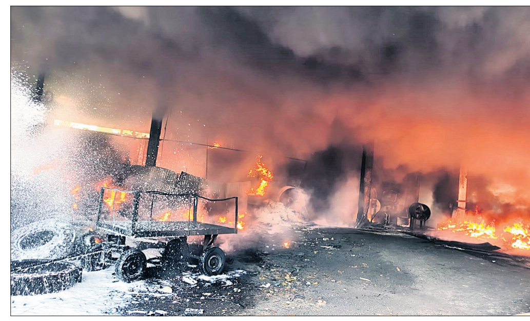
ଚାନ୍ଦାର କାରଖାନା ଜଳୁଛି ।

ରାଜଗାଙ୍ଗପୁର, ୨୬/୪ (ଅଶୋକ ପାଣି) ସୁନ୍ଦରଗଡ଼ ଜିଲ୍ଲା ରାଜଗାଙ୍ଗପୁର ଥାନା ଅନ୍ତର୍ଗତ ପଦାଜାମପାଲିଠାରେ ଥିବା ଏକ ଚାନ୍ଦାର କାରଖାନାରେ ରବିବାର ଅଗ୍ନିକାଣ୍ଡ ଘଟିଛି । ଏଥିରେ କେହି ମୃତ୍ୟୁ ହେଇ ନ ଥିବା ଜଣାପଡ଼ିଛି । ସକାଳ ପ୍ରାୟ ସାଢ଼େ ୫ଟାରେ ଚାନ୍ଦାର କାରଖାନାରେ କୌଣସି କାରଣରୁ ନିଆଁ ଲାଗି ଯାଇଥିଲା । ନିଆଁର ପ୍ରକୋପରେ ସମ୍ପୂର୍ଣ୍ଣ ଅଞ୍ଚଳ ଧୂଆଁମୟ ହୋଇଯାଇଥିଲା । ଖବର ପାଇ ରାଜଗାଙ୍ଗପୁର ଅଗ୍ନିଶମ ବିଭାଗ, କୁଡ଼ା ଅଗ୍ନିଶମ ବିଭାଗ, ରାଉରକେଲା ଅଗ୍ନିଶମ ବିଭାଗ ତଥା ଡାକନିଆ ସିମେଣ୍ଟର ନିଆଁଲିଭା ଗାଡ଼ି ଘଟଣାସ୍ଥଳରେ ପହଞ୍ଚିଥିଲେ । ଦୀର୍ଘ ୬ ଘଣ୍ଟାର ପ୍ରୟାସ ପରେ ସେମାନେ ନିଆଁକୁ ଆୟତ୍ତ କରିଥିଲେ ।