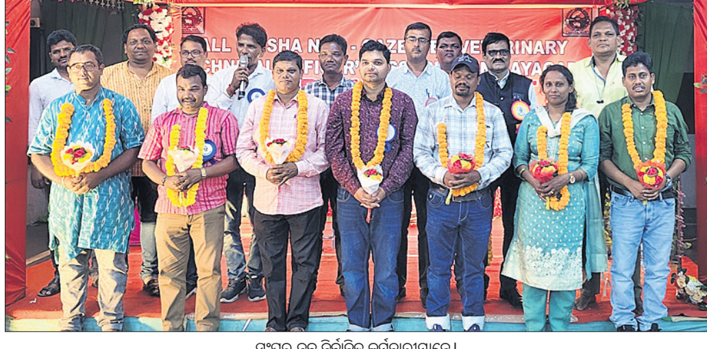
ସଂଘର ନବ ନିର୍ବାଚିତ କର୍ମଚାରୀମାନେ।