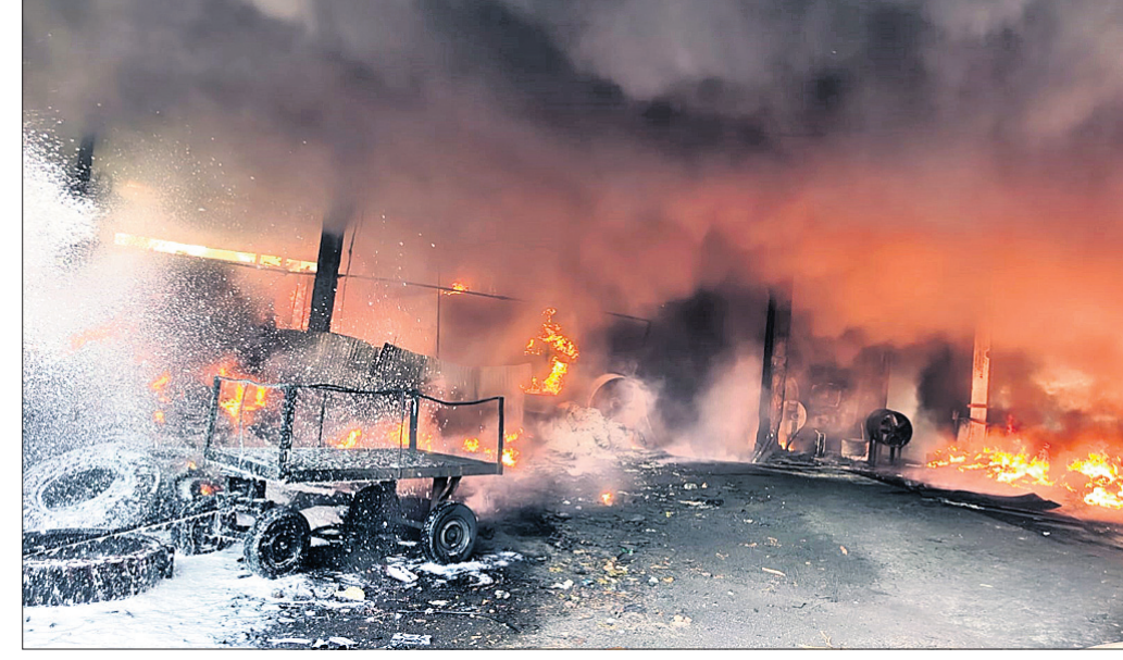
ଚାନ୍ଦାର କାରଖାନା ଜଳିଛି।

ରାଜଗାଙ୍ଗପୁର, ୨୬/୪ (ଅଶୋକ ପାଣି) ସୁନ୍ଦରଗଡ଼ ଜିଲ୍ଲା ରାଜଗାଙ୍ଗପୁର ଥାନା ଅନ୍ତର୍ଗତ ପଦାଜାମପାଲିଠାରେ ଥିବା ଏକ ଚାନ୍ଦାର କାରଖାନାରେ ରବିବାର ଅଗ୍ନିକାଣ୍ଡ ଘଟିଛି। ଏଥିରେ କେହି ମୃତ୍ୟୁ ହୋଇ ନ ଥିବା ଜଣାପଡ଼ିଛି। ସକାଳ ପ୍ରାୟ ସାଢ଼େ ୫ଟାରେ ଚାନ୍ଦାର କାରଖାନାରେ କୌଣସି କାରଣରୁ ନିଆଁ ଲାଗି ଯାଇଥିଲା। ନିଆଁର ପ୍ରକୋପରେ ସମସ୍ତ ଅଞ୍ଚଳ ଧୂଆଁମୟ ହୋଇଯାଇଥିଲା। ଖବର ପାଇ ରାଜଗାଙ୍ଗପୁର ଅଗ୍ନିଶମ ବିଭାଗ, କୁନ୍ତା ଅଗ୍ନିଶମ ବିଭାଗ, ରାଉରକେଲା ଅଗ୍ନିଶମ ବିଭାଗ ତଥା ଡାକ୍ତରଖାନା ସମେତ ନିଆଁଲିଭା ଗାଡ଼ି ଘଟଣାସ୍ଥଳରେ ପହଞ୍ଚିଥିଲେ। ଦୀର୍ଘ ୬ ଘଣ୍ଟାର ପ୍ରୟାସ ପରେ ସେମାନେ ନିଆଁକୁ ଆୟତ୍ତ କରିଥିଲେ।