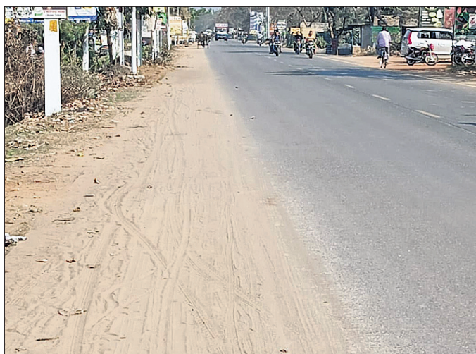
ରାସ୍ତା ପାର୍ଶ୍ୱରେ କମିଥିବା ବାଲି।

ସହ ପୂର୍ଣ୍ଣ ବିଭାଗର କାର୍ଯ୍ୟକଳାପ ଉପରେ ପ୍ରଶ୍ନବାଚୀ ଦୃଷ୍ଟି ହୋଇଛି। ଠିକାଦାରି କାର୍ଯ୍ୟ ବ୍ୟତୀତ ରାସ୍ତାର ରକ୍ଷଣାବେକ୍ଷଣ ଉପରେ