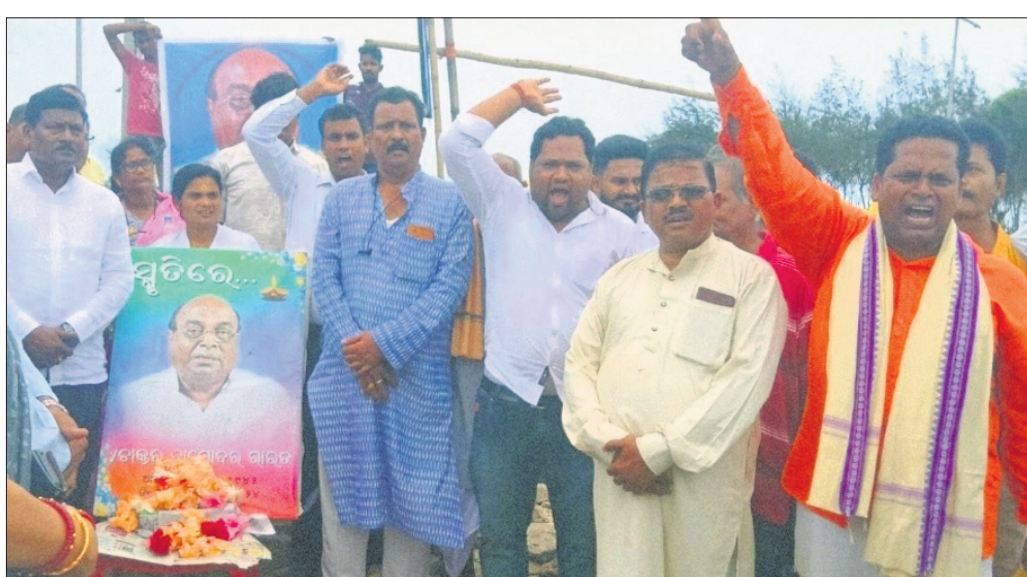
ଏମ୍ପି ବିରୁ ପ୍ରସାଦ ତରାଇ ଓ ସମର୍ଥକମାନେ ପ୍ରତିବାଦ କରୁଛନ୍ତି।