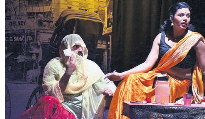
ନାଟକରେ କଳାକାରମାନେ ଅଭିନୟ କରୁଛନ୍ତି।

ବିଜୟ ସିଂହ ପରମାରଙ୍କ ନିର୍ଦ୍ଦେଶିତ ଏହି ନାଟକରେ କଳାକାରମାନେ ମହିଳାଙ୍କ ସଂଘର୍ଷ ଜୀବନ କଥା ଚିତ୍ରଣ କରିଛନ୍ତି। ଜଣେ ମହିଳା ସମାଜରେ ଘରୁଥିବା ହିଂସାରୁ ଘରକୁ ନିର୍ଦ୍ଦେଶିତ ହେବା ପରେ ନାଟକରେ ପ୍ରଦର୍ଶିତ ହେଉଛି।