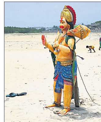
ସମୁଦ୍ର କୂଳକୁ ମିଳିଥିବା ହନୁମାନ ମୂର୍ତ୍ତି।