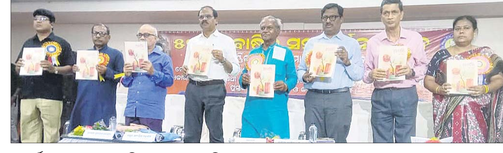
ଗୋକର୍ଣ୍ଣିକା ସ୍ୱତନ୍ତ୍ର ସଂଖ୍ୟାକୁ ଅତିଥି ଉନ୍ମୋଚନ କରୁଛନ୍ତି।