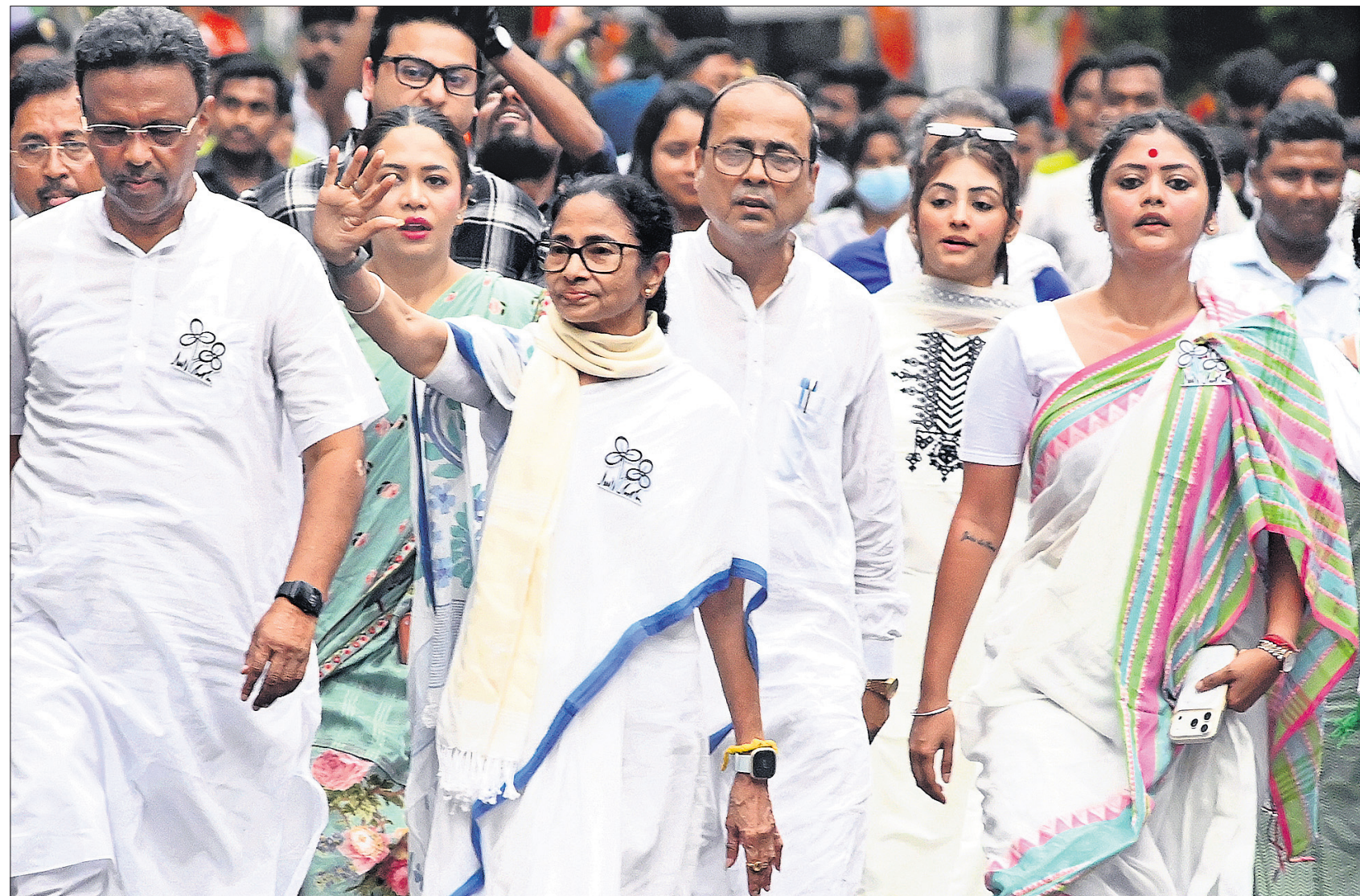
ପଶ୍ଚିମବଙ୍ଗ ବିଧାନସଭା ନିର୍ବାଚନ ପ୍ରଚାର ଶେଷ ଦିନରେ ଯୋମବାବ ମୁଖ୍ୟମନ୍ତ୍ରୀ ତଥା ବୃତ୍ତମୁକ୍ତ କଂଗ୍ରେସ ସୁପ୍ରିମୋ ମମତା ବାନାର୍ଜୀ କୋଲକାତାରେ ଏକ ରୋଡ୍‌ଶୋ'ରେ ଯୋଗ ଦେଇଛନ୍ତି। ତାଙ୍କ ସହ ଦକାୟ ନେତ୍ରୀ ସାୟୋନି ଘୋଷ ଓ ଅନ୍ୟମାନେ ଅଛନ୍ତି।