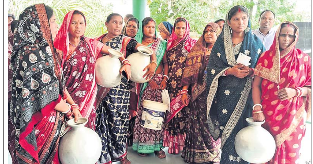
ଅଭିଯୋଗ ଶୁଣାଣି ଶିବିରକୁ ଗରା, ବାଲଟି ଧରି ମହିଳାମାନେ ଆସିଛନ୍ତି ।