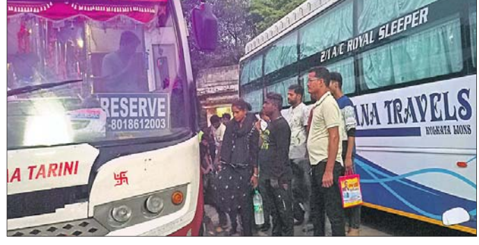
ଏକ ଘରୋଇ ବସ୍ରେ ସୋମବାର ସନ୍ଧ୍ୟାରେ ଲୋକେ ପଶ୍ଚିମବଙ୍ଗ ଯାଉଛନ୍ତି ।