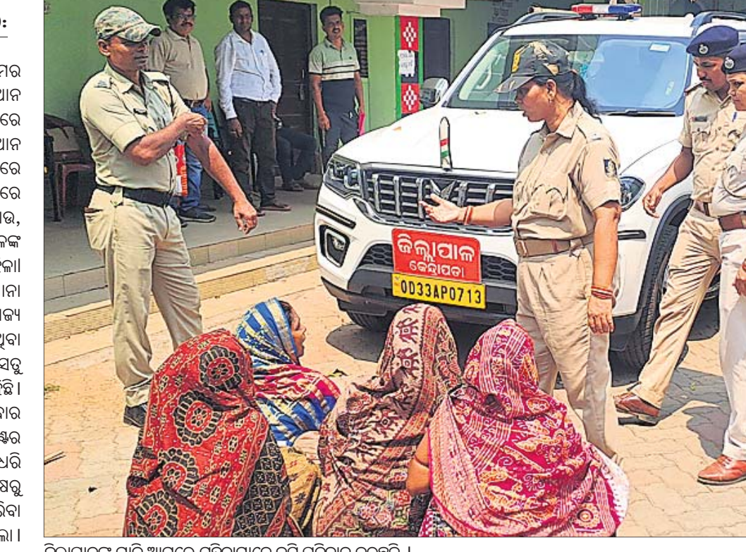
ଜିଲାପାଳଙ୍କ ଗାଡ଼ି ଆଗରେ ମହିଳାମାନେ ବସି ପ୍ରତିବାଦ କରୁଛନ୍ତି ।

ଜନମଙ୍ଗଳକାରୀ ଯୋଜନାକୁ ଆମର ବିରୋଧ ନାହିଁ । କିନ୍ତୁ ଆମକୁ ଅଧିକାର କରିବାର ବ୍ୟବସ୍ଥା ଆଗ କର ତା' ପରେ ଉତ୍ତର ଦେବା । ଯଦି ପ୍ରଶ୍ନାସନ ଅଧିକାର ନ କରି ଉତ୍ତର ଦେବାକୁ ପ୍ରସ୍ତାବ କରେ ତେବେ ଆମକୁ ଆଗ ମାରିଦେଇ ତା' ପରେ ଆମ ଘରକୁ ଉତ୍ତରଦେବି ପ୍ରକଳ୍ପ କରାଯାଉ, ଏଭଳି ଭିନ୍ନରେ ଅଟକ ରହି ଜିଲାପାଳଙ୍କ ଗାଡ଼ି ସମ୍ମୁଖରେ ଧାରଣା ଦେଲେ ମହିଳା ଏଭଳି ଏକ ଅଭିଯୋଗ ଆସିଛି ଆଜି ଥାନା ଅନ୍ତର୍ଗତ ଗୋପାଳପୁର ଗ୍ରାମର । ରାଜ୍ୟ ସରକାରଙ୍କ ପକ୍ଷରୁ ପତ୍ରପୁରଠାରେ ଥିବା ବ୍ରାହ୍ମଣୀ ନଦୀ ଉପରେ ଦ୍ୱିତୀୟ ସେତୁ ନିର୍ମାଣ ନିମନ୍ତେ ପ୍ରକ୍ରିୟା କାରି ରହିଛି । ଗୋପାଳପୁରଠାରେ କିଛି ପରିବାର ସମେତ ମନ୍ଦିର, କମ୍ୟୁନିଟି ସେଣ୍ଟର ପକ୍ଷରୁ ସରକାରୀ ଜମିକୁ ବାସ୍ତବିକ ଧରି ଦଖଲ ରଖିଥିବାରୁ ଆଜି ତହସିଲ ପକ୍ଷରୁ ଦଖଲରେ ଥିବା ଜମିଗୁଡ଼ିକୁ ମୁକ୍ତକରିବା ନିମନ୍ତେ ନୋଟିସ୍ ଦିଆ ଯାଉଥିଲା । ନୋଟିସ୍ ଲାଗିବା ପରେ ମଧ୍ୟ ସେମାନେ ସେହି ଜାଗା ଖାଲି ନ କରିବାରୁ ଏପ୍ରିଲ ୨୮ ସୁଦ୍ଧା ଖାଲି କରିବାକୁ ନିର୍ଦ୍ଦେଶ ଦିଆଯାଇଛି । ଯଦି ଏହାକୁ ଅବମାନନା କରାଯାଏ ତେବେ ୨୯ ତାରିଖରେ ସେମାନଙ୍କୁ ଉତ୍ତର ଦେବାକୁ ବୋଲି ତହସିଲ ପକ୍ଷରୁ ନୋଟିସ୍ ଦିଆଯାଇଛି । ଏହି ନୋଟିସ୍ ପାଇବା ପରେ ମହିଳାମାନେ ସେମାନଙ୍କୁ ଅଧିକାର ବ୍ୟବସ୍ଥା କରିବା ପରେ ଉତ୍ତର ନିମନ୍ତେ ଏକ ଦାବିପତ୍ର ପ୍ରଦାନ କରିଥିଲେ । ଏପରିକି