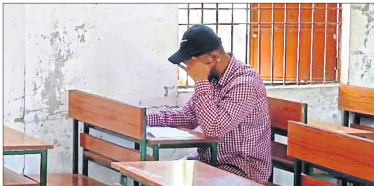
ଏକାକୀ ପରୀକ୍ଷା ଦେଉଥିବା ବିଦ୍ୟାର୍ଥୀ।

ଜଣେ ବାଣିଜ୍ୟ ବିଭାଗ ପରୀକ୍ଷାର୍ଥୀଙ୍କୁ ପରୀକ୍ଷା ପରିଚାଳକ କଳା ବିଭାଗର ରାଜନୀତି ବିଜ୍ଞାନ ପ୍ରଶ୍ନପତ୍ର ଦେଇଥିଲେ। ଛାତ୍ର ଜଣକ ମଧ୍ୟ କିଛି ବୁଝି ନ ପାରି ସେହି ପ୍ରଶ୍ନର ଉତ୍ତର ଲେଖି ଚାଲିଲେ। ପରୀକ୍ଷାର ୩ ଘଣ୍ଟା ସମୟ ସରିଆସୁଥିବା ବେଳେ ଛାତ୍ରଙ୍କୁ ଭୁଲ୍ ପ୍ରଶ୍ନପତ୍ର ଦିଆଯାଇଥିବା ପରୀକ୍ଷା ପରିଚାଳକ ଜାଣିବା ପରେ ତୁରନ୍ତ ଛାତ୍ରଙ୍କଠାରୁ ସେହି ପ୍ରଶ୍ନପତ୍ର ନେଇ ତାଙ୍କୁ ତାଙ୍କ ବିଭାଗର ପ୍ରଶ୍ନପତ୍ର ପ୍ରଦାନ କରାଯାଇଥିଲା। ମାଲକାନଗିରି ସଦରରେ ଥିବା ମାଲକାନଗିରି ମହାବିଦ୍ୟାଳୟରେ ସୋମବାର ଏଭଳି ତ୍ରୁଟି ଦେଖିବାକୁ ମିଳିଛି। ମାଲକାନଗିରି କଲେଜରେ ବ୍ୟାଚ୍ କୋର୍ସ ପାଇଁ ସୋମବାର ପୁନଃ ପରୀକ୍ଷା ଥିଲା। ବିଭିନ୍ନ ବିଷୟରେ ଫୋଲ୍ ହୋଇଥିବା ୭୫ ଜଣ ପରୀକ୍ଷାର୍ଥୀ ସୋମବାର ପୁଣି ଥରେ ନିକଟ ବ୍ୟାଚ୍