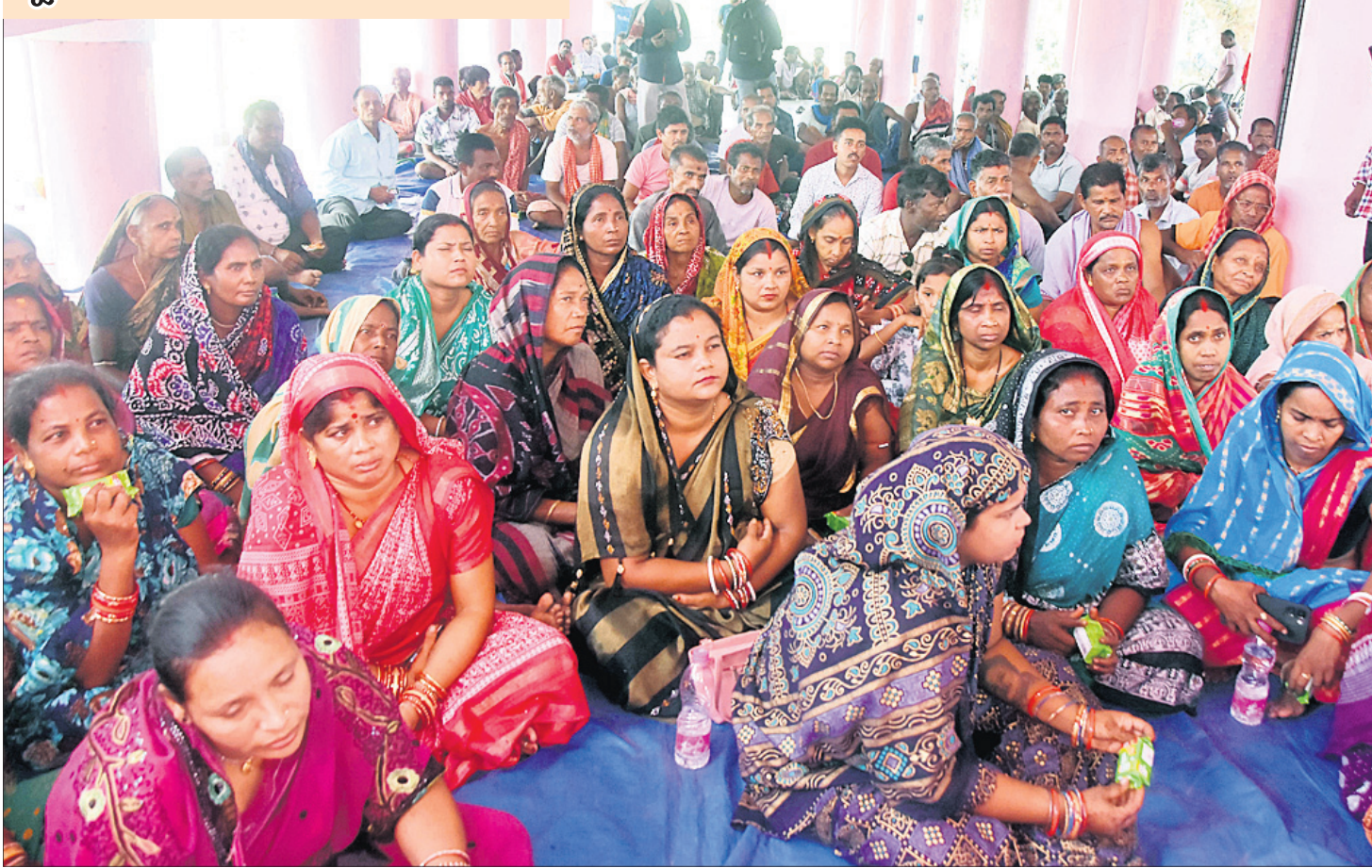
ବ୍ରହ୍ମଗିରି ବ୍ଲକ୍‌ରୁ ଆସିଥିବା ପଞ୍ଚାୟତସ୍ତର ବାଧ୍ୟାଧିକାରୀଙ୍କୁ ବିରୋଧ କରି ଶକ୍ତିଗ୍ରସ୍ତ ଗ୍ରାମବାସୀଙ୍କ ଗ୍ରାମ ସଭା।