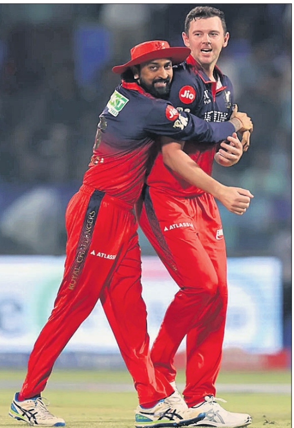
ଉତ୍କଳକେଟ ନେତା ପରେ କୋଶି ହାଜେଲଉଡ୍‌ଙ୍କ କୁନାଳ ପାଞ୍ଚାଳ ବଧେଇ।