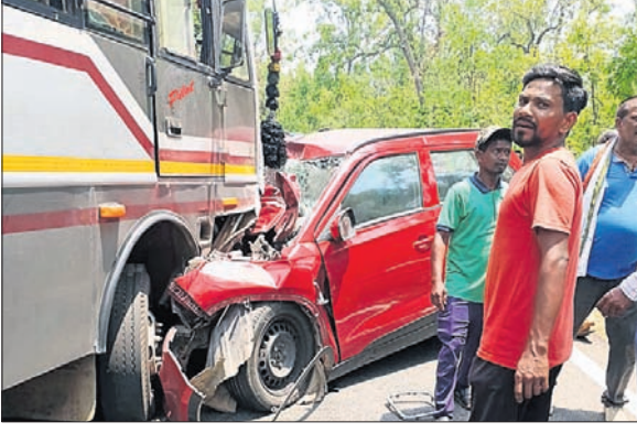
କାଦଡ଼ିଆ ନିକଟରେ ଦୁର୍ଘଟଣାଗ୍ରସ୍ତ ବସ୍ ଓ କାର୍।

ବାଲିପଦା/କରଖିଆ (ନୀଳାଦ୍ରି ବିହାରୀ ବଖୋପା/କବିତା ମହାନ୍ତ), ୨୭/୪ ମୟୂରଭଞ୍ଜ ଜିଲ୍ଲା କରଖିଆ ଉପକଣ୍ଠ ଅଞ୍ଚଳରେ ସୋମବାର ପୃଥକ ସଡ଼କ ଦୁର୍ଘଟଣାରେ ୫ଜଣଙ୍କ ମୃତ୍ୟୁ ଘଟିଥିବା ବେଳେ ୬ଜଣ ଗୁରୁତର ହୋଇଛନ୍ତି। ପୋଲିସ୍ ସମସ୍ତ ମୃତଦେହ ଜବତ କରି ବ୍ୟବଚ୍ଛେଦ ପାଇଁ ପଠାଇବା ସହ ଦୁର୍ଘଟଣାଗ୍ରସ୍ତ ଗାଡ଼ିଗୁଡ଼ିକୁ ଜବତ କରିଛି।