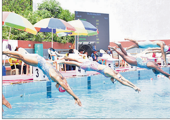
ଆଇସିଏମ୍ ସମର ଚ୍ୟାଲେଞ୍ଜ ପ୍ରତିଯୋଗିତା ଅବସରରେ ପ୍ରତିଯୋଗୀମାନେ।

ପ୍ରତିଯୋଗିତାରେ ମୋଟ ୫୬ଟି ଲକ୍ଷ୍ୟ ଅନୁଷ୍ଠିତ ହୋଇଥିଲା। ୧୫ଟି କ୍ଲବର ୫୧୪ ସୁଇଚମର ଏଥିରେ ପ୍ରତିସ୍ପନ୍ଧିତା କରିଥିଲେ। ମୋଟ ୧,୯୧୪ ବ୍ୟକ୍ତିଗତ ଏଣ୍ଟ୍ରି ସହରଣ କ୍ରୀଡ଼ାର ଲୋକପ୍ରିୟତାକୁ ସୂଚାଇଛି। ପ୍ରତି ବର୍ଷର ୩ କର୍ମ ଲେଖାଏ ଶ୍ରେଷ୍ଠ ସୁଇଚମରକୁ ପୁରସ୍କୃତ କରାଯାଇଛି। କିଏ ପକ୍ଷରୁ ସର୍ବାଧିକ ୨୯୮ ସୁଇଚମର ଅଂଶଗ୍ରହଣ କରିଥିଲେ। ଏହା ମଧ୍ୟରେ ୧୯୦ ବାଲିକା ଓ ୧୦୮ ବାଳକ ସାମିଲ। ପ୍ରଦର୍ଶନ ଦୃଷ୍ଟିରୁ ଇନ୍ଦ୍ରାୟନ ଇନ୍ଦ୍ରସିଂହଙ୍କ ଅଫ୍ ଷୋର୍ଟ୍ (ଆଇଆଇଏସ୍) ଭୂବନେଶ୍ୱରର ପ୍ରଦର୍ଶନ ପ୍ରଭାବୀ ରହିଥିଲା। ବିଭିନ୍ନ ବର୍ଗରେ ଏହାର ପ୍ରତିଯୋଗୀମାନେ ସ୍ୱର୍ଣ୍ଣ, ରୌପ୍ୟ ଓ ବ୍ରୋଞ୍ଜ ପଦକ ହାସଲ କରିଛନ୍ତି। ଗ୍ରେନମାର୍କ ଆକ୍ୱାଟିକ୍ ପାଉଡ଼େଶନର ଉଦ୍ୟମ ଯୋଗୁ କିଏ ପ୍ରତିଯୋଗୀମାନେ ପ୍ରଦର୍ଶନର ଛାପ ଛାଡ଼ିଥିବାକୁ କିଏ ଓ କିଏ ପ୍ରତିସ୍ପନ୍ଧିତା ଅନୁଷ୍ଠିତ ସାମଗ୍ରୀ ଖୁସିବ୍ୟକ୍ତ କରିଛନ୍ତି।