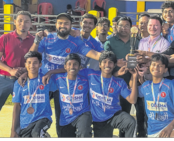
ବ୍ରୋଞ୍ଜ ପଦକ ବିଜୟୀ ଓଡ଼ିଶା ରୋଲ୍ ବଲ୍ ଦଳ।