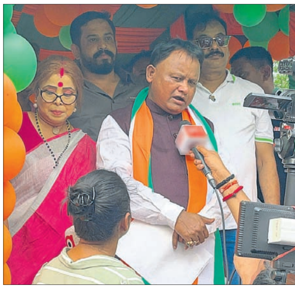
ପଶ୍ଚିମବଙ୍ଗ ବାଗୋଡା ନିର୍ବାଚନମଣ୍ଡଳରେ ମୁଖ୍ୟମନ୍ତ୍ରୀ ମୋହନ ଚରଣ ମାଝୀ ନିର୍ବାଚନ ପ୍ରଚାର କରୁଛନ୍ତି।