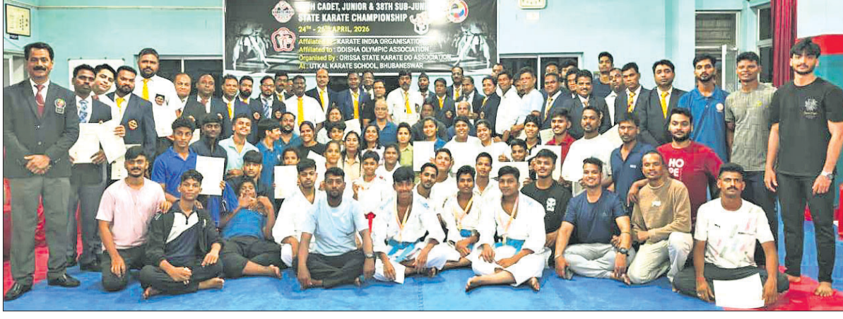
ରାଜ୍ୟସ୍ତରୀୟ କରାଟେ ପ୍ରତିଯୋଗିତାରେ ଭୁବନେଶ୍ୱର ପ୍ରତିଯୋଗୀମାନେ ଅତିଥିକ ଗହଣରେ।

ଭୁବନେଶ୍ୱର, ୨୭/୪ (ତପନ ସାଲ୍) ସ୍ଥାନୀୟ ଉତ୍କଳ କରାଟେ ସ୍କୁଲ ପରିସରରେ ରାଜ୍ୟ ସ୍ତରୀୟ ୩୨ତମ କୁନିୟର, କ୍ୟାଡେଟ୍ ଏବଂ ୩୮ତମ ସର୍ବଜୁନିୟର କରାଟେ ପ୍ରତିଯୋଗିତା ରବିବାର ଉଦ୍‌ଘାଟିତ ହୋଇଛି। ପ୍ରତିଯୋଗିତାରେ ଓଡ଼ିଶାର ବିଭିନ୍ନ ଜିଲ୍ଲାକୁ ୬୫୦ ଜଣ ପ୍ରତିଯୋଗୀ ଅଂଶଗ୍ରହଣ କରିଥିଲେ। ପ୍ରଭାବୀ ପ୍ରଦର୍ଶନ କରି ଭୁବନେଶ୍ୱର ୫ଟି ସ୍ୱର୍ଣ୍ଣ ସହ ମୋଟ ୧୮୨ ପଦକ ହାସଲ କରି