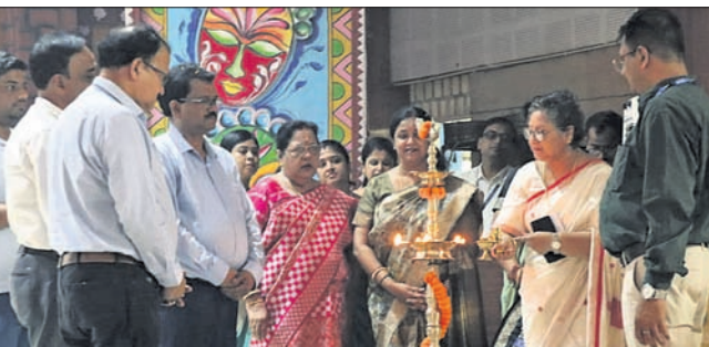
କାର୍ଯ୍ୟକ୍ରମକୁ ଅତିଥିମାନେ ଉଦ୍ଘାଟନ କରୁଛନ୍ତି।

ତାଳଚେର, ୨୭୫୪ (ମନୋଜ ନନ୍ଦ) ଅନୁଗୋଳ ଜିଲ୍ଲା ତାଳଚେରସ୍ଥିତ ଏମ୍.ଏସ୍.ଏଲ୍. ଜଗନ୍ନାଥ କ୍ଷେତ୍ର ଡିଏଭି ସ୍କୁଲର ୩୦ତମ ପ୍ରତିଷ୍ଠା ଦିବସ ପାଳିତ ହୋଇଯାଇଛି।