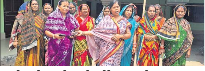
ବୁକ୍ ଅଞ୍ଚଳରୁ ଅଭିଯୋଗ କରିବାକୁ ଆସିଥିବା ଗିରିବନ୍ଧୁ ଗ୍ରାମର ମହିଳାମାନେ ।

ଆଜି, ୨୭୪(ବନମାଳୀ ସେନାପତି) କେନ୍ଦ୍ରାପଡ଼ା ଜିଲା ଆଜି ବୁକ୍ ଅଞ୍ଚଳରେ ପ୍ରବଳ ଗ୍ରାସ୍ତ୍ର ପ୍ରବାହ ମଧ୍ୟରେ ବଢ଼ିଛି ଜଳକଷ୍ଟ । ପାରମ୍ପରିକ ଜଳଉତ୍ସ ସବୁ ଶୁଷ୍କପ୍ରାୟ ହୋଇପଡ଼ିଛି । ସାମଗ୍ରିତଠାରୁ ଆରମ୍ଭକରି ପିଇବା ଯାଏ ପାଣି ପାଇଁ ଲୋକେ ତହକବିତକ ହେଉଛନ୍ତି । ଆଜି ବୁକ୍ ସଦର ପଞ୍ଚାୟତ ସେନାପତି ଗିରିବନ୍ଧୁ ଗ୍ରାମରେ ଏହିଭଳି ସମସ୍ୟା ଦେଖାଦେଇଛି । ଗିରିବନ୍ଧୁ ଜଳଯୋଗାଣ ପ୍ରକଳ୍ପ ମାଧ୍ୟମରେ ଲୋକଙ୍କୁ ପାଇପ ପାଣି ଯୋଗାଇଦେବାର ବ୍ୟବସ୍ଥା ଥିଲେ ବି ଲୋକେ ଆବଶ୍ୟକତା ଅନୁସାରେ ପାଇନାହାନ୍ତି । ଏହାର ପ୍ରତିଫଳନ ସେମାନେ ଗାଁର ଶତାଧିକ ମହିଳା ବୁକ୍ କାର୍ଯ୍ୟାଳୟ ଘେରାଇ କରିଥିଲେ । ସେମାନେ ଅଭିଯୋଗ