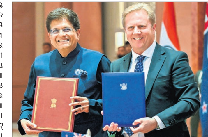
ଦୁଆବିଲ୍ଲାରେ ଭାରତ-ନ୍ୟୁଜିଲ୍ୟାଣ୍ଡ ମୁକ୍ତ ବାଣିଜ୍ୟ ଚୁକ୍ତିନାମା ସ୍ୱାକ୍ଷର ଅବସରରେ କେନ୍ଦ୍ର ବାଣିଜ୍ୟ ଓ ଶିଳ୍ପମନ୍ତ୍ରୀ ପାୟୁଷ ଗୋୟାଲ୍‌ଙ୍କ ସହ ନ୍ୟୁଜିଲ୍ୟାଣ୍ଡ ବାଣିଜ୍ୟ ଓ ନିବେଶ ମନ୍ତ୍ରୀ ଗୋର୍ଡ଼ ମାକ୍‌ଲେ।

ପୂର୍ଣ୍ଣନିବେଶ (ଏପ୍ରିଲ) ଗ୍ରହଣ କରିବ ବୋଲି ପ୍ରତିଶ୍ରୁତି ଦିଆଯାଇଛି। ଭାରତ ସହ ୪ ଯୁରୋପୀୟ ରାଷ୍ଟ୍ର କରିଥିବା ଚୁକ୍ତିନାମାରେ ୧୦୦ ବିଲିୟନ ଡଲାର