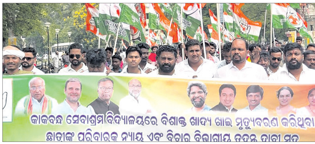
କାଳକ୍ରମେ ବିଶାଳ ଗାୟ ମୃତ୍ୟୁବରଣ କରିଥିବା ଛାତ୍ରୀଙ୍କ ପରିବାର ନ୍ୟାୟ ଏବଂ ବିଚାର ବିଭାଗୀୟ ଡକ୍ଟର ଦାବୀ ମତ