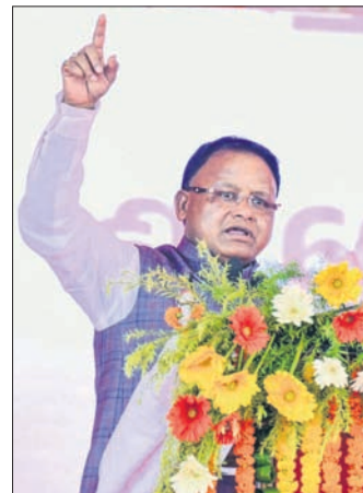
ପୁଞ୍ଜ୍ୟମନ୍ତ୍ରୀ ମୋହନ ଚରଣ ମାଝୀ ଉଦ୍‌ବୋଧନ ଦେଉଛନ୍ତି ।

କେନ୍ଦ୍ରର ଜିଲ୍ଲାରେ ବିଦ୍ୟୁତ୍ ଶକ୍ତି ବ୍ୟବସ୍ଥାର ସମ୍ପ୍ରସାରଣ ନିମନ୍ତେ ଯୋଡ଼ା ନୂଆ ଉତ୍ତରାଞ୍ଚଳରେ ମଜାଳଦାସୀ ପୁଞ୍ଜ୍ୟମନ୍ତ୍ରୀ ମୋହନ ଚରଣ ମାଝୀ ଏକ ଉଚ୍ଚସ୍ତରୀୟ ସମୀକ୍ଷା ୪୦୦/୨୨୦ କେଭି ଗ୍ରୀଡ଼ ସର୍ବସ୍ୱେଚ୍ଛାରେ ଭିତ୍ତିପ୍ରସ୍ତର ସ୍ଥାପନ କରିଛନ୍ତି । ଏହି ଅବସରରେ ୨୦୩୭ ସୁଦ୍ଧା ରାଜ୍ୟରେ ଆହୁରି ୩୪ଟି ନୂଆ ଗ୍ରୀଡ଼ ସ୍ଥାପନ ହେବ ବୋଲି ପୁଞ୍ଜ୍ୟମନ୍ତ୍ରୀ କହିଛନ୍ତି । ପୁଞ୍ଜ୍ୟମନ୍ତ୍ରୀ ପୂର୍ବରୁ ୧୯୮୩ରେ ଉତ୍ତରାଞ୍ଚଳରେ ସ୍ଥାପନ କରାଯାଇଥିବା ପାଇଁ ୧୯୮୪ରେ ୧୨୪୭ କୋଟି ଟଙ୍କା ବ୍ୟୟରେ ନିର୍ମିତ ହେବାକୁ ଥିବା ନୂତନ ଗ୍ରୀଡ଼ ସର୍ବସ୍ୱେଚ୍ଛା ସହ ୨ଟି ୨୨୦ କେଭି ଗ୍ରୀଡ଼ ସର୍ବସ୍ୱେଚ୍ଛା ଓ ୪ଟି ଗ୍ରୀଡ଼ମିଶ୍ରଣ ଲାଇନ୍ସର ଭିତ୍ତିପ୍ରସ୍ତର ସ୍ଥାପନ କରିଛନ୍ତି । ଏହି ଅବସରରେ ସେ କହିଛନ୍ତି, କେନ୍ଦ୍ରର ଜିଲ୍ଲା ସହ ଓଡ଼ିଶାର ବିକାଶକୁ ଆଗେଇନେବା ପାଇଁ ସେ କାର୍ଯ୍ୟ କରୁଛନ୍ତି । ଏହି ଉଚ୍ଚସ୍ତରୀୟ ସମୀକ୍ଷା ଗ୍ରୀଡ଼ ସର୍ବସ୍ୱେଚ୍ଛା ନିମନ୍ତେ କେନ୍ଦ୍ରର, ମୟୂରଭଞ୍ଜ, ସୁନ୍ଦରଗଡ଼ର କୋଇଲା ଆଦି ଅଞ୍ଚଳକୁ ବିଦ୍ୟୁତ୍ ସଂଯୋଗ କରାଯିବ । ଏସବୁ ଅଞ୍ଚଳର ୭ ଲକ୍ଷ ୧୭ ହଜାର ଉପଭୋକ୍ତା ମଧ୍ୟ ଉପକୃତ ହେବେ । ଏଥିସହ ଶିଳ୍ପର ଅଭିବୃଦ୍ଧି ସହ