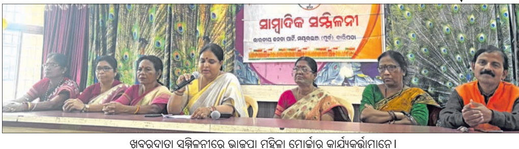
ଝରଦାତା ସମ୍ମିଳନୀରେ ଭାଜପା ମହିଳା ମୋର୍ଚ୍ଚାର କାର୍ଯ୍ୟକର୍ତ୍ତାମାନେ ।

ବାରିପଦା, ୨୮୪ (ନାଳାଦ୍ରି ବିହାରୀ ଦେବପାଟ) ଦେଶରେ ମହିଳାମାନଙ୍କୁ ସଶକ୍ତ କରିବା ପାଇଁ ଅଣାଯାଇଥିବା 'ମହିଳା ବନ୍ଦନ ଅଧିନିୟମ ବିଲ' ବିରୋଧୀ ଦଳଙ୍କ ଚକ୍ରାନ୍ତ ଯୋଗୁଁ ଅଟକି ରହିଛି । ଏହାକୁ ନେଇ ଭାଜପା ମହିଳା ମୋର୍ଚ୍ଚା ପକ୍ଷରୁ ସାରା ରାଜ୍ୟରେ ଜନଆନ୍ଦୋଳନ ପ୍ରକାଶ ପାଇବା ସହ ବିରୋଧୀଙ୍କ ପ୍ରଚ୍ଚଳନ ବେଳେ ବିରୋଧୀ ଲୋକଙ୍କ ସାମ୍ନାକୁ ଆସିଯାଇଛି । ଏହି ପରିସ୍ଥିତିରେ ଉପସଭାରେ ବିରୋଧୀ ଲୋକଙ୍କ ସାମ୍ନାକୁ ଆସିଯାଇଛି । ଏହି ପରିସ୍ଥିତିରେ ଉପସଭାରେ ବିରୋଧୀ ଲୋକଙ୍କ ସାମ୍ନାକୁ ଆସିଯାଇଛି ।