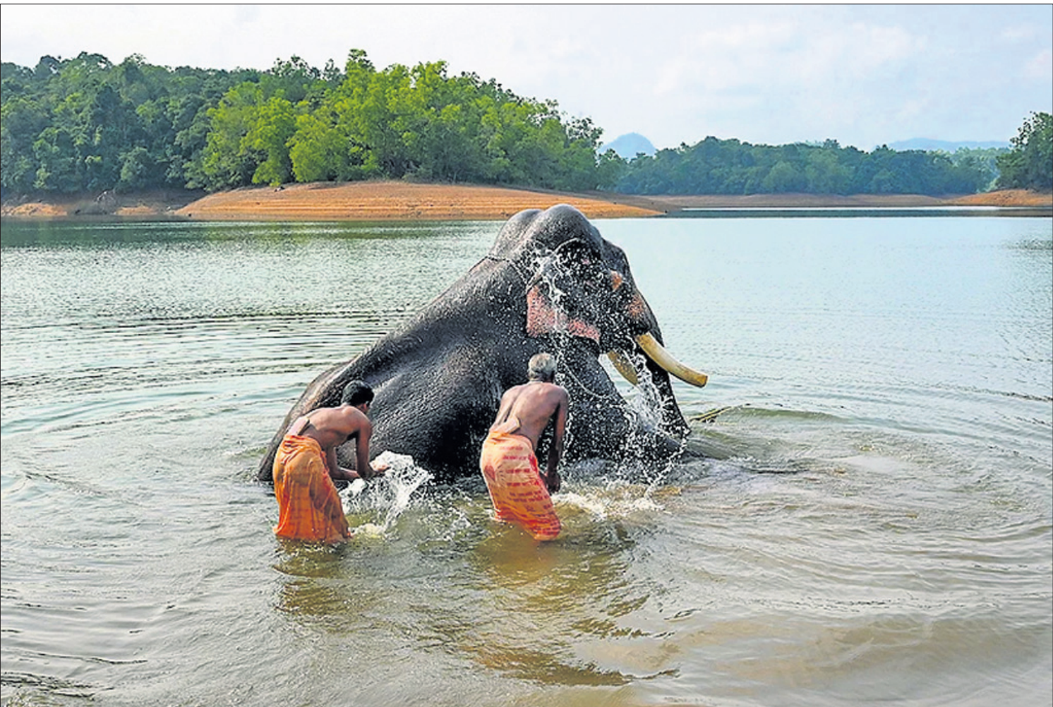
କେରଳ ଥୁରୁଭାନଗପୁରମନ୍ଦିର ନେୟାର କଳକଥାରେ ମଙ୍ଗଳବାର କୋରୁର ଏଲିଫାଣ୍ଟ ରିହାବିଳିତେଶ୍ୱର ସେଞ୍ଚରରେ ଥିବା ୮୫ ବର୍ଷୀୟ ସୋମାନ୍ ହାତୀକୁ ମାଛୁଡ଼ିମାନେ ଗାଧୋଇ ଦେଉଛନ୍ତି ।