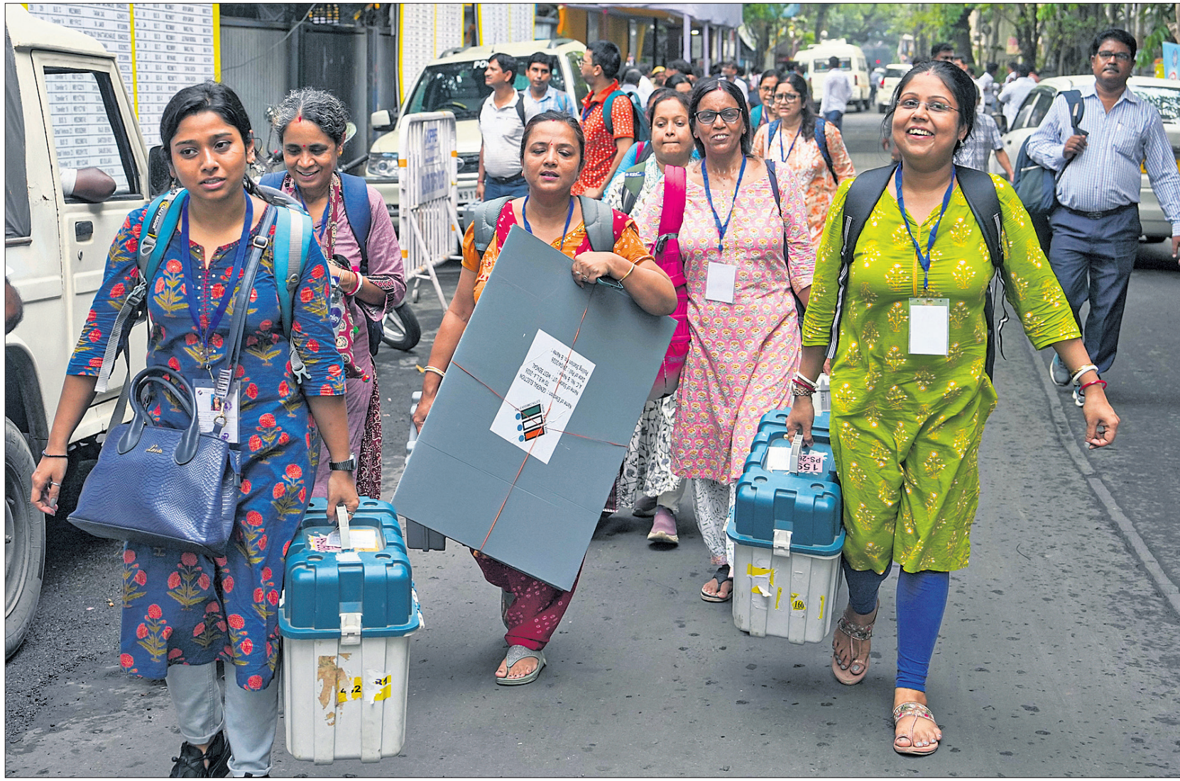
ପଶ୍ଚିମବଙ୍ଗ ବିତରଣ ପର୍ଯ୍ୟାୟ ବିଧାନସଭା ନିର୍ବାଚନ ଲାଗି ପୋଲି ଅଧିକାରୀମାନେ ମଙ୍ଗଳବାର କୋଲକାତାକୁ ଉଦ୍ଧାରଣ, ଭିତ୍ତିପତି ସମେତ ଅନ୍ୟାନ୍ୟ ଭୋଟିଂ ସାମଗ୍ରୀ ଧରି ସେମାନଙ୍କ ରୁଥ୍ ଅଭିଯୋଗ ଯାଉଛନ୍ତି।