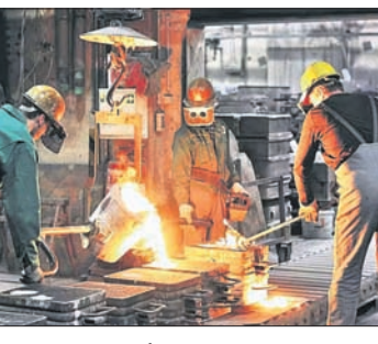
ଉତ୍ପାଦନ କ୍ଷେତ୍ରରେ କର୍ମଚାରୀମାନଙ୍କର କାର୍ଯ୍ୟ

ଗତ ବର୍ଷ ସମାନ ସମୟରେ ଏହି ଅଭିବୃଦ୍ଧି ୧.୨ ପ୍ରତିଶତ ରହିଥିଲା। କିନ୍ତୁ ଶିଳ୍ପ ଉତ୍ପାଦନ କ୍ଷେତ୍ର ମାତ୍ରାଧିକ ପ୍ରଭାବିତ ହୋଇଛି।