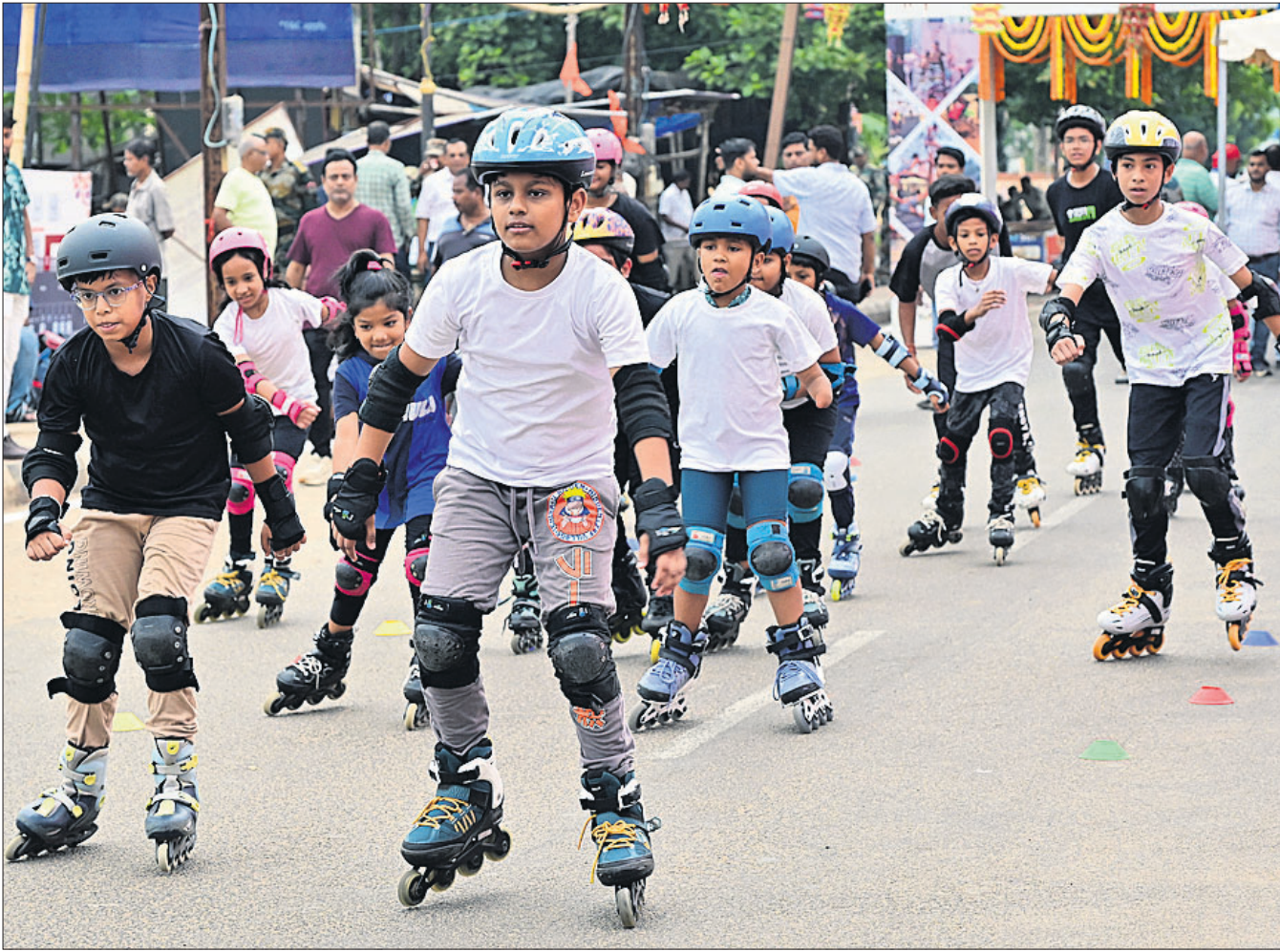
କଟକ ବାରବାଟୀ ଦୁର୍ଗ ସମ୍ମୁଖ ବାଲିଯାତ୍ରା ପଡ଼ିଆ ରାସ୍ତା ପାର୍ଶ୍ୱରେ ଅନୁଷ୍ଠିତ ପଥ ଉପର କାର୍ଯ୍ୟକ୍ରମରେ ଝିଅମାନେ ମଜା ନେଉଛନ୍ତି ପିଲାମାନେ ।