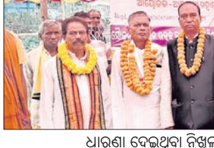
ଧାରଣା ଦେଇଥିବା ନିଖୁଳ ଉତ୍କଳ ଜୁଲ ସମାଜର କର୍ମକର୍ତ୍ତା।