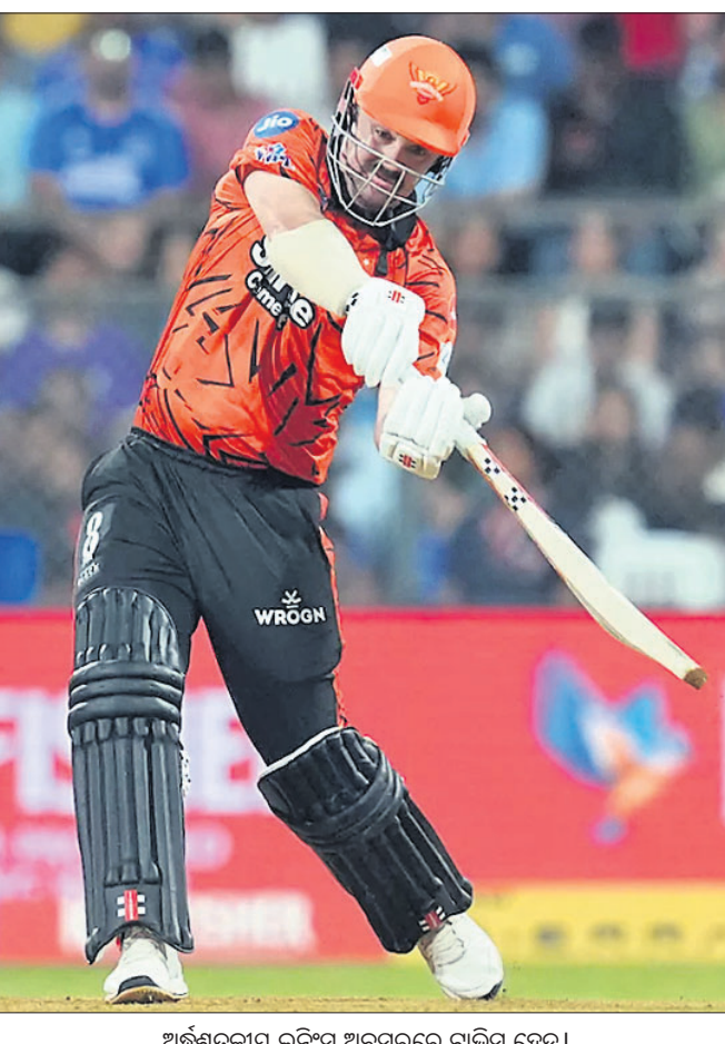
ଅର୍ଦ୍ଧଶତକୀୟ ଇନ୍ଫିଏ ଅବସରରେ ଗ୍ରାଭିସ ହେଉ।