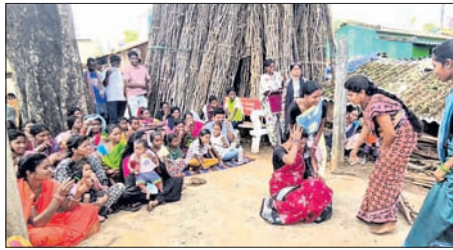
ଏନ.ଏସ୍. ସ୍ୱାମିନାଥନ ଗବେଷଣା ପ୍ରତିଷ୍ଠାନ ପକ୍ଷରୁ ଲମ୍ବତାପୁର ବ୍ଲକରେ ପଥପ୍ରାନ୍ତ ନାଟକ କରାଯାଇଛି।

କନ୍ୟାପୁର, ୨୯୪୪(ପବନ ପାଣିଗ୍ରାହୀ)-କୋରାପୁଟ ଜିଲ୍ଲା କନ୍ୟାପୁରରେ ଏନ.ଏସ୍. ସ୍ୱାମିନାଥନ ଗବେଷଣା ପ୍ରତିଷ୍ଠାନ ପକ୍ଷରୁ ଲମ୍ବତାପୁର ବ୍ଲକର ବାଲେଶ୍ୱଳ ଗ୍ରାମରେ ଗ୍ରାମ୍ୟ ଚାପଦାସ ହସ୍ତକଳା ସଚେତନତା ବୃଦ୍ଧି ପାଇଁ ଏକ ପଥପ୍ରାନ୍ତ ନାଟକ ମାଧ୍ୟମରେ ଗ୍ରାମବାସୀଙ୍କୁ ସଚେତନ କରାଯାଇଛି।