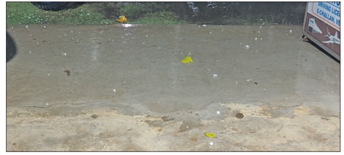
ରାସ୍ତାରେ କୁଆପଥର ପଡ଼ିଛି।

ଏଥେରୁବାଲି-କୋନେରୁ ଷ୍ଟେଶନର ୩୬ କିଲୋମିଟର, କୋଟଭାଇ-କିରାଣ୍ଡୁଲ (କେକେ) ଲାଇନର ୪୪୨ କିଲୋମିଟର ପାରକାଖେମୁଣ୍ଡି-ଗୁଣପୁରର ୫୩.୫ କିଲୋମିଟର ରେଳପଥ ରହିବ। ୧୦୭ କୋଟି ଟଙ୍କା ବ୍ୟୟରେ ନିର୍ମାଣ ଚାଲିଥିବା ନୂତନ ରେଳ ଡିଭିଜନର ଆଧୁନିକ କାର୍ଯ୍ୟାଳୟ ଭିତ୍ତିଭୂମି ରହିବ। ଏଥିରେ ତିଆରିଏବଂ କାର୍ଯ୍ୟାଳୟ ଭବନ, ବିଭାଗୀୟ ନିୟନ୍ତ୍ରଣ କାର୍ଯ୍ୟାଳୟ ଏବଂ କର୍ମଚାରୀଙ୍କ ପାଇଁ ବାସଗୃହ ସୁବିଧା ରହିବ। ଏହି ପ୍ରକଳ୍ପର କାର୍ଯ୍ୟ କୋରାପୁଟରେ ଚାଲିଛି। ଷ୍ଟାଫ୍ କାର୍ଯ୍ୟ ମଧ୍ୟ ନିର୍ମାଣ କାର୍ଯ୍ୟ ଚାଲିଥିବା ରେଳପଥ ସ୍ୱତନ୍ତ୍ର ପ୍ରକାଶ।