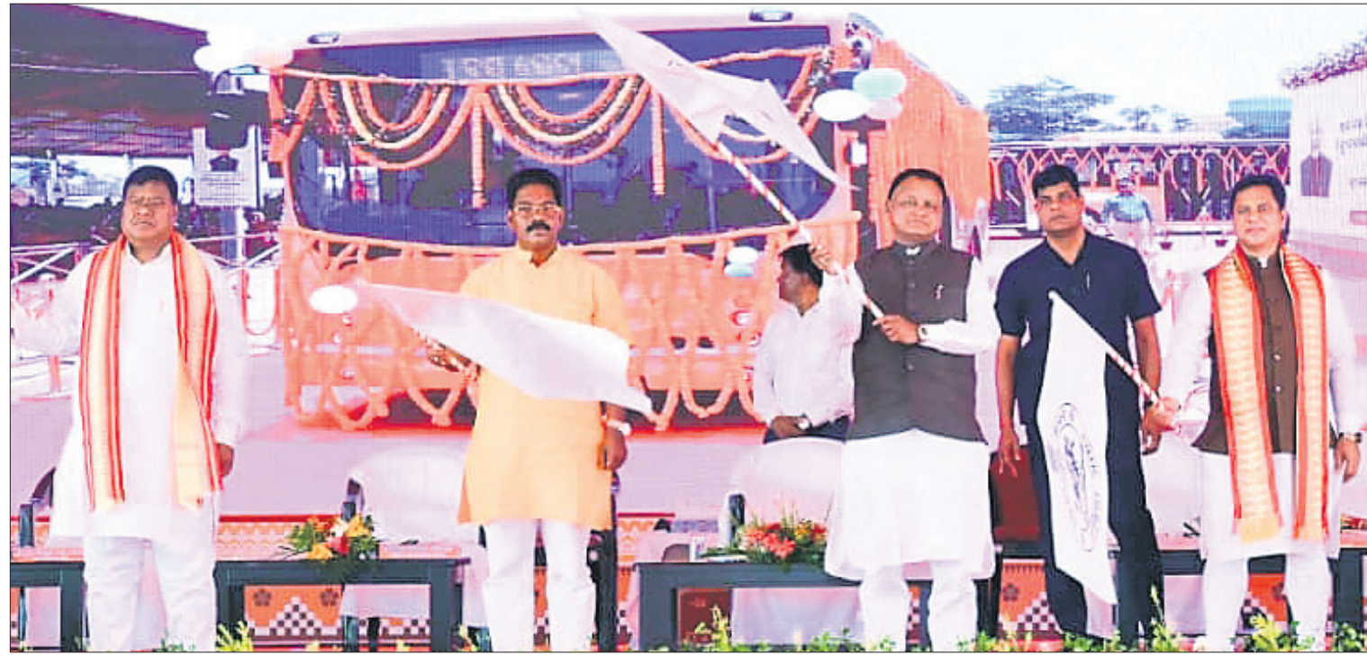
ମୁଖ୍ୟମନ୍ତ୍ରୀ ମୋହନ ଚରଣ ମାଝୀ ଓ ଅନ୍ୟ ଅତିଥି ପଠାକା ଦେଖାଇ ନୂତନ ଇ-ବସ୍ ସହ 'ଆମ ବସ୍' ଡିପୋର ଲୋକାର୍ପଣ କରୁଛନ୍ତି।