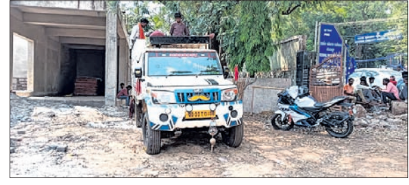
କୋରାପୁଟ ଆଞ୍ଚଳିକ ପରିବହନ ବିଭାଗ ପକ୍ଷରୁ ବୋଧାତ୍ମକ ଭାବେ ଯାତ୍ରା ନେତୃତ୍ୱ ଏକ ଡିକେ ଗାଡ଼ି ସହ ୪ ପିଲ୍ଲୁ ଜବତ କରାଯାଇଛି।

କୋରାପୁଟ, ୨୯୪୪(ଅମିତାଭ ବେହେରା)- କୋରାପୁଟ ଆଞ୍ଚଳିକ ପରିବହନ ବିଭାଗ ପକ୍ଷରୁ ବିଭାଗ ପକ୍ଷରୁ ବୋଧାତ୍ମକ ଭାବେ ଯାତ୍ରା ନେତୃତ୍ୱ ଏକ ଡିକେ ଗାଡ଼ି ସହ ୪ ପିଲ୍ଲୁ ଉପାନ୍ତ ଜବତ କରାଯାଇଛି।