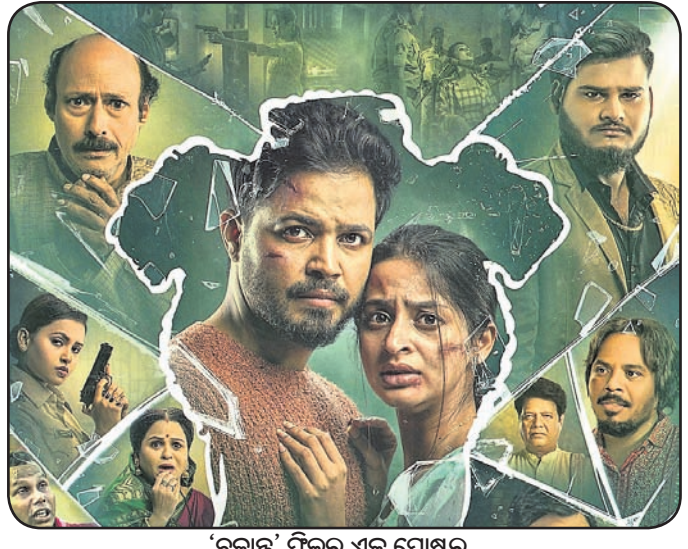
'ଚକ୍ରାନ୍ତ' ଫିଲ୍ମର ଏକ ପୋଷ୍ଟର

ରାଜ୍ୟର ଅନ୍ୟତମ ଦର୍ଶକାଦୃତ ମନୋରଞ୍ଜନ ଚ୍ୟାନେଲ ଜୀ-ସାର୍ଥକ ସବୁବେଳେ ଦର୍ଶକଙ୍କ ପସନ୍ଦକୁ ଆଧାର କରି ନୂଆ ନୂଆ ଚଳଚ୍ଚିତ୍ର ଭେଟିଦେଇଛି। ଆସନ୍ତା ମାସ ୩ ତାରିଖ ସନ୍ଧ୍ୟା ୬.୩୦ ମିନିଟରେ ଏହି ଚ୍ୟାନେଲରେ ପ୍ରଥମ ଥର ପାଇଁ ପ୍ରସାରିତ ହେବାକୁ ଯାଉଛି ନୂଆ ଓଡ଼ିଆ ଚଳଚ୍ଚିତ୍ର 'ଚକ୍ରାନ୍ତ'। ଏହାର ବିଷୟବସ୍ତୁ ଜ୍ଞାନମ-ଆଲର ଉପରେ ଆଧାରିତ। ନୈନା ଜଣେ ଗାଈଳି ନିରାହ ସୁବତୀ। ନିଜର ସ୍ୱପ୍ନ ପୂରଣ କରିବାକୁ ସେ ଭୁବନେଶ୍ୱର ଆସେ। ଏହି ସମୟରେ ସତେଯେମିତି ବୁଢ଼ାଗାଁ ତାକୁ ଅପେକ୍ଷା କରି ବସିଥାଏ। ଗୋଟିଏ ପଟରେ ଏକ ହତ୍ୟା ମାମଲାରେ ସେ ଛନ୍ଦି ହୋଇଯାଏ। ସେପଟେ ପ୍ରେମିକ ଦ୍ୱାରା ପ୍ରତାରିତ ହୁଏ। ତେବେ ଏଭଳି ସମୟରେ ନୈନା କ'ଣ କରେ ? ସେ କ'ଣ ନିଜକୁ ନିର୍ଦୋଷ ବୋଲି ପ୍ରମାଣିତ କରିପାରେ ? ଅନ୍ୟପକ୍ଷରେ ସେ କ'ଣ ନିଜ ପ୍ରେମିକକୁ ପୁଣି ଥରେ ଫେରିପାଏ ? ଏମିତି ଅନେକ ଅସମ୍ଭବ ପ୍ରଶ୍ନାବଳୀର ଉତ୍ତର ଏହି ଫିଲ୍ମରେ ରହିଛି। ପୂର୍ବରୁ ପ୍ରେକ୍ଷକମାନଙ୍କୁ