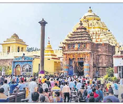
ପୁରୀ ବାସିନ୍ଦା ସେମାନଙ୍କ ଅତି ଆବଶ୍ୟକ ସମୟରେ ଶ୍ରୀମନ୍ଦିର ପ୍ରବେଶକୁ ବଞ୍ଚିତ ହେବାରୁ ୧୪୫୨୭ ତାରିଖରୁ ପ୍ରତିଦିନ ଭକ୍ତ ସାଲବେଗ ପାଠକୁ ଶ୍ରୀମନ୍ଦିର ପର୍ଯ୍ୟନ୍ତ ସେତେବେଳା ଯାତ୍ରା ଆରମ୍ଭ କରିଛନ୍ତି। ଏଥିରେ ବିଭିନ୍ନ ବର୍ଗର ମହିଳାଙ୍କ ସମେତ ବରିଷ୍ଠ ନାଗରିକ ଯୋଗଦେଉଛନ୍ତି। ପୁରୀ ସହରବାସୀଙ୍କ ପାଇଁ କିଛି ସ୍ୱତନ୍ତ୍ର ବ୍ୟବସ୍ଥା କରାଯିବ ବୋଲି କୁହାଗଲେ ମଧ୍ୟ ତାହା ଏଯାବତ୍ କାର୍ଯ୍ୟକାରୀ ହୋଇ ନ ଥିବାବେଳେ ଲୁଚ୍ ବୁଦ୍ଧି ବ୍ୟବସ୍ଥା ସେମାନଙ୍କୁ ଅଧିକ ଅସୁବିଧା କରାଇଛି। ଏଠାରେ ଶ୍ରେୟସିଦା ଦରକାର ଯେ ଶ୍ରୀମନ୍ଦିରର ବ୍ୟବସ୍ଥାବଳୀ ସାର

ସହାୟକରଣ ଉଦ୍ଦେଶ୍ୟ ରହିଥିଲା। ଏହି ସମୟରେ ବହୁ ଲକ୍ଷ ଟଙ୍କା ବ୍ୟୟରେ ସିଂହଦ୍ୱାର ପର୍ଯ୍ୟନ୍ତ ହେଉଥିବା ଧାଡ଼ିରେ ପଡ଼େ ଦେଖାଇ ଶ୍ରୀମନ୍ଦିରରେ ଶୁଖିକିତ ଦର୍ଶନର ବ୍ୟାପକ ପ୍ରଚାର ଯୋଗୁ ଭକ୍ତଙ୍କ ସଂଖ୍ୟା ବଢ଼ିଗଲା। ଅପରପକ୍ଷରେ ୪ଦ୍ୱାର ଖୋଲିବା ୨୦୨୪ ନିର୍ବାଚନ ପୂର୍ବରୁ ଭାଙ୍ଗିପାର ନିର୍ବାଚନୀ ମୁଦ୍ଦା ହୋଇଗଲା ଓ ପଳଦାୟୀ ମଧ୍ୟ ହେଲା। ଭାଙ୍ଗିଯାଏ ସରକାର ଶପଥ ଗ୍ରହଣ ଦିନ ଏହାକୁ କାର୍ଯ୍ୟକାରୀ କରିବାକୁ ଯୋଷାକାକରି କିଛିଦିନ ପରେ ତାହା କାର୍ଯ୍ୟକାରୀ କରିବାରେ ପୂର୍ବରୁ ପଶ୍ଚିମ ଦ୍ୱାର ବେଇ ପୁରୀ ସହରବାସୀଙ୍କ ପ୍ରବେଶ ବାଧାପ୍ରାପ୍ତ ହେଲା।