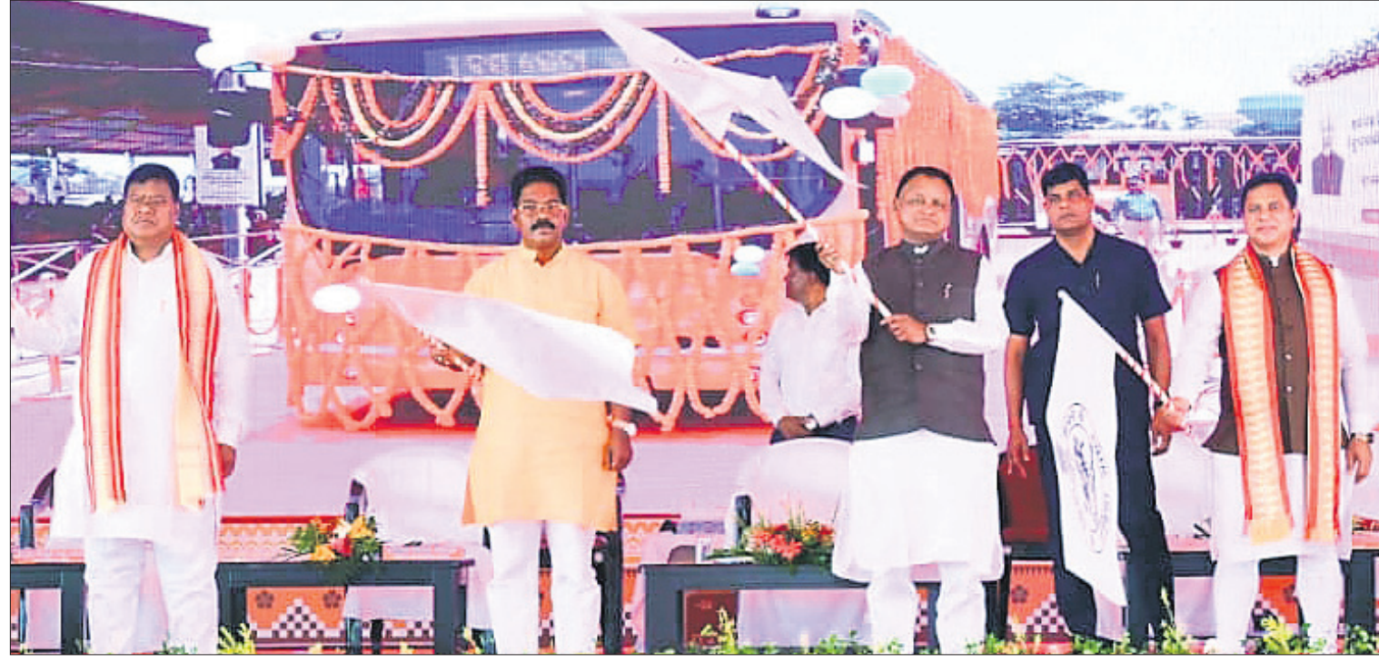
ମୁଖ୍ୟମନ୍ତ୍ରୀ ମୋହନ ଚରଣ ମାଝୀ ଓ ଅନ୍ୟ ଅତିଥି ପଠାକା ଦେଖାଇ ନୂତନ ଇ-ବସ୍ ସହ 'ଆମ ବସ୍' ଡିପୋର ଲୋକାର୍ପଣ କରୁଛନ୍ତି।