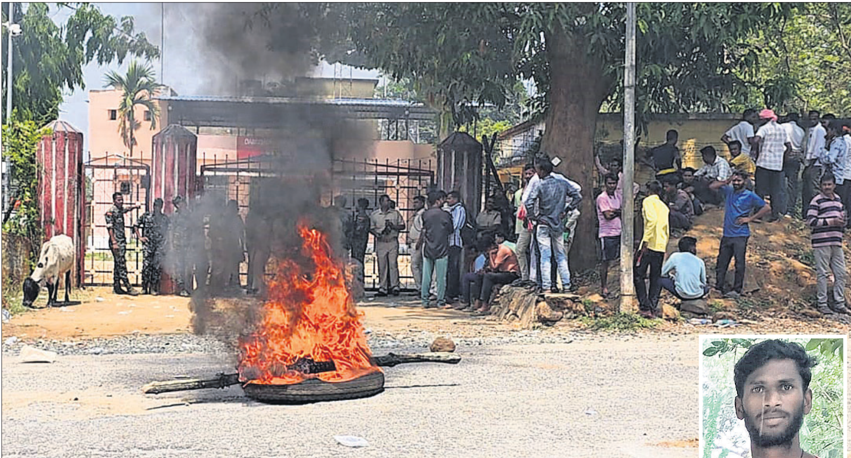
ହାଜତ ମୃତ୍ୟୁ ପ୍ରତିବାଦରେ ପରିବାର ଏବଂ ଗ୍ରାମବାସୀ ଡାକୁଗାଁ ଥାନା ସମ୍ମୁଖରେ ଚାନ୍ଦିଆ ଗୋଡ଼ା ପ୍ରଦର୍ଶନ କରୁଛନ୍ତି।

ଘୋଳିସ ପାଡ଼ରେ ମୃତ୍ୟୁ ହୋଇଥିବା ପରିବାର ଲୋକଙ୍କ ଅଭିଯୋଗ, ଉତ୍ତେଜନା