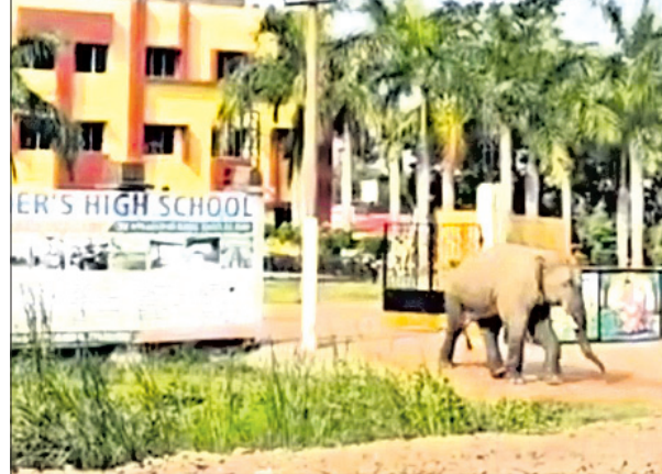
ବିଦ୍ୟାଳୟ ସମ୍ମୁଖରେ ହାତୀ।

ବାଲେଶ୍ୱର ଜିଲ୍ଲା ଅଧୀନ ବାନ୍ଧିପୁରରେ ରୁଧିବାର ହାତୀ ଉପଦ୍ରବ ଦେଖିବାକୁ ମିଳିଛି। ଏକ ଦଳ ହାତୀ ସ୍ଥାନୀୟ ସେକ୍ସା କାରିକାର୍ଯ୍ୟ ହାତୀକୁ ପରିସରରେ ବୁଲୁଥିବା ଦେଖି ସ୍ଥାନୀୟ ଲୋକଙ୍କ ମଧ୍ୟରେ ଆତଙ୍କ ଖେଳିଯାଇଛି। ମଙ୍ଗଳବାର ସନ୍ଧ୍ୟାରେ, ଶାସନ ଓ ରେଭିନ୍ ପଞ୍ଚାୟତର ବହୁ ଗାଁରେ ହାତୀଙ୍କ ଉପଦ୍ରବ ଦେଖିବାକୁ ମିଳିଥିଲା।