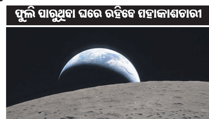
ପୁଲି ପାରୁଥିବା ଘର ରହିବେ ମହାକାଶଚାରୀ