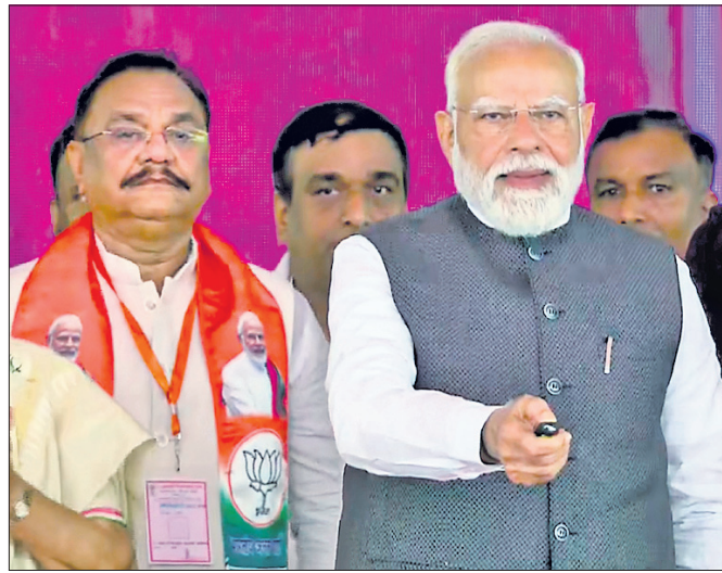
ପ୍ରଧାନମନ୍ତ୍ରୀ ନରେନ୍ଦ୍ର ମୋଦି ସୁଭର୍ ଚିପି ଗଙ୍ଗା ଏକ୍ସପ୍ରେସ୍‌ଫ୍ରେ ଉଦ୍‌ଘାଟନ କରୁଛନ୍ତି । ଉଦ୍‌ଘାଟନ ରାଜ୍ୟର ବିଭାଗ ଯାତ୍ରାକୁ ଆଦିତ୍ୟନାଥ କହିଛନ୍ତି । ଏହି ୬ ଲେନ୍ ନୂଆ ଗତି ଦେବ ବୋଲି ମୁଖ୍ୟମନ୍ତ୍ରୀ ରାସ୍ତା ପ୍ରାମାଣ୍ୟ, କୃଷକ, ଉଦ୍ୟୋଗୀ ଏବଂ

ସୁବର୍ଣ୍ଣକ ପାଇଁ ଲାଇଫ୍‌ଲାଇନ ଭାବେ କାର୍ଯ୍ୟ କରିବ ଏବଂ ବିକାଶକୁ ଉତ୍ତମ କରିବାର ପ୍ରମୁଖ ଭୂମିକା ନେବ । ଉକ୍ତ ଏକ୍ସପ୍ରେସ୍‌ଫ୍ରେ ୧୨ଟି ମୁଖ୍ୟ ଜିଲା ମାରଟ୍, ହାପୁର, ବୁଲନ୍ଦସହର, ଆମ୍ବୋହା, ସମଲ, ବଦାଉନ୍, ଶାହଜାହାନପୁର, ହାର୍ଦ୍ଦେଇ, ଉଜ୍ଜାପୁର, ରାଏବରେଲି, ପ୍ରତାପଗଡ଼ ଏବଂ ପ୍ରୟାଗରାଜକୁ ଯୋଡ଼ିବା ସହ ଯାତ୍ରା ସମୟକୁ ଯଥେଷ୍ଟ କମାଇବ ବୋଲି ଆଶା କରାଯାଉଛି । ଉକ୍ତ ଏକ୍ସପ୍ରେସ୍‌ଫ୍ରେ ଏକ ବିଶେଷତ୍ୱ ହେଲା ବାୟୁଶାନ୍ତ ଦିନାନ୍ତର କରୁଛି । ଅବତରଣ ପାଇଁ ଶାହଜାହାନପୁର ନିକଟରେ ୩.୨ କି.ମି. ଦୀର୍ଘ ଏକ ଏୟାରଷ୍ଟ୍ରିପ୍ ରହିଛି । ଏହା ବ୍ୟତୀତ ଏକ୍ସପ୍ରେସ୍‌ଫ୍ରେରେ ଇଣ୍ଟେଲିଜେଣ୍ଟ ଟ୍ରାଫିକ୍ ମ୍ୟାନେଜମେଣ୍ଟ ସିଷ୍ଟମ୍ (ଆଇଟିଏମ୍‌ଏସ୍), ସିପିଟି ସିଷ୍ଟମ୍, ସୁରକ୍ଷା ପାଇଁ କରୁଛି କଲ୍ ବକ୍ସ, ଆଲୁମିନିୟମ୍ ଓ ପାସ୍ତାଲିଂ ଯୁକ୍ତି ରହିଛି ।