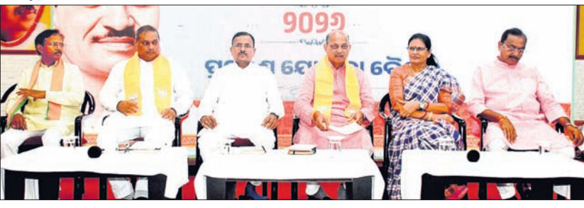
ଭାଜପା ରାଜ୍ୟ କାର୍ଯ୍ୟାଳୟରେ ପ୍ରବେଶପ୍ରଦାୟ ଜିଲା ପ୍ରଶିକ୍ଷଣ ବର୍ଗ ଯୋଜନା ବୈଠକରେ ବକାୟ ନେତୃତ୍ୱ।