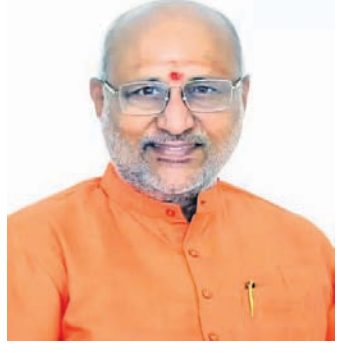
ଶ୍ରୀ ଯି. ପି. ରାଧାକୃଷ୍ଣନ ଉପରାଷ୍ଟ୍ରପତି