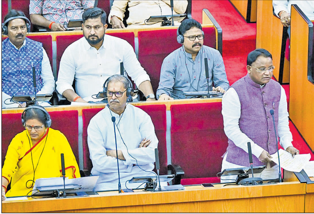
ଗୁରୁବାର ବିଧାନସଭାର ସ୍ୱତନ୍ତ୍ର ଅଧିବେଶନରେ ମୁଖ୍ୟମନ୍ତ୍ରୀ ମୋହନ ଚରଣ ମାଝୀ ଉଦ୍‌ବୋଧନ ଦେଉଛନ୍ତି।

ମହିଳାଙ୍କୁ ଚଳା ଦେଇଦେଲେ ମହିଳା ସଶକ୍ତୀକରଣ ହୁଏ ନାହିଁ ବୋଲି ମୁଖ୍ୟମନ୍ତ୍ରୀ ମୋହନ ଚରଣ ମାଝୀ କହିଛନ୍ତି। ବିଧାନସଭାର ସ୍ୱତନ୍ତ୍ର ଅଧିବେଶନରେ 'ଗଣତନ୍ତ୍ରରେ ମହିଳାମାନଙ୍କ ଭୂମିକା' ଶୀର୍ଷକ ଆଲୋଚନା ଆରମ୍ଭ କରି ମୁଖ୍ୟମନ୍ତ୍ରୀ କହିଛନ୍ତି, ମହିଳା ସଶକ୍ତୀକରଣ, ବିଶେଷଭାବେ ରାଜନୈତିକ ସଶକ୍ତୀକରଣ ବିଷୟରେ ଆଲୋଚନା ପାଇଁ ଏହି ଅଧିବେଶନ ଆୟତ୍ତ କରାଯାଇଛି। ସେ କହିଛନ୍ତି, ରାଜ୍ୟରେ ଗତ କିଛି ଦଶନ୍ଧି ଧରି ସବୁ ରାଜନୈତିକ ଦଳ ମହିଳା ସଶକ୍ତୀକରଣ ବିଷୟରେ ଆଲୋଚନା କରୁଛନ୍ତି। କିନ୍ତୁ ତାଙ୍କ ପାଇଁ ମହିଳା ସଶକ୍ତୀକରଣର ସଂଜ୍ଞା ଅତି ସରଳ। ସେମାନଙ୍କ ପାଇଁ ମହିଳା ସଶକ୍ତୀକରଣର ଅର୍ଥ ହେଉଛି କେବଳ ଅର୍ଥନୈତିକ ପ୍ରଭାବରେ ଆତ୍ମନିର୍ଭରଶୀଳତା। ତେଣୁ ସ୍ୱୟଂ ସହାୟକ ଗୋଷ୍ଠୀ (ଏସ୍‌ଏସ୍‌ସି) ଗଠନ କରି କିଛି ଚଳା ଦେଇଦେଲେ ସେମାନେ ଭାବନ୍ତି ଯେ ମହିଳାମାନେ ସଶକ୍ତ ହୋଇଗଲେ। ମାତ୍ର ଏହା ଏକ ଭ୍ରାନ୍ତଧାରଣା। ସଶକ୍ତୀକରଣର ପ୍ରକୃତ ସଂଜ୍ଞା ହେଉଛି ନିଜେ ନିଜ ପାଇଁ, ପରିବାର ପାଇଁ ଏବଂ ସମାଜ ପାଇଁ ନିଷ୍ପତ୍ତି ନେବାର ଅଧିକାର। ସାମାଜିକ, ଅର୍ଥନୈତିକ ଏବଂ ରାଜନୈତିକ କ୍ଷେତ୍ରରେ ସଶକ୍ତୀକରଣ ହେବା ହିଁ ହେଉଛି ପ୍ରକୃତ ଅର୍ଥରେ ମହିଳା ସଶକ୍ତୀକରଣ ବୋଲି ମୁଖ୍ୟମନ୍ତ୍ରୀ କହିଛନ୍ତି। ଏଥିସହ ସେ କହିଛନ୍ତି, ଦେଶ ସ୍ୱାଧୀନ ହେବାର ପ୍ରାୟ ୮୦ ବର୍ଷ ହୋଇଗଲାଣି। ଏହି ୮ ଦଶକରେ ଦେଶର ଡିଆଁ ଓ ମହିଳାମାନେ ସବୁ କ୍ଷେତ୍ରରେ ପାରଙ୍ଗମ ହାସଲ କରିଛନ୍ତି।