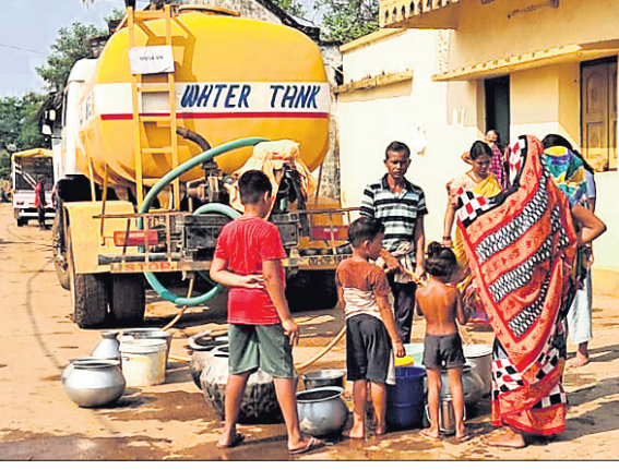
ପତାକା ଗ୍ରାମରେ ପହଞ୍ଚିଲା ଫାକର ପାଣି।