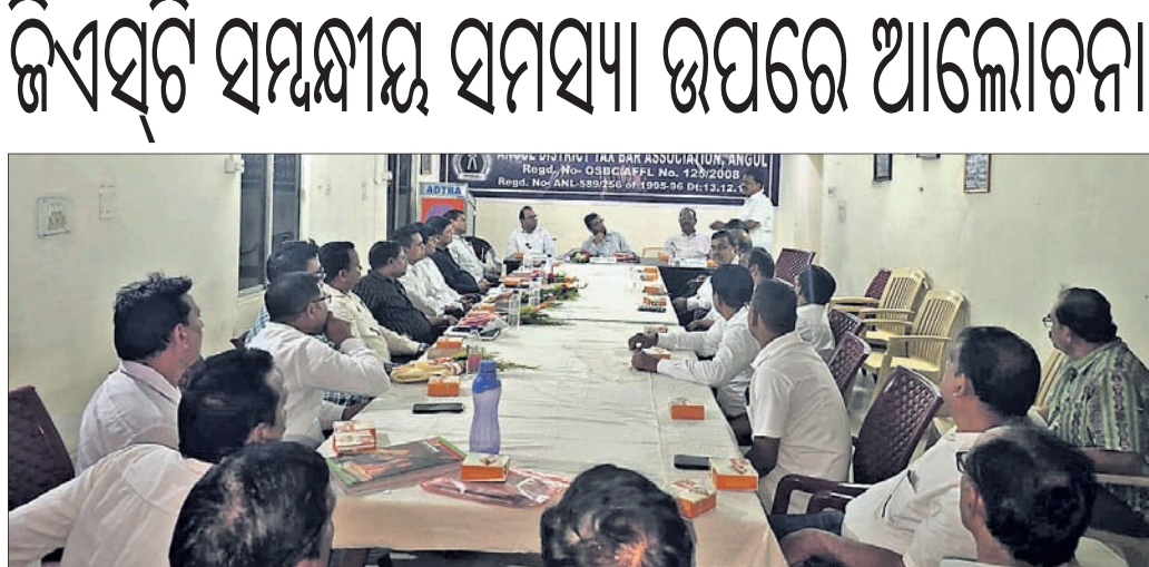
ଚାକ୍ଷୁ ବାଂ ଆସୋସିଏଟସ୍ ହଲ୍‌ରେ ଅନୁଷ୍ଠିତ ବିଠକରେ ଉପସ୍ଥିତ ଅଧିକାରୀମାନେ।