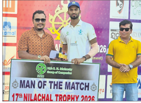
ମ୍ୟାଚ ଅଫ ଦି ମ୍ୟାଚ ପୁରସ୍କାର ପ୍ରଦାନ କରାଯାଉଛି।