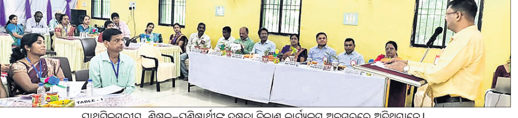
ପ୍ରାଥମିକସ୍ତରୀୟ ଶିକ୍ଷକ-ପ୍ରଶିକ୍ଷାର୍ଥୀଙ୍କ ଦକ୍ଷତା ବିକାଶ କାର୍ଯ୍ୟକ୍ରମ ଅବସରରେ ଅତିଥିମାନେ।