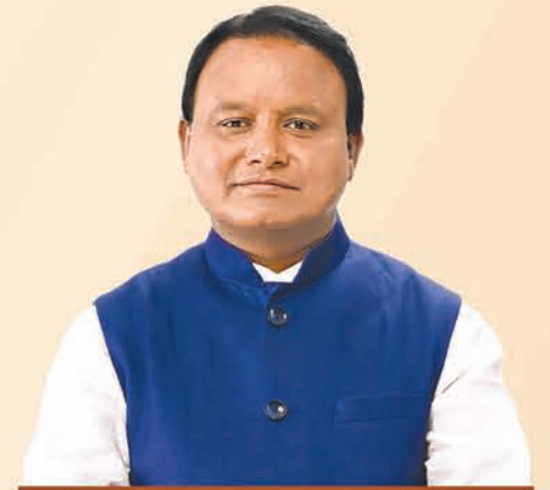
ଶ୍ରୀ ମୋହନ ଚରଣ ମାଝୀ ମୁଖ୍ୟମନ୍ତ୍ରୀ, ଓଡ଼ିଶା