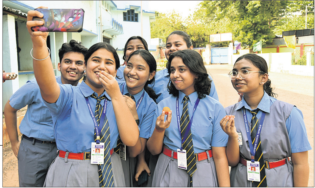
ଆଇସିଏସ୍‌ଇ ଦଶମ ଓ ଆଇଏସ୍‌ସି ଦ୍ୱାଦଶ ପରୀକ୍ଷା ଫଳ ଗୁରୁବାର ପ୍ରକାଶ ପାଇବା ପରେ ଭୁବନେଶ୍ୱରସ୍ଥିତ ସ୍ନିହାର୍ତ୍ତ ସ୍କୁଲର ଛାତ୍ରଛାତ୍ରୀ ଖୁସି ମନାଉଛନ୍ତି।

୯୮.୨୭% ରହିଥିବାବେଳେ ଦ୍ୱାଦଶରେ ପାଠ୍ୟହାର ବର୍ତ୍ତମାନ ୯୯.୨୭% ଓ ପଞ୍ଜାବୀ ବର୍ତ୍ତମାନ ୯୯.୩୮% ରହିଛି। ଓଡ଼ିଶାରେ ଆଇସିଏସ୍‌ଇ ପାଠ୍ୟହାର ୯୯.୧୭% ଓ ପଞ୍ଜାବୀ ୯୯.୧୭% ଥିବାବେଳେ ୯୯.୨୪% ପରୀକ୍ଷାର୍ଥୀ ଆଇଏସ୍‌ସିରେ କୃତକାର୍ଯ୍ୟ ହୋଇଛନ୍ତି।