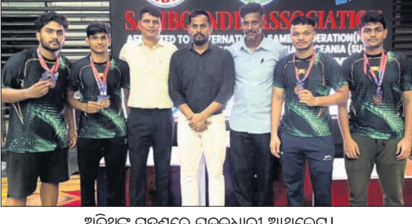
ଅତିଥିକ ଗହଣରେ ପଦକଧାରୀ ଆସିଲେ।

ଭୁବନେଶ୍ୱର, ୩୦୧୪ (ବିଜୟ ରଣା) କେରଳର କୋଡିକୋଡ଼ାରେ ୨୩ ରୁ ୨୬ ତାରିଖ ମଧ୍ୟରେ ଅନୁଷ୍ଠିତ ଜାତୀୟ ସାମ୍ପୋ ଖେଳ ପ୍ରତିଯୋଗିତାରେ ଉତ୍କଳ କରାଡେ ସ୍କୁଲରୁ ଭାଗ ନେଇଥିବା ଖେଳାଳି ମାନେ ବିଭିନ୍ନ ବିଭାଗରେ ୫ ସ୍ୱର୍ଣ୍ଣ, ୧ ରୌପ୍ୟ ଓ ୨ ବ୍ରୋଞ୍ଜ ସମେତ ୮ ଟି ପଦକ ହାସଲ କରିଛନ୍ତି।