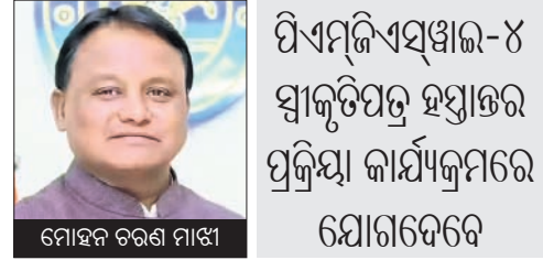
ମୋହନ ଚରଣ ମାଝୀ