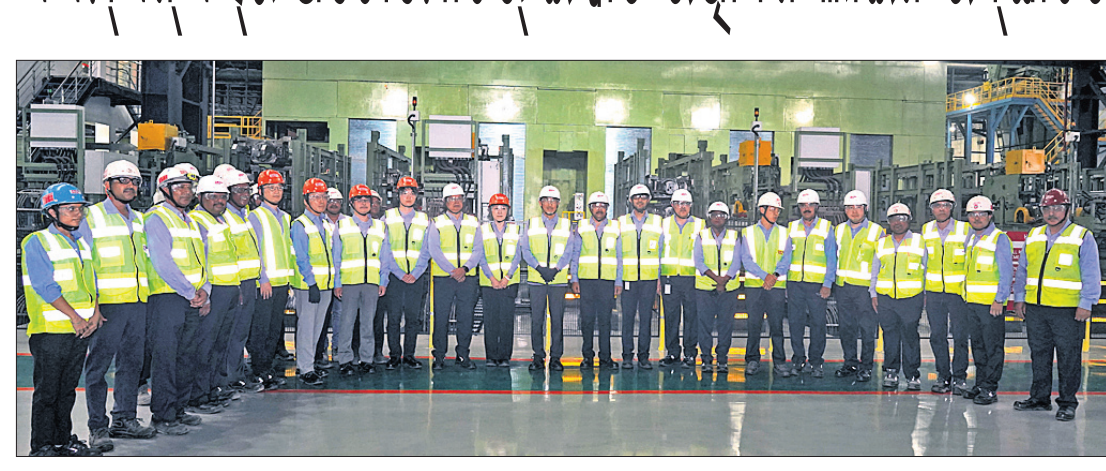
ଭୁବନେଶ୍ୱର, ୩୦।୪ (ଅନୁରାଧା ମହାରଣା)

ଆର୍ଯ୍ୟଲମିଟଲ ନିପୁନ୍ ଷ୍ଟିଲ୍ ଇଣ୍ଡିଆ (ଏଏମ୍‌ଏନ୍‌ଏସ୍ ଇଣ୍ଡିଆ) ପକ୍ଷରୁ ଶୁଭକାରୀ ଉଦ୍‌ଘାଟନ କାର୍ଯ୍ୟକ୍ରମରେ ଭାରତର କାମ୍ୟାପୁର ରାଷ୍ଟ୍ରପୂର୍ବ କେନ୍ଦ୍ର ଓଡ଼ିଶା ସ୍ୱରାଜ୍ୟ ଏକ ଆଧୁନିକ ପିକଲିଂ ଲାଇନ୍ ଏବଂ ଗାଞ୍ଜେନ୍ କୋଲ୍ ମିଲ୍ (ପିଏଲଟିସିଏମ୍) ଉଦ୍‌ଘାଟିତ ହୋଇପାରିଛି। ବାର୍ଷିକ ୨ ନିୟୁଟନ୍ ଫୋର୍ସ ପ୍ରତି ବର୍ଷ ଏହା ଅଧିକାଂଶ ପିକଲିଂ କାର୍ଯ୍ୟକ୍ରମ ପୂର୍ଣ୍ଣ କରିବ। ଆଧୁନିକ ଅଗୋମୋତିଭ୍ ଇସ୍ପାତ ଉତ୍ପାଦନ ସହାୟତା ନିମନ୍ତେ ଉଚ୍ଚ ଶକ୍ତିସମ୍ପନ୍ନ ଗାଳଭାନିଲ୍ (ଜିଆଇ),