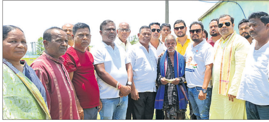
ୟୁଏ କଂଗ୍ରେସର ପ୍ରତିନିଧି ଦଳ ପକ୍ଷରୁ ଜିଲ୍ଲା ପାଟଣା ବ୍ଲକ୍ ସହାୟତା ପ୍ରଦାନ କରାଯାଇଛି।