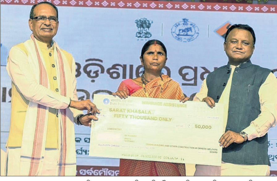
ମୁଖ୍ୟମନ୍ତ୍ରୀ ମୋହନ ଚରଣ ମାଝୀ ଏବଂ କେନ୍ଦ୍ର କୃଷି ଓ ଗ୍ରାମ ଉନ୍ନୟନ ମନ୍ତ୍ରୀ ଶିବରାଜ ଦି ଚୌହାନ ଜଣେ ହିରାଧିକାରୀଙ୍କୁ ବିବାହ ସହାୟତା ଚାହିଁ ପ୍ରଦାନ କରୁଛନ୍ତି।

ପ୍ରତି କୃଷି ଗ୍ରାମକୁ 'ବିହନ ଗ୍ରାମ'ରେ ଗଢ଼ି ତୋଳିବାକୁ ଇଚ୍ଛା ଅଛି: ଶିବରାଜ