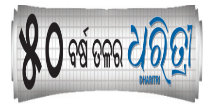
୩ ମେ ୧୯୭୭

ନିତିଆକତାକୁ ସାମଗ୍ରୀ ତିଆରି କରିବାରେ ଯେତିକି ବ୍ୟବହାର କରାଯାଉଛି ତାହାଠାରୁ ଅଧିକ ବର୍ଷ ଆକାରରେ ପିଲି ଦିଆଯାଉଛି। ତେବେ ଏହି କଡ଼ା ବର୍ଷକୁ କେରଳର ଅର୍ଦ୍ଧା ମାଧ୍ୟର ସଂଗ୍ରହ କରି ସେଥିରୁ ପ୍ୟାକେଟିଂ ଉତ୍ପାଦ ପ୍ରସ୍ତୁତ କରୁଛି। ଅର୍ଦ୍ଧାକ କରସ ୨୯ । ସେ ୨୦୧୨ରେ ଗ୍ରାନାରେ କମ୍ପାନୀ ପ୍ରତିଷ୍ଠା କରି ଠିକ୍ ପ୍ଲାଷ୍ଟିକ ଭଳି ଦେଖାଯାଉଥିବା ପରିବେଶ ଉପଯୋଗୀ ବାୟୋପଲିମର ଉତ୍ପାଦନ କରୁଛି, ଯାହା ଖାଦ୍ୟ, ଔଷଧ ଏବଂ କର୍ମଚାରୀଙ୍କ ପ୍ୟାକେଟିଂରେ ବ୍ୟବହାର ହେଉଛି। ଏହି ପ୍ୟାକେଟିଂ ଉତ୍ପାଦ ବିକ୍ରୟ ଯୋଗ୍ୟ ଏବଂ କମ୍ ଦିନରେ ମାଟିରେ ମିଶିଯାଉଛି। ଏହା ପ୍ଲାଷ୍ଟିକ ପଲିମରର ପ୍ରଦୂଷଣକାରୀ ପ୍ରଭାବକୁ ପରିବେଶକୁ ରକ୍ଷା କରିବାରେ ପ୍ରମୁଖ ଭୂମିକା ନେଇପାରିବ। ଏହା ସହ ଅର୍ଦ୍ଧାକ ଦ୍ୱାରା ପ୍ରସ୍ତୁତ ଏହି ପରିବେଶ ଉପଯୋଗୀ ପ୍ୟାକେଟିଂ ଉତ୍ପାଦ ବି ଖାଦ୍ୟକୁ ପ୍ଲାଷ୍ଟିକର ବିକ୍ଷାଳ କରାଯାଇବୁ ସୁରକ୍ଷିତ ରଖିପାରିବ।