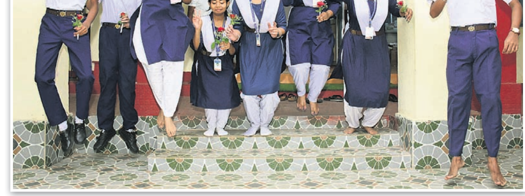
ମାଟ୍ରିକ୍ ପରୀକ୍ଷା ଫଳ ପ୍ରକାଶ ପରେ ଭୁବନେଶ୍ୱର ବଦରଡ଼ିଙ୍ଗ୍ କଲୋନାସ୍ଥିତ ସରସ୍ୱତୀ ଶିଶୁବିଦ୍ୟାଳୟ ଛାତ୍ରାଛାତ୍ରୀମାନେ ଖୁସି ମନାଉଛନ୍ତି ।

ଆଇଆଇଟି ପଢ଼ିବାକୁ ଲକ୍ଷ୍ୟ ରଖୁଛି ମୁଁ ମାଟ୍ରିକ୍ ପରୀକ୍ଷାରେ ଜିଲ୍ଲା ଚମ୍ପର ହୋଇ ଖୁସି ଅନୁଭବ କରୁଛି। କିନ୍ତୁ ମୋର ୬୦୦ ରୁ ୫୮୦ ବଦଳରେ ୫୭୨ ନମ୍ବର ରହିଛି। ୮ ନମ୍ବର ବିଜ୍ଞାନରେ କଟ୍ ଯାଇଛି। ୯୮ ବଦଳରେ ୯୦ ରହିଛି। ମୁଁ ବିଜ୍ଞାନ ପେପର ରିଟେକ୍ କରିବି । ତେବେ ମୁଁ ଆଇଆଇଟି ପଢ଼ିବାକୁ ଲକ୍ଷ୍ୟ ରଖି କୋଟି ନେବା ଆରମ୍ଭ କରିଛି। ଦିନକୁ