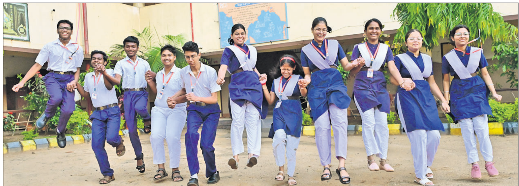
ମାଟ୍ରିକ୍ ପରୀକ୍ଷାଟକ ଶନିବାର ଅପରାହ୍ନରେ ପ୍ରକାଶ ପାଇବା ପରେ କଟକ ରୁକ୍‌ସାପୁର ସରକ୍ଷଣ ଶିଶୁ ବିଦ୍ୟାଳୟର ଛାତ୍ରାଛାତ୍ରୀମାନେ ଖୁସି ମନାଉଛନ୍ତି।