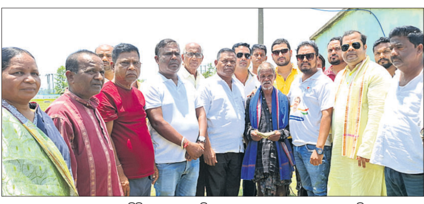
ୟୁବ କଂଗ୍ରେସର ପ୍ରତିନିଧି ଦଳ ପକ୍ଷରୁ ଜିଲ୍ଲା ପାଟଣା ବ୍ଲକ୍ ସହାୟତା ପ୍ରଦାନ କରାଯାଇଛି।