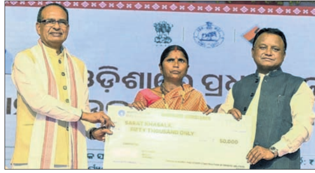
ମୁଖ୍ୟମନ୍ତ୍ରୀ ମୋହନ ଚରଣ ମାଝୀ ଏବଂ କେନ୍ଦ୍ର କୃଷି ଓ ଗ୍ରାମ୍ୟ ଉନ୍ନୟନ ମନ୍ତ୍ରୀ ଶିବରାଜ ସିଂ ଗୌହାନଙ୍କ ସମେତ ଶୁଭାରମ୍ଭ କରାଯାଇଛି।