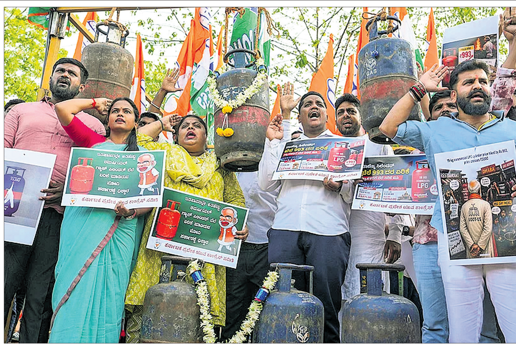
ଏଲପିଜି ମୂଲ୍ୟ ବୃଦ୍ଧି ପ୍ରତିବାଦରେ ବେଙ୍ଗାଲୁରୁରେ ଶନିବାର ମୁଦକଗ୍ରେସ କର୍ମୀ ପୁଲିସ୍ ଧରି ବିରୋଧ କରୁଛନ୍ତି । ୧୯ କେଜି ବ୍ୟବସାୟିକ ଏଲପିଜି ବିଲିଣ୍ଡର ଦାମ୍ ୯୯୩ ଟଙ୍କା ବଢ଼ିଥିବାରୁ ଅସନ୍ତୋଷ ବୃଦ୍ଧି ପାଇଛି ।