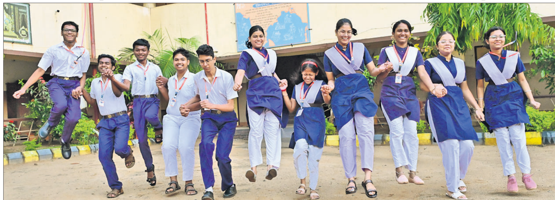
ମାଟ୍ରିକ୍ ପରୀକ୍ଷାଟକ ଶନିବାର ଅପରାହ୍ନରେ ପ୍ରକାଶ ପାଇବା ପରେ କଟକ ରୁଳାପାଠର ସରସ୍ୱତୀ ଶିଶୁ ବିଦ୍ୟାଳୟର ଛାତ୍ରାଛାତ୍ରୀମାନେ ଖୁସି ମନାଉଛନ୍ତି।

କଟକ, ୨୫ (କାର୍ତ୍ତିକ ସାହୁ) ଚଳିତବର୍ଷର ହାଇସ୍କୁଲ ସାର୍ଟିଫିକେଟ୍ ପରୀକ୍ଷା(ମାଟ୍ରିକ୍ ପରୀକ୍ଷା) ଫଳ ଶନିବାର ପ୍ରକାଶ ପାଇଛି। ଏଥର ରାଜ୍ୟରେ ପାସ୍ ହାର ୯୫.୩୩% ହୋଇଥିବାବେଳେ ଝିଅମାନେ ଆଗରେ ରହିଛନ୍ତି। ଛାତ୍ରୀଙ୍କ ପାସ୍ ହାର ୯୬.୩୭% ରହିଥିବା ବେଳେ ଛାତ୍ରଙ୍କ ପାସ୍ ହାର ୯୪.୦୩% ରହିଛି। ଗଜପତି ଜିଲ୍ଲାରେ