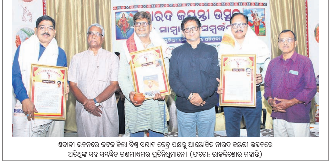
ଶତାବ୍ଦୀ ଭବନରେ କଟକ ଜିଲ୍ଲା ବିଶ୍ୱ ସମ୍ମଦ କେନ୍ଦ୍ର ପକ୍ଷରୁ ଆୟୋଜିତ ନାବକ କଳ୍ପନା ଉତ୍ସବରେ ଅତିଥିଙ୍କ ସହ ସମ୍ବର୍ଦ୍ଧିତ ଗଣନାଧ୍ୟାପକ ପ୍ରତିନିଧିମାନେ।