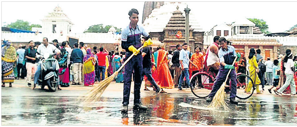
ସିଂହଦ୍ୱାର ସମ୍ମୁଖ ବଡ଼ ଦାଣ୍ଡରେ କମିଥିବା ମଲ ଓ ଆବର୍ଜନା ପାଣିକୁ ସଫା କରାଯାଉଛି ।

ଶ୍ରୀମନ୍ଦିର ସମ୍ମୁଖରେ ରବିବାର ଏକ ଅଭାବନୀୟ ଘଟଣା ଦେଖାବାକୁ ମିଳିଛି । ଶ୍ରୀମନ୍ଦିର ସିଂହଦ୍ୱାର ସମ୍ମୁଖରେ ମଲ, ପୁତ୍ର ନିଶା ନଳା ପାଣି ଭାସୁଥିବା ଦେଖାବାକୁ ମିଳିଥିଲା । ଏନେଇ ଶ୍ରୀମନ୍ଦିରକୁ ଆସୁଥିବା ଶ୍ରଦ୍ଧାଳୁଙ୍କ ମଧ୍ୟରେ ଘୋର ଅସନ୍ତୋଷ ଦେଖାଯାଇଛି । ପୁରୀ ମୁଖାବଳ, ଶନିବାର ରାତିରେ ଶ୍ରୀମନ୍ଦିର ପରିକ୍ରମା ମାର୍ଗରେ ଥିବା ଶୈବାଳୟର ମଲକା ଚାକି କାମ ହୋଇ ଫାଟି ଯାଇଥିଲା । ଫଳରେ ରବିବାର ସକାଳେ ସିଂହଦ୍ୱାର ସାମ୍ନାରେ ଶୈବାଳୟର ମଲ, ପୁତ୍ର ନିଶା ନଳା ପାଣି ଭାସୁଥିବା ଦେଖାବାକୁ ମିଳିଥିଲା । ଫଳରେ ଭକ୍ତ ନଳା ପାଣି ମାଡ଼ି ମନ୍ଦିର ଭିତରକୁ ପ୍ରବେଶ କରୁଥିବାରୁ ଅସନ୍ତୋଷ ପ୍ରକାଶ କରିଥିଲେ । ପ୍ରାୟ ୩୦୦ ଟନରୁ ଅଧିକ ଏଭଳି ଅଭାବନୀୟ ଘଟଣା ଦେଖାବାକୁ