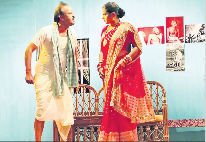
ବାରମ୍ବାର ଓମ୍ ନାଟ୍ୟ ସଂସ୍ଥାର କଳାକାରଙ୍କ ଦ୍ୱାରା ପରିବେଷିତ ନାଟକ 'ଚିଠି'ର ଏକ ଦୃଶ୍ୟ।

ସାଧାରଣ ସଂଗ୍ରାମୀ ଚନ୍ଦ୍ରମଣି ପ୍ରଧାନଙ୍କର ମହାତ୍ମା ଗାନ୍ଧୀଙ୍କ ସହ ନିବିଡ଼ ସମ୍ପର୍କ ଥିଲା। ଗାନ୍ଧିଜୀଙ୍କ ସହ ତାଙ୍କର ଚିଠି ଦିଆନିଆ ଚାଲିଥିଲା। ତାଙ୍କର ପୁଅ ଓ ବୋହୂ ସହ ନାରୁଣାଟିଏ ଥିଲେ। ଏହା ଭିତରେ ନାରୁଣାକୁ ଭଲ ପାଉଥିବା ଅଧ୍ୟାପକ ପିଏଚ୍ଡି କଳାବେଳେ ଜାଣିବାକୁ ପାଇଛନ୍ତି ମହାତ୍ମା ଗାନ୍ଧୀଙ୍କ ଚିଠି ସାହାଯ୍ୟ ଆଫ୍ରିକାରେ ଗୋଟିକୁ ୪ କୋଟି ଟଙ୍କାରେ ବିକ୍ରି ହେଉଛି। ଏହି କଥା ଜାଣିସାରିବା ପରେ ଚନ୍ଦ୍ରମଣିଙ୍କ ପ୍ରତି ପୁଅବୋହୂଙ୍କ ବ୍ୟବହାର ବଦଳି ଯାଇଛି। ନାରୁଣାଠାରୁ ସବୁ କିଛି ଶୁଣି ସାରିବା ପରେ ଚନ୍ଦ୍ରମଣି ସେସବୁ ଚିଠିକୁ ପୁଅବୋହୂଙ୍କୁ ନ ଦେଇ ରିଜିଷ୍ଟରେ ମୁଦ୍ରେଇ ଦେଇଛନ୍ତି। ଜୀବନ ଯାଇଛି ପଛେ ମହାତ୍ମାଗାନ୍ଧୀଙ୍କ ସେହି ଚିଠିକୁ ସୁରକ୍ଷିତ ରଖି ନିଲାମ୍ ହେବାକୁ ଦେଇନାହିଁ ଚନ୍ଦ୍ରମଣି। ଏମିତି ଏକ ଘଟଣାବଳୀକୁ