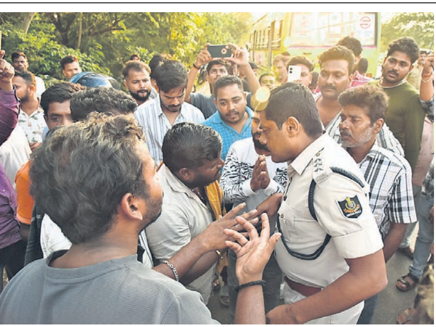
ଉତ୍ତମ ଲୋକଙ୍କୁ ପୋଲିସ୍ ବୁଝାଶୁଝା କରୁଛି।