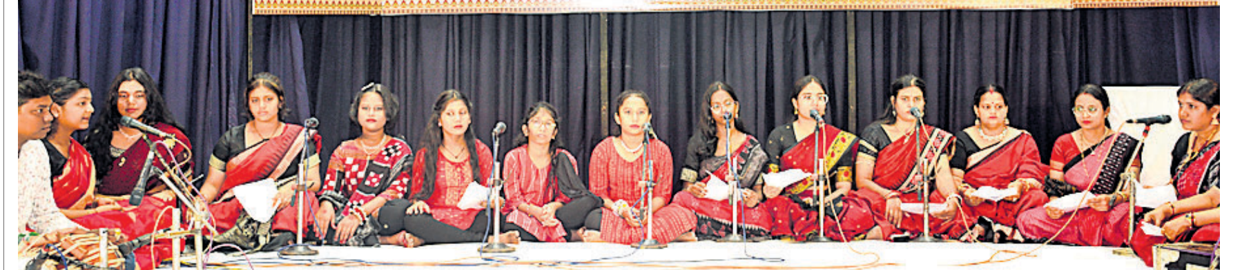
ଭୁବନେଶ୍ୱର ସୂଚନାଉପାଦାନରେ ସାଧନା ଆର୍ଟ ଆଣ୍ଡ କଲର୍ସ ପକ୍ଷରୁ ରବିବାର ଅନୁଷ୍ଠିତ ଅନୁଷ୍ଠାନ ଓଡ଼ିଶା ସଙ୍ଗୀତ ସନ୍ଧ୍ୟାରେ ଶିଳ୍ପୀମାନେ ସଙ୍ଗୀତ ପରିବେଷଣ କରୁଛନ୍ତି।

ଯୋଗାଯୋଗ: ପୁରୀ, ପୁରୀ, ଭୁବନେଶ୍ୱର-୭୫୧୦୦୨ Cont - 8249753102 / 9999311320 / 9439254951