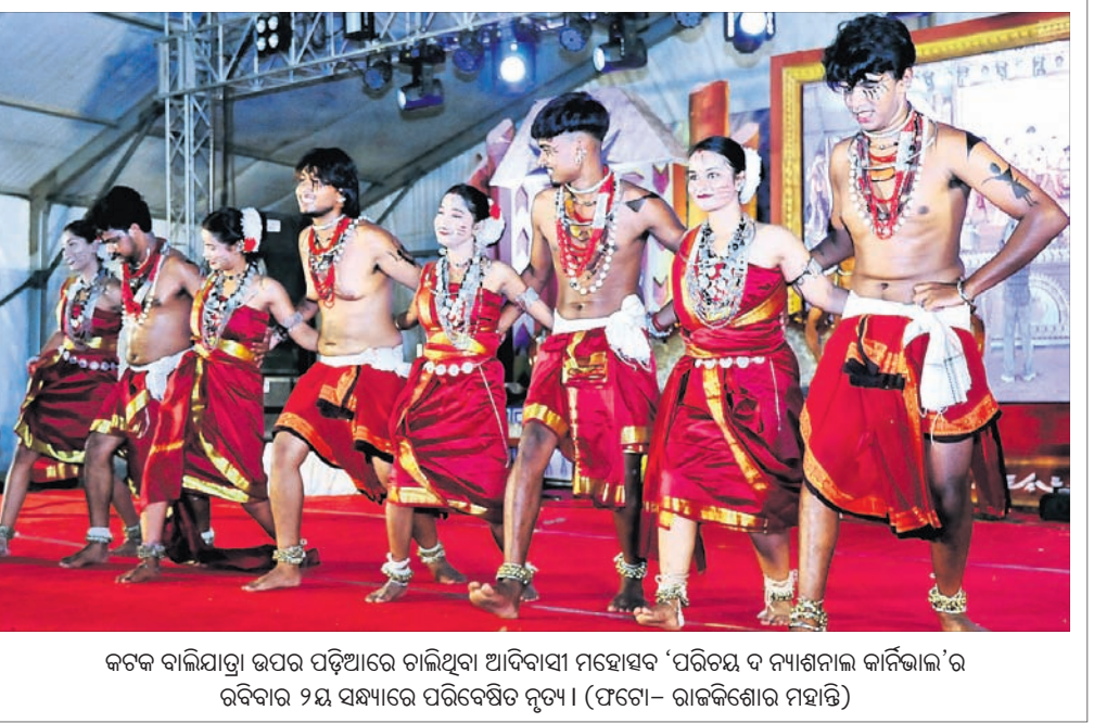
କଟକ ବାଲିଯାତ୍ରା ଉପର ପଡ଼ିଆରେ ଚାଲିଥିବା ଆଦିବାସୀ ମହୋତ୍ସବ 'ପରିଚୟ ଦ୍ୟାକ୍ଷିଣା କାର୍ଯ୍ୟକ୍ରମ' ର ରବିବାର ୨ୟ ସନ୍ଧ୍ୟାରେ ପରିବେଷିତ ନୃତ୍ୟ ।

ସେଲଫି ପଠାଇବା ସମୟରେ ନିଜର ନାମ ଏବଂ ମୋବାଇଲ ନମ୍ବର ଦେବାକୁ ଭୁଲୁ ନାହିଁ । ଯୋଗାଯୋଗରେ ପ୍ରତି ପ୍ରକାଶ ପାଇବ ।