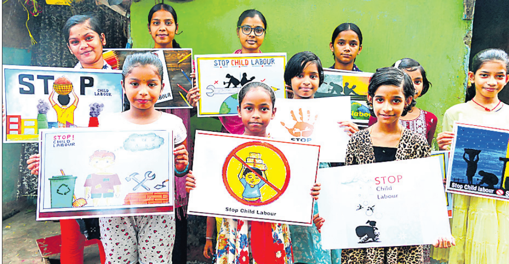
ଶିଶୁମାନେ ଶିଶୁ ଶ୍ରମିକ ବନ୍ଦ ପାଇଁ ଆହ୍ୱାନ ଦେଉଛନ୍ତି।

ଭୁବନେଶ୍ୱର, ୩୫ (ବନ୍ଦନା ସେଠୀ) ସମାଜରେ ଅବହେଳିତ ଶିଶୁମାନଙ୍କୁ ମୁଖ୍ୟ ଶ୍ରମିକର ପ୍ରଶ୍ନ ଉଠାଇ କରାଯାଇଥିଲା।