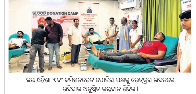
ଜୟ ଓଡ଼ିଶା ଏବଂ କମିଶନରେଟ ପୋଲିସ୍ ପକ୍ଷରୁ ରେଜିଷ୍ଟର କରାଯାଇ ପରିବାର ଅନୁଷ୍ଠିତ ରକ୍ତଦାନ ଶିବିର।