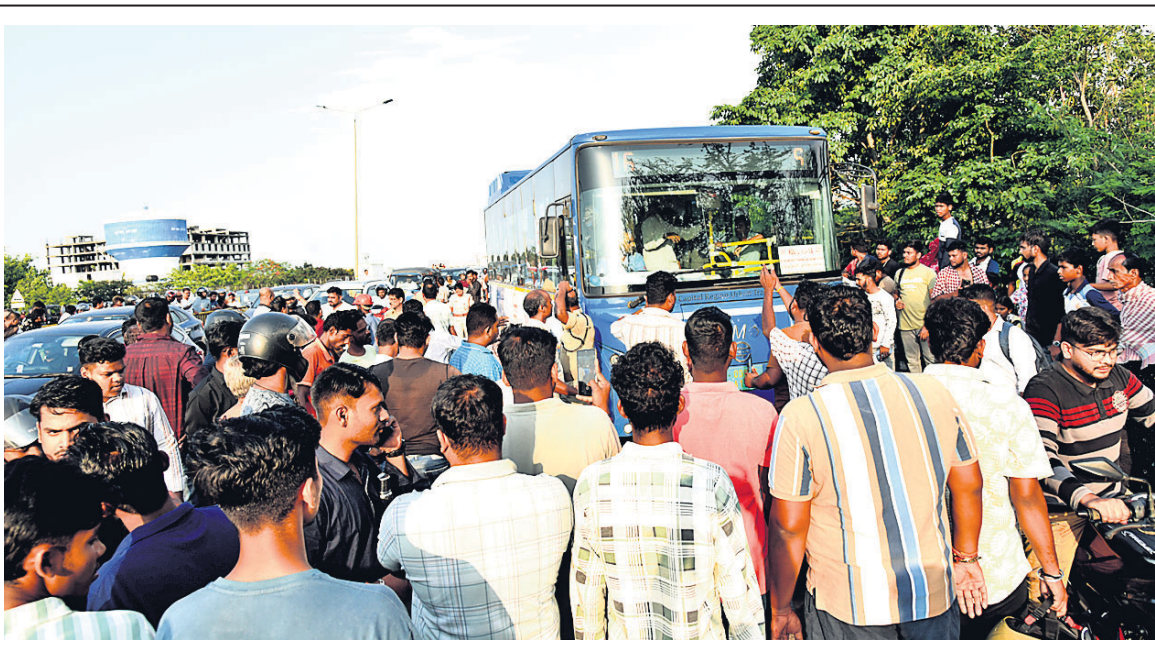
ଦୁର୍ଯ୍ୟଗଣା ପରେ ସେହିବାଟ ଦେଇ ଯାଉଥିବା ଆମବସଗୁଡ଼ିକୁ ଲୋକେ ଅଟକାଇ ପ୍ରତିବାଦ କରୁଛନ୍ତି।