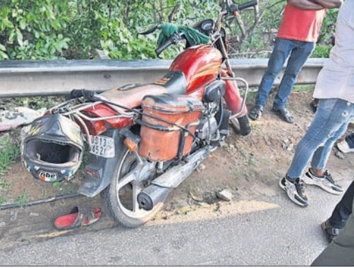
ଦୁର୍ଯ୍ୟଗଣାଗ୍ରସ୍ତ ଆମ ବସ୍ ଓ ବାଇକ୍।

ଦେଇଥିଲା। ଫଳରେ ବାଇକ୍ ଚାଲି ଯାଇଥିବାବେଳେ ସେ ରାସ୍ତାରେ ଛିଟିକି ପଡ଼ିଥିଲେ। ଏହି ସମୟରେ ଉକ୍ତ ବସ୍ ଟାଙ୍କ ଦେହ ଓ ମୁଣ୍ଡ ଉପରେ ଚଢ଼ିଯାଇଥିଲା।