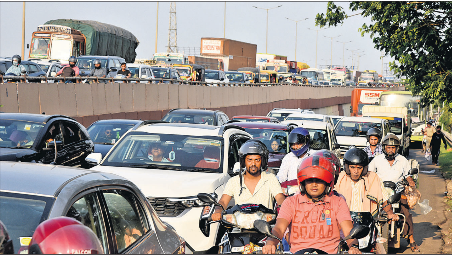
ଭୁବନେଶ୍ୱର ସଡ଼କରୁ ଦିହାର ସମ୍ମୁଖ ଜାତୀୟ ରାଜପଥରେ ରବିବାର ଅପରାହ୍ନରେ ଆମ ବସ୍ ଧକ୍କାରେ ଜଣେ ବାଇକ୍ ଆରୋହୀଙ୍କ ମୃତ୍ୟୁ ପରେ ହୁଏପାଳକୁ ବାଣାଦିହାର ପର୍ଯ୍ୟନ୍ତ ଗାଡ଼ିମୋଟର କାମରେ ଫସି ରହିଛି।

ଭୁବନେଶ୍ୱର, ୩୫ (ଅନୁରାଧା ମହାରଣା) ଓଡ଼ିଶା ରାଜ୍ୟ ସମବାୟ ଚଳୁ ଉତ୍ପାଦକ ସଂଘ (ଓମ୍ଫେଡ଼୍) ପକ୍ଷରୁ କ୍ଷୀର ମୂଲ୍ୟ ବୃଦ୍ଧି ଘୋଷଣା କରାଯାଇଛି। ବିଭିନ୍ନ ପ୍ରକାରର ଓମ୍ଫେଡ଼୍ କ୍ଷୀରର ଖୁସୁରା ମୂଲ୍ୟ ଉପରେ ଲିଟର ପିଛା ୪ ଟଙ୍କା ବୃଦ୍ଧି ହୋଇଛି। ଉତ୍ପାଦକ ସଂଘର କାର୍ଯ୍ୟକାରୀତା ଓ ଉତ୍ପାଦନ କ୍ଷମତାକୁ ବୃଦ୍ଧି ଦେବା ପାଇଁ ଏହି ବୃଦ୍ଧି ଆବଶ୍ୟକ ବୋଲି ସଂଘର କାର୍ଯ୍ୟକର୍ତ୍ତାମାନେ କହିଛନ୍ତି।