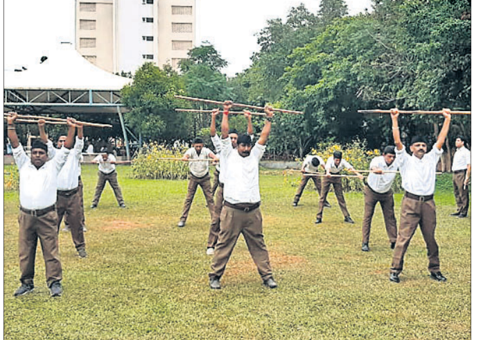
ସ୍ୱୟଂସେବକମାନେ ଶାରୀରିକ କୌଶଳ ପ୍ରଦର୍ଶନ କରୁଛନ୍ତି।