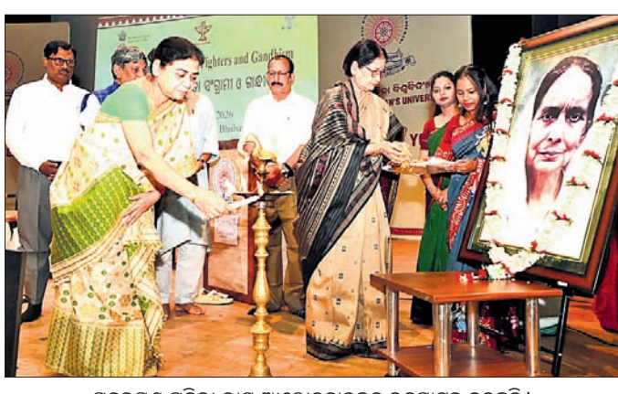
ପଦ୍ମଭୂଷଣ ପ୍ରତିଭା ରାୟ ଆଲୋଚନାକୁ ଉଦ୍‌ଘାଟନ କରୁଛନ୍ତି।

କେନ୍ଦ୍ର ସାହିତ୍ୟ ଏକାଡେମୀ ଓ ରମାଦେବୀ ମହିଳା ବିଶ୍ୱବିଦ୍ୟାଳୟର ମିଳିତ ଆନ୍ତର୍ଜାତୀୟ ଉତ୍ସାହୀନା ନାରୀ ସାଧନା ସଂଗ୍ରାମୀ ଓ ଗାନ୍ଧୀବାଦୀ ଶାନ୍ତି ଆଲୋଚନାକୁ ଶୁଭକାରୀ ବିଶ୍ୱବିଦ୍ୟାଳୟ ପ୍ରେକ୍ଷାଳୟରେ ଅନୁଷ୍ଠିତ ହୋଇଯାଇଛି।