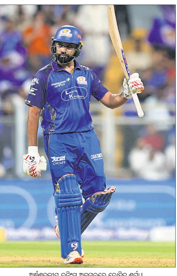
ଅର୍ଦ୍ଧଶତକାନ୍ତ ଇନିଂସ ଅବସରରେ ରୋହିତ ଶର୍ମା ।

ମୁମ୍ବାଇ, ୪।୫ ରୋହିତ ଶର୍ମା ଓ ରିୟାନ ରିକଲଟନଙ୍କ ବିଶ୍ୱୋତ୍ତମ ଅର୍ଦ୍ଧଶତକ ଏବଂ ଶତକାନ୍ତ ଭାଗଦାରି ବଳରେ ଯୋଗ୍ୟର ଅନୁକୃତ ଆଇପିଏଲ୍ ମ୍ୟାଚ୍ରେ ମୁମ୍ବାଇ ଇଣ୍ଡିଆନ୍ସ ଉତ୍କଳକେତରେ ଲକ୍ଷ୍ମି ପୁପର କାଏଣ୍ଟକୁ ପରାସ୍ତ କରିଛି । ଲକ୍ଷ୍ମି ଦ୍ୱାରା ପ୍ରଦତ୍ତ ୨୨୯ ରନର ବିଶାଳ ଟାର୍ଗେଟକୁ ମୁମ୍ବାଇ ୧୮.୪ ଓଭରରେ ୪ ଉତ୍କଳକେତ ହରାଇ ହାସଲ କରି ନେଇଥିଲା । ଟାର୍ଗେଟର ପିଛା କରିବା ଦୃଷ୍ଟିରୁ ଏହା ମୁମ୍ବାଇର ଅନ୍ୟତମ ବୃହତ୍ ବିଜୟ । ଏହା ମୁମ୍ବାଇର ୩ୟ ବିଜୟ । ଏଥିଯୋଗୁ ଦଳ ୩ ବିଜୟ ଓ ୬ ପଏଣ୍ଟ୍ ସହ ନବମ ସ୍ଥାନରେ ରହିଛି । ଆରମ୍ଭରୁ କୋଶ ଉତ୍କଳକେତ ହରାଇଥିବା ଲକ୍ଷ୍ମି ପାଇଁ ମିଚେଲ ମାର୍ଶ ଓ ପୁରନ ବିଦାୟ ଉତ୍କଳକେତରେ ୪୯ ବଲରେ ତ୍ରୁଟ ୯୪ ରନ ଯୋଡ଼ିଥିଲା । ପୁରନ ୨୧ ବଲରେ ୬୩ (୧ ଚୌକା ଓ ୮) ଓ ମାର୍ଶ ୨୫ ବଲରେ ୪୪ (୪ ଚୌକା ଓ ୩ ଛକା) ରନ କରି