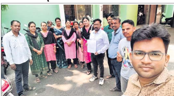
ଜିଲ୍ଲାପାଳଙ୍କୁ ଜେଟିବାକୁ ଆସିଥିବା ପ୍ରାଥମିକ ଶିକ୍ଷକମାନେ ।

ଫୁଲବାଣୀ, ଧାଃ(ରାଜ୍ୟ କୁମାର ରାଜତ) କର୍ମଚାରୀଙ୍କୁ କାର୍ଯ୍ୟରେ ପ୍ରାଥମିକ ଶିକ୍ଷକଙ୍କ ଦାବିକୁ ପ୍ରଶ୍ନାସନ ଅଣଦେଖା କରୁଛି। ନିୟମ ଅନୁସାରେ ଅନୁଲୋଚନ କରୁଥିବା ୨୦୨୨-୨୩ ଶିକ୍ଷକଙ୍କ ବଦଳି ହୋଇଥିଲେ ହେଁ ତାହାକୁ ପ୍ରଶ୍ନାସନ କାର୍ଯ୍ୟକାରୀ କରୁନାହିଁ । ୨୦୨୨-୨୩ ବର୍ଷର ବଦଳି ଆଦେଶ କାର୍ଯ୍ୟକାରୀ ହୋଇ ନ ଥିବା ବେଳେ ୨୦୨୨-୨୩ ବର୍ଷ ପାଇଁ ଅନୁଲୋଚନରେ ବଦଳି ପ୍ରକ୍ରିୟା ଆରମ୍ଭ ହୋଇଛି। ବଦଳି ଆଦେଶ ପାଇଥିବା କିଛି ଶିକ୍ଷକଙ୍କୁ ଶିକ୍ଷକ ସୋମବାର ଆସି ଜିଲ୍ଲାପାଳଙ୍କୁ ଜେଟିବାକୁ ଦେଖାଇ ଦେଖାଇ ଓ ରାଜ୍ୟର ବିଭାଗରେ କାର୍ଯ୍ୟରେ ପ୍ରାଥମିକ ଶିକ୍ଷକଙ୍କ ବଦଳି ଅନୁଲୋଚନ ପ୍ରକ୍ରିୟାରେ ହୋଇଛି । ସେମାନେ ଯୁବସମ୍ପଦ ପୋର୍ଟାଲକୁ ଯାଇ ବଦଳି ଲାଗି ଆବେଦନ କରୁଥିବା ଜଣେ ଶିକ୍ଷକ ବଦଳି ପାଇଁ ପୋର୍ଟାଲରେ ଖାଲି ଥିବା ଶିକ୍ଷକ ପଦବା ଅନୁସାରେ ୧୦ଟି ବିଦ୍ୟାଳୟକୁ ବାଛି ପାରିବେ । ୨୦୨୪-୨୫ରେ ୨୫୫ରୁ ୭୫୫ ଶିକ୍ଷକ ନିଜ ପଦ ଅନୁସାରେ ବଦଳି