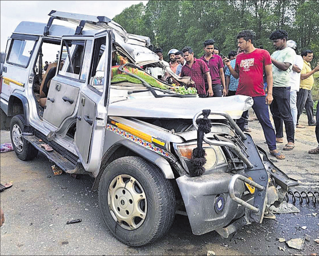
ଦୁର୍ଘଟଣାରେ କ୍ଷତିଗ୍ରସ୍ତ ହୋଇଥିବା ବୋଲେରୋ।

ସୁଚନା ଅନୁସାରେ, ବୋଲେରୋ (ନଂ.ଓଡି ୦୨ଏଲ ୦୪୨୯)ରେ ବଡ଼ଚଣା ଥାନା ପୁରୁଷୋତ୍ତମପୁର ଶାସନ ଗାଁରୁ ଏକ ପରିବାରର ୧୫ ଜଣ ସଦସ୍ୟ କେନ୍ଦୁଝର ଅଞ୍ଚଳକୁ ବାହାରକୁ ଯାଇ ଫେରୁଥିଲେ। ସୋମବାର ସକାଳେ ସେମାନେ ବରଡ଼ା ଛକ ନିକଟରେ ପହଞ୍ଚି ଥିବାବେଳେ ରାସ୍ତାପାର୍ଶ୍ୱରେ ଠିଆ ହୋଇଥିବା ଏକ ଚିମ୍ପ ବୋଝେଇ ହାଇଡ୍ରା ପଞ୍ଚ ପଟରେ ବୋଲେରୋ ଧକ୍କା ଦେଇଥିଲା। ବୋଲେରୋରେ ବସିଥିବା ଯାତ୍ରୀମାନେ ଏଣେତେଣେ ଛିଟିକି ପଡ଼ିଥିଲେ। ଏହା ଦେଖି ଚିମ୍ପ ବୋଝେଇ ହାଇଡ୍ରାକୁ ନେଇ ଭ୍ରାତୃଭଉର ସେଠାରୁ ଦୁତରାଜିରେ ପଳାଇ ଯାଇଥିବା ପ୍ରତ୍ୟକ୍ଷଦର୍ଶୀ କହିଛନ୍ତି। ମୃତଦେହଗୁଡ଼ିକ ପୁଷ୍ପା-୭