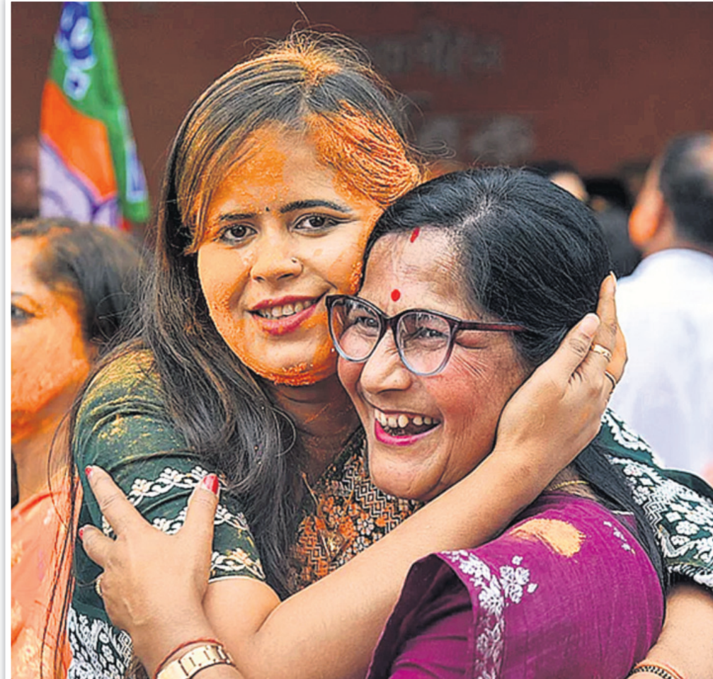
ଆସାନ ବିଧାନସଭା ନିର୍ବାଚନରେ ଭାଜପାର ବିଜୟ ପରେ ଗୁଆହାଟୀରେ ଦଳର ପୁଣ୍ୟାଳୟରେ ଦକାୟ କର୍ମୀମାନେ ଉତ୍ସବ ମନାଉଛନ୍ତି।