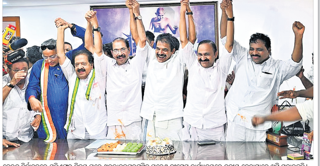
କେରଳ ନିର୍ବାଚନରେ ଯୁଦ୍ଧିଏମ୍ ବିଜୟ ପରେ ଥୁରୁଭାନଗପୁରମ୍‌ରେ ପ୍ରବେଶ କଂଗ୍ରେସ କାର୍ଯ୍ୟାଳୟରେ ଦକାୟ ନେତାମାନେ କୁସି ମନାଉଛନ୍ତି।

ଏଲଡିଏମ୍ ପରାଜିତ ହୋଇଛି। ଚଳିତ ନିର୍ବାଚନରେ କଂଗ୍ରେସ ୬୩ ଆସନ ଜିତିଥିବାବେଳେ ଏସିଆଇ(ଏମ୍) ୨୫ ଆସନ ଜିତି ଗୋଟିଏରେ ଆଗରେ ରହିଛି। ଏସିଆଇ ୭ ଆସନ ଜିତିଥିବାବେଳେ ଇଣ୍ଡିଆନ୍ ୟୁନିୟନ ମୁସଲିମ୍ ଲିଗ୍ (ଆଇୟୁଏମ୍‌ଏଲ୍) ୨୦ ଆସନରେ ବିଜୟ ହୋଇଛି। ବିଜୟନଙ୍କ କ୍ୟାବିନେଟ୍‌ର ୨୧ ମନ୍ତ୍ରୀଙ୍କ ମଧ୍ୟରୁ ୧୩ ହାରିଯାଇଛନ୍ତି।