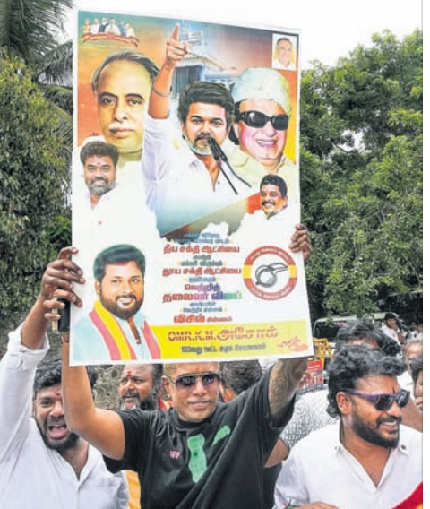
ତାମିଲନାଡୁରେ ଚିକିତ୍ସା ବିଜୟ ପରେ ଉତ୍ସାହିତ ଦକାୟ ସମର୍ଥକମାନେ ବିଜୟଙ୍କ ପୋଷ୍ଟର ଧରିଛନ୍ତି।

ପଶ୍ଚିମବଙ୍ଗ ନିର୍ବାଚନ ସବୁଦିନ ପାଇଁ ମନେ ରହିବ ବୋଲି ଫକୀରପଲ୍ଲୀ ଆସନରେ ପ୍ରଧାନମନ୍ତ୍ରୀ ନରେନ୍ଦ୍ର ମୋଦି କହିଛନ୍ତି। ଜନଶକ୍ତିର ବିଜୟ ହୋଇଛି ଓ ଭାଜପାର ପୁଣ୍ୟାଳୟ ରାଜନୀତି ଜିତିଛି। ପଶ୍ଚିମବଙ୍ଗରେ ପଢ଼ୁ ପୂର୍ବିକ ବୋଲି ପ୍ରଧାନମନ୍ତ୍ରୀ ସୋମବାର ସନ୍ଧ୍ୟାରେ କହିବା ସହ ରାଜ୍ୟର ପ୍ରତ୍ୟେକ ବ୍ୟକ୍ତିଙ୍କ ପାଖରେ ମଥାନତ କରୁଛି ବୋଲି କହିଛନ୍ତି। ପଶ୍ଚିମବଙ୍ଗରେ ଭାଜପାକୁ ମିଳିଥିବା ବିପୁଳ ଜନମତକୁ ପ୍ରଧାନମନ୍ତ୍ରୀ ଅଭୂତପୂର୍ବ କହିବା ସହ ଭାଜପା ରାଜ୍ୟବାସୀଙ୍କ ଆଶା ଆକାଂକ୍ଷା ପୂରଣ ପାଇଁ ସବୁପ୍ରକାର ପ୍ରୟାସ କରିବ ବୋଲି ପ୍ରତିଶ୍ରୁତି ଦେଇଛନ୍ତି।